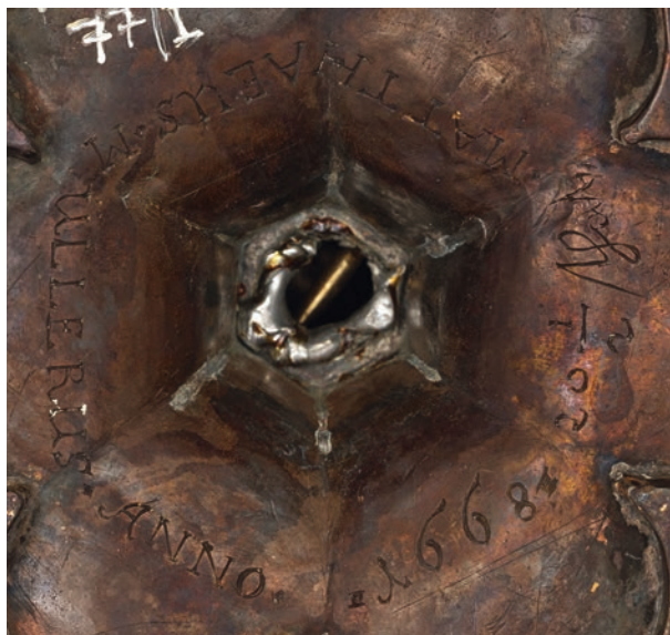
Ryc. 7. Inskrypcja na odwrociu kielicha; w zbiorach MK, nr inw. MHK-77/I

Następnie informacje o kielichu pojawiły się w Słowniku geograficznym Królestwa Polskiego i innych krajów słowiańskich z 1889 roku 7 . Podobnie jak w pracy Heisego naczynie wymieniono przy charakterystyce wyposażenia ewangelickiego zboru w Bogatce 8 .