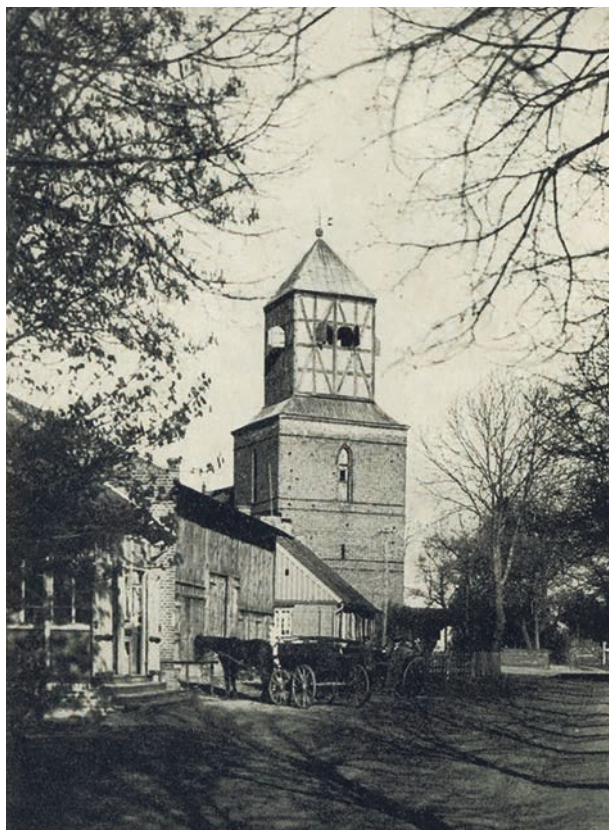
Ryc. 6. Kościół ewangelicki w Bogatce, autor fotografii niezany, ok. 1920; w zbiorach Muzeum Pomorza, nr inw. GSP02249

świątyni na czele z interesującym nas naczyniem. Autor dokładnie opisał jego kształt, dekorację nodusa oraz inskrypcje na odwrociu stopy 6 .