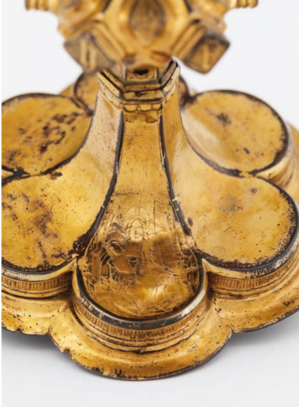
Ryc. 2. Stopa kielicha