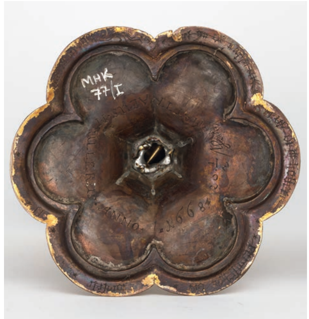
Ryc. 5. Inskrypcje na odwrociu kielicha

i naczynie zasililo zbiory muzealne, dołączając do kolekcji Działu Historii i Sztuki Krakowa Średniowiecznego 2 .