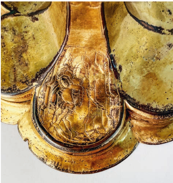
Ryc. 3. Stopa kielicha, przedstawienie Pietas Domini