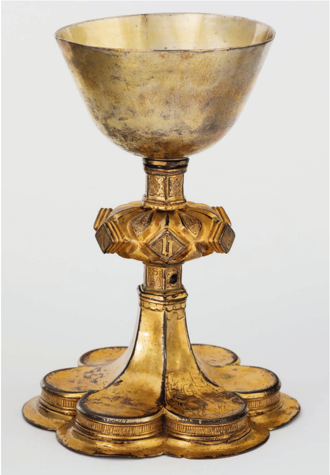
Ryc. 1. Kielich, ok. połowy XV w., srebro, stop miedzi, złocenie; w zbiorach MK, nr inw. MHK-77/I