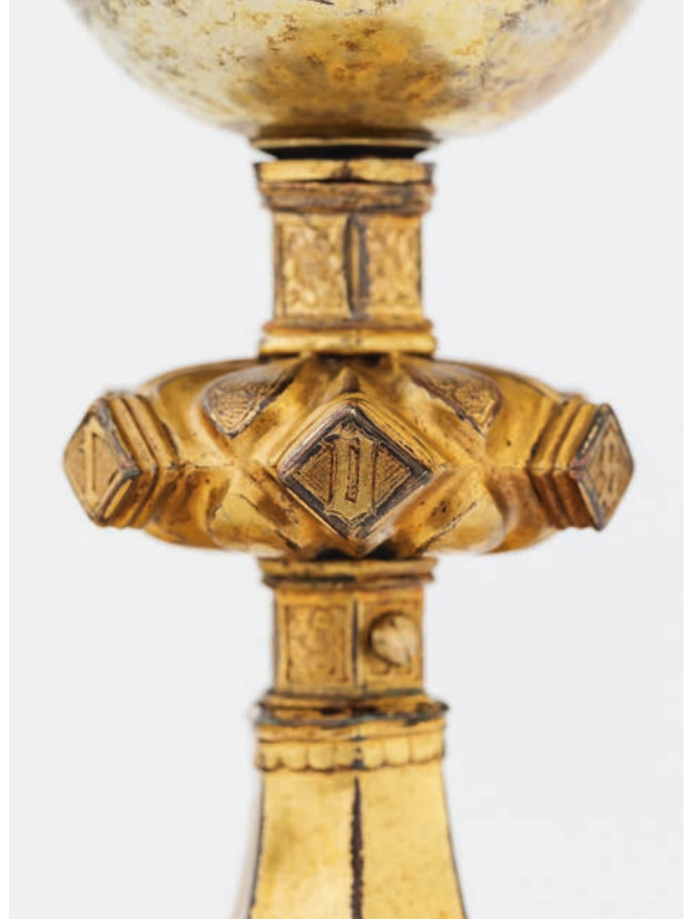
Ryc. 4. Nodus kielicha