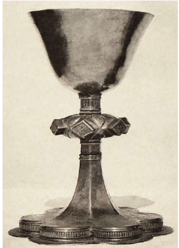
Kielich z Radzyna Chełmińskiego, druga ćwierć XV w.; reprodukcja: Heise Johannes: Die Bau- und Kunstdenkmäler der Provinz Westpreussen. Kreis Graudenz . Danzig 1894, S. 569

Przedmioty w Muzeum Krakowa i w Radzynie mają podobną sześciolistną stopę, której pola wydzielono krzywymi załamaniami. W obu przypadkach jest ona osadzona na cokółku z pionowo prążkowanym fryzem i płaską kryzą. W omawianym w artykule zabytku jest on nieznacznie wyższy (podobnie jak w kielichu w Muzeum Narodowym w Gdańsku, przypisanym do pierwszej ćwierci XV wieku 57 , czy bardziej ogólnie – pierwszej połowy XV stulecia 58 ). Motyw cokołu ozdobionego pionowym laskowaniem występuje nie tylko w dekoracji kielichów, ale i m.in. krzyży relikwiarzowych, jak w Muzeum Narodowym w Gdańsku (datowanym na około 1450 rok 59 ). Należy przypomnieć, że pole stopy muzealnego obiektu pokrywa ryte przedstawienie Pietas