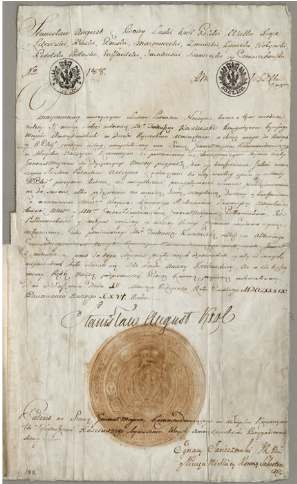
Dyplom nominacyjny Tadeusza Kościuszki na stopień generała majora z 12 października 1789 r.; w zbiorach Muzeum Książąt Czartoryskich, rkps 2716/105, fot. Pracownia fotograficzna MNK

„Uczelnia jako instytucja wyższej użyteczności publicznej, powinna dbać o odpowiednio wysoki poziom kulturowy absolwentów poprzez humanizację studiów, w tym zaznajamianie z ojczyzną historią i kulturą, rozwijanie umiejętności posługiwania się językiem ojczystym, a także nauczanie na odpowiednim poziomie języków obcych”.