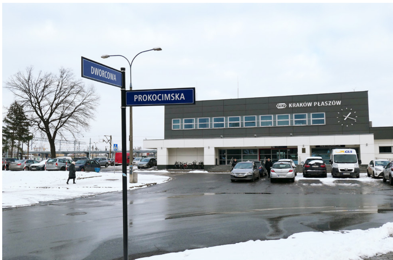
Ulica Dworcowa przy dworcu kolejowym Kraków Płaszów, 2024