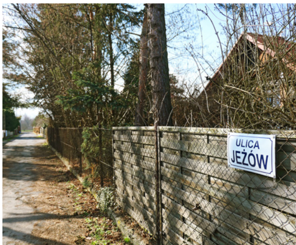
Ulica Jeżów

bieni przez komunistów, ale nie działali w czasach komunistycznych. Na przykład, na podstawie tej ustawy nie można byłoby usunąć takiego »bojownika o prawa chłopów« jak Jakub Szela. Po moim wniosku [do Rady Miejskiej we Wrocławiu] plac Jakuba Szeli we Wrocławiu został zlikwidowany w 2014 r. i ten »bohater ludowy« nie jest już nigdzie w Polsce honorowany. Jednak w Szczecinie, Warszawie, Katowicach czy Łodzi wciąż patronują tamtejszym ulicom buntownicy przeciwko Rzeczypospolitej z 1651 r.: Aleksander Kostka-Napierski i jego kompani Marcin Radocki i Stanisław Łętowski 137 .