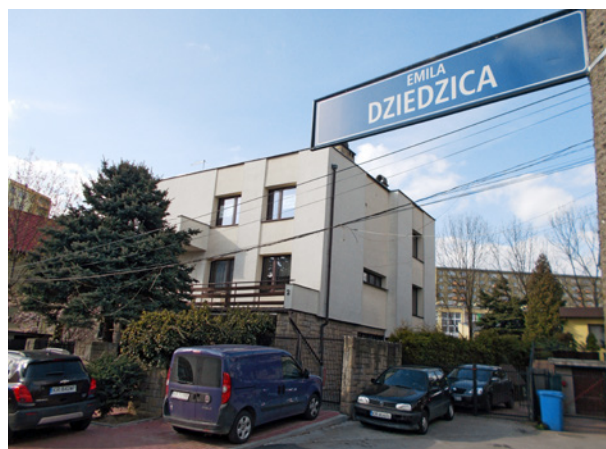
Dawna ulica Emila Dziedzica, od 2017 r. nosi imię Marka Eminowicza, fot. Mateusz Drożdż, 2016

Wraz z decyzją Sejmu pojawiła się szansa na kompleksowe rozwiązanie sprawy, tym bardziej że koszty zmian miały wziąć na siebie samorządy. Jednak jak zwykle diabeł tkwił