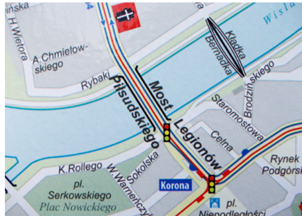
Przykład błędu w nazwie na planie MPK umieszczonym na przystanku – kładka „Bernadka”, fot. Mateusz Drożdż, 2024

Mimo tych działań nie udało się poprawić wszystkich błędów, które zresztą co jakiś czas prasa wytykała służbom miejskim. Na przykład w 2010 roku w artykule prasowym wyliczono część błędnych zapisów: „Serenio Fenna zamiast Sereno Fenna, Anny Libera zamiast Anny Libery, Stella-Sawickiego zamiast Stelli-Sawickiego. Krakowskie ulice, i to wcale nie peryferyjne, mają błędy w nazwach (...). Byki pojawiają się przy nazwie ronda im. Antoniego Matecznego,