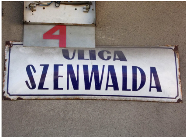
Nazwa ulicy na cześć działacza komunistycznego Lucjana Szenwalda istniała do 2017 r., fot. Mateusz Drożdż, 2016