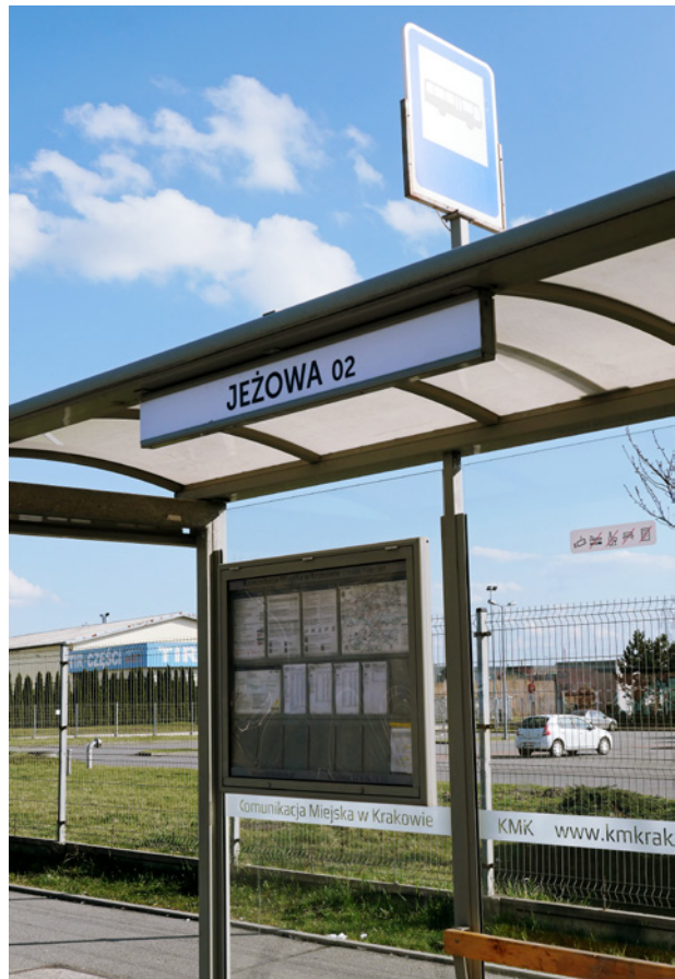
Przystanek Jeżowa, 2024

Akcja dekomunizacji wywołała też wzmożoną dyskusję na tematy związane z historią, zwłaszcza powojenną, nazwami ulic i próbą oceny osób uhonorowanych, co samo w sobie jest cenne, gdyż upowszechniało wiedzę historyczną i o dziedzictwie niematerialnym. Angażowała też wielu mieszkańców, którzy generalnie nie kwapią się do tego, aby wziąć udział w dyskusjach i życiu społecznym, poza najczęściej kwestiami infrastruktury lub planowanych inwestycji obok swojego miejsca zamieszkania.