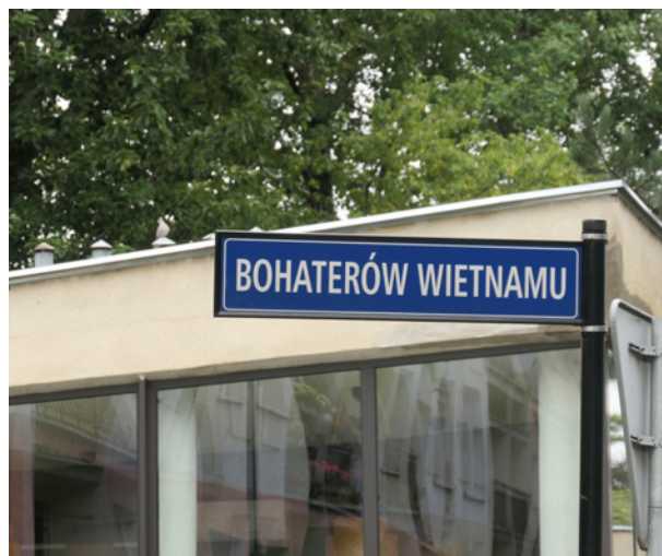
Zachowana nazwa ulicy Bohaterów Wietnamu, 2024

O ile w Krakowie nikt nie domagał się korekty nazw upamiętnionych socjalistów, jak aleja Ignacego Daszyńskiego, ulice Bolesława Limanowskiego i Stefana Okrzei czy żołnierki poległej pod Lenino Anieli Krzywoń, to w skali kraju wyglądało to często zupełnie inaczej, wręcz zawstydzająco. Mniej lub bardziej instytucjonalni lustratorzy wnioskowali o zmianę ulic Stefana Okrzei w Bogatyni, Bolesława Limanowskiego w Pile, a nawet jednego z ojców polskiej niepodległości Ignacego Daszyńskiego w Wałbrzychu i Ząbkowicach Śląskich. I choć IPN w końcu podał publicznie przykładowe nazwy do zmiany 70 , to urzędnicy i radni często zostawali bez wsparcia merytorycznego, o czym przypominałem w artykule, pisząc: „Pomoc IPN w określeniu, które nazwy podlegają dekomunizacji bywa niewystarczająca i niespieszna. Samorządowcy toruńscy przez 9 miesięcy czekali na odpowiedź tamtejszego oddziału Instytutu dotyczącą Wincentego Pstrowskiego” 71 .