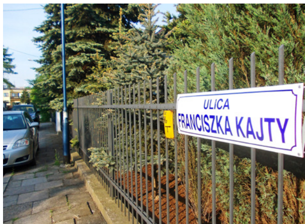
Nazwa ulicy upamiętniająca działacza PPR-u Franciszka Kajtę przetrwała do 2017 r.

W Krakowie słyhać też było, choć raczej sporadycznie, głosy domagające się dokończenia dekomunizacji. Postulował je Instytut Pamięci Narodowej, pojawiały się także co ja-