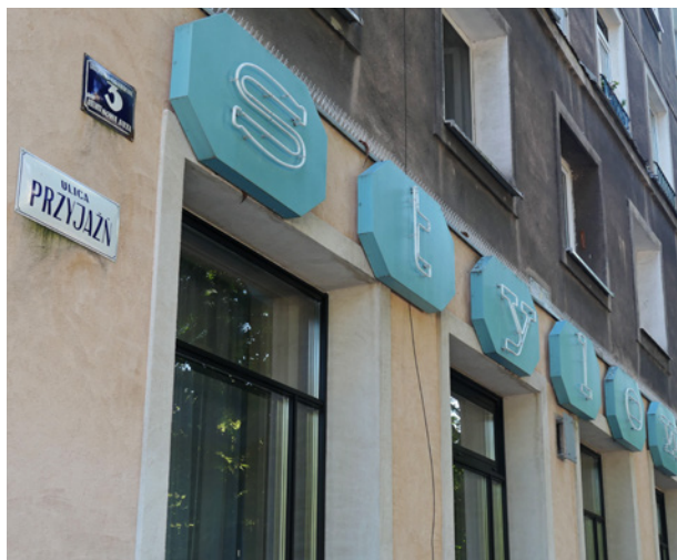
Historyczna tabliczka „ul. Przyjaźni” z początku Nowej Huty jako element dziedzictwa kulturowego