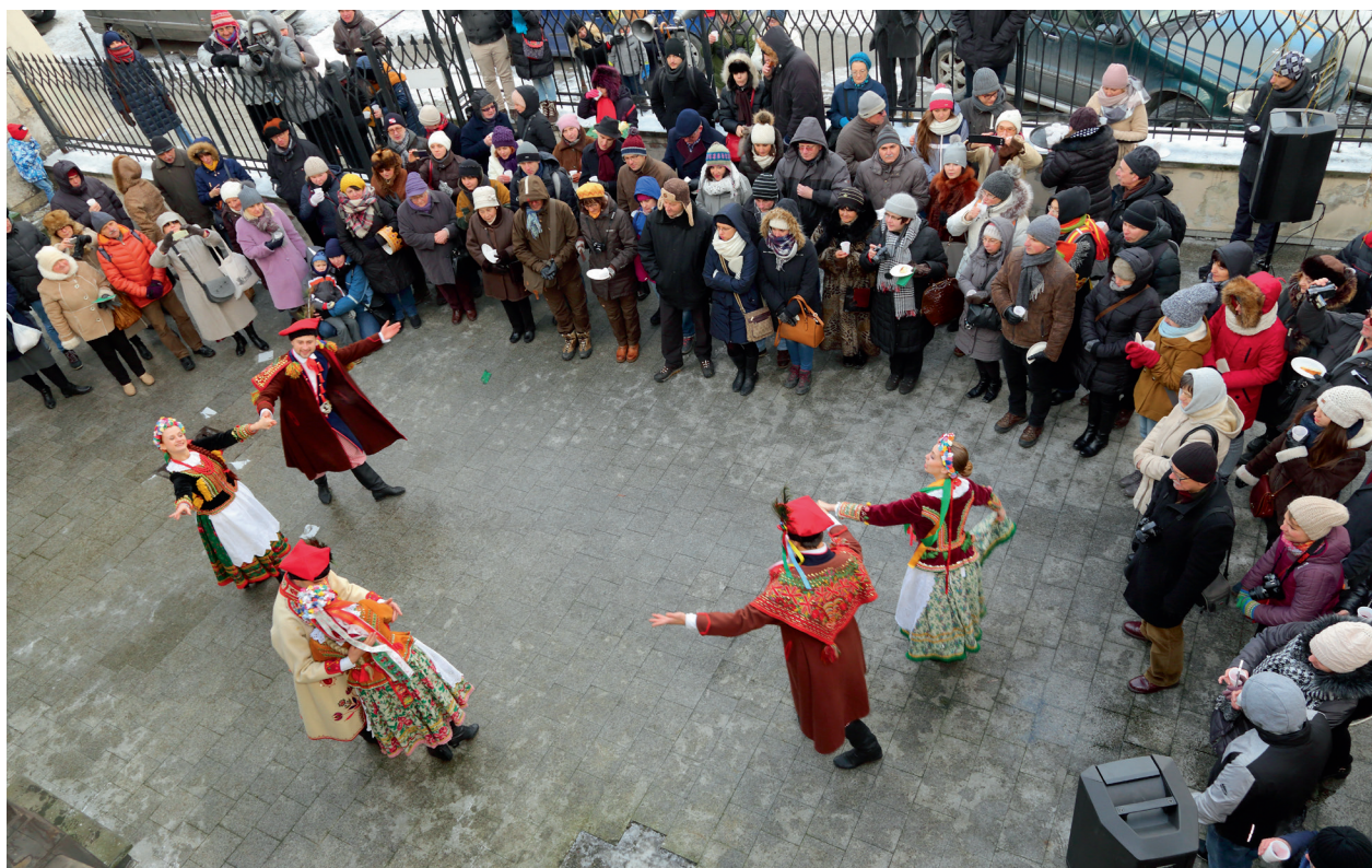
Spacer wokół szopki, inscenizacja na dziedzińcu Domu pod Krzyżem, 6 stycznia 2017 r.