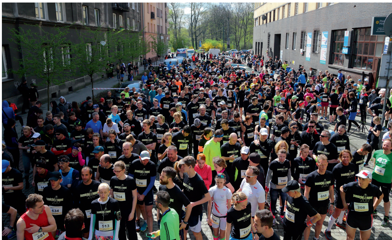
Ulica Pomorska przed startem do Biegu Pamięci, 8 kwietnia 2017 r.