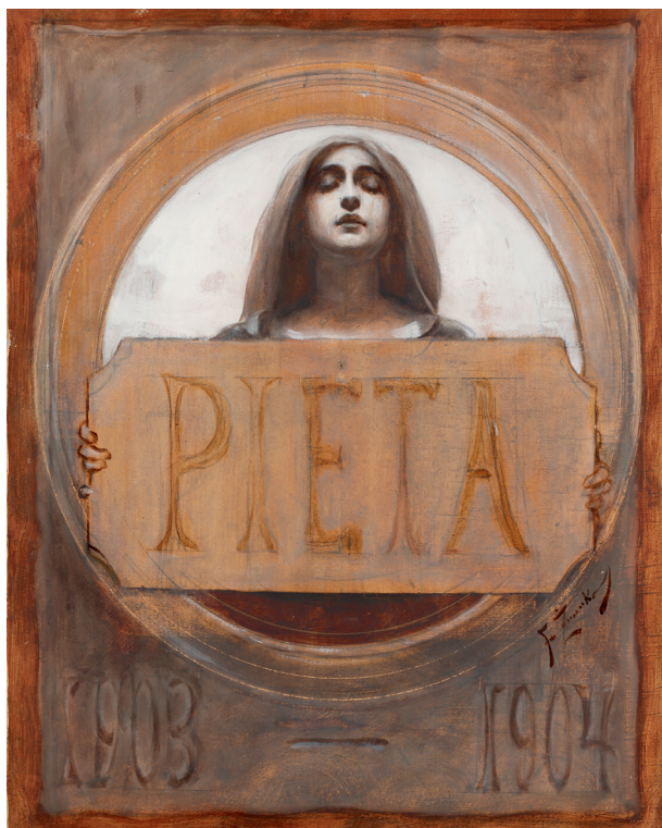
Franciszek Żmurko, Pieta , sygn. p. d. F. Żmurko, Warszawa, 1903–1904, rysunek, gwasz, akwarela, tektura, 57×47 cm, nr inw. MHK-6173/III