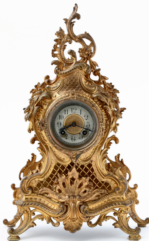
Zegar kominkowy, stołowy, Lenzkirch, Schwarzwald, Badenia, Niemcy, 1889, odlew, brąz złocony, 40 × 27 cm, nr inw. MHK-1534/II