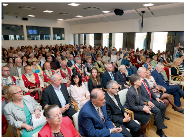
Uczestnicy wernisażu wystawy Na wspólnej drodze. Kraków i Budapeszt w średniowieczu , sala Miedziana w pałacu Pod Krzysztoforą, 5 czerwca 2017 r.

Pałac Pod Krzysztoforą, główna siedziba Muzeum, był przygotowywany do kolejnego etapu remontu, tym razem skrzydła wschodniego tej budowli. 2017 był ostatnim rokiem działalności ekspozycyjnej w pałacu przed wejściem do niego, na kilka lat, ekip budowlanych.