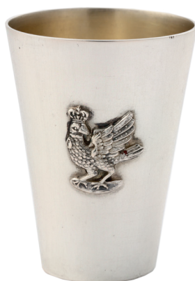
Jeden z dwóch kieliszków z wizerunkiem kura krakowskiego Bractwa Kurkowego, wyk. Władysław Rogalski (?), Kraków, okres międzywojenny, srebro, odlew, złocenie, wys. 4,5 cm, nr inw. MHK-993/Brk/1-2