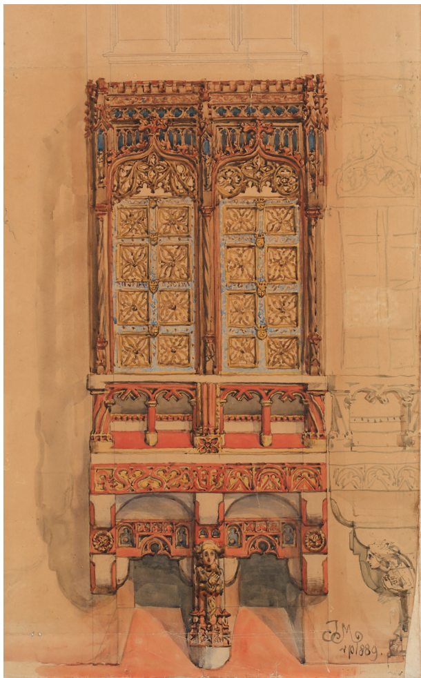
Jan Matejko, Projekt polichromii do kościoła Mariackiego , Kraków, 1889, akwarela, papier, 85 × 47 cm, nr inw. 3860/VIII