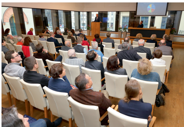
Seminarium (po) Co pokazać i (po) co ukryć , sala Miedziana w pałacu Pod Krzysztofory, 6 grudnia 2017 r., fot. Andrzej Janikowski

budynku i naprawę uszkodzonego tarasu. Opracowano projekt koniecznej modyfikacji systemu wentylacji w obiekcie i wyłoniono firmę, która zrealizowała w drugiej połowie roku uzupełniającą modernizację wentylacji mechanicznej. Tym samym zapewniono warunki do bezpiecznego i zgodnego z normami przechowywania muzealiów. W przygotowaniach do uruchomienia obiektu ważną rolę odegrało także wykonanie pełnej aranżacji pomieszczeń magazynowych i komunikacyjnych udostępnianych do zwiedzania.