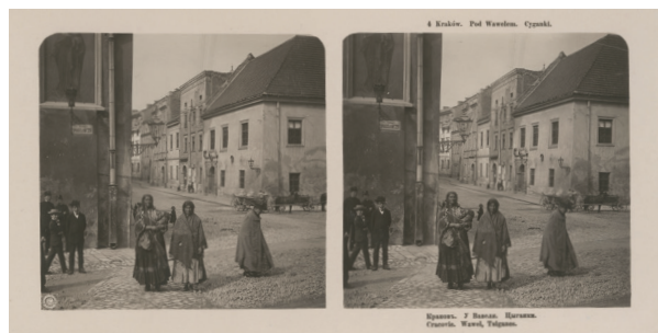
Zdjęcie stereoskopowe przedstawiające dwie Cyganki u stóp Wawelu, autor nieznan, początek XX w., 8,8 × 17,9 cm, nr inw. MHK-Fs22429/IX