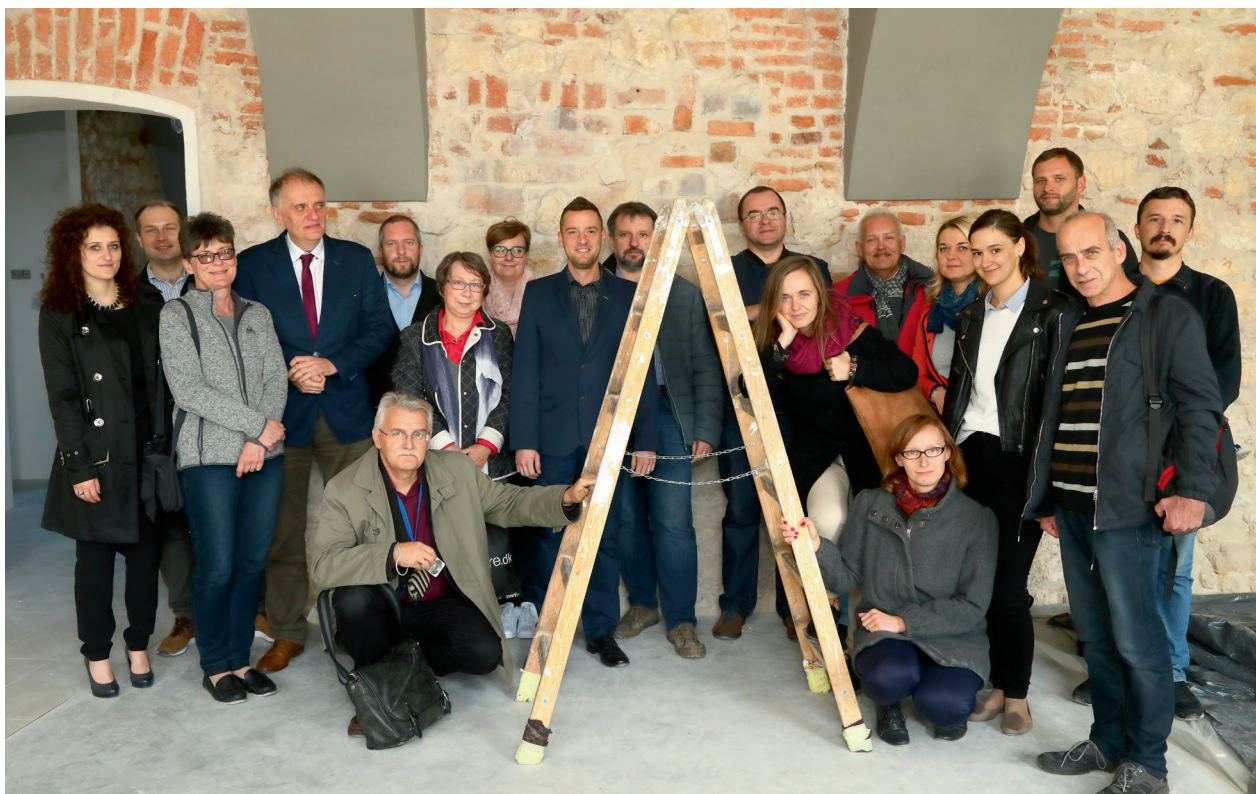
Członkowie zespołu projektowego Muzeum Podgórze, sala wystawy stałej w trakcie prac budowlanych, 28 września 2017 r., fot. Andrzej Janikowski

Tym samym nie było możliwe udostępnienie zwiedzającym Muzeum w zakładanym początkowo terminie: pod koniec października 2017 roku.