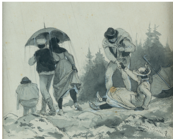
Walery Eljasz-Radzikowski, Wycieczka w Tatry , sygn. p. d. Walery Eljasz R., ok. 1870–1890, akwarela, papier, 15 × 17cm, nr inw. MHK-3865/VIII