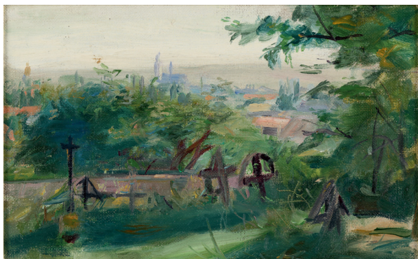
Wojciech Weiss, Cmentarz Podgórski , Podgórze, 1896, olej, płótno, 12 × 20 cm, nr inw. MHK-6178/III