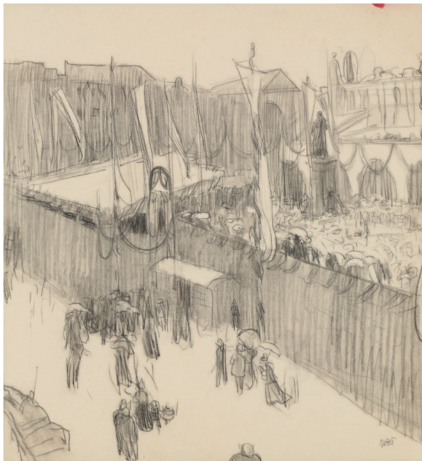
Wojciech Weiss, Uroczyste odsłonięcie pomnika Adama Mickiewicza na Rynku krakowskim , datowany p. d. ołówkiem 1898, Kraków, rysunek, węgiel, papier, 41 × 39,5 cm, nr inw. MHK- 3869/VIII