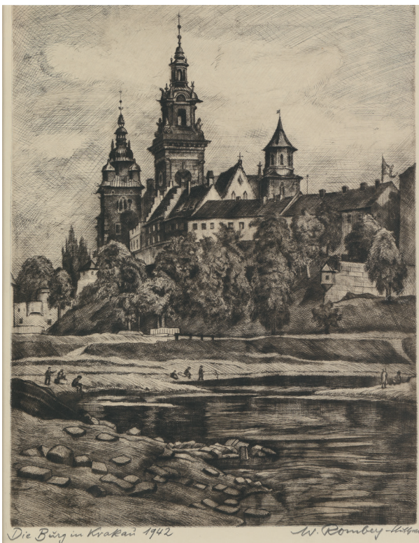
Walter Romberg, Burg in Krakau (Wawel) , sygn. l. d. Die Burg in Krakau 1942 , p. d. W. Romberg-Stuttgart, Kraków, 1942, miedzioryt, akwaforta, 34 × 44,5 cm, nr inw. MHK-3861/VIII