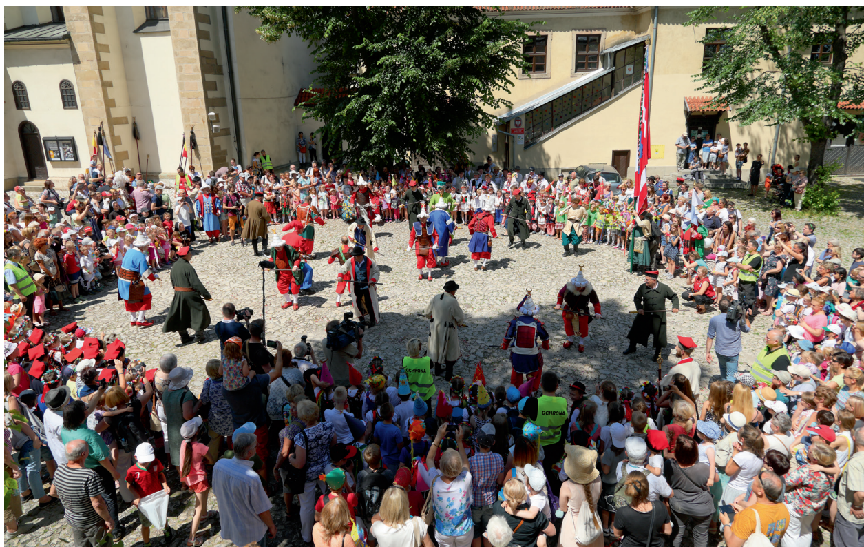
Pochód Lajkonika, bitwa Tatarów z włóczkami na dziedzińcu klasztoru Norbartanek, 22 czerwca 2017 r.

rzy kreuują i realizują wspólnie z Muzeum program edukacyjny wydarzenia. W roku 2017 koncentrowaliśmy się na tematyce wystawy Na wspólnej drodze. Kraków i Budapeszt w średniowieczu . Treść poszczególnych zajęć organizowanych we wszystkie soboty i niedziele lipca i sierpnia dotyczyła szlaków handlowych w średniowieczu, życia codziennego, rzemiosła, obronności i turniejów tej epoki. Wielkim powodzeniem cieszyła się gra miejska Imię zbrodni , turniej rycerski czy inscenizacja najazdu tatarskiego.