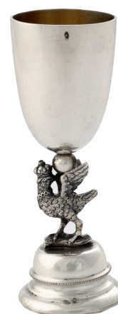
Pucharek z trzonem w kształcie miniaturowy kura krakowskiego Bractwa Kurkowego, wyk. Władysław Rogalski (?), Kraków, okres międzywojenny, srebro, odlew, wys. 9,5 cm, nr inw. MHK-994/Brk