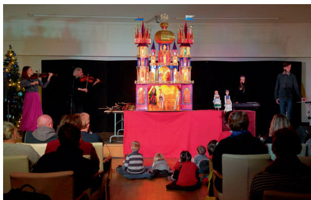
Przedstawienie jasełkowe w wykonaniu rodziny Malików, 15 stycznia 2017 r.

W związku z przygotowaniem do generalnego remontu wschodniego skrzydła pałacu Pod Krzysztoforą Muzeum przeniosło lokalizację corocznej wystawy szopek krakowskich