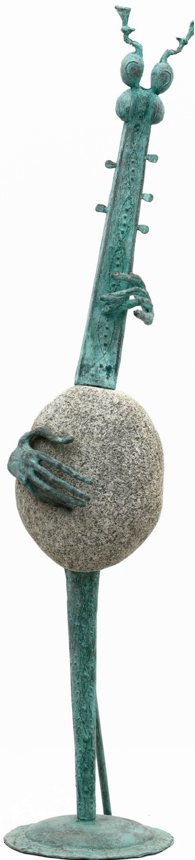
Bronisław Chromy, Muzykant I , Kraków 2010, brąz patynowany, kamień, odlew, spawanie, wys. 175 cm, nr inw. MHK-112/IV