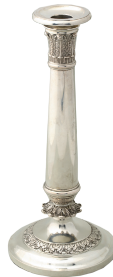
Jeden z dwóch świeczników, wyk. Stanisław Westwalewicz, ok. 1820, srebro, wys. 29 cm, nr inw. MHK-6169/III/1-2