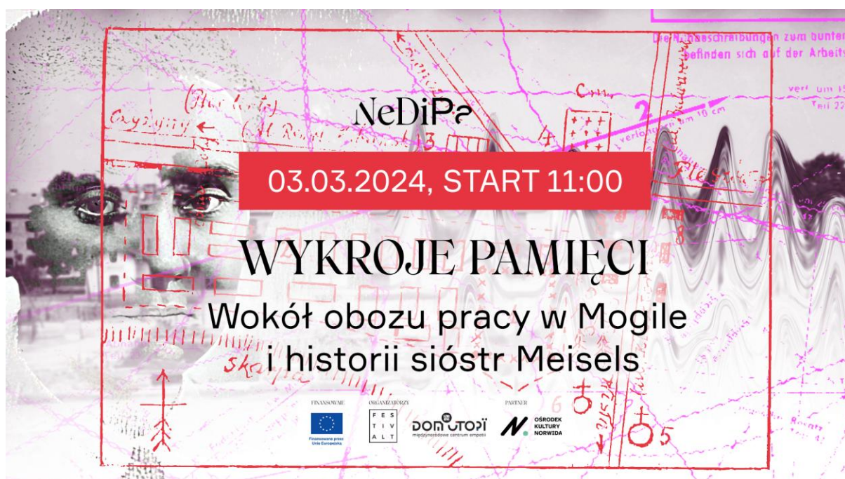
Grafika: Plakat z zaproszeniem na wystawę