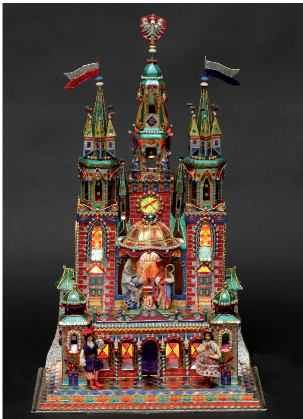
AUTOR SZOPKI: Stanisław Paczyński 1991