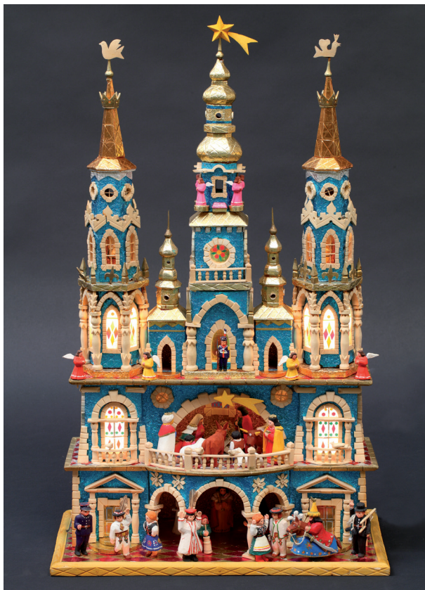
AUTOR SZOPKI: Marian Więcek 1998