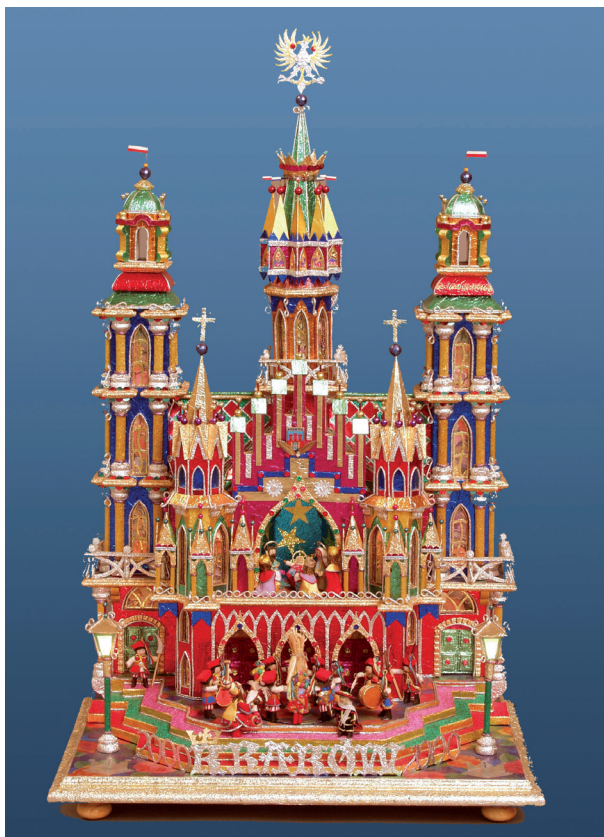
AUTOR SZOPKI: Piotr Michalczyk 2000