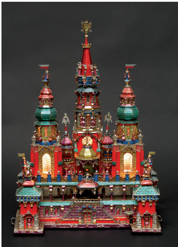
AUTOR SZOPKI: Krzysztof Dębski 1994