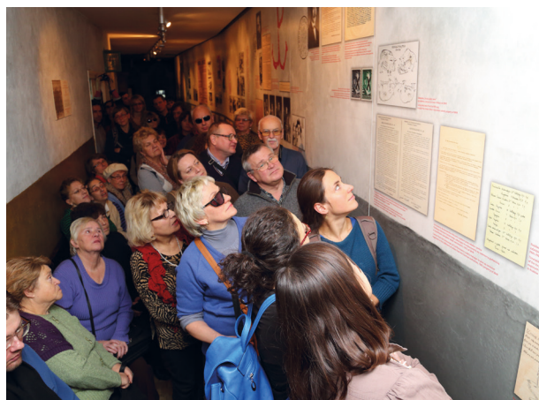
Spotkanie inauguracyjne trasy dla niepełnosprawnych w ramach projektu Muzeum poza ciszą i ciemnością, wystawa stała Kraków – czas okupacji 1939–1945, 26 listopada 2013 r.