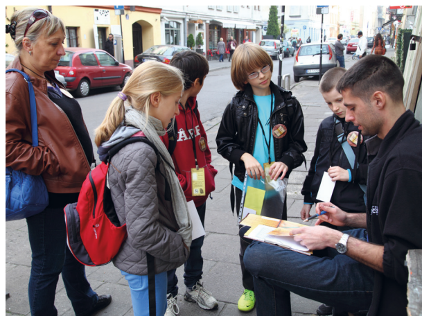
Gra miejska Zapomniany pamiętnik , zrealizowana w ramach projektu Opowiedz mi miasto , jeden z punktów kontaktowych, 11 października 2013 r.

MHK kontynuowało współpracę w ramach CAMOC-ICOM i Międzynarodowej Koalicji Miejsc Sumienia (Fabryka Emalia Oskara Schindlera).