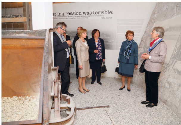
Wizyta Pierwszych Dam, małżonek prezydentów państw Europy Środkowej w Fabryce Emalia Oskara Schindlera, pośrodku Pierwsza Dama RP Anna Komorowska, 9 października 2013 r.

Muzeum gościło, w ramach wymiany stażowej, pracowników muzeów Lwowa i Magdeburga. Trwały rozmowy w sprawie kolejnych wystaw czasowych ze zbiorów MHK w Koszycach i w Montrealu.