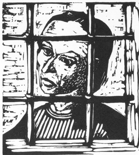
„Uwięziona” 1949 r.

Jonasz Stern, Kryjówka w getcie, z cyklu Getto lwowskie, 1945, drzeworyt, 37 na 26 cm; w zbiorach MHK, nr inw. MHK-3124/VIII/1-14