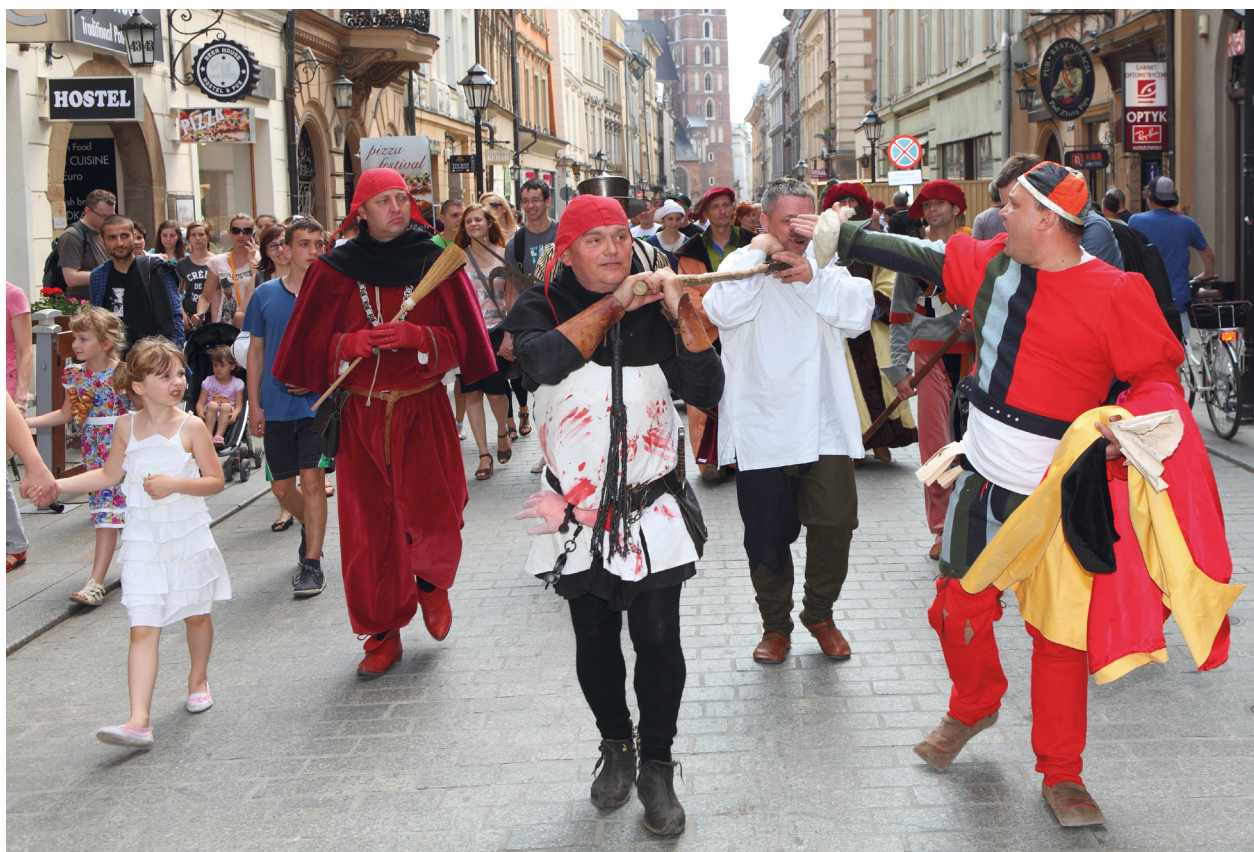
Uliczna inscenizacja w ramach wydarzenia Średniowiecze da się lubić, 15 czerwca 2013 r.; fot. Tomasz Kalarus

5 października 2013 r. w hali Com-Com Zone w Nowej Hucie odbył się IX Turniej Piłkarski Muzeów Krakowskich o Puchar Prezydenta Krakowa. Jest to impreza organizowana przez muzea krakowskie od roku 2005. Głównym organizatorem jest MHK.