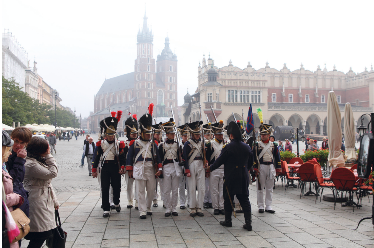
Wernisaż wystawy W nurtach historii. W 200. rocznicę śmierci księcia Józefa Poniatowskiego, 8 października 2013 r.