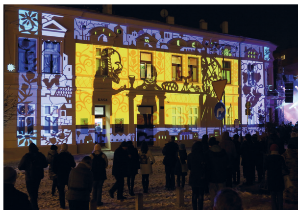
Mapping na fasadzie kamienicy przy placu Bohaterów Getta 18, część uroczystości, 16 marca 2013 r.; fot. Andrzej Janikowski

kumentalnymi i prezentacjami dostępnymi we wszystkich pomieszczeniach.