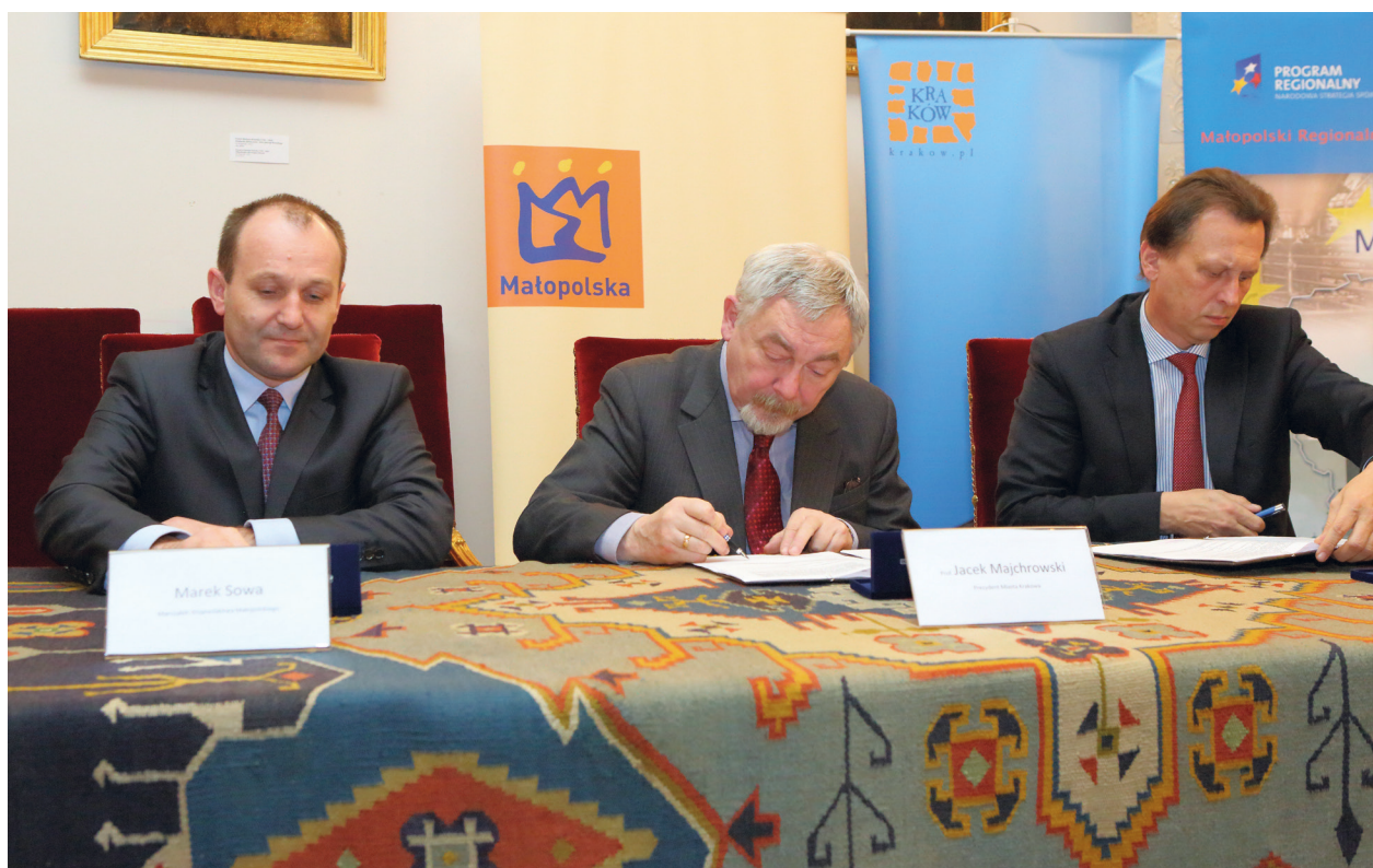
Uroczystość podpisania umowy pomiędzy Gminą Miejską Kraków a Zarządkiem Województwa Małopolskiego dotyczącej dofinansowania modernizacji pałacu Pod Krzysztoforami środkami unijnymi, od lewej: marszałek Marek Sowa, prezydent Krakowa Jacek Majchrowski, członek Zarządu Województwa Jacek Krupa, sala Baltazara Fontany, pałac Pod Krzysztoforami, 17 stycznia 2013 r.; fot. Andrzej Janikowski

Zamontowano od strony dziedzińca konstrukcję windy biegnącej od piwnic do czwartego piętra pałacu. Duże tempo prac wynikało z konieczności dotrzymania terminów przewidzianych w projekcie unijnym i zakończenia inwestycji do końca sierpnia 2014 roku. Łącznie wartość prac budowlanych wykonanych w skrzydle zachodnim pałacu wyniosła w ramach projektu unijnego prawie 5,5 mln zł oraz dodatkowo ok. 1,4 mln zł wartość prac konserwatorskich zrealizowanych głównie dzięki wsparciu Narodowego Funduszu Rewaloryzacji Zabytków Krakowa (NFRZK).