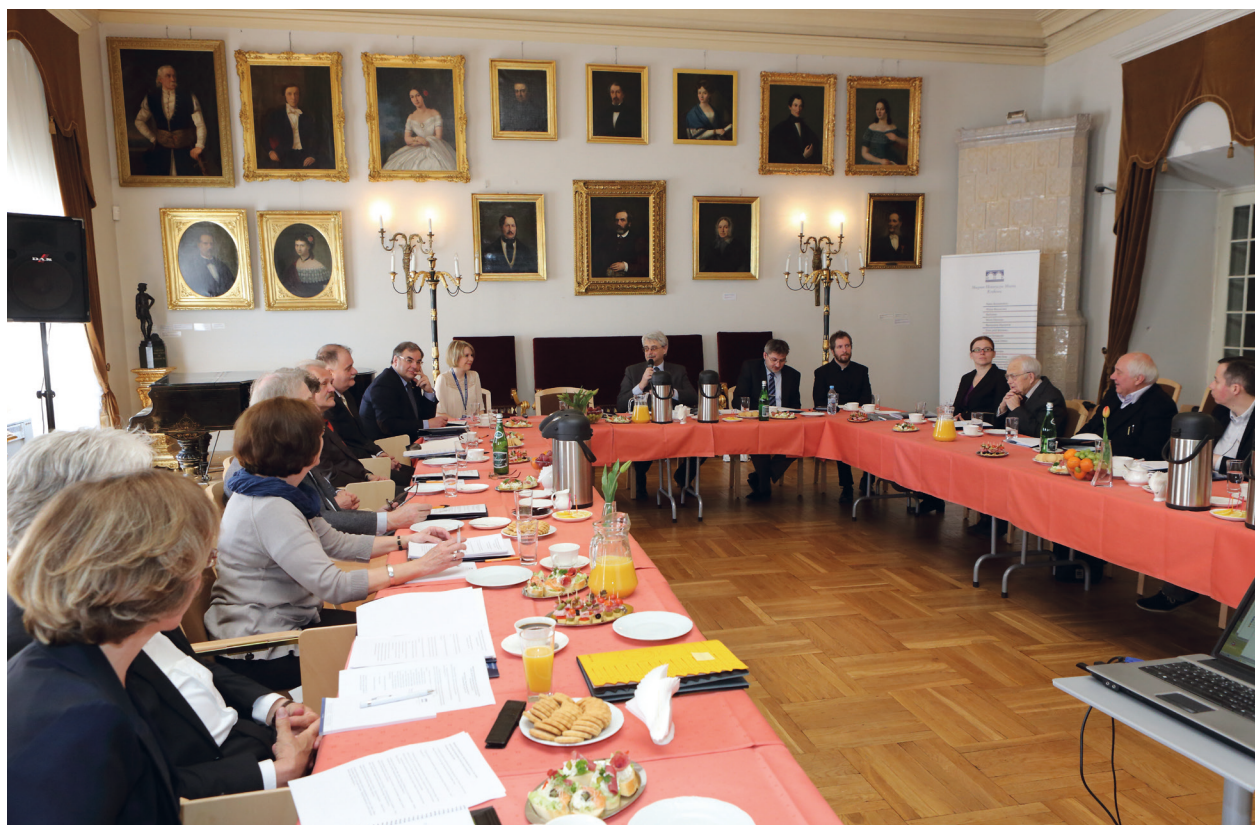
Posiedzenie Rady Muzeum Historycznego Miasta Krakowa, sala Baltazara Fontany, pałac pod Krzysztofory, 22 kwietnia 2013 r.