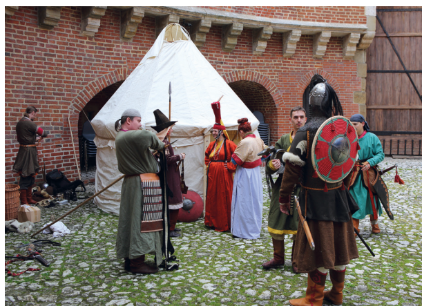
Legendy z Rondla w sosie tatarskim, wydarzenie towarzyszące corocznemu Pochodowi Lajkonika, Barbakan, 8 czerwca 2013 r.