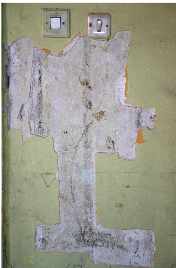
Ryc. 29. Drugie piętro, pomieszczenie nr 321, ściana wschodnia. Fragment dekoracji z motywem roślinnym

nakryte płaskimi sufitami. W pierwszym etapie przebadano sufity, nie znaleziono na nich historycznych warstw przewidzianych do konserwacji i ewentualnej ekspozycji 54 . W drugim etapie wykonano sondy stratygraficzne na wszystkich ścianach wyżej wymienionych pomieszczeń 55 . Na ścianach przebadanych pomieszczeń nie stwierdzono występowania dekoracyjnych warstw malarskich. Nie znaleziono historycznych warstw przewidzianych do konserwacji czy ewentualnej ekspozycji.