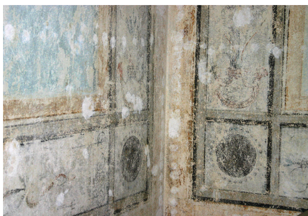
Ryc. 13. Pierwsze piętro, pomieszczenie nr 220, fragment odsłoniętej polichromii po zabiegach konserwacji technicznej, stan z maja 2012 r., fot. D. Jurczyk-Curyło

nych partiach 2–2,5 cm. Widoczne są liczne przemurowania i naprawy. Prawdopodobnie na najstarszy zachowany tynk natrafiono na ścianie północnej przy otworze drzwiowym. Tam też odkryto ślady szcążkowo zachowanych pasków dekoracyjnych. Generalnie nie znaleziono malarskich warstw dekoracyjnych, a jedynie szcążkowo skupiska koloru.