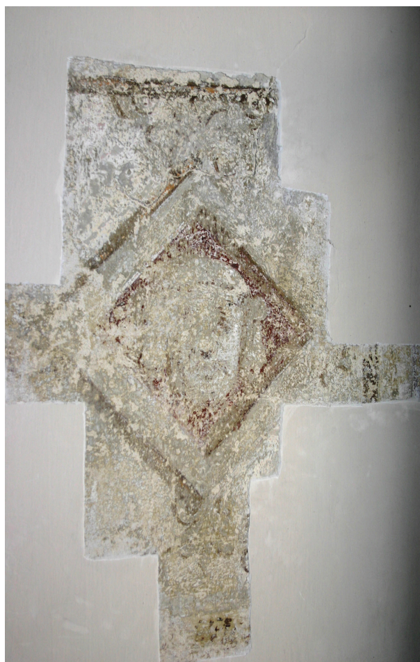
Ryc. 3. Pierwsze piętro, pomieszczenie nr 219, ściana północna, zachodni gład okienny, fot. D. Jurczyk-Curyło

Na tym etapie badań oceniono, że ujawniona kompozycja architektoniczna jest zachowana w stopniu wystarczającym, by zaproponować jej odsłonięcie na wszystkich ścianach oraz konserwację techniczną. Polichromia proponowana do odsłonięcia i konserwacji technicznej wykonana jest w technice mieszanej: fresk, farba na spoiwie organicznym (klejówka) 11 . Stwierdzono istnienie pigmentów: żelazowych (czerwień, ugier) i bieli wapiennej. Zbadano również próbkę najstarszej zaprawy wapienno-piaskowej, leżącej bezpośrednio na wątku ceglany. Zaprawa o strukturze gruboziarnistej bez zawartości gipsu, w kolorze białym. Jako