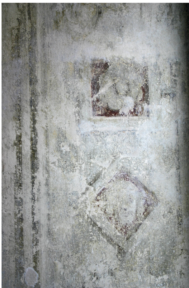
Ryc. 4. Pierwsze piętro, pomieszczenie nr 219, fragment glifu okiennego i ściany północnej po odsłonięciu polichromii, stan z maja 2012 r.

strukcyjnego, należy ją usunąć. Można to zrobić w ramach prac budowlano-remontowych jeszcze przed przystąpieniem do odsłaniania dekoracji, oczywiście pod ścisłym nadzorem konserwatora, bowiem bezpośrednio poniżej listwy jest zachowana dekoracja. Można to wykonać również po odsłonięciu polichromii w ramach prac konserwacji technicznej.