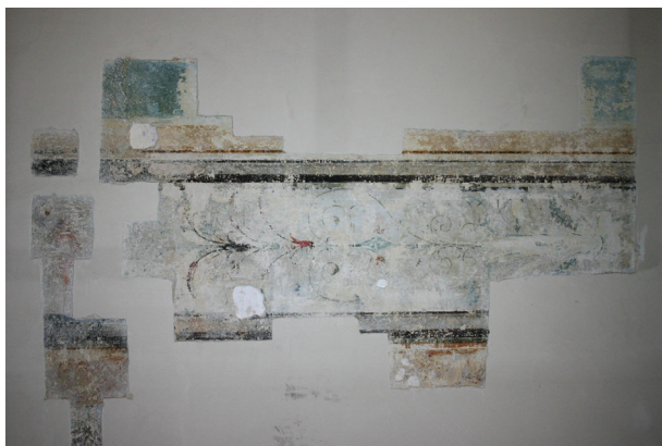
Ryc. 8. Pierwsze piętro, pomieszczenie nr 220, ściana zachodnia. Fragment odkrytej dekoracji typu iluzjonistycznego