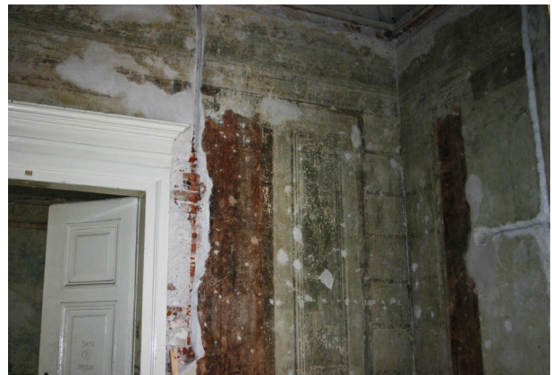
Ryc. 2. Pierwsze piętro, pomieszczenie nr 219, fragment narożnika północno-zachodniego. Polichromia po odsłonięciu i zabiegach konserwacji technicznej, stan z maja 2012 r.

północnej jedynie w narożniku wschodnim i zachodnim, a w środkowej partii ściany północnej najstarsze warstwy zostały zniszczone aż do wątku. Zachowana pierwotna dekoracja malarska jest starsza niż obecnie istniejące belki konstrukcyjne stropu (mechaniczne uszkodzenia w związku z wykuwaniem gniazd belek). Dekoracja o motywach roślinno-geometrycznych to rodzaj liściastych girland na błękitnym tle i przyozdobionych motywem zdwojonych pasków pomiędzy nimi. Analizy chemiczne wykazały istnienie pigmentów bieli wapiennej i czerni. Nie znaleziono barwników, które mogłyby być wskazówką przy dokładnym datowaniu dekoracji 7 .