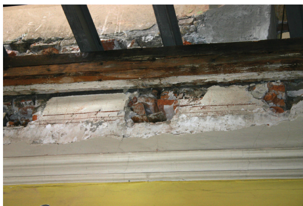
Ryc. 15. Pierwsze piętro, pomieszczenie nr 223, ściana zachodnia nad gzymssem. Zarysy niezrealizowanego projektu dekoracji odkryte po usunięciu sufitu i fasety, fot. D. Jurczyk-Curyło

Warto przypomnieć, że chociaż na suficie i fasacie nie znaleziono żadnych śladów dekoracji malarskich, to profilowany gzyms pochodzący z drugiej połowy XIX wieku jest chronionym elementem zabytkowym i należy go poddać