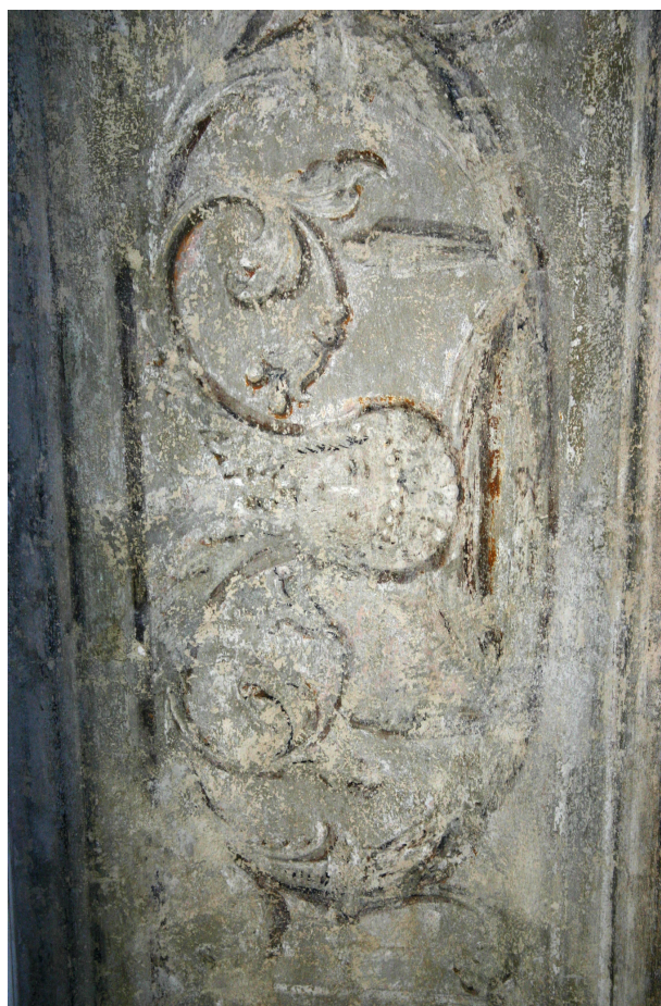
Ryc. 5. Pierwsze piętro, pomieszczenie nr 219, fragment glifu nad otworem okiennym. Polichromia po zabiegach konserwacji technicznej, stan z maja 2012 r., fot. D. Jurczyk-Curyło

Polichromia zachowana pomiędzy podłogą pomieszczenia nr 321 a sufitem pomieszczenia nr 219, zgodnie