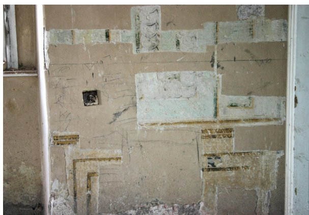
Ryc. 19. Drugie piętro, pomieszczenie nr 318, ściana zachodnia. W odkrywce widoczne zdwojone płyciny węglne