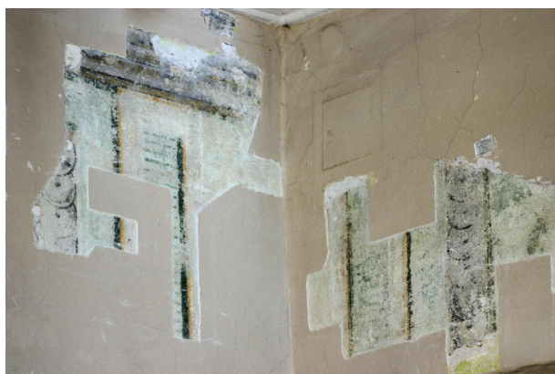
Ryc. 17. Drugie piętro, pomieszczenie nr 318, narożnik ściany północno-wschodniej. Odkrywki ukazują dekorację architektoniczno-płycinową z motywem tralkowym

Polichromia należąca do II warstwy chronologicznej właściwie zachowała się jedynie na ścianie południowej nad otworem drzwiowym (zapewne niegdyś z naświetlem, jak istniejący otwór w ścianie zachodniej). Na ścianie wschodniej w dolnym pasie przy otworze drzwiowym zachowały się fragmenty poziomych pasków, podobne szczątki widoczne są na ścianie północnej. Generalnie, ściany pomieszczenia mocno zniszczone przez liczne instalacje, przekucia i przemurowania. Odkryty, najlepiej zachowany fragment nad drzwiami do pomieszczenia nr 317, koresponduje z pierwotnym otworem – jest supraportą o wyraźnym zamknięciu pionowym i poziomym. Malatura wyżej opisanej polichromii wykonana jest w technice klejowej lub temperowej (w spoiwie wykryto białko) 30 . Stwierdzono istnienie pigmentów: zieleń miedziowa – prawdopodobnie verdigris, czerń z węgla drzewnego, smalta grubokrystaliczna.