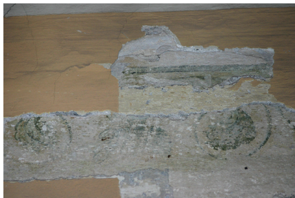
Ryc. 16. Drugie piętro, pomieszczenie nr 316, ściana południowa. Fragment supraporty, motyw roślinny

Polichromie w wymienionych wnętrzach charakteryzują się takim samym rodzajem plastyczności, delikatnością, fi-