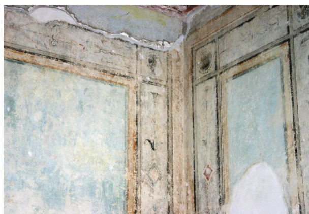
Ryc. 11. Pierwsze piętro, pomieszczenie nr 220, fragment polichromii typu iluzjonistycznego odkrytej na ścianie zachodniej, po konserwacji technicznej, stan z maja 2012 r.

arabeskowym w symetrycznym układzie kandelabrowym 16 . Ornamenty nie powielają jednego układu lecz budowane są indywidualnie (wić roślinna, woluty, grona owoców, kwiaty z listkami, romby, parasol, zarys figurki ludzkiej; ryc. 8–13).