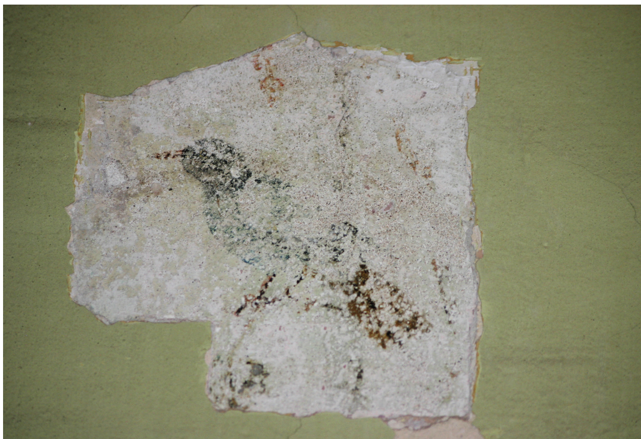
Ryc. 28. Drugie piętro, pomieszczenie nr 321, ściana wschodnia w odkrywce widoczny wielobarwny ptak

rościach (por. ryc. 21, 22). Technika malatury mieszana – mokry fresk wykończony temperą 47 .