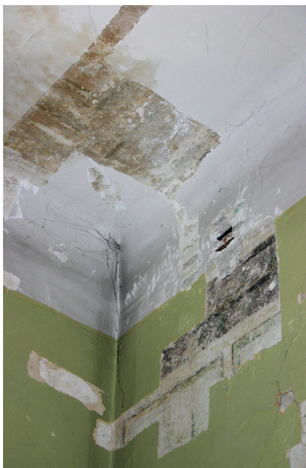
Ryc. 24. Drugie piętro, pomieszczenie nr 321, narożnik północno-wschodni. Fragment polichromii na ścianach i suficie

W wielu miejscach stan zachowania warstw technologicznych nie jest dobry, a dalsze poszerzanie odkrywek bez prac techniczno-zabezpieczających groziłoby zniszczeniem frag-