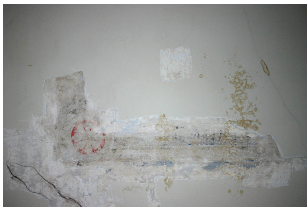
Ryc. 14. Pierwsze piętro, pomieszczenie nr 220, sufit. Fragment XX-wiecznej dekoracji

Malatura wykonana na bazie spoiwa klejowego, dość nietrwała, ulegająca degradacji. W miejscu być może kiedyś istniejącego profilowanego gzymsu podsufitowego została