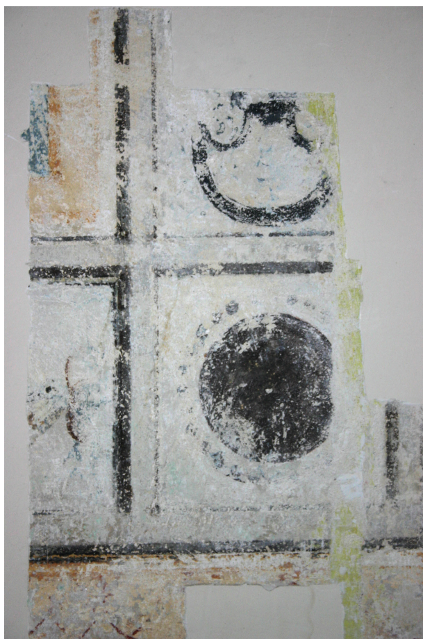
Ryc. 12. Pierwsze piętro, pomieszczenie nr 220, ściana północna. W odkrywcę fragment ornamentu, fot. D. Jurczyk-Curyło