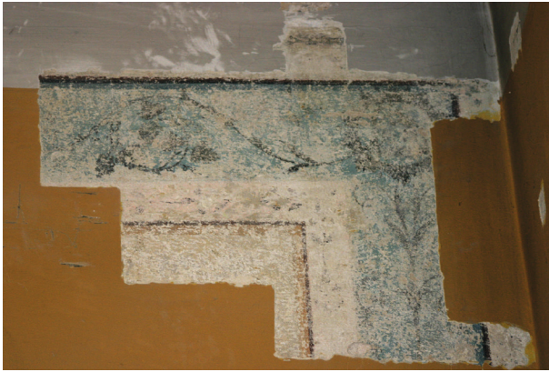
Ryc. 21. Drugie piętro, pomieszczenie nr 320, ściana zachodnia. Fragment dekoracji płycinowej typu iluzjonistycznego, fot. D. Jurczyk-Curyło

mii. Pomiędzy lizeny wpisane są płyciny obramione dekoracją typu cekinowego i tralkowego – równoległy szraf 32 . Dolny pas dekoracji stanowią prostokątne zdwojone płyciny wgłębne najlepiej zachowane i widoczne w odkrywkach na ścianie zachodniej i północnej (ryc. 19, 20) 33 . Wstępnie powstanie polichromii datowane jest na ostatnie lata XVIII wieku lub początek wieku XIX.