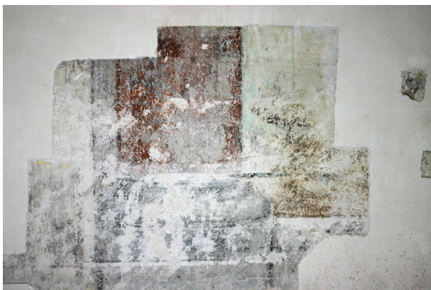
Ryc. 6. Pierwsze piętro, pomieszczenie nr 219, ściana południowa. Fragment bazy i trzonu kolumny, zarys krajobrazu (?)