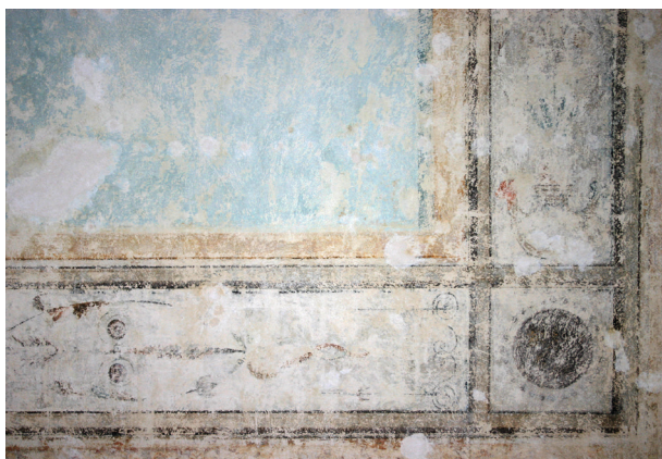
Ryc. 9. Pierwsze piętro, pomieszczenie nr 220, fragment odkrytej dekoracji malarskiej po zabiegach konserwacji technicznej, stan z maja 2012 r.