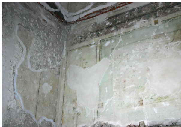
Ryc. 25. Drugie piętro, pomieszczenie nr 321, narożnik północno-wschodni. Dekoracja malarska po zabiegach konserwacji technicznej, stan z maja 2012 r.

mentów tak subtelnej polichromii. W związku z tym nie rozczytoano szczegółów powierzchni między podziałkami. Pełniejsze rozpoznanie da dopiero całkowite odsłonięcie polichromii.