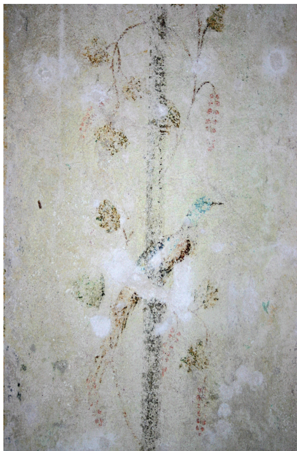
Ryc. 27. Drugie piętro, pomieszczenie nr 321, ściana wschodnia. Fragment dekoracji malarskiej po zabiegach konserwacji technicznej, stan z maja 2012 r.