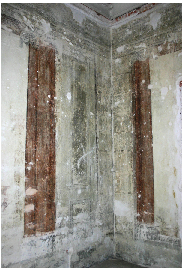
Ryc. 7. Pierwsze piętro, pomieszczenie nr 219, fragment odsłoniętej architektonicznej dekoracji malarskiej po zabiegach konserwacji technicznej, stan z maja 2012 r., fot. D. Jurczyk-Curyło

Sufit z wieloma uszkodzeniami mechanicznymi, zaciekami, licznymi odspojeniami warstw, zwłaszcza w północnej jego części. Pod najmłodszą chronologicznie warstwą widoczne przyklejone na spękaniach bandaż budowlane.