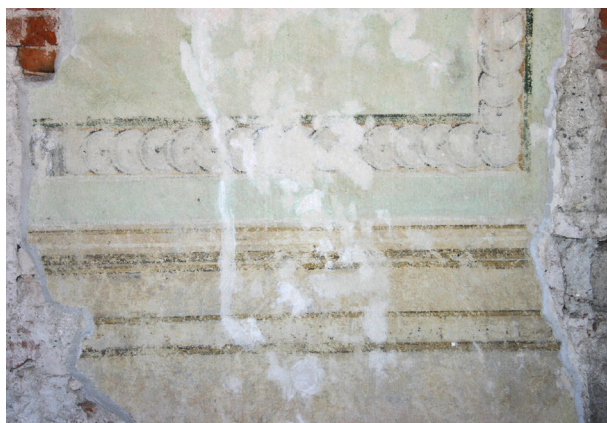
Ryc. 20. Drugie piętro, pomieszczenie nr 318, ściana zachodnia. Fragment dekoracji po zabiegach konserwacji technicznej, stan z maja 2012 r.

wyrównania gipsowego i wierzchnią emulsją różowougrowobiałą. Wnętrze artykułowane jest przez lizeny flankujące narożniki i glify otworów okiennych 31 . Otwór drzwiowy w ścianie wschodniej jest wtórny w stosunku do polichro-