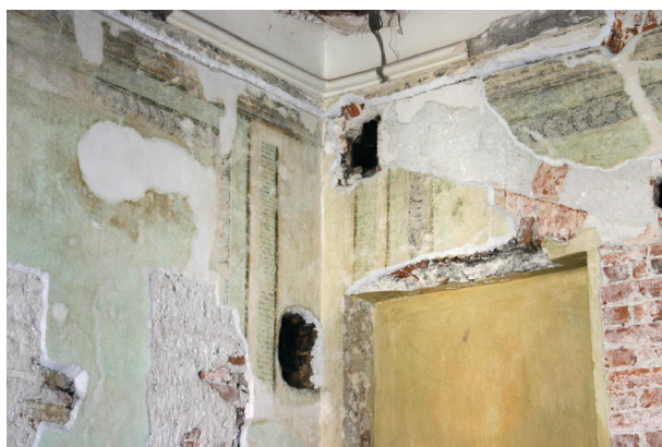
Ryc. 18. Drugie piętro, pomieszczenie nr 318, fragment narożnika ściany północno-wschodniej. Polichromia po zabiegach konserwacji technicznej, stan z maja 2012 r.

Na większości powierzchni czterech ścian najstarsza zachowana dekoracja malarska znajduje się tylko pod warstwą