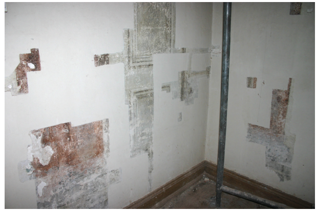
Ryc. 1. Pierwsze piętro, pomieszczenie nr 219, narożnik północno-zachodni. W odkrywkach fragmenty polichromii typu architektonicznego, fot. D. Jurczyk-Curyło

Dzięki usunięciu podłogi w pomieszczeniu nr 321 na drugim piętrze odsłoniła się polichromia zachowana między konstrukcyjnymi belkami stropu nad pomieszczeniem nr 219. Dekoracja malarska o spoiwie bardzo nietrwałym, klejowym, na pobiale i tynku wapienno-piaskowym, znajduje się w obrębie fryzu podsufitowego, co jest dowodem na to, że pomieszczenie nr 219 było wyższe. Polichromia zachowana jest na wszystkich ścianach, przy czym na ścianie