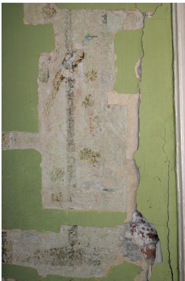
Ryc. 26. Drugie piętro, pomieszczenie nr 321, ściana wschodnia. Fragment dekoracji z motywem roślinnym i ornitologicznym, fot. D. Jurczyk-Curyło

Na tym etapie badań pomimo licznych ubytków i zniszczeń (przekucia, fragmenty przemurowanych ścianek) ocenia się, że ujawniona kompozycja iluzjonistyczna jest zachowana w stopniu wystarczającym, by zaproponować odsłonięcie jej na wszystkich ścianach oraz konserwację techniczną. Malatura opisywanej polichromii wykonana jest w technice wapiennej. Stwierdzono istnienie pigmentów: błękit miedziowy i cynober 41 .