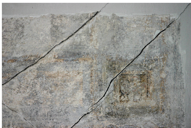
Ryc. 23. Drugie piętro, pomieszczenie nr 320, sufit. Fragment XX-wiecznej dekoracji

tografie ze skalą podziałki 38 . Użytkownik zobowiązał się zdjąć fragmenty lepiej zachowane (wykonanie transferu) w celu zachowania szczątków autentycznej warstwy historycznej.