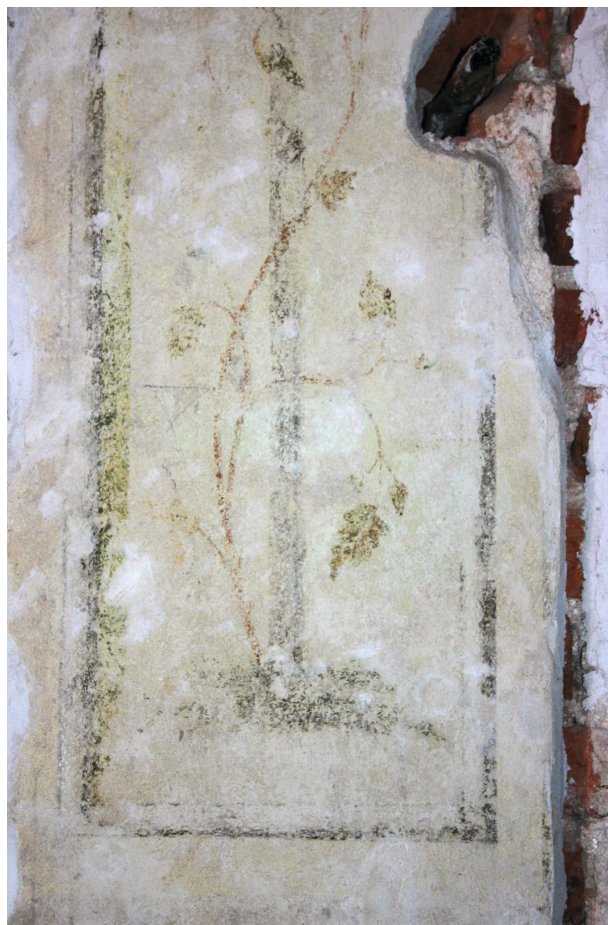
Ryc. 30. Drugie piętro, pomieszczenie nr 321, ściana wschodnia. Fragment polichromii po zabiegach konserwacji technicznej, stan z maja 2012 r.

Wstępne datowanie poszczególnych wątków i warstw na nich leżących przyjęto na podstawie dotychczasowych badań