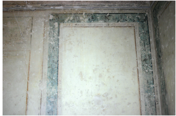
Ryc. 22. Drugie piętro, pomieszczenie nr 320, fragment dekoracji po zabiegach konserwacji technicznej, stan z maja 2012 r.

Na ścianach znaleziono osiem warstw chronologicznych: VIII – najmłodsza, emulsyjna, oranżowougrowa, rozbielona na podkładzie; VII – żółta klejówka (w pasie lamperii do wysokości 170 cm brązowa olejna); VI – żółtozielona na podkładzie (olejna lamperia zielona); V – zbitek kolejnych przemalowań monochromatycznych na pobiałach (w pasie lamperii olejnych na podkładach). Występuje zróżnicowanie kolorystyczne ze względu na dawny podział pomieszczenia; IV – monochromatyczna ugrowobiała na miejscowym cienkim zatarciu wapienno-piaskowym i pobiale; III – dekoracja malarska płycinowa typu iluzjonistycznego z ornamentem roślinnym. Tonacja płycin bladioróżowougrowa, ornament ciemnobrązowobordowy na tle błękitu (ryc. 21, 22). W górnej części szczątkowo zachowane fragmenty belkowania, w dolnej profilowane płyciny w tonacji szarej na bardzo cienkiej pobiale i tynku wapienno-piaskowym o grubości