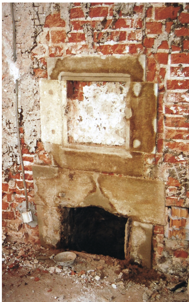
Pałac Pod Krzysztofory, parter, fragment południowej ściany loggii – stan po usunięciu tynku. Wtórnie osadzona kamieniarka okienka piwnicznego oraz wtórna kamieniarka wyczystki kominowej, 1682–1684