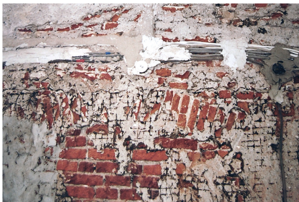
Pałac Pod Krzysztofory, parter, fragment południowej ściany loggii – stan po usunięciu tynku. Widoczne nadproże otworu drzwiowego uformowane w barokowej fazie budowy zaślepięnego wtórnie w 2. połowie XX w.