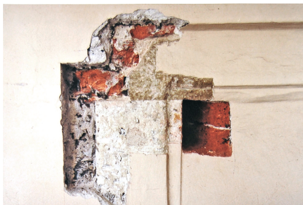
Pałac Pod Krzysztofory, parter, południowa ściana loggii, odsłonięty w odkrywcę fragment wtórnie osadzonego w wątku ściany piaskowcowego nadproża i zachodniego węgara zaślepionej obecnie wyczystki kominowej, 1682–1684

Wtórnie osadzony w wątku ściany kamienny stopień schodów stanowił zapewne nadproże wnęki o obecnie niesprecyzowanej funkcji – nie jest możliwe upatrywanie w tej partii ściany otworu drzwiowego, bowiem przylega do niej od wnętrza ściana poprzeczna, jak również brak nad nim konstrukcyjnego, ceglano nadproża. Użyty wtórnie materiał, a także niewystępowanie cech stylistycznych nie pozwalają na ścisłe datowanie czasu powstania wnęki; można wstępnie przyjąć, że wykonano ją w drugiej połowie XVIII