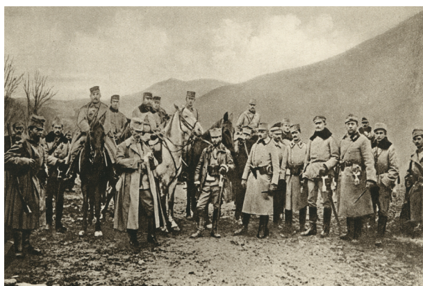
Legiony Polskie w polu. Pocztówka, „nakładem Wiedeńskiej Delegacji N. K. N. i Samarytanina polskiego na cele humanitarne Legionów i Samarytanina”; reprod. A. Janikowski; w zbiorach Muzeum Historycznego Miasta Krakowa, nr inw. 1250/K/VIII