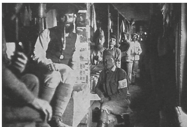
Jeńcy w baraku w obozie na Syberii, reprod. za: E. Brändström: Unter Kriegsgefangenen in Rußland und Sibirien 1914–1920. Berlin 1927