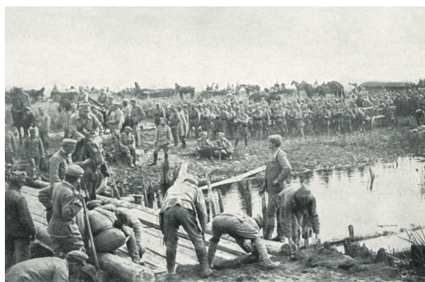
Legioniści. Fotografia w Albumie I Pułku I Brygady Legionów Polskich 1915; reprod. A. Janikowski; w zbiorach Biblioteki Naukowej i Archiwum Muzeum Historycznego Miasta Krakowa, nr inw. II 28100

1917 roku we Lwowie. Ukazywało się ono co miesiąc pod patronatem wspomnianych już Galicyjskiego Stowarzyszenia Czerwonego Krzyża i Centralnego Biura Wiadomości o Jeńcach we Lwowie. Określono w nim, w jaki sposób i gdzie należy zwracać się po informacje. Jeżeli chodzi o jeńców galicyjskich były to: Lwowska Sekcja Wywiadowcza, Krakowska Sekcja Wywiadowcza oraz filie biur wywiadowczych Galicyjskiego Czerwonego Krzyża w Krośnie i Przemyślu. Należało przy tym podać imię i nazwisko żołnierza (jeńca), szarżę, przynależność taktyczną, rok urodzenia, ewentualnie wiadome ostatnie miejsce internowania lub dokładny ostatni adres (pocztę polową). Do zadań wymienionych instytucji należało też pośrednictwo w przyjmowaniu zamówień na paczki żywnościowe oraz w wysyłce pieniędzy 15 .