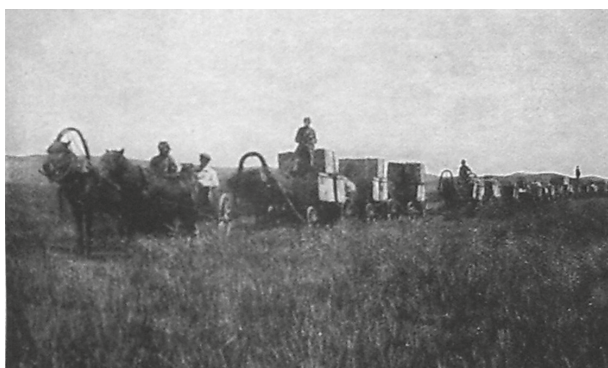
Szwedzka delegacja z transportem żywności dla obozu jenieckiego na Syberii; reprodukcja za: E. Brändström: Unter Kriegsgefangenen in Rußland und Sibirien 1914–1920 . Berlin 1927; reprodukcja M. Oettingen

jechał na front, przez Smoleńsk do Mińska. Tutaj spotkał się z rodziną, a potem przedostał się do Warszawy 23 .