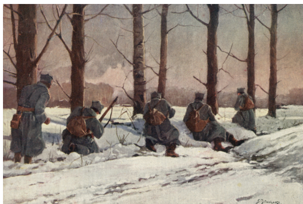
Legioniści w okopach. Pocztówka; reprod. A. Janikowski; w zbiorach Muzeum Historycznego Miasta Krakowa, nr inw. 2415/K/VIII

W różnych czasopismach wychodzących na terenie Galicji publikowano listy strat żołnierzy armii austro-węgierskiej. Uwzględniano w nich poległych, rannych, zaginionych, znajdujących się w niewoli lub tych, którzy z niej powrócili, przebywających w szpitalach. Podawano przy tym jednostkę, w której służyła dana osoba, rok urodzenia i miejscowość, z której pochodziła, miejsce i datę śmierci lub zaginięcia, ewentualnie powrotu z niewoli czy szpitala, czasem miejsce pochówku. Informowano też o stratach określonych pułków. Niekiedy były to tylko imiona i nazwiska. W wykazach ogólnych uwzględniano żołnierzy Legionów Polskich będących integralnym składnikiem armii austro-węgierskiej. Częściej jednak dane dotyczące legionistów podawano w odrębnych zestawieniach. Ukazywały się one na łamach takich czasopism, jak wydawane w Krakowie „Nowa Reforma” i „Czas” czy wychodzący od maja 1915 roku „Goniec Polowy Legionów” – dziennik rozporządzeń Komendy Legionów Polskich.