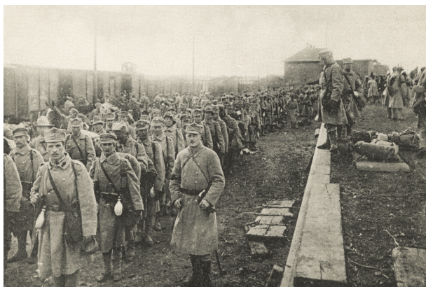
Legiony Polskie, II i III Pułk na dworcu krakowskim. Pocztówka, „nakładem Wiedeńskiej Delegacji Samarytanina polskiego na cele Legionów i Samarytanina polskiego”; reprod. A. Janikowski; w zbiorach Muzeum Historycznego Miasta Krakowa, nr inw. 1249/K/VIII

Źródło zachowało się w postaci dwóch oprawnych ksiąg. Obejmuje 3035 osób w układzie alfabetycznym według nazwisk, bez numerów porządkowych. Zapis dotyczący danej osoby zaczyna się od liczby rzymskiej w granicach od I do VIII – było to odniesienie do konkretnych wydawanych wcześniej przez CUE list strat, w których występowało nazwisko legionisty 6 . Dalej kolejno podano stopień, nazwisko i imię, pułk, kompanię, dzień, miesiąc i rok wzięcia do niewoli (zaginięcia), miejscowość, miejsce internowania, rok urodzenia, miejsce przynależności (zamieszkania), co nie zawsze odpowiadało miejscu urodzenia, zawód. Przy nazwiskach legionistów, o których CUE nie miał pewnych wiadomości zaznaczano: zaginiony (w tej grupie mieszczą się również osoby, przy których nie podano żadnej informacji o ich losach). Lista była uzupełniana na bieżąco. Świadczą o tym dopiski piórem uwzględniające nowe osoby, korygu-