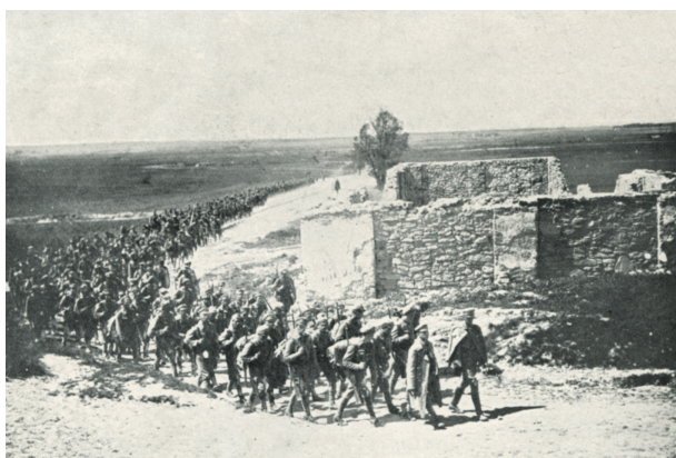
Legioniści. Fotografia w Albumie I Pułku I Brygady Legionów Polskich 1915; reprod. A. Janikowski; w zbiorach Biblioteki Naukowej i Archiwum Muzeum Historycznego Miasta Krakowa, nr inw. II 28100