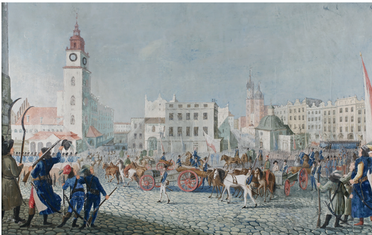
Sprowadzenie do Krakowa jeńców i zdobytych armat spod Raławic w kwietniu 1794 r., M. Stachowicz, koniec XVIII w., gwasz; w tle w środku Dom Komisji (dawna Wielka Waga), za nią z prawej fragment budynku Małej Wagi; w zbiorach Muzeum Historycznego Miasta Krakowa, nr inw. MHK 722/II