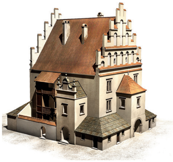
Wielka Waga w fazie III i IV, widok od południowego wschodu. W rekonstrukcji przyjęto wariant bryły z dachem dwuspadowym i manierystycznymi szczytami; oprac. nauk. W. Niewalda, S. Ślawiński, model cyfrowy P. Opaliński; w zbiorach Muzeum Historycznego Miasta Krakowa

W 1620 roku wspomniano o dwóch urządzeniach ważących oraz o skrzyni „z dziesięciną od ołowiu” dla kościoła Mariackiego. Na piętrze mieszkał czynszownik 74 . W 1621 roku wspomniano kramy pod Wagą i piwnice żelazne pod topnią 75 , w 1623 roku trzy piwnice pod topnią i osiem kramów pod Wagą 76 , w 1627 roku kramy przy Wadze „wkoło leżące” 77 . Z lat 1626–1629 pochodzą kolejne zapiski o topni oraz kramach 78 . W 1629 roku: „sklepy, piwnice i budy pod Wielką Wagą leżące poczynają się naprzeciwko kościołowi S. Wojciecha u wrót Wagi” 79 (było ich 19 80 ). W 1639 roku wymieniono 20 tych lokalności 81 . Tak też w 1641 i 1642 82 oraz