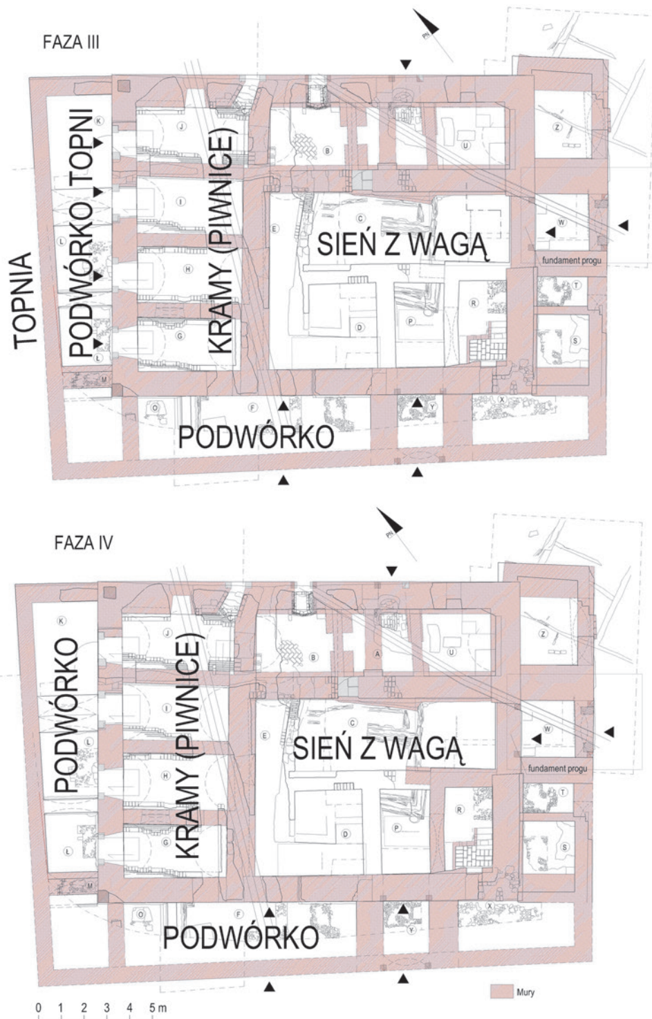
Rekonstrukcja przyziemia Wielkiej Wagi w fazie III i IV; oprac. nauk. W. Niewalda, S. Sławiński; oprac. rys. D. Rozbicka na podkładzie pomiaru M. Mamicy

roku potwierdza sąsiedztwo topni i targu węglowego oraz bliskość Kramów Bogatych 47 . Do 1592 roku skład ołowny był przy Wadze, potem przeniesiono go poza miasto 48 .