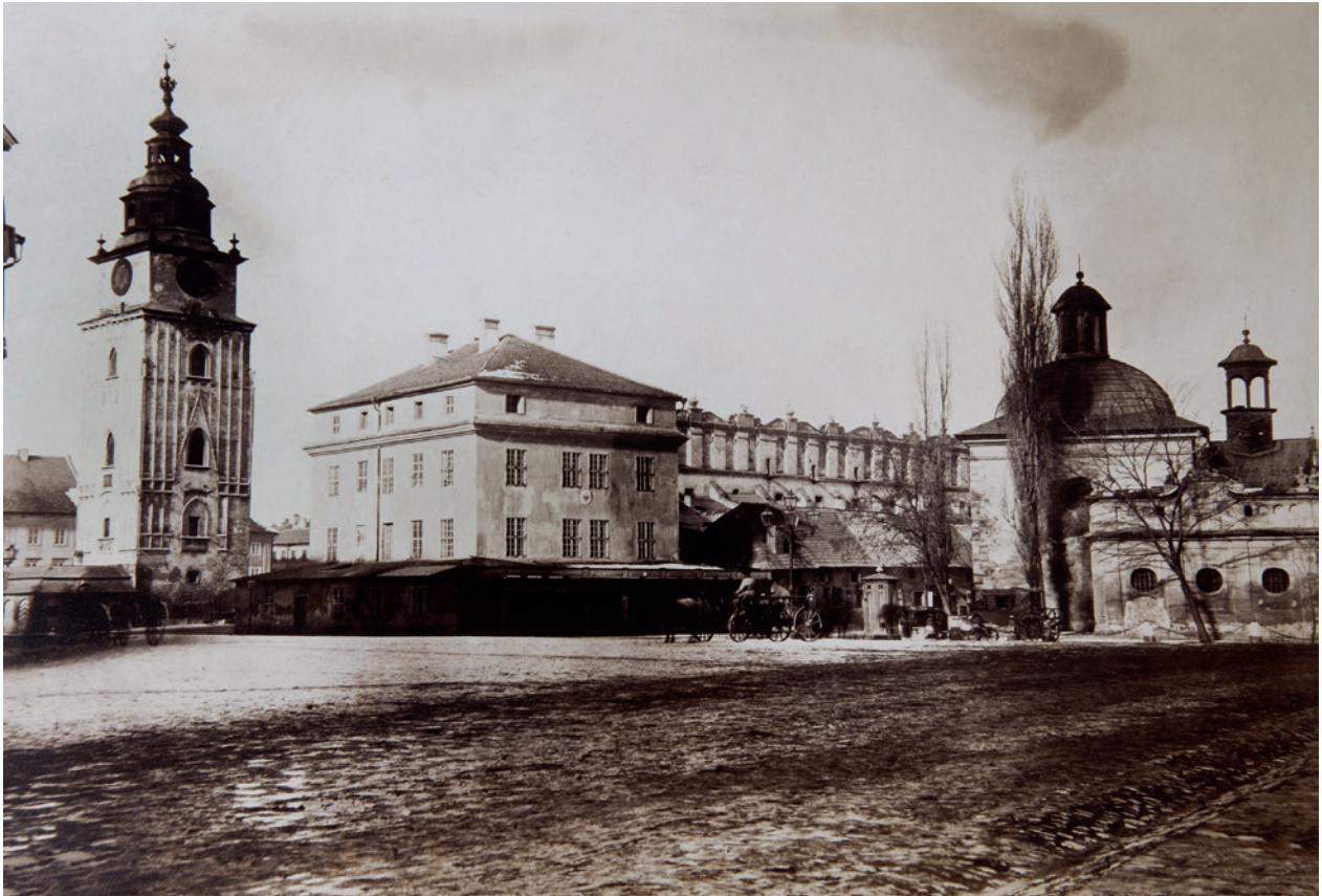
Południowo-wschodnia część Rynku, pośrodku budynek dawnej Wielkiej Wagi; fot. K. Beyer, 1858 r.; reprodukcja A. Chęć; w zbiorach Muzeum Narodowego w Krakowie, nr inw. MNK-XX-f-1842

schodowej: schody zbudowano na murowanych wysklepkach, a okładzinę stopni wykonano z drewna.