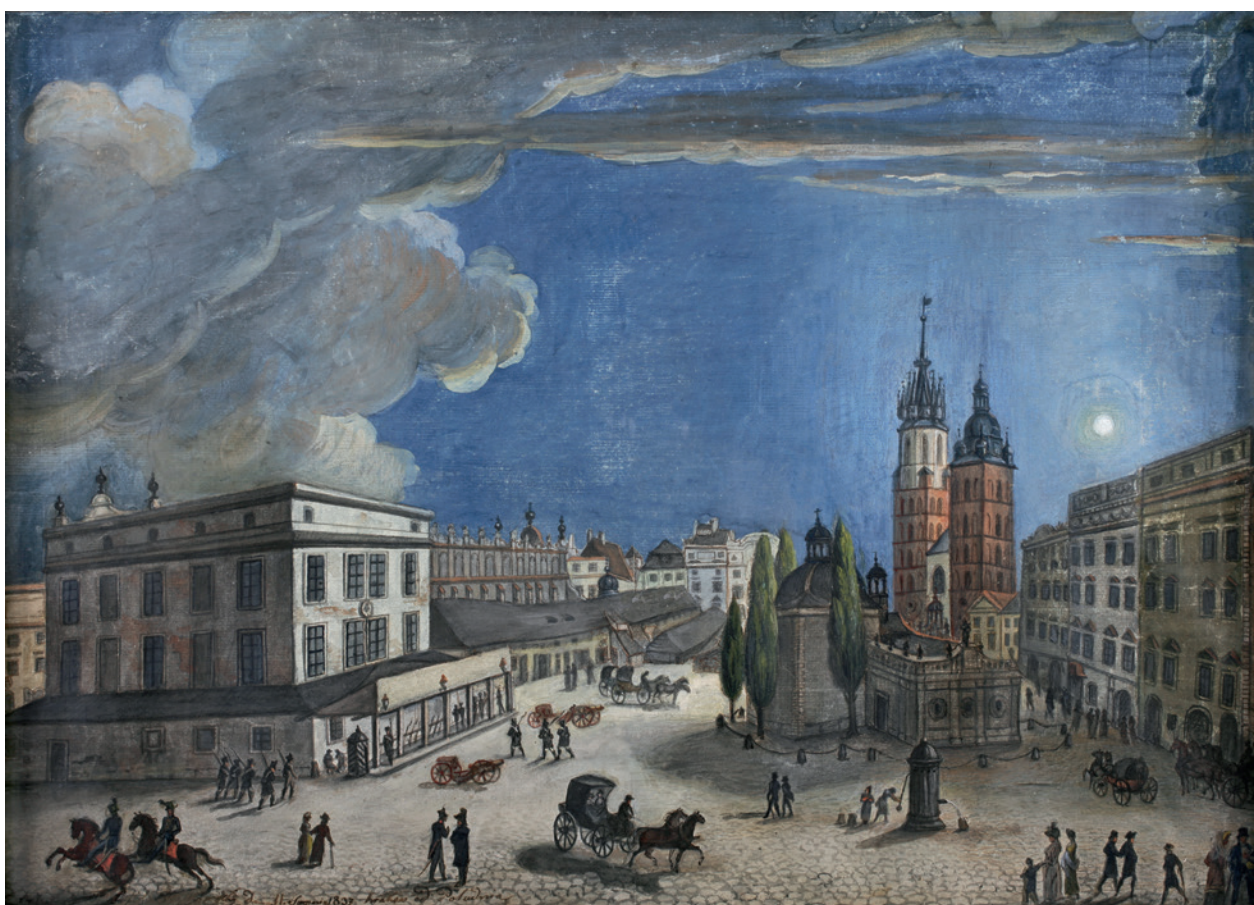
Wschodnia połowa Rynku Głównego od południa, z lewej Dom Komisji (dawna Wielka Waga) – siedziba odwachu milicji Wolnego Miasta Krakowa, T. Piątkowski, gwasz i akwarela, 1837 r.; fot. T. Kalarus; w zbiorach Muzeum Historycznego Miasta Krakowa, nr inw. MHK 786/VIII