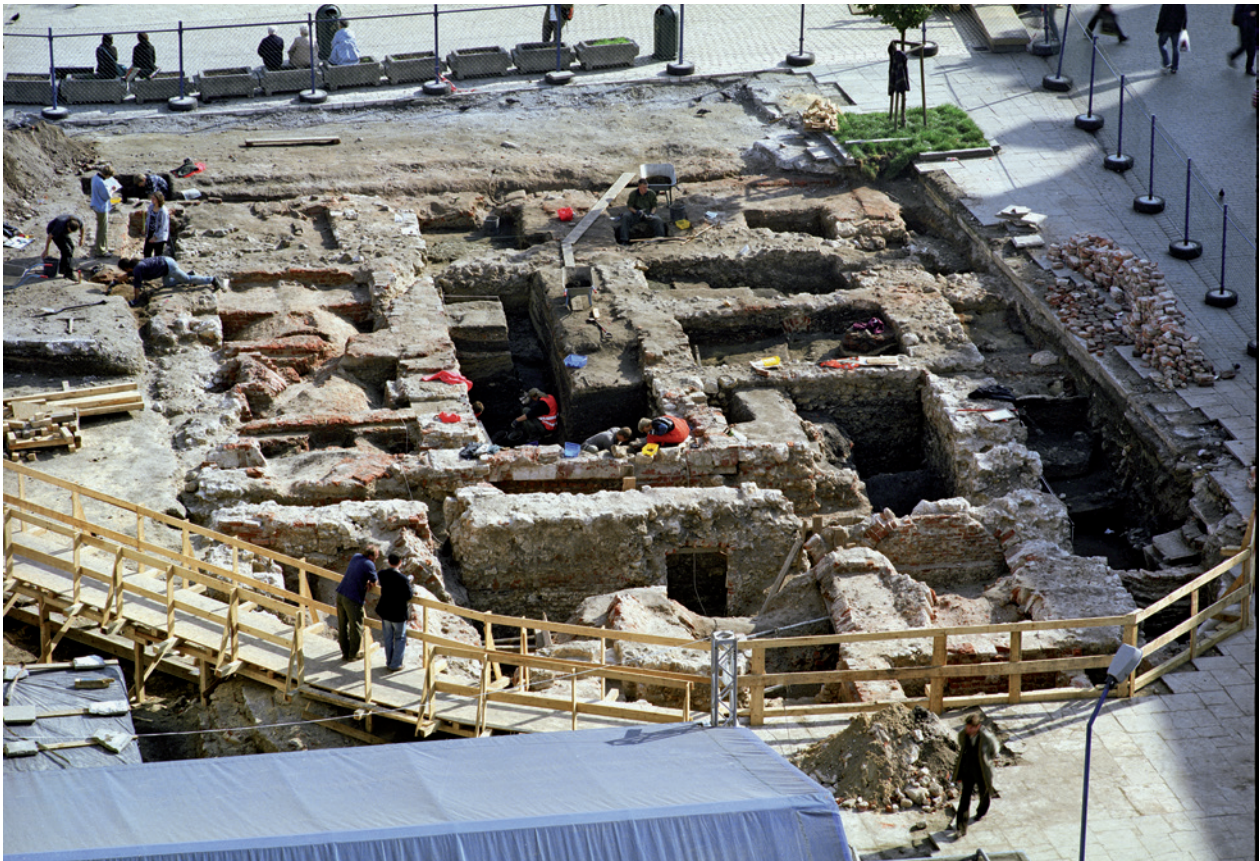
Mury Wielkiej Wagi odkryte w 2005 r., widok w kierunku wschodnim