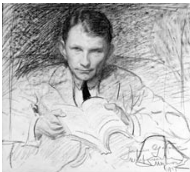
Portret Józefa Gatuszki, rys. L. Wyczółkowski, 1925, kreda, papier

Bardzo dobrze układała się współpraca ze szkołami i ośrodkami zajęć pozalekcyjnych. Dużym zainteresowaniem cieszyły się konkursy wiedzy o Krakowie, które w minionym czteroleciu po raz pierwszy adresowane były nie tylko do licealistów, ale i gimnazjalistów. Prowadzono też konkurs dla młodzieży ze środowisk polonijnych Europy i Stanów Zjednoczonych.