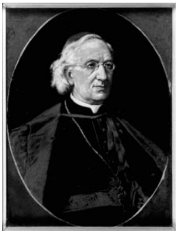
Portret kardynała Albina Dunajewskiego, mal. W. Rossowski, lata 90. XIX w., olej, płótno