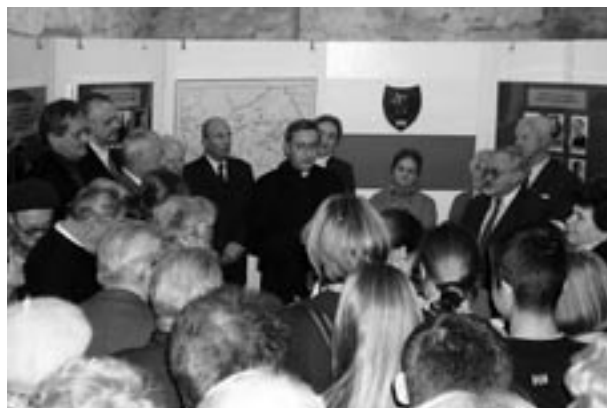
Otwarcie wystawy Chorągiew Krakowska Szarych Szeregów. W 60. rocznicę powstania