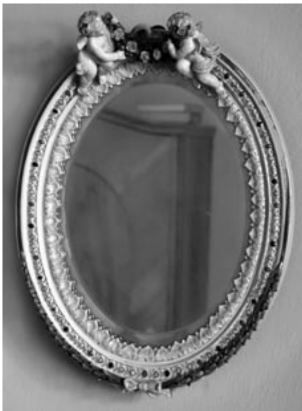
Lustro kryształowe w oprawie porcelanowej, sygn. Plaul, Turyngia, 2 poł. XIX w.