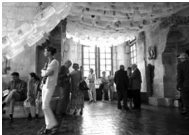
Wieża Ratuszowa – wystawa Bogdan Achimescu – ilustracje – miasto, fot. R. Korzeniowski

Innym kierunkiem pracy, wynikającym z obowiązku udostępniania zbiorów i informowania o nich, były kwerendy prowadzone na zlecenie różnych instytucji, konserwatorów, samodzielnych pracowników nauki, doktorantów, studentów, miłośników Krakowa, dziennikarzy radia itp. Ogółem pracownicy merytoryczni muzeum przeprowadzili kwerendy i odpowiedzieli na 1429 różnorodnych zapytań. Najczęściej