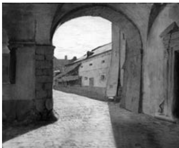
Betlejmka na dziedzińcu Pałacu Krzysztofory, rys. F. Turek