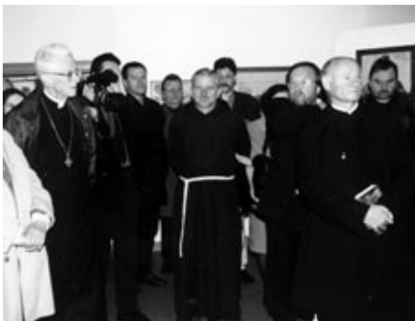
Otwarcie wystawy Skarby krakowskich klasztorów – zbiory oo. Franciszkanów, pierwszy z lewej kard. F. Macharski