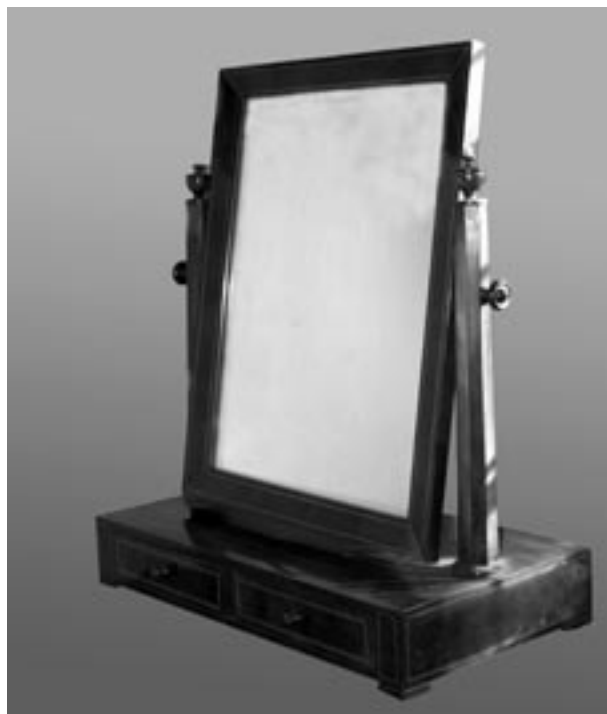
Toaletka biedermeier, 1820–1830

Jak wskazano, wśród zakupów tego czterolecia przeważały obiekty wyposażenia mieszkań. Tutaj za najcenniejsze nabytki uznajemy: żardinierę datowaną na około 1810–1815 rok (nr inw. 5320/III), „pralkę” (1894, metal, drewno, nr inw. 5318/III), dywan kaukaski (XIX wiek, wełna, nr inw. 5503/III), modlitewnik turkmeński (XIX wiek, nr inw. 5504/III),