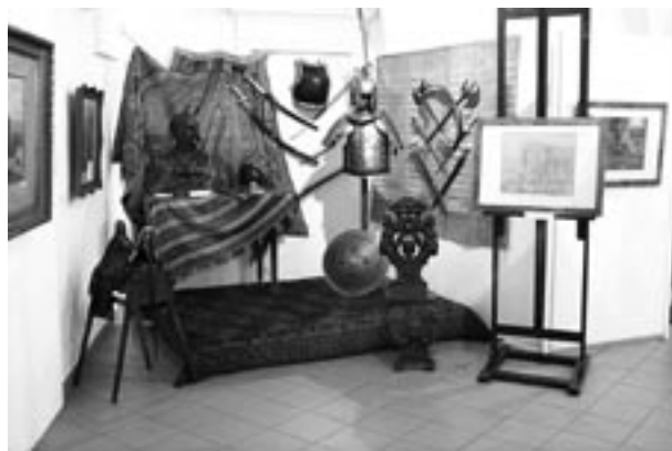
Fragment wystawy Juliusz Kossak 1824–1899. W stulecie śmierci, rekwizyty z pracowni artysty, fot. J. Korzeniowski