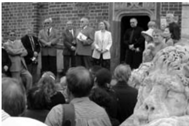
Wieża Ratuszowa – otwarcie wystawy prac A. Wsiolkowskiego Obecność

wisko bardziej zakodowane w sferze ducha czy praktyki administracyjnej? Nad tymi scenariuszami trudzili się: Anna Jodłowiec, Danuta Radwan i Eugeniusz Duda.