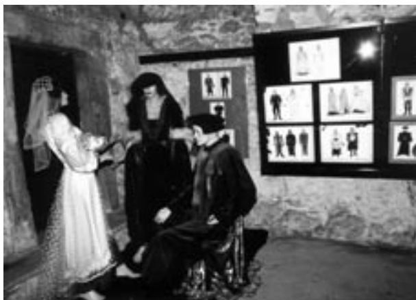
Wystawa Elżbieta Krywsza-Fedorowicz – scenografia, fragment