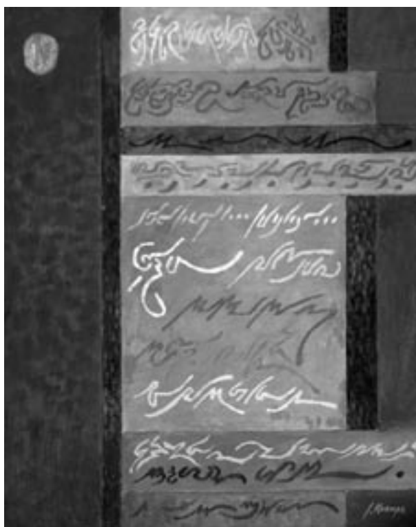
Obraz Tekst słoneczny, mal. J. Kraupe-Świdarska, 1992, olej, płótno