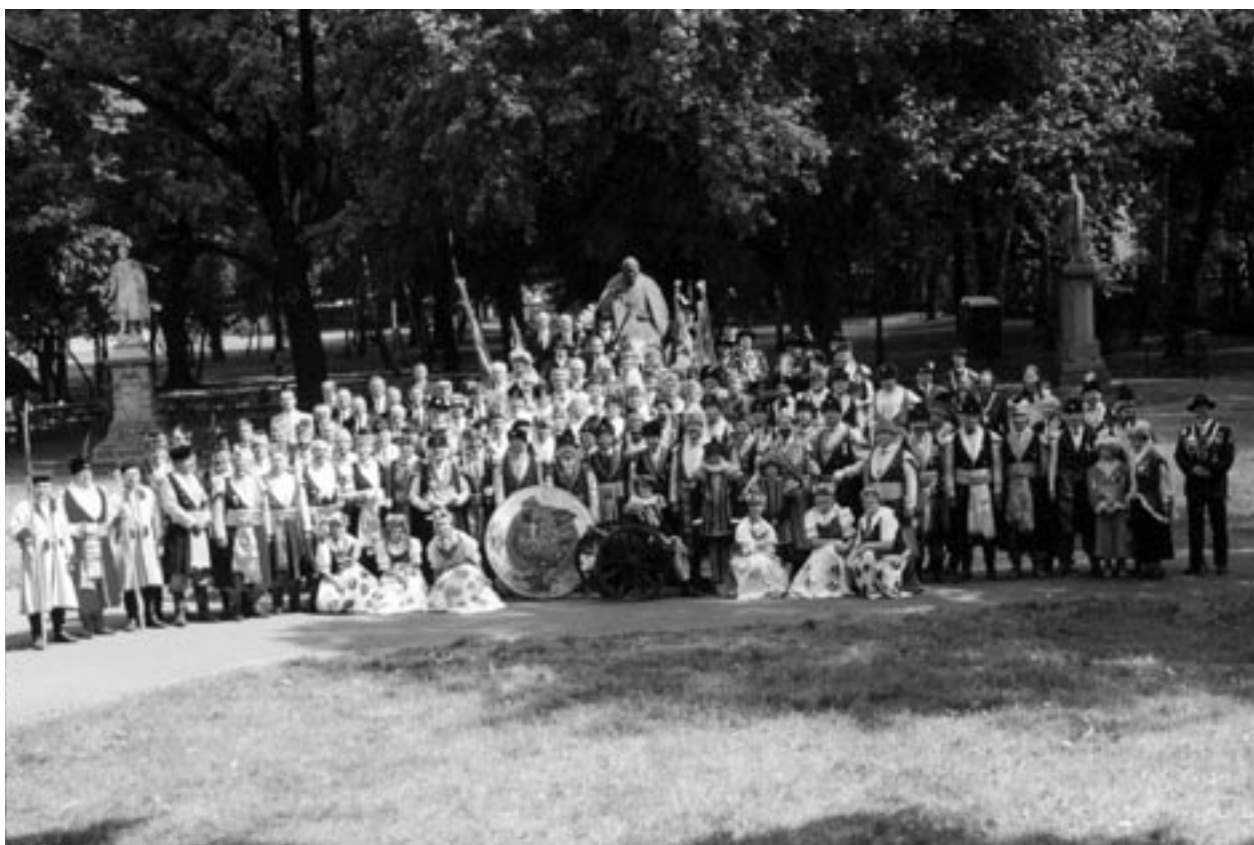
Bracia kurtkowi przy pomniku Jana Pawła II w Ogrodzie Strzeleckim w Krakowie