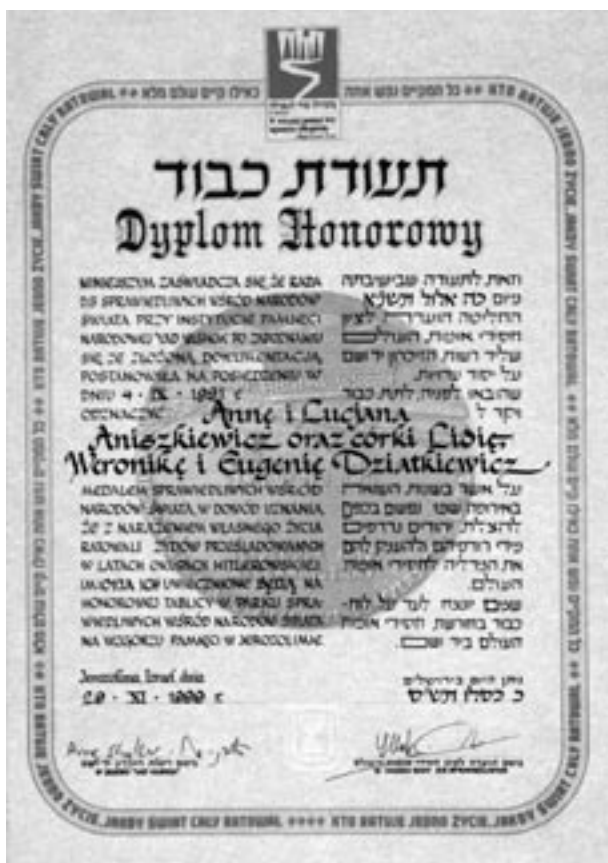
Dyplom medalu Sprawiedliwy wśród Narodów Świata

tek rodzinnych lub osobistych pomnożyli zasób narodowych dóbr kultury.