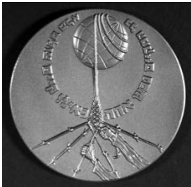
Medal Sprawiedliwy wśród Narodów Świata