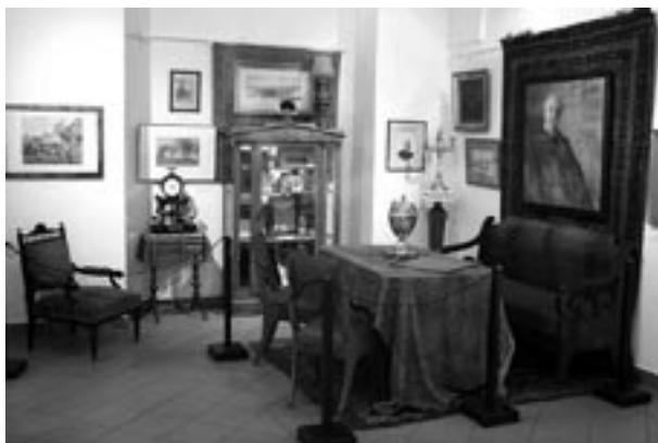
Fragment wystawy Juliusz Kossak 1824–1899. W stulecie śmierci