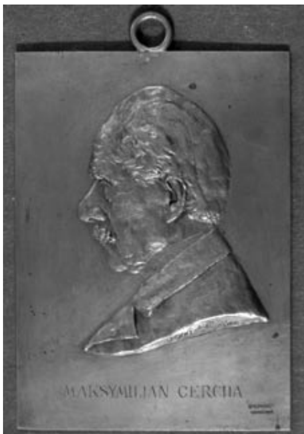
Popiersie Maksymiliana Cerchy, sygn. S. Cercha, brąz, odlew w Zakładach Braci Łopieńskich, Warszawa