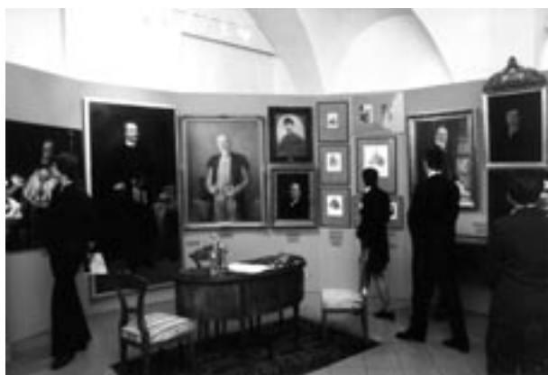
Otwarcie wystawy: Znak wiecznotrwały – Kopiec Tadeusza Kościuszki