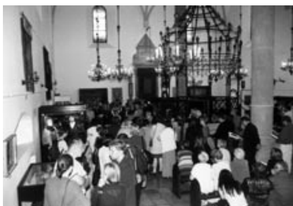
Stara Synagoga – otwarcie wystawy Potęga obyczaju

Andrzej Pollo, wystawa retrospektywna 9 V–30 VI komisarz wystawy: Leszek Sybila