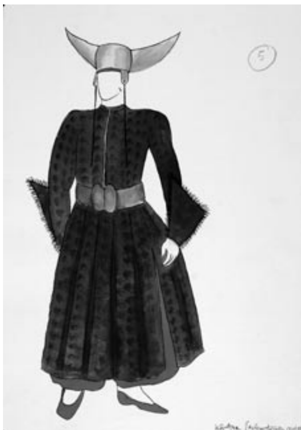
Projekt kostiumu dla orszaku Lajkonika – włóczkowie, rys. K. Zachwatowicz, 1999, fot. J. Korzeniowski