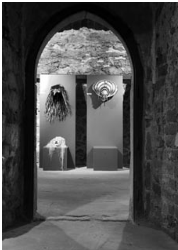
Galeria Teatralna – wystawa Manos Pontikakis – maska grecka

We wrześniu otwarto kolejną ekspozycję z cyklu Skarby krakowskich klasztorów . Poświęcona krakowskim zbiorom klasztornym była już 11 z kolei wystawą, stwarzającą szerokiej publiczności możliwość poznania na co dzień niedostępnych bezcennych skarbów polskiej kultury przez stulecia gromadzonych przez zgromadzenia zakonne. Tym razem udostępnialiśmy obiekty, stanowiące własność zakonu Jezuitów. Towarzystwo Jezusowe (Societas Jesu) ma długą i dramatyczną