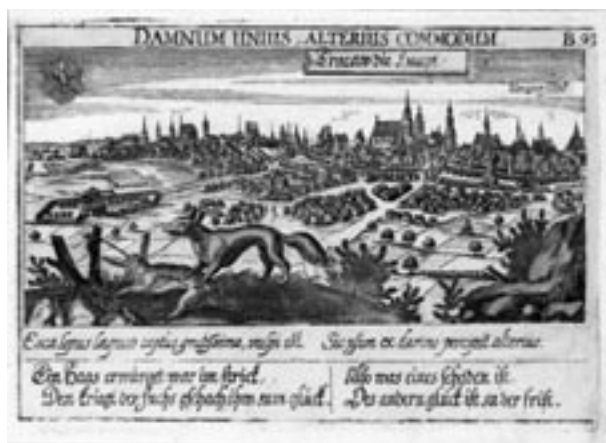
Widok Krakowa od północnego zachodu, miedzioryt, sygn. J.E. Loffler, XVII w.

Znaczący udział we wzroście naszego zasobu miały dary – te w większości pochodziły od artystów lub ich rodzin. Na szczególną uwagę zasługują obiekty darowane lub przekazane w depozyt przez spadkobierców Haliny Rudzkiej-Cybisowej.