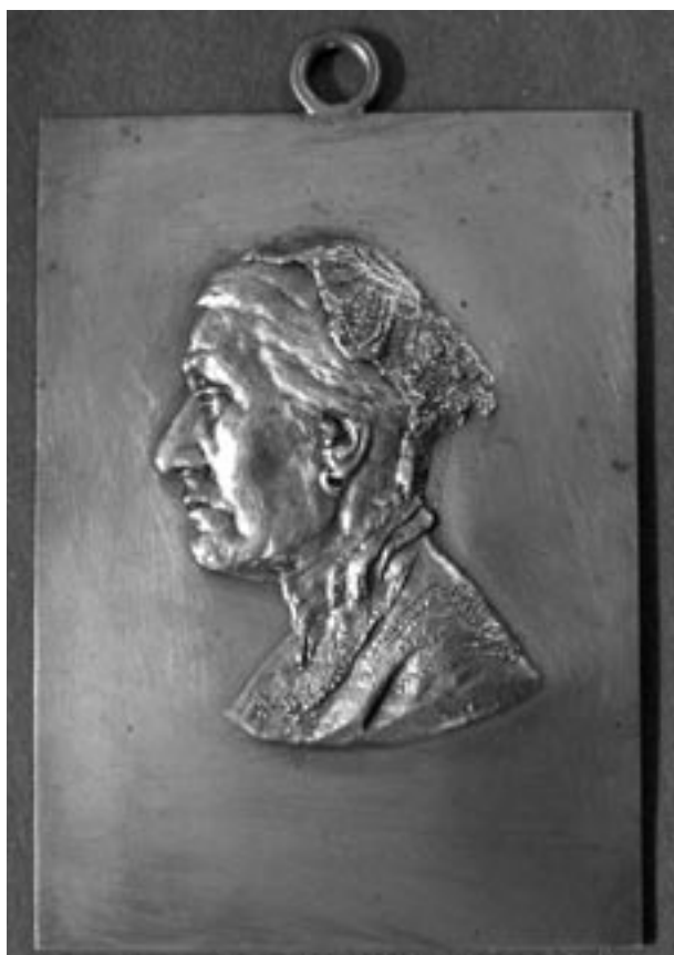
Popiersie Leokadii Cerchy, sygn. S. Cercha, brąz, odlew w Zakładach Braci Łopieńskich, Warszawa