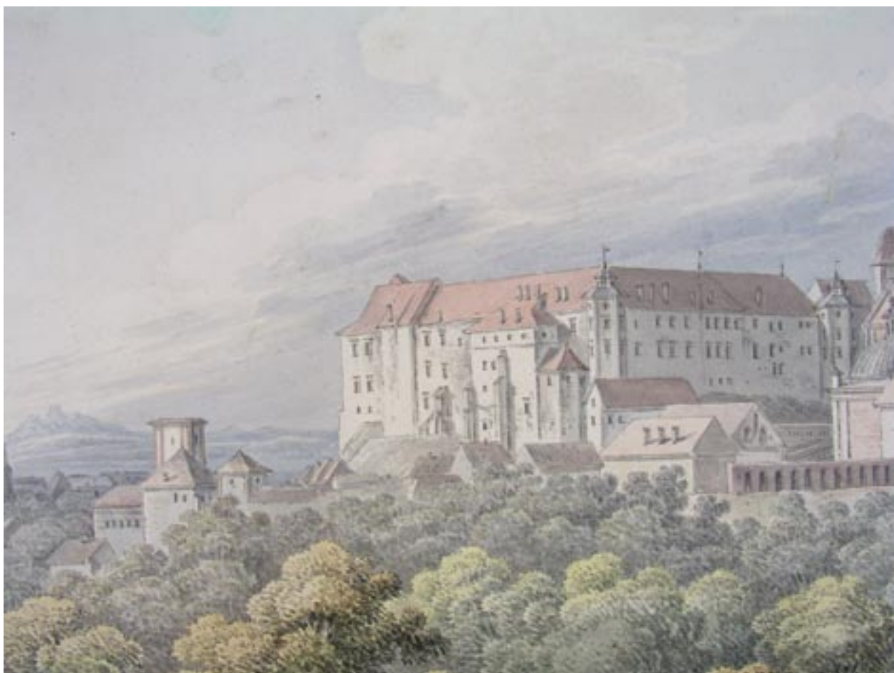
Widok Wawelu od północnego wschodu, Z. Vogel, ok. 1800, akwarela, fragment, wł. i fot. Biblioteka Uniwersytecka w Warszawie

rozbudowany wokół głównej osi kompozycyjnej, wyprowadzonej ze środka elewacji domu, z licznymi osiami poprzecznymi. Tworzono w ten sposób kolejno zakładane wnętrza ogrodowe, często o układzie tarasowym. Ogrody te posiadały podział wewnętrzny, przy zastosowaniu żywopłotów i pergol, na odrębne, regularnie ukształtowane kwatery. Część z nich to klasyczny hortus conclusus przy ścianie pałacu, ale w przeciwieństwie do religijnej symboliki średnio-