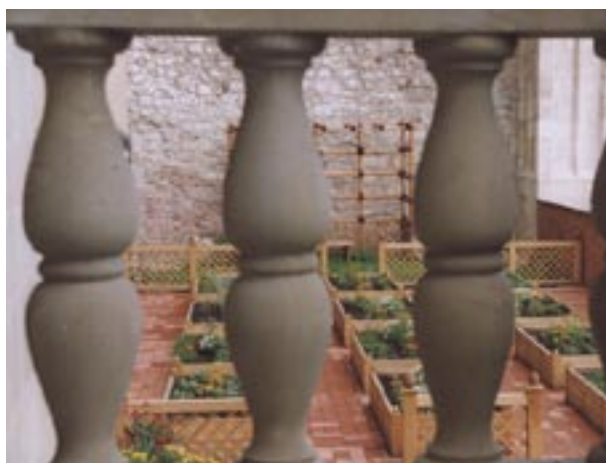
Zrekonstruowany hortus conclusus (widok z ganku)

Przedstawione wyżej prace konstrukcyjne in ortulo superiori podlegały na pewno nadzorowi doświadczanego ogrodnika, być może wymienionego w rachunkach w 1541 roku Laurentiusa hortulano 10 . Natomiast nad rozplanowaniem ozdobnego ogrodu czuwała zapewne królowa Bona (panowała w latach 1518–1557), przeszczepiając włoskie kompozycje na grunt krakowski. Ogród królowej wzmiankowany jest w kontekście prac prowadzonych w ogrodzie Zygmunta Starego (1467–1548) w 1542 roku, sytuowanego w dolnej partii wzgórza, przy łaźni królewskiej 11 .