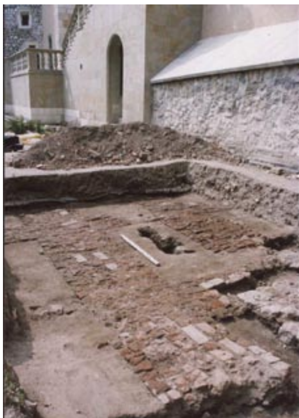
Odśloniety fragment ceglano-ziemnej kompozycji renesansowej, fot. J. Firlet