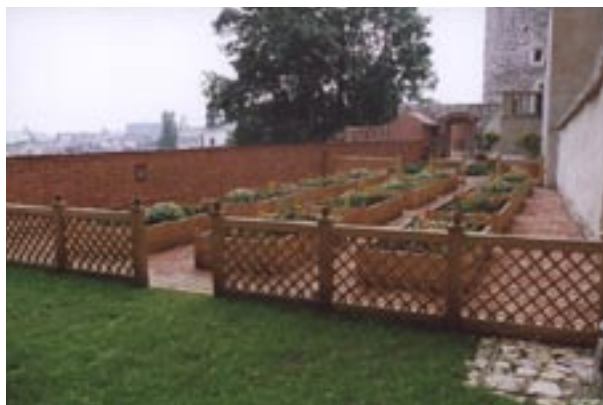
Widok ogrodu od północy

Dwa wejścia z kamiennymi stopniami wprowadzają do wydłużonego wnętrza, wyłożonego czerwoną cegłą, z kilkoma kwadratowymi rabatami na początku. Dopiero w głębi ogrodu pojawia się kratownica chodników, otaczających prostokątne rabaty ziemne ujęte w drewniane skrzynie. Ten szachownicowy układ oddziela od wieży Duńskiej trawiasta „łąka”, z dostawionym do muru efektownym tre-