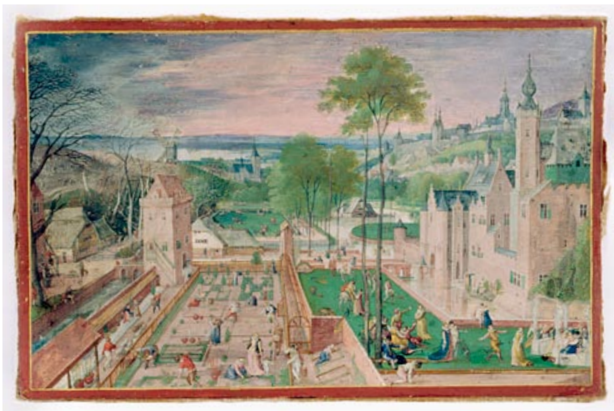
Wiosna w ogrodzie zamkowym, H. Bol, 1584, gwasz, wł. Fundacji XX Czartoryskich przy Muzeum Narodowym w Krakowie, fot. M. Studnicki.

Odkryta na górnym tarasie wawelskim kompozycja stanowi niewątpliwie część ogrodów królewskich, założonych w 1541 roku przed wschodnim skrzydłem pałacu. Całość powiązanego osiowo założenia reprezentuje nawiązujący do tradycji włoskiej układ tarasowy, sytuowany na stoku wzgórza, z widokowym otwarciem na krajobraz miejski. Taras górny, o charakterze jeszcze średniowiecznego wirydarza, zdobi parter z geometrycznymi kwaterami, ustawionymi pasmami wzdłuż elewacji rezydencji 31 .