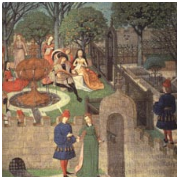
Miniatura z Powieści o róży, wyd. ok. 1485 (wg P. Hobhouse, Historia ogrodów... , ryc. na s. 101)

Opisana sytuacja naprowadza na domysł, iż na górnym tarasie należy rekonstruować, w części południowej, podobny układ prostokątnych rabat, jak w partii północnej. Trudno natomiast rozstrzygnąć, czy drewniane obudowy grzęd podwyższonych (skrzynie z rachunków królewskich) wykorzystano w obrębie całego tarasu, czy tylko jego części. Jeszcze trudniej ustalić, jakie