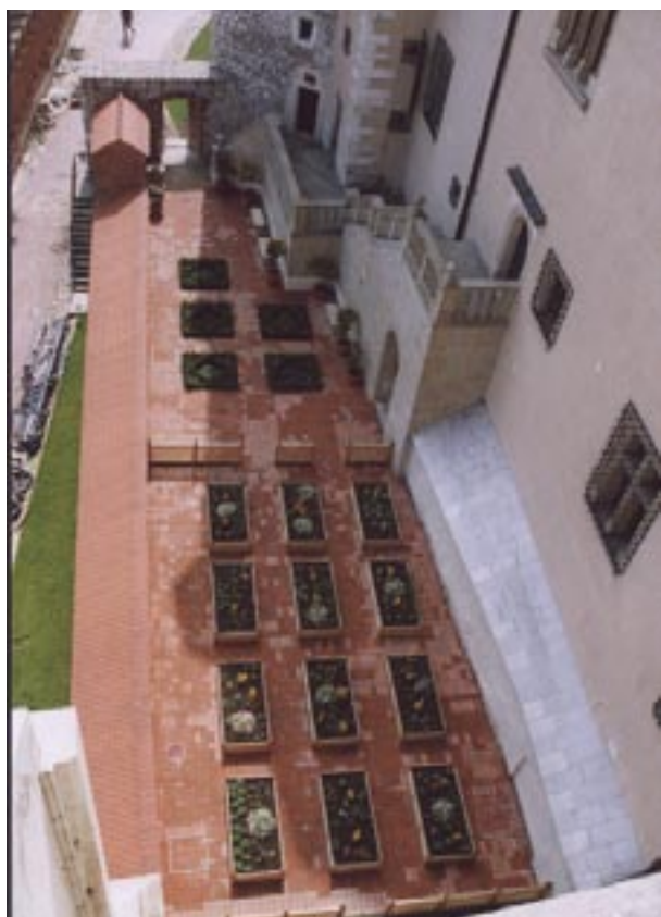
Rekompozycja na górnym tarasie (widok z wieży Duńskiej)

Tak więc uzyskano poważny zasób źródeł archeologicznych dotyczących lokalizacji ogrodu na górnym tarasie. Natomiast studiami nad zespołem ogrodów renesansowych zajęła się Jadwiga Gwizdałówna, wykorzystując zachowane źródła historyczne 8 . Według ustaleń autorki w oparciu o rachunki budowy zamku, hortus sub turri Jordanka powstał w 1541 roku, przy elewacji pałacu. Tego samego terenu dotyczy również zapis [...] hortuli ante fontem castris erecti [...], gdyż w tymże roku modernizowano studnię zamkową w piwnicy pod Schodami Poselskimi. Z rachunków królewskich dowiadujemy się, iż właśnie w 1541 roku zaczęły się spore wydatki na budowę ogrodu sub Jordanka . Przywieziono wiele wozów czarnoziemiu ( terra nigra ) z Czarnej Wsi, następnie wykonywano prace ad structuram ogrodu przeznaczonego dla roślin (ziół?). Przy konstruowaniu podłoża zatrudnieni byli murarze, którzy ogród ceglami posadzali (jeszcze w 1543 roku notowano zakup 7000 sztuk cegieł do ogrodów). Dalsze prace polegały na wykonaniu przez cieśli drewnianych skrzynek z przeznaczeniem dla ogrodu przy Jordance. Rachunki dokumentowały także budowanie drewnianej altany ( tentorium ) oraz ustawianie czterech ławek 9 .