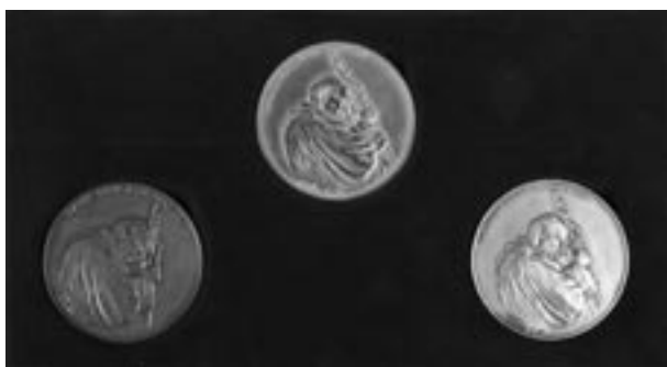
Komplet medali pamiątkowych przedstawiających Jana Pawła II, wybitych z okazji 24. rocznicy Jego pontyfikatu i Jubileuszowego Roku Świętego