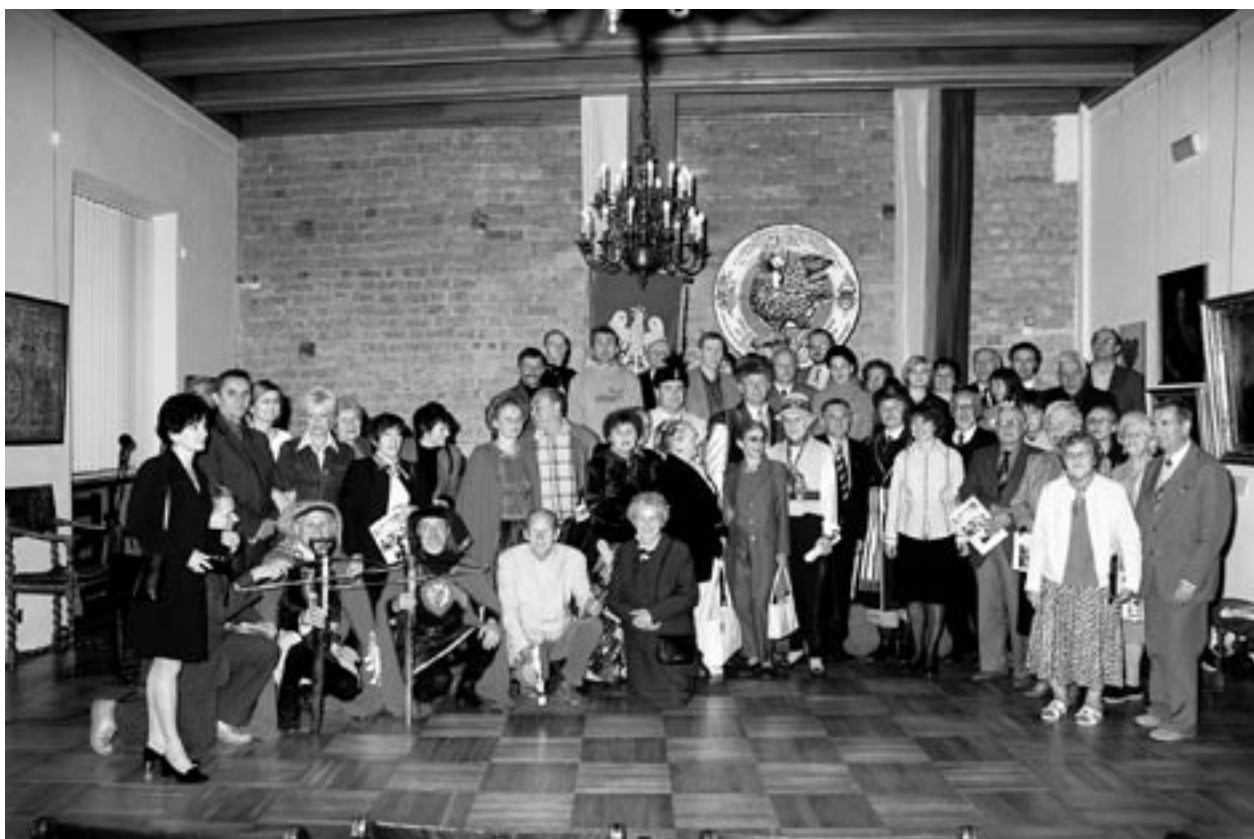
Wernisaż wystawy Krakowskie Bractwo Kurkowe żywa tradycja. Muzeum Mazowieckie w Płocku, 26 IX 2003