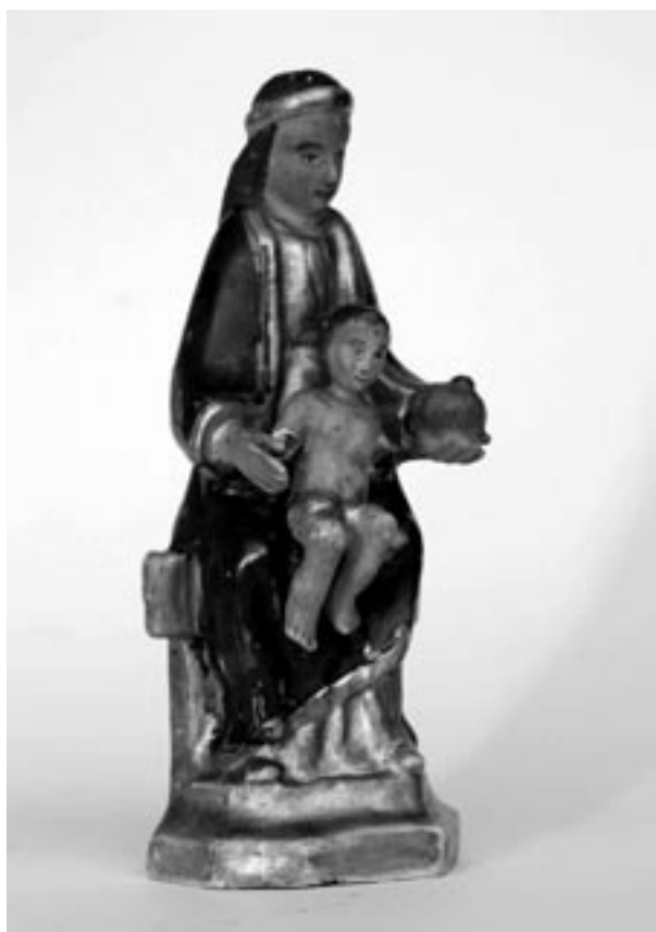
Madonna z dzieciątkiem, 1 połowa XVII w., wg według schematu ikonograficznego z XIV w.

dział za najcenniejsze uznajemy m.in. obrazy Franciszka Kostrzewskiego Grzybobranie (olej, płótno), Leona Wyczółkowskiego Krucyfiks wawelski (pastel), Józefa Pankiewicza Pejzaż śródziemnomorski (olej, płótno), Olgi Boznańskiej Portret młodej kobiety (olej, płótno), Pejzaż holenderski (szkoła holenderska, olej, płótno). Statystycznie przyrost liczby muzealiów przedstawiano w tabeli 1.