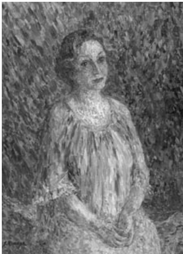
J. Kraupe-Świdorska, Portret Danuty Leszczyńskiej-Kluz, 2003, olej, płótno