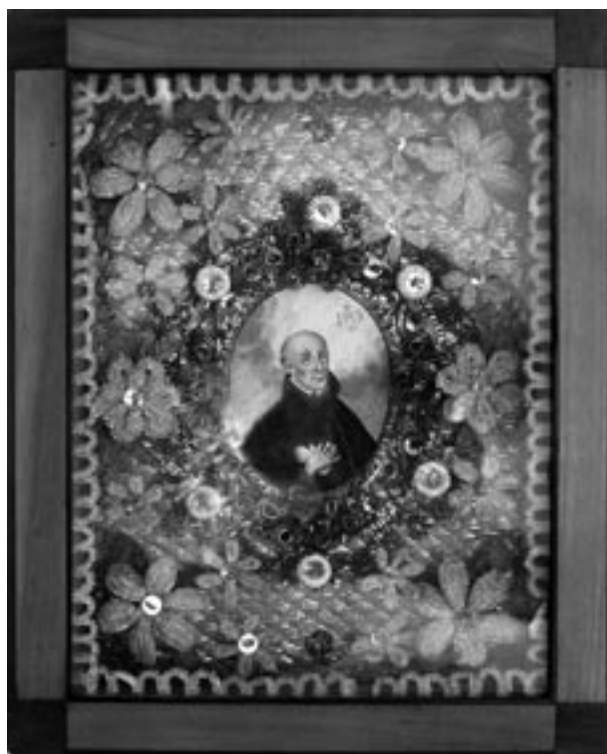
Ołtarzyk z medalionem św. Ignacego Loyoli, ok. 1850, akwarela, haft, srebrna nić