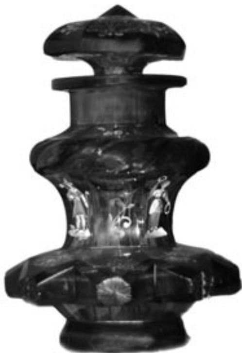
Karafka, szkło niebieskie, ręcznie malowane, biedermeier