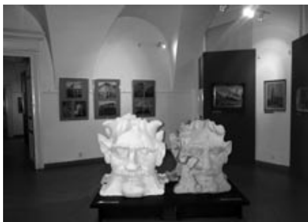
Fragment wystawy Kraków w odnowie. Konserwacja i restauracja dziedzictwa architektoniczno-urbanistycznego w latach 1815–2003