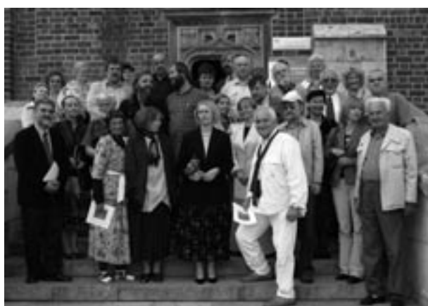
Pożegnanie z Wieżą – uczestnicy cyklu ekspozycji Z pracowni naszych artystów z kuratorem wystaw M. Zientarą

nione budowle miasta, ludzi lub wydarzenia. Obok tego pojawiały się obrazy, rysunki, numizmaty, medale, odznaki, wyroby rzemiosła i przedmioty codziennego użytku, wśród tych ostatnich były niespotykane już dzisiaj lub stanowiące rzadkość. Prowadzono też reinwentaryzację zbiorów uzupełniając dotychczasowe zapisy o nowe ustalenia – zweryfikowano wiedzę o 1517 eksponatach.