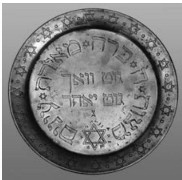
Talerz szabasowy, lata 30. XX w.