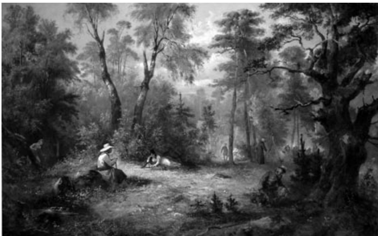
F. Kostrzewski, Grzybobranie , 1883, olej, płótno

zachowania obiektów. Duży ruch muzealiów i wielość wystaw sprawiły, że w pierwszym rządzie podejmowane były zabiegi przy eksponatach wybranych na wystawy stałe i zmienne.