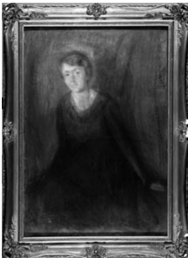
A. Markowicz, Portret Róży Markiewiczowej, 1917, pastel