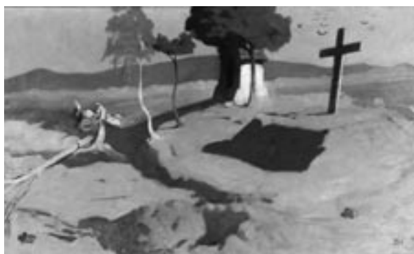
W. Tetmajer, Krzyż na pustkowiu , 1916, olej, płótno, fot. R. Korzeniowski

Dowodem zaufania do muzeum były liczne depozyty od osób prywatnych i instytucji. Wśród zdeponowanych