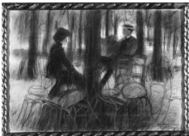
A. Markowicz, Scena paryska, ok. 1901, rysunek, ołówek, kredka, fot. R. Korzeniowski

W ciągu omawianego okresu zbiory muzealne powiększyły się o 3707 obiektów i osiągnęły liczbę 96 469 eksponatów. Obok muzealiów poszerzono zbiory biblioteki i archiwum naukowego. Nabywano głównie wydawnictwa omawiające dzieje i kulturę naszego miasta oraz publikacje z zakresu historii, historii sztuki, dziejów teatru, judaistyki, drukarstwa, zabytkoznawstwa, antropologii kultury. Gromadzono też druki ulotne: afisze, zaproszenia, programy, ulotki wyborcze itp. Wszystkie nowo nabyte obiekty zostały