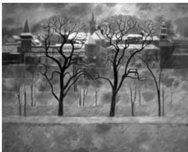
P. Taranczewski, Planty, 2003, olej, płótno, fot. R. Korzeniowski