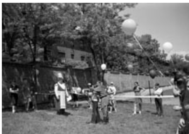
Finale konkursu o tytuł Małego Króla kurkowego – strzelanie z łuku prowadzi olimpijczyk Krzysztof Włosik, 31 V 2003

wi poświęciliśmy wystawę: Zagłada Żydów krakowskich. W 60. rocznicę likwidacji getta krakowskiego .