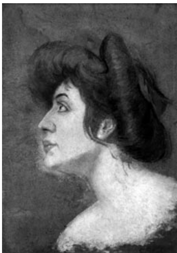
S. Janowski, Portret Gabrieli Zapolskiej, 1904, olej, płótno