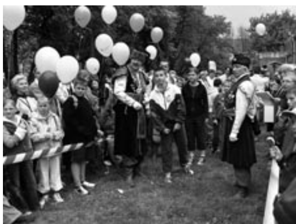
Finał Konkursu o tytuł Małego Króla Kurkowego – rzut lotkami do kura z balonów, fot. M. Niechaj

które odbyły się w dniu święta miasta 5 czerwca. W latach 2003–2004 przeprowadzono następujące konkursy: Nie od razu Kraków odnowiono, czyli dzieje odnowy zabytków Krakowa (dla młodzieży licealnej, finał 24 IV 2003); Kraków 1795–1918 (dla gimnazjalistów, finał 28 IV 2003); Kraków metropolią czy prowincją Europy? (licealiści, finał 21 V 2004); Kraków romański i gotycki (gimnazjaliści, finał 14 V 2004); Kraków – Wieliczka miasto światowego dziedzictwa kultury – nowy konkurs ideowo nawiązujący do wystawy Kraków w odnowie z 2003 roku (licealiści, finał 24 V 2004); Kraków renesansu i baroku (gimnazjaliści) oraz Kraków maceznik czy Polski Piemont (licealiści).