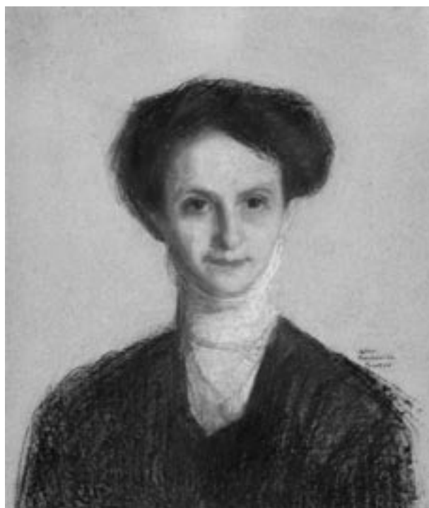
A. Markowicz, Portret żony artysty w czarnej sukni, po roku 1912, pastel, fot. R. Korzeniowski

W ciągu omawianego okresu zbiory muzealne powiększyły się o 3707 obiektów i osiągnęły liczbę 96 469 eksponatów. Obok muzealiów poszerzono zbiory biblioteki i archiwum naukowego. Nabywano głównie wydawnictwa omawiające dzieje i kulturę naszego miasta oraz publikacje z zakresu historii, historii sztuki, dziejów teatru, judaistyki, drukarstwa, zabytkoznawstwa, antropologii kultury. Gromadzono też druki ulotne: afisze, zaproszenia, programy, ulotki wyborcze itp. Wszystkie nowo nabyte obiekty zostały