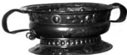
Wanienka do chłodzenia wina, XVII w., mosiądz