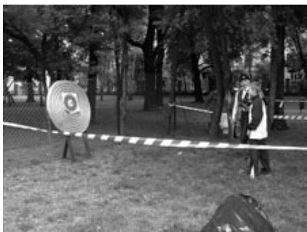
Finał Konkursu o tytuł Małego Króla Kurkowego – rzut lotkami do tarczy