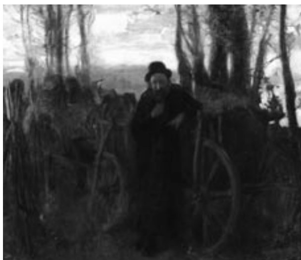
W. Weiss, Pokusa – scena z powstania styczniowego , 1894, olej, płótno, sygnowany