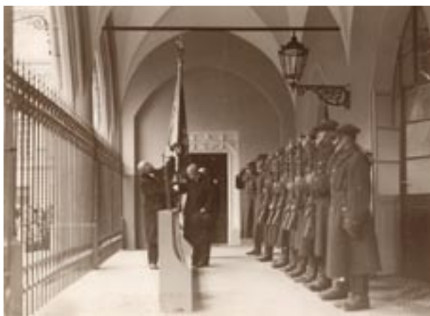
Przekazanie sztandaru „Gwiazdy” podczas zmiany warty w rocznicę oswobodzenia Krakowa w 1932 r., Fs 9711/IX