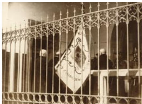
Przekazanie sztandaru „Gwiazdy” podczas zmiany warty w rocznicę oswobodzenia Krakowa w 1932 r.