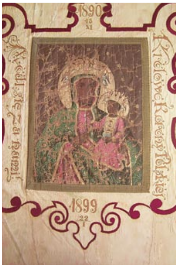
Obraz Matki Boskiej Częstochowskiej na awersie sztandaru „Gwiazdy” – stan przed konserwacją, fot. R. Korzeniowski

nego. Pośrodku białego – dziś już nieco pożółkłego – tła awersu naszyty jest obraz Matki Boskiej Częstochowskiej, która, jako Królowa Korony Polskiej, była patronką stowarzyszenia „Gwiazda”. Obraz, malowany olejno na płótnie w wymiarach 36,5 cm x 48 cm (w świetle), lamowany jest taśmą pasmanteryjną o szerokości 2,5 cm, tkaną w ukośne srebrno-żółte paski. Wokół obrazu wyhaftowano obramienie w formie kartusza z motywem wolut, zwieńczonego krzyżem. Posłużono się tu techniką pełnego płaskiego haftu nicią w kolorze bordowym, obwiedzionego złotym szycem. W polu kartusza widnieją napisy, wyszyte ozdobnie żółtą nicią i złotym szycem – z prawej strony: „Królowo Korony Polskiej”, z lewej: „Módl się za nami!” oraz dwie daty – u góry rok założenia stowarzyszenia: „1890 15/XI”, u dołu data związana z poświęceniem sztandaru i rocznicą wybuchu powstania styczniowego: „1899 22/I” 12 . Jeszcze dwa, wyhaftowane bordową nicią, napisy wypełniają boczne partie tej strony sztandaru, okalając łukami centralną kompozycję – po prawej stronie: „W JEDNOŚCI Z BOGIEM”, po lewej: „W PRACY Z NARODEM!”.