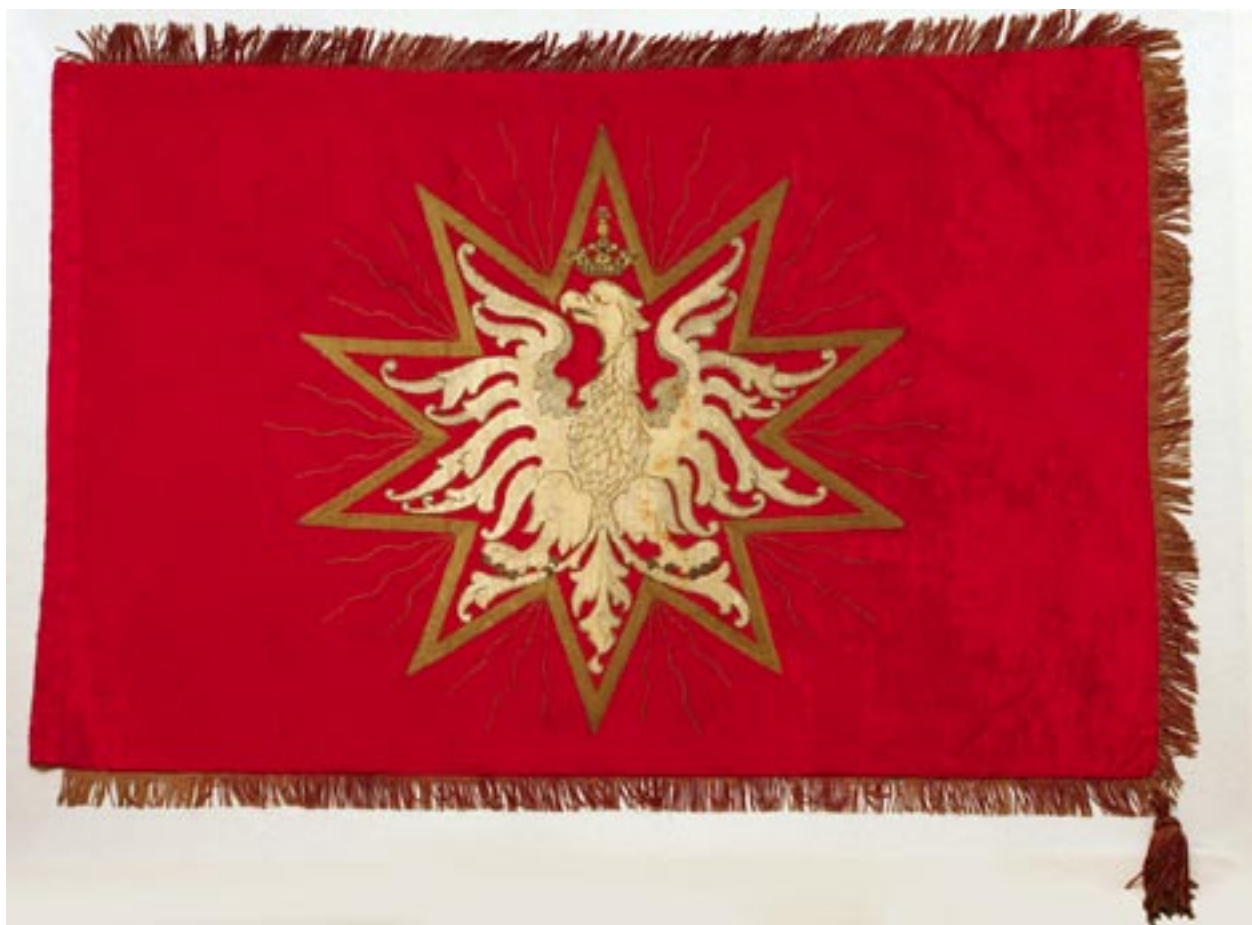
Sztandar „Gwiazdy”, rewers – stan po konserwacji, fot. R. Korzeniowski

Oryginalną taśmę, doszytą do brzegu drzewcowego, zakryto pasem nowej tkaniny – po jej odsłonięciu ukazały się przedziurawienia i wytłoczenia spowodowane przez gwoździe wbite w drzewce.