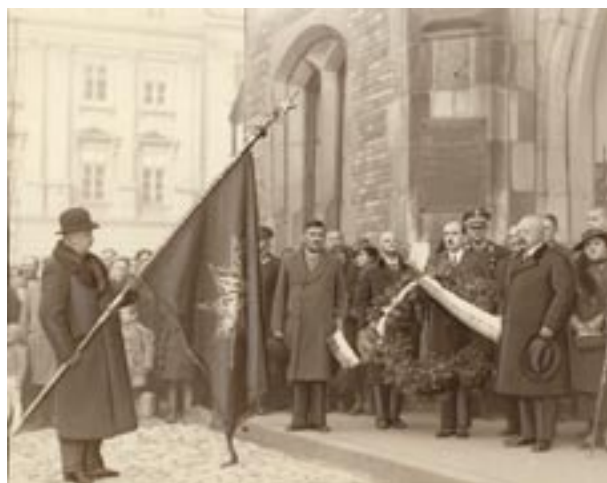
Sztandar „Gwiazdy” przed odwachem podczas obchodów rocznicy oswobodzenia Krakowa w 1935 r., fot. Agencja Fotograficzna „Światowid”, wł. Muzeum Historyczne Miasta Krakowa, Fs 1365/IX