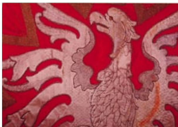
Aplikacja z Orłem Polskim na rewersie – podczas konserwacji