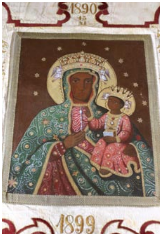
Obraz Matki Boskiej na awersie – stan po konserwacji

słowym w Krakowie. Nie wiadomo, jaki zakres miały te prace, dotyczyły raczej tylko tkanin – prawdopodobnie z tego okresu pochodziły bardzo drobne i ściśle, nieregularne przycerowania, zwłaszcza na awersie. W 1966 roku sztandarem zajęły się Pracownie Konserwacji Zabytków w Warszawie – zabiegi dotyczyły wyłącznie fragmentów tkanin.