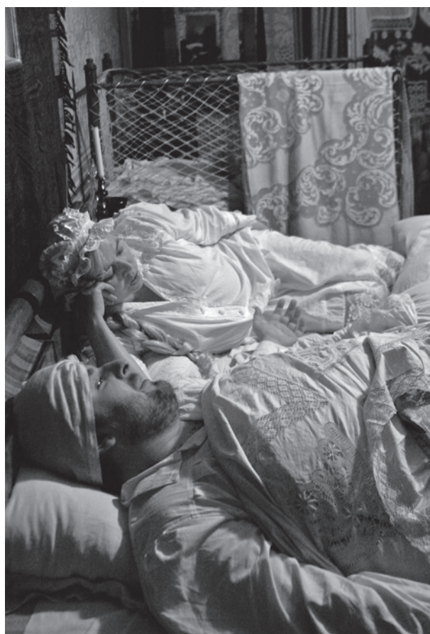
Noc Muzeów, Kamienica Hipolitów, Z wizytą w sypialni Dulskich