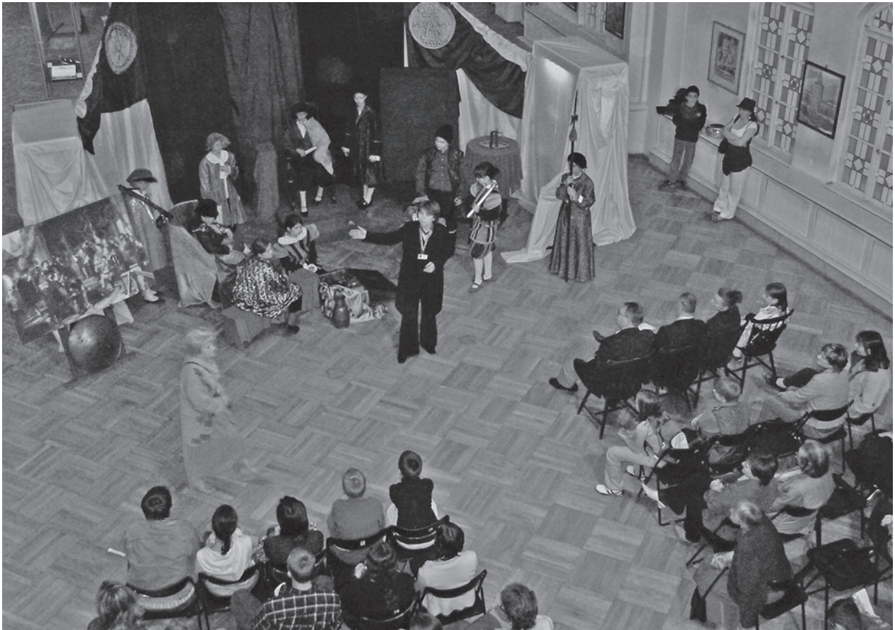
Noc Muzeów, inscenizacja spotkania Króla Zygmunta Augusta z Barbarą Radziwiłłówną, Celestat