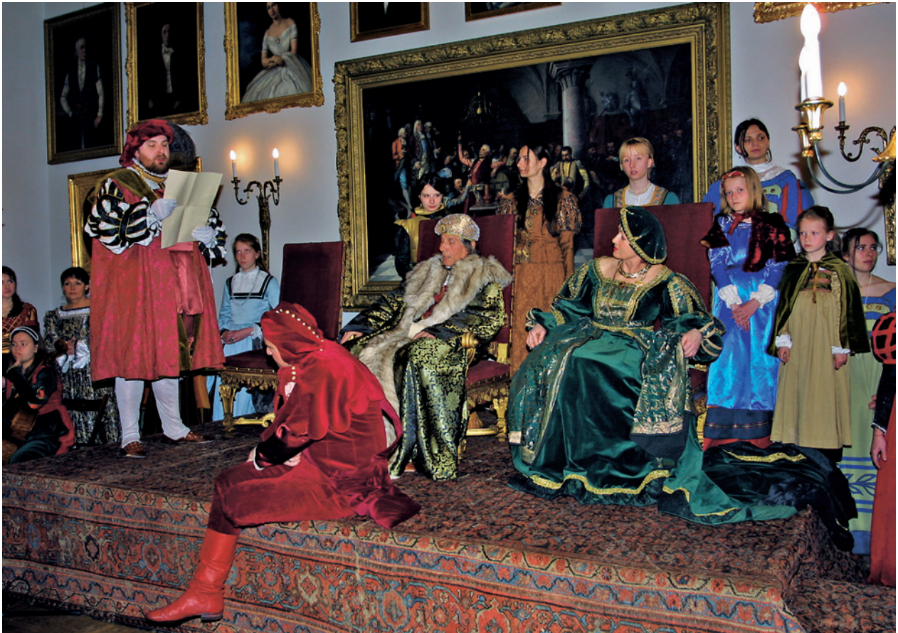
Powitanie palatyna Ottheinricha z królem Zygmuntem Starym i królową Boną, inscenizacja z okazji otwarcia wystawy Podróż przez centrum Europy. Obrazy z podróży palatyna Ottheinricha z lat 1536/1537, sala Baltazara Fontany, Pałac Krzysztofora