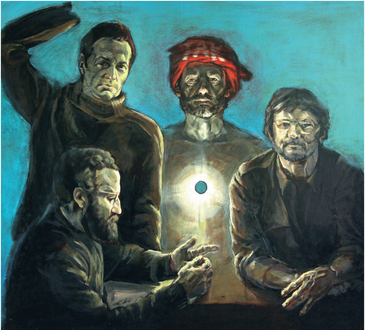
L. Sobocki, 4 x tak, portret zbiorowy członków grupy Wprost, olej, płótno, fot. J. Korzeniowski, nr inw. 5906/III

łóg Singeltona, Uwolnienie Tadeusza Kościuszki przez cara Pawła I w 1796 r. (XIX wiek, tempera, kość słoniowa), wycinanka barwna Mizrach (wyk. Marta Gołąb, 2004, akwabela).