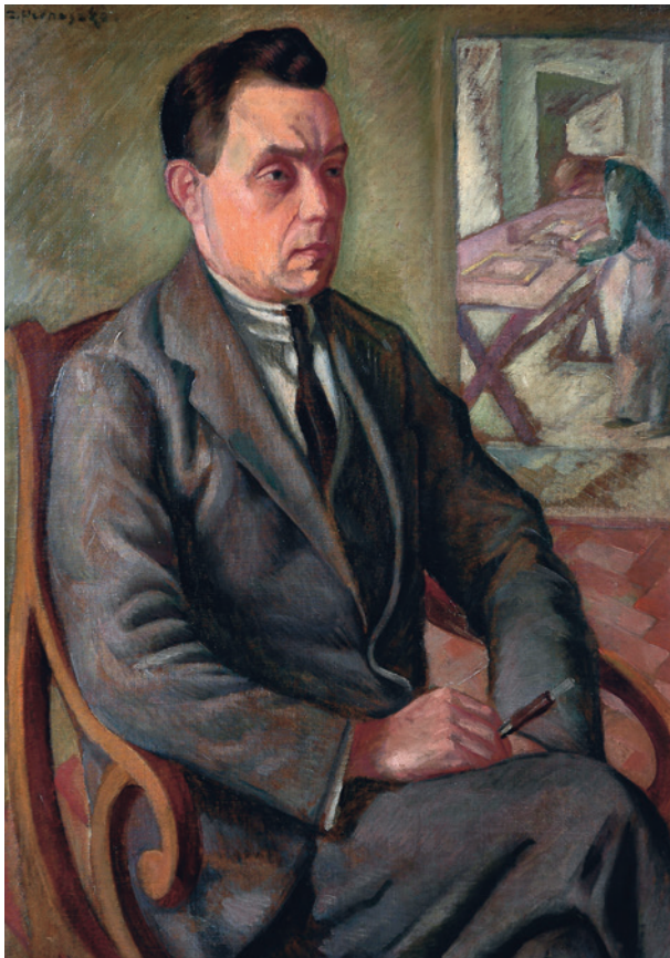
Z. Pronaszko, Portret Roberta Jahody, lata 30. XX w., olej, płótno, nr inw. 5910/III