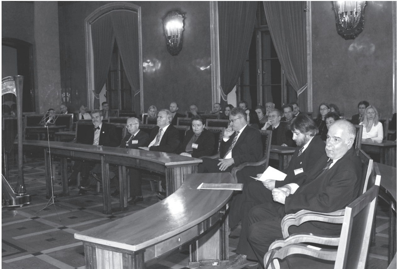
Goście władz miasta Krakowa – uczestnicy Międzynarodowej Sesji Komparatystycznej Europejskie miasta prawa magdeburgskie. Tradycja, dziedzictwo, identyfikacja, sala obrad Rady Miasta Krakowa, Pałac Wielopolskich