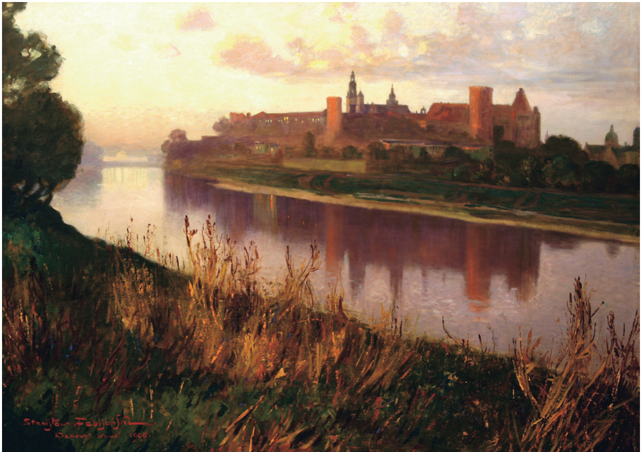
S. Fabijański, Widok Wawelu, olej, płótno, nr inw. 5849/III