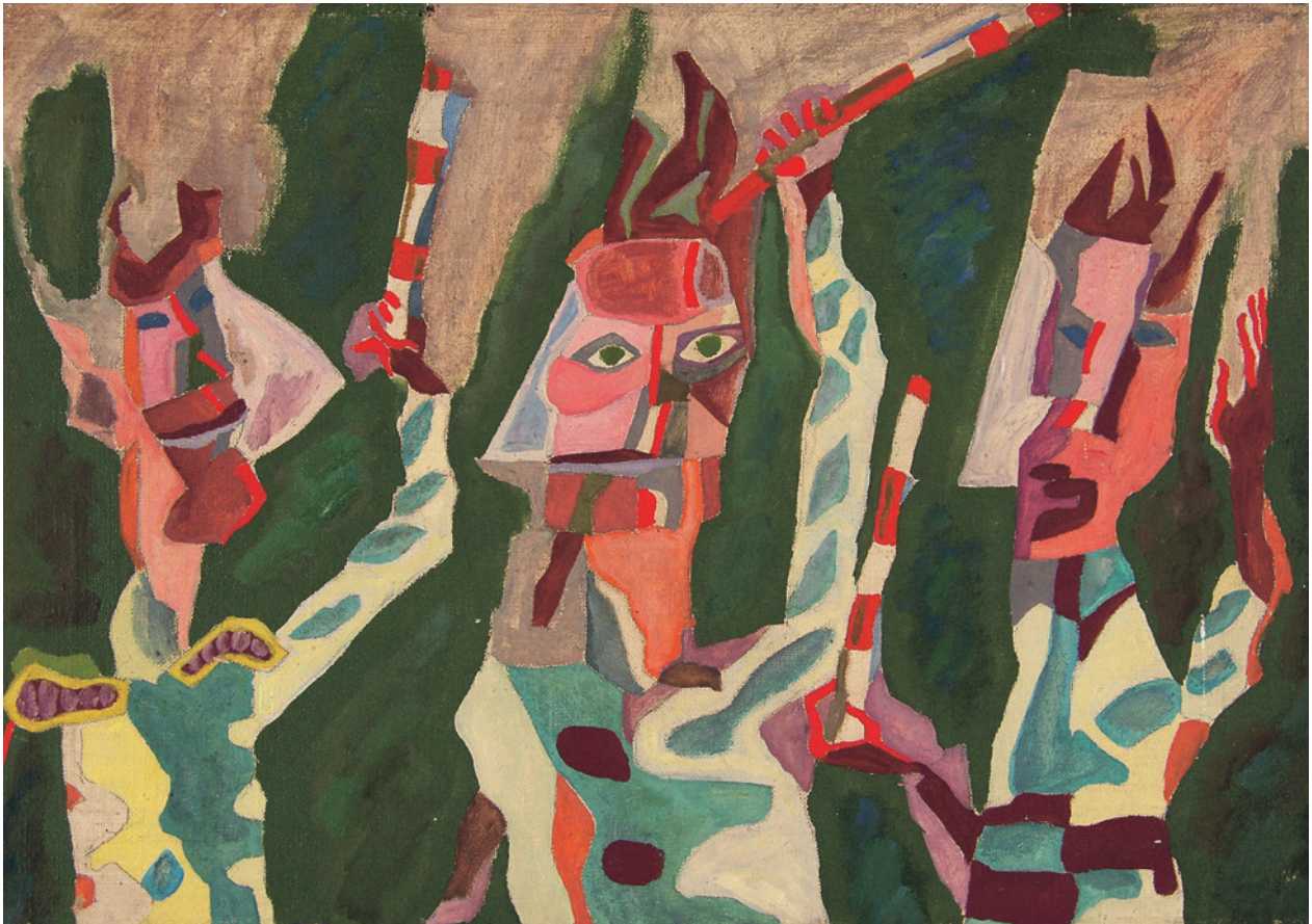
L. Dutka, Zbójcy, 1984, olej, płótno, fot. J. Korzeniowski, nr inw. 5955/III

stytucji, organizacji i stowarzyszeń. Jak zawsze chcemy w tym miejscu złożyć podziękowanie tym wszystkim, którzy kierując się szlachetnym porywem serca składali nam bezinteresownie swe często wartościowe nie tylko emocjonalnie, ale i materialnie pamiątki, z myślą o tym, że w zbiorach muzeum znajdują należyte miejsce, że otoczone będą konserwatorską troską i będą dobrze służyć narodowej kulturze. Dary te traktujemy jako wyraz najwyższego zaufania do instytucji Muzeum jako najlepszego gwaranta bezpiecznego zachowania polskiego dziedzictwa narodowego. Wszystkich darczyńców prosimy o przyjęcie podziękowań i wyrazów najwyższego szacunku za dary ich serc.