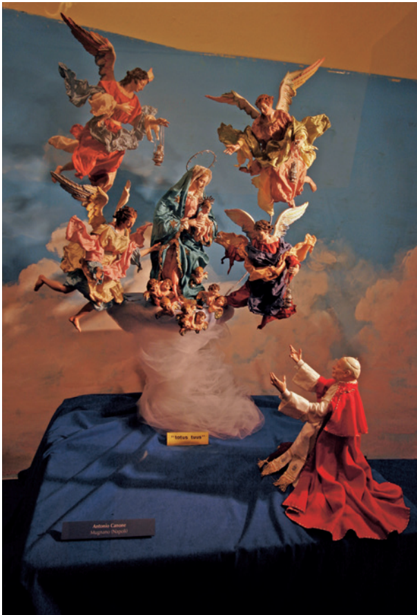
Fragment wystawy Szopka neapolitańska

Zespół Badawczy Rynku Głównego w Krakowie pod kierownictwem dr. Cezarego Buški, z ramienia Muzeum kuratorem wystawy była Aleksandra Radwan. Przy organizacji ekspozycji i naukowym rozpoznaniu wystawianych obiektów z zespołem współpracowali specjaliści z zakresu wielu dziedzin naukowych reprezentujących następujące uczelnie: Uniwersytet Jagielloński, Uniwersytet Poznański, Akademię Górniczo-Hutniczą w Krakowie, Akademię Rolniczą w Krakowie, Politechnikę Krakowską, Polską Akademię Nauk oraz Szpital Specjalistyczny im Jana Pawła II w Krakowie.