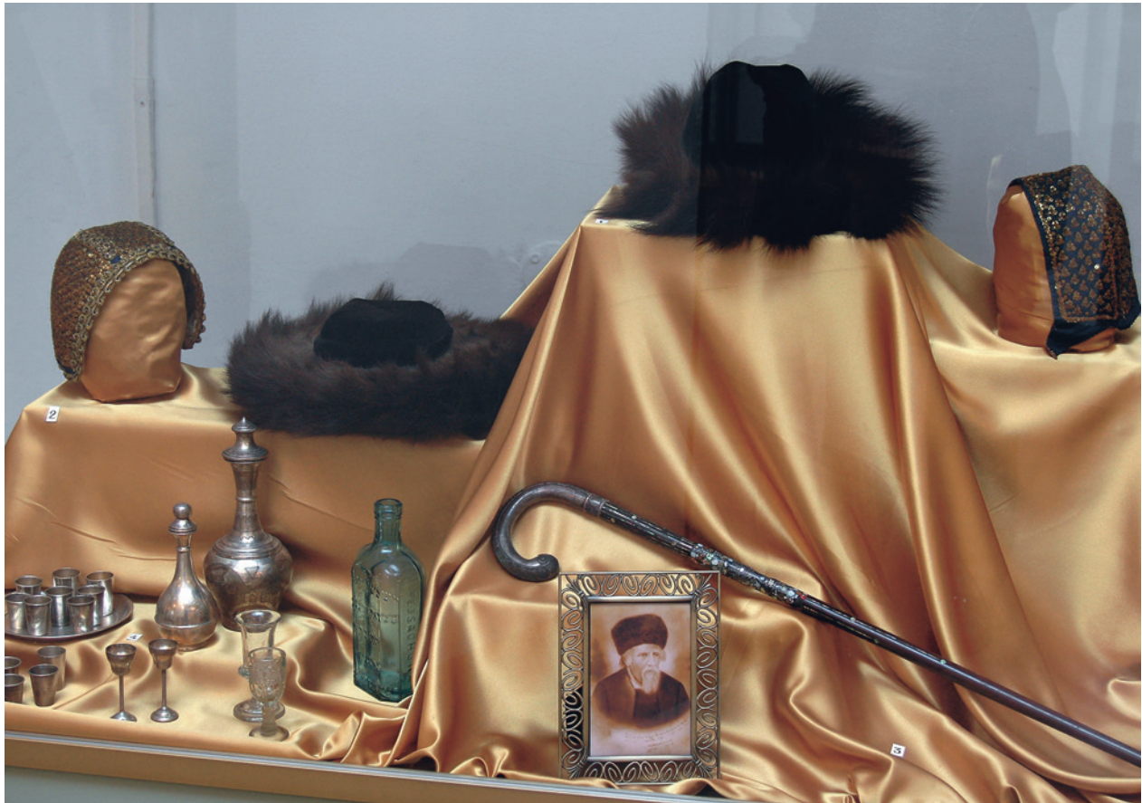
Fragment ekspozycji Czas chasydów

Wystawa złożona z reprodukowanych zdjęć archiwalnych, grafik i rysunków oraz pamiątkowych przedmiotów i starych chasydzkich ksiąg została uzupełniona informacjami na temat powstania i rozwoju tego religijnego ruchu oraz komentarzami do działalności największych cadyków. Zawierała ponadto mapy przedstawiające zasięg zjawiska i prezentowała po raz pierwszy udostępniane dokumenty, poświadczające zamieszkanie w Międzybożu na Podolu Baal Szem Towa, legendarnego założyciela chasydyzmu. Na wystawie, w części zaaranżowanej na kształt części jesziwy, czyli żydowskiej uczelni religijnej, można było usiąść i sięgnąć po informacje dotyczące kabały, posłuchać oryginalnej muzyki chasydzkiej i opowieści o rabinach cudotwórcach. Kuratorem ekspozycji była Elżbieta Długosz, aranżację plastyczną przygotował Andrzej Harasz.