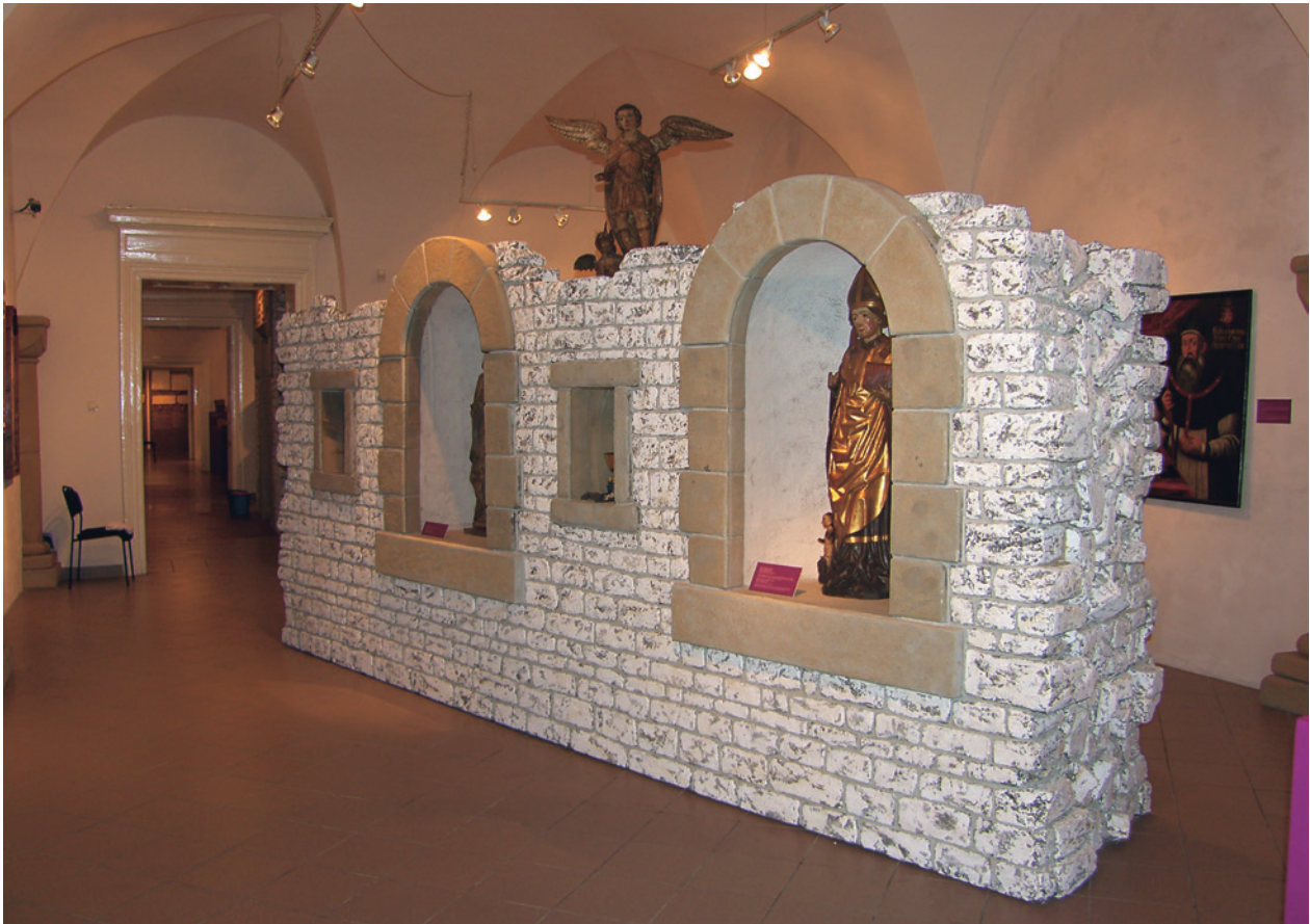
Fragment wystawy Kraków w chrześcijańskiej Europie X–XIII wiek