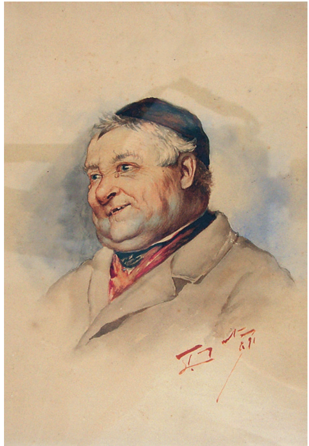
F. Tepe, Portret Żyda, 1871, akwarela, fot. J. Korzeniowski, nr inw. 941/VII

nionego dwulecia za kierunki priorytetowe w działaniach pracowni konserwatorskich uznano zabiegi przy obiektach przewidywanych na wystawy organizowane w ramach realizacji programu obchodów 750-lecia lokacji Krakowa. Podejmowano też zabiegi przy obiektach użyczanych Muzeum na wystawy zmienne przez klasztory, kościoły i osoby prywatne, w ten sposób rewanżując się za możliwość korzystania z ich zasobów, a zarazem poprawiając stan utrzymania dzieł stanowiących część narodowego dziedzictwa kultury. Wiele z tych obiektów po raz pierwszy poddano opiece konserwatorskiej. Wykonywano też wstępne zabiegi przy przedmiotach pochodzących z wykopalisk na Rynku Głównym, które były pokazane na organizowanej przez wspólnie z Zespołem Badawczym kierowanym przez dr. Cezarego Buškę wystawie w Wieży Ratuszowej. Wystawa Badania archeologiczne Rynku Głównego w Krakowie 2005–2006 była pokazem najcenniejszych wykopalisk.