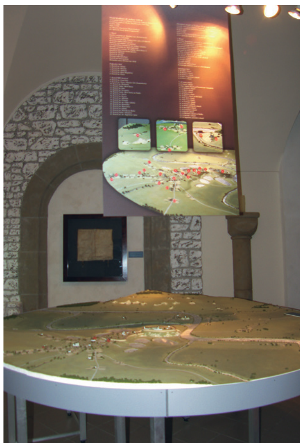
Fragment wystawy Kraków w chrześcijańskiej Europie X–XIII wieku

znaki sukcesów i zwycięstw. Zamykała wystawę sala poświęcona kibicom zawsze i wszędzie, czyli tym, którzy w dni zwycięstw, ale i porażek pozostawali i pozostają wierni „swojej” Cracovii lub „swojej” Wiśle. Większość eksponatów to przede wszystkim zdjęcia, ale zaprezentowano również obrazy, pamiątki osobiste, koszulki, rowery, łyżwy i hokejówki, piłki i proporczyki, medale i odznaki, szaliki i inne akcesoria zarówno sportowców, jak i ich fanów. Na wystawione można też było oglądać filmy, fragmenty kronik, ukazujące oba obchodzące 100-lecie kluby. Wystawie towarzyszył katalog który obok prezentacji ukazanych pamiątek zawierał m.in. obszerny artykuł autorstwa Marcina Marynowskiego, przedstawiający historię Cracovii i Wisły, a także kalendarium najważniejszych wydarzeń w dziejach obu klubów oraz zestawienia wyników sportowych w różnych dyscyplinach.