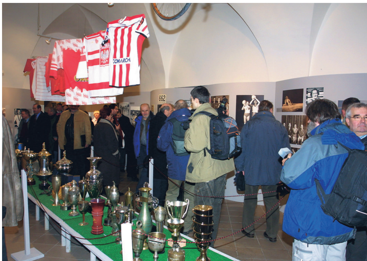
Fragment ekspozycji Cracovia – Wisła 1906–2006. Święta wojna, święta zgoda, fot. J. Korzeniowski

w trudnej sztuce portretu. Kontynuowano też wypróbowane od wielu lat cykle, jak np. Gwiazda sceny krakowskiej , a zarazem zainicjowano nowy, Zapomniane dziedzictwo Nowej Huty . Nie brakło oczywiście wystawy szopek. Tym razem ku wielkiej satysfakcji widzów, obok krakowskich, pokazaliśmy szopki neapolitańskie. Prezentację ekspozycji 2006 roku rozpoczną od kolejnej wystawy dedykowanej zbliżającemu się jubileuszowi lokacji miasta.