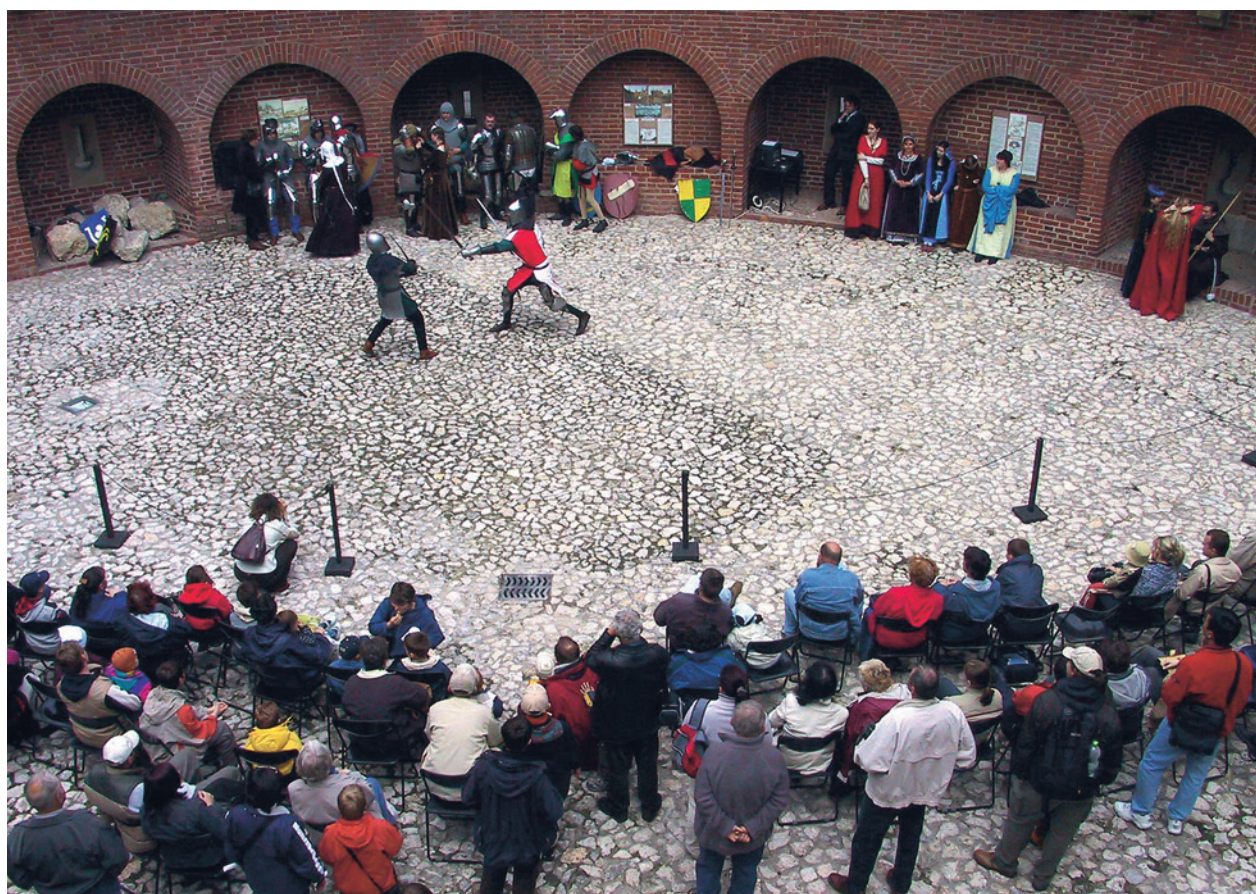
Turniej rycerski w Barbakanie

utworu Operze Krakowskiej (orkiestra, chór, soliści). Pracykonanie miało miejsce na dziedzińcu Pałacu Krzysztofora i spotkało się z bardzo ciepłym przyjęciem słuchaczy. Koncert ten sprawił, że otwarcie wystawy stało się wydarzeniem o wymiarze niespotykanym w historii krakowskiego muzealnictwa.