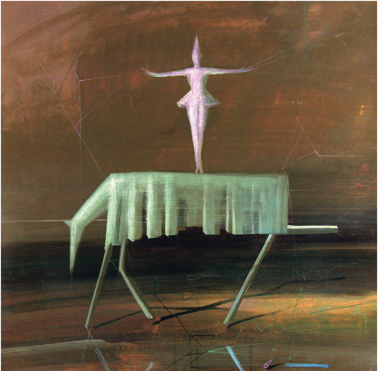
J. Jakowlew-Stożek, Różowa tancerka, olej, płótno, fot. J. Korzeniowski, nr inw. 5845/III

meier (ok. 1820), sypialnię z krakowskiego zakładu Wojciecha Bobera z ul. Rajskiej 10, w skład której wchodziły dwie szafy, toaletka, stolik okrągły, dwa fotele, taboret z XX wieku. Wzrost liczby eksponatów w okresie 2005–2006 pokazano w tabeli.