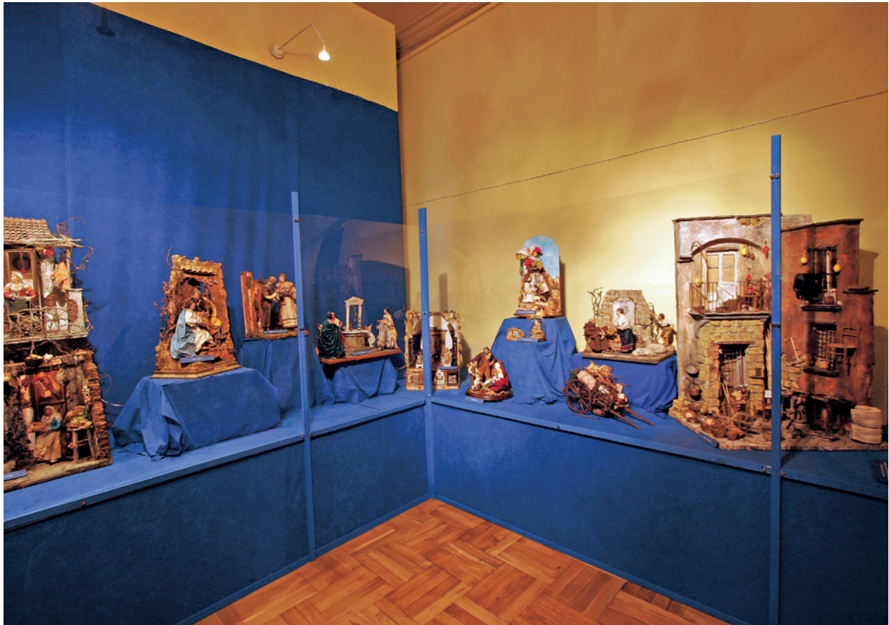
Fragment wystawy Szopka neapolitańska

wieku. Tworzono je zarówno na dworze królewskim, jak i wśród ubogich mieszczan. W zmodyfikowanej formie nie tylko przetrwała do dzisiaj, ale stała się też wielką atrakcją turystyczną Neapolu i okolic.