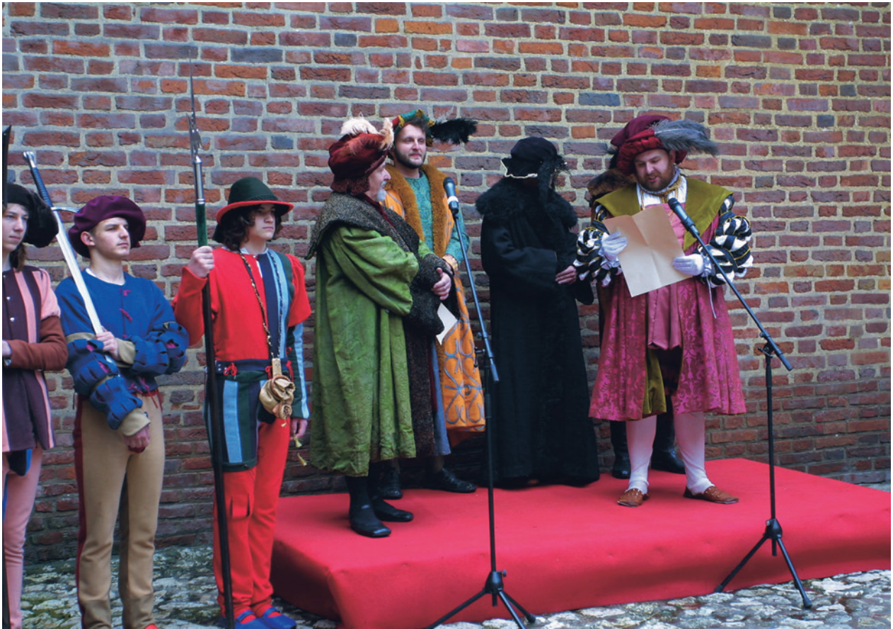
Uroczystość powitania w Barbakanie palatyna Ottheinricha – inscenizacja z okazji wernisażu wystawy Podróż przez centrum Europy. Obrazy z podróży palatyna Ottheinricha z lat 1536/1537, Barbakan

wego programu ekspozycyjnego oraz wydłużenia godzin otwarcia wystaw. Na te wyniki korzystnie wpłynęły imprezy zainicjowane przez władze miasta w 2004 roku: Noc Muzeów oraz Dzień Otwartych Drzwi Muzeów Krakowskich . Istotne dla ich powodzenia było zaangażowanie się w działania wszystkich istniejących w Krakowie muzeów, wsparcie tej akcji przez Stałą Konferencję Dyrektorów Krakowskich Muzeów i wreszcie dobra popularyzacja w mediach. Za efektem frekwencyjnym szedł też wzrost wpływów za biletów wstępu.