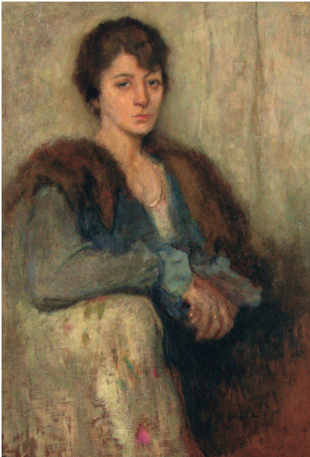
A. Karpiński, Portret nieznannej kobiety, 1922, olej, tektura, fot. J. Korzeniowski, nr inw. 5918/III