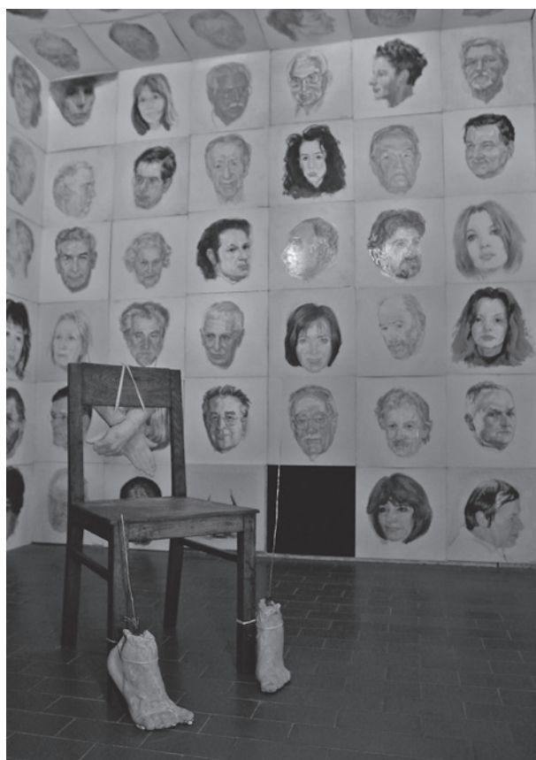
Fragment wystawy malarstwa L. Sobockiego Replikatorium, fot. J. Korzeniowski

Agnieszka Kutylak, Zgryźliwy poemat. O twórczości Witolda Wojtkiewicza