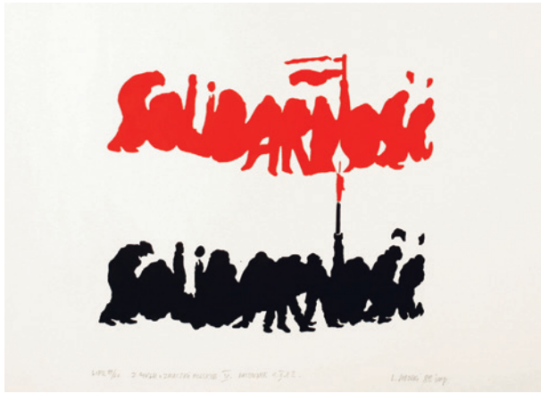
L. Sobocki, linoryt z cyklu Znaczki polskie , 1980–1982, fot. J. Korzeniowski, nr inw. 3886/III