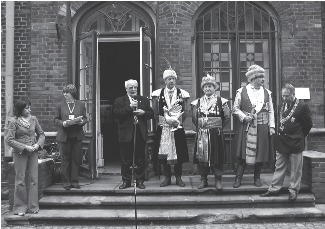
Wicedyrektor Muzeum W. Pasowicz rozpoczyna finał konkursu o tytuł Małego Króla Kurkowego