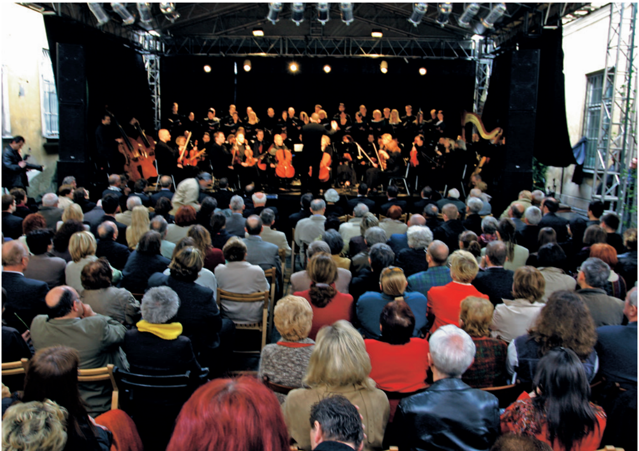
Koncert prapremierowy oratorium Cracovia est – widok na estradę