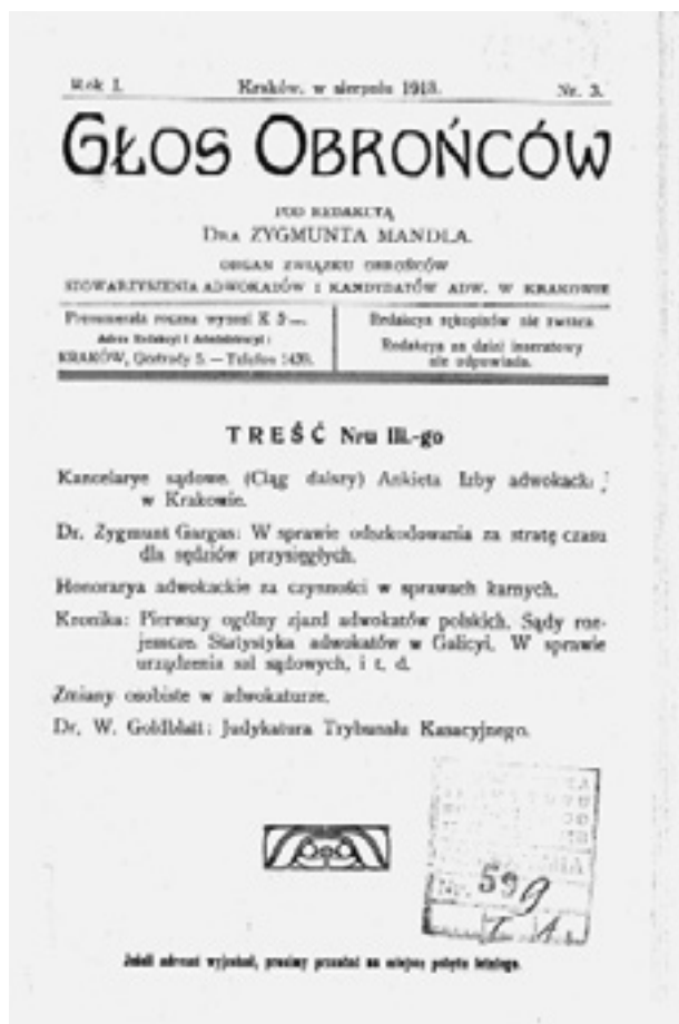
3. „Głos Obrońców”, pismo Stowarzyszenia Kandydatów Adwokackich w Krakowie (pierwsza strona)

pensji aplikantom adwokackim. Stowarzyszenie wezwało również Radę Adwokacką w Krakowie do dyscyplinarnego ścigania tych adwokatów, którzy zatrudniali aplikantów bez wynagrodzenia 32 .