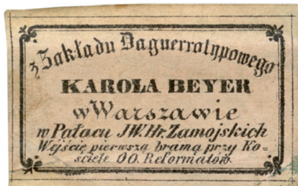
Ryc. 4. Nalepka firmowa dagerotypisty Karola Beyera umieszczona na odwrotnej stronie dagerotypu przedstawiającego Włodzimierza Kraińskiego; nr inw. MHK-Fs 5763/IX