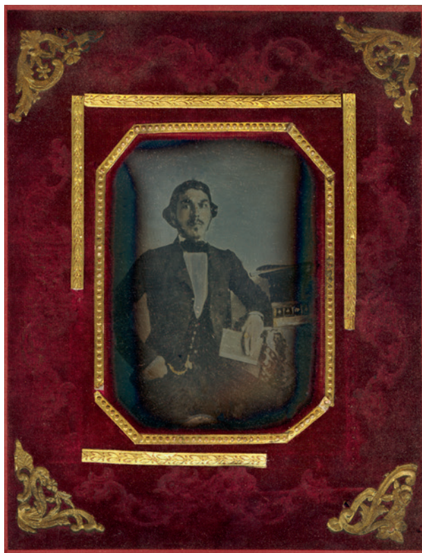
Ryc. 2. Nieznany mężczyzna, autor dagerotypu nieznany, 1854; nr inw. MHK-Fs4594/IX