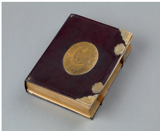
Album fotografii członków Towarzystwa Strzeleckiego Krakowskiego; nr inw. 240-BrK/1-58