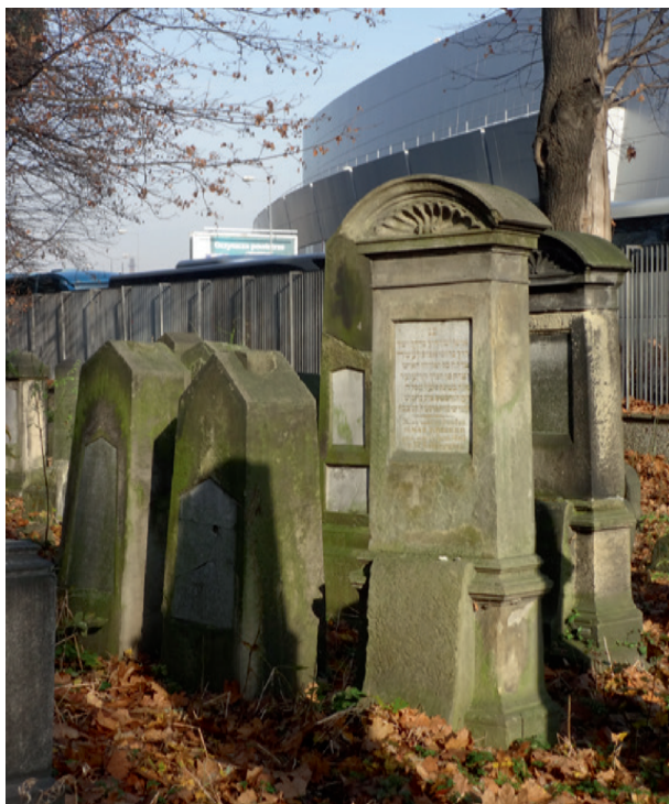
Ryc. 4. Nagrobek Ignacego Kriegera (z prawej), fot. Andrzej Malik, 2018

Kriegerów, Janetta, właśnie w Tarnowie w 1864 roku wyszła za mąż 27 . Jeszcze w połowie lat sześćdziesiątych Urząd Powiatowy w Tarnowie upominał się o podatek domostykalny