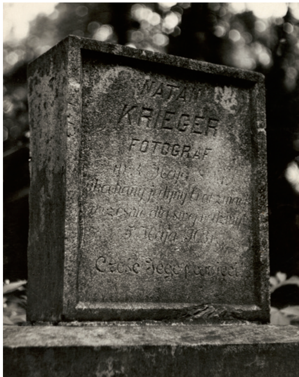
Ryc. 8. Nagrobek Natana Kriegera (fragment), fot. Andrzej Malik, ok. 1990

Natana zachował się do dziś, ale napisy, widoczne jeszcze około 1990 roku, obecnie są zupełnie nieczytelne (szczęśliwie dokumentuje je fotografia, wykonana przy okazji jego odkrycia – ryc. 8).