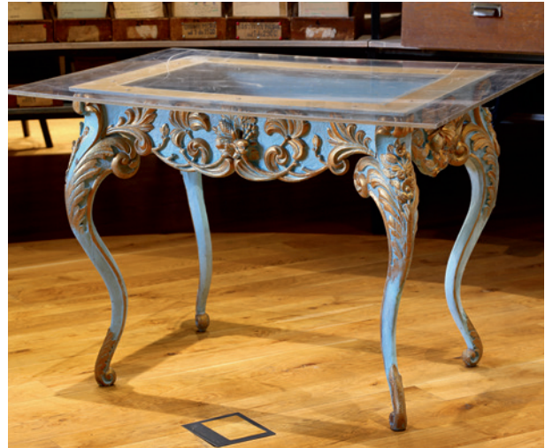
Ryc. 10. Stół z atelier Kriegerów na ekspozycji w Domu Rzemiosł (Teatr im. Juliusza Słowackiego w Krakowie), fot. Tomasz Kalarus, 2019