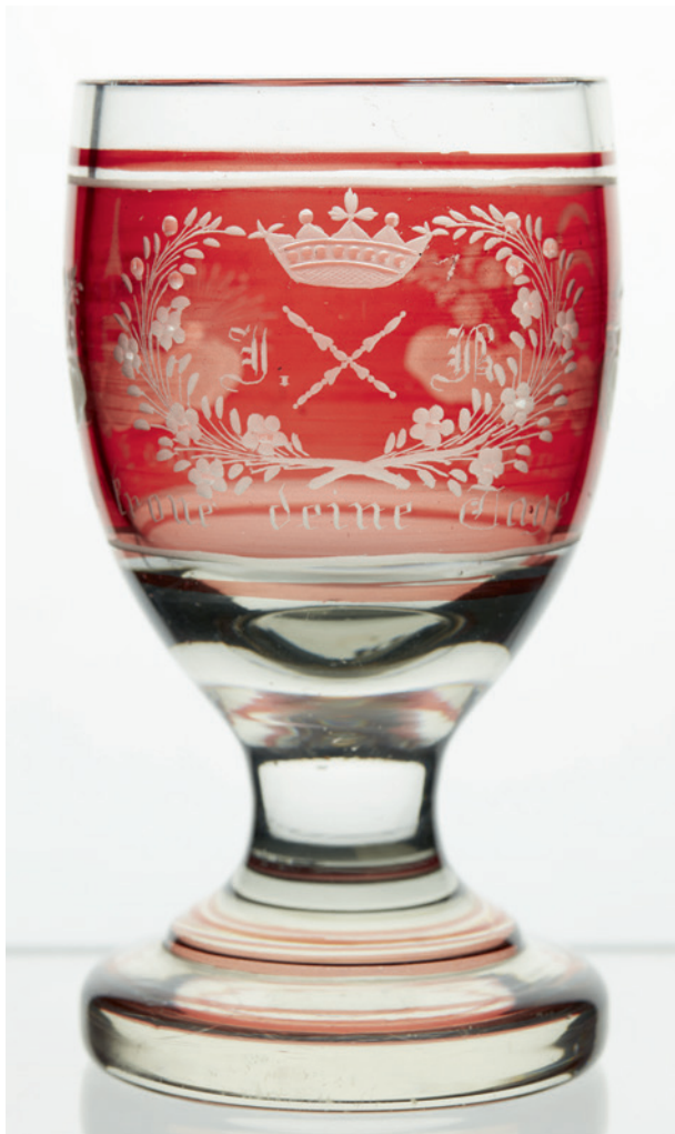
Ryc. 11. Kielich z życzeniami i inicjałami Ignacego Kriegera (?), połowa XIX w., fot. Anna Olchawska, Pracownia Fotograficzna MNK; w zbiorach MNK, nr inw. MNK IV-Sz-258