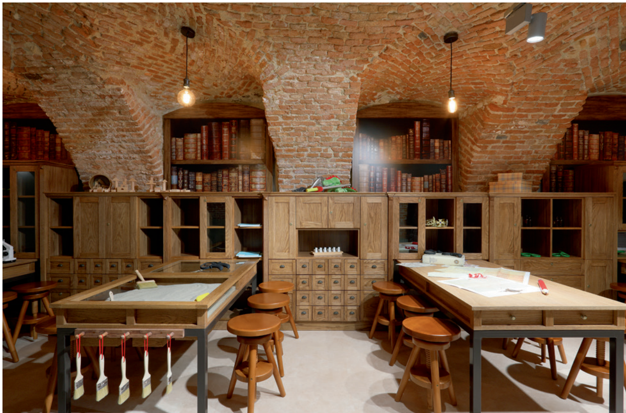
Alchemia miasta , fragment wystawy głównej, fot. Andrzej Janikowski, 2018

i zaszczepieniu zainteresowaniem historią, tradycjami, ludzkimi perypetiami, bez których nie byłoby muzealnej narracji. Opowieść na wystawie nie kończy się na żadnym konkretnym momencie, trwa przez nowe obiekty, nowe opowieści i relacje z działań, jakie odbywają się aktualnie w Podgórzu.