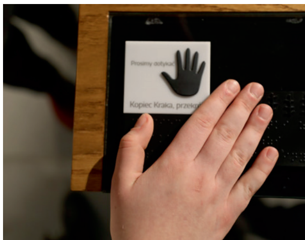
Zajęcia dla osób z dysfunkcją wzroku