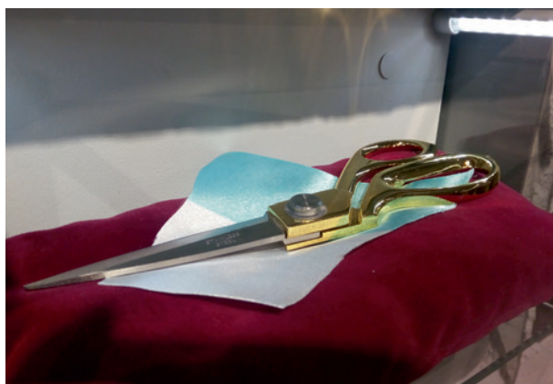
Nożyczki, które trafiły do gabloty po wernisażu

kańcami. Choć jest to proces żmudny, wymagający ogromu pracy i jednak eksperymentalny, wierzę, że przynosi już efekty. Podgórze było niegdyś miastem dumnych obywateli, dumnych z miejsca, jakie stworzyli, z wkładu, jaki wnieśli w rozwój ojczyzny. Teraz jest miejscem świadomej dyskusji nie o historii miasta, ale o jego teraźniejszości i przyszłości. Dowodem tego są coraz liczniejsze akcje społeczne podejmowane przez mieszkańców, takie jak dyskusja wokół terenu pod estakadą (gdzie według oczekiwań krakowian powinien powstać park) czy trudna rozmowa na temat przyszłości byłego niemieckiego obozu KL Płaszów. Mieszkańcy traktują podgórski oddział jako miejsce spotkania, ale też interwencji – do nas przychodzi, gdy źle się dzieje z jakimś budynkiem czy fragmentem miasta. Muzeum Podgórze jest więc niejako miejscem, w którym nie tylko kumulują się lokalne nastroje społeczne, ale mają okazję na rozwój – rozmowę i początek działania.