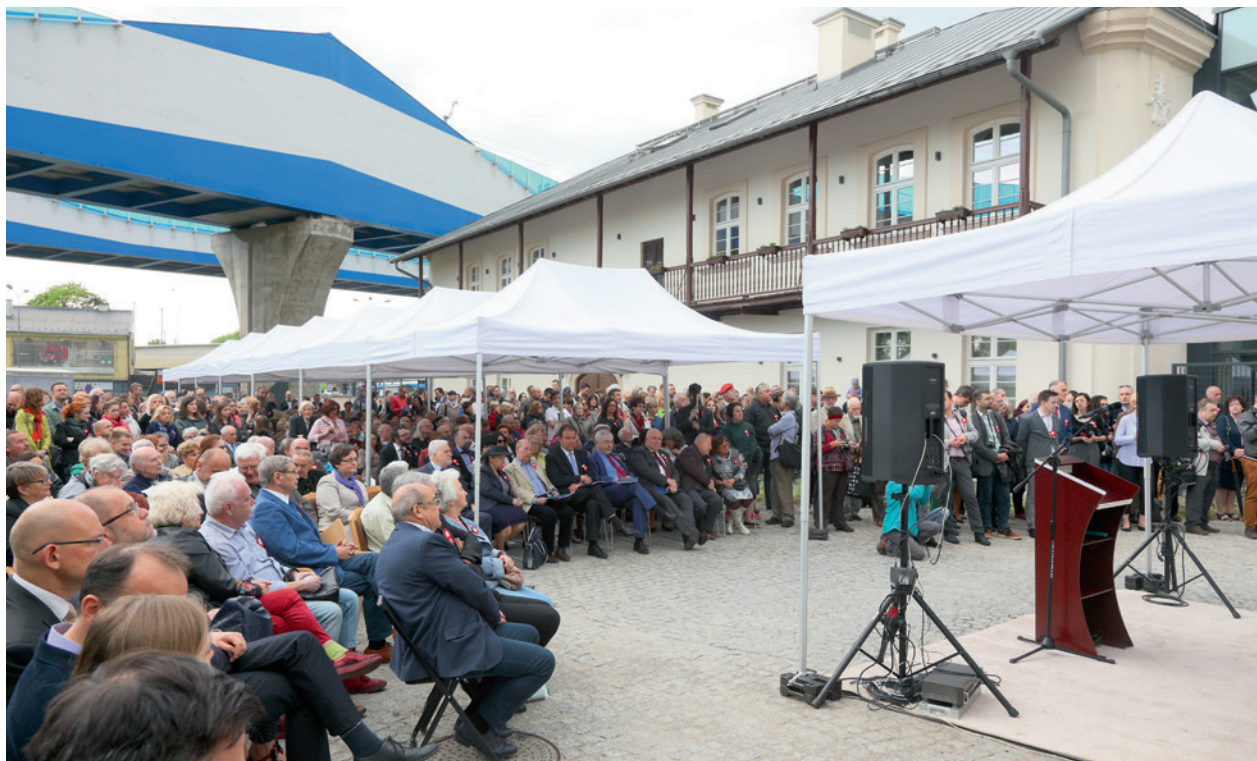
Uroczystość otwarcia oddziału, fot. Andrzej Janikowski, 26 kwietnia 2018 r.