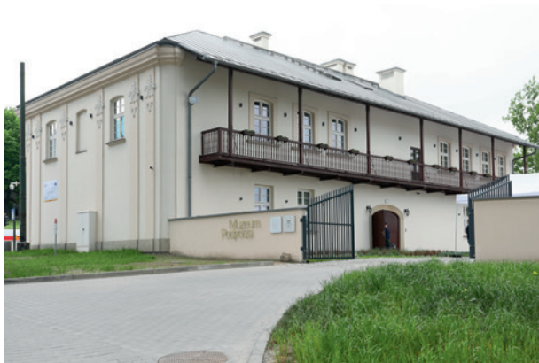
Muzeum Podgórze, 2018