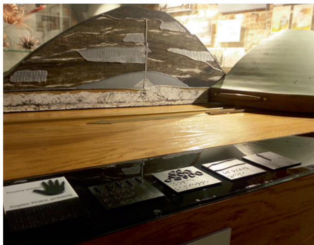
Dotykowe elementy wystawy głównej, fot. Katarzyna Bury