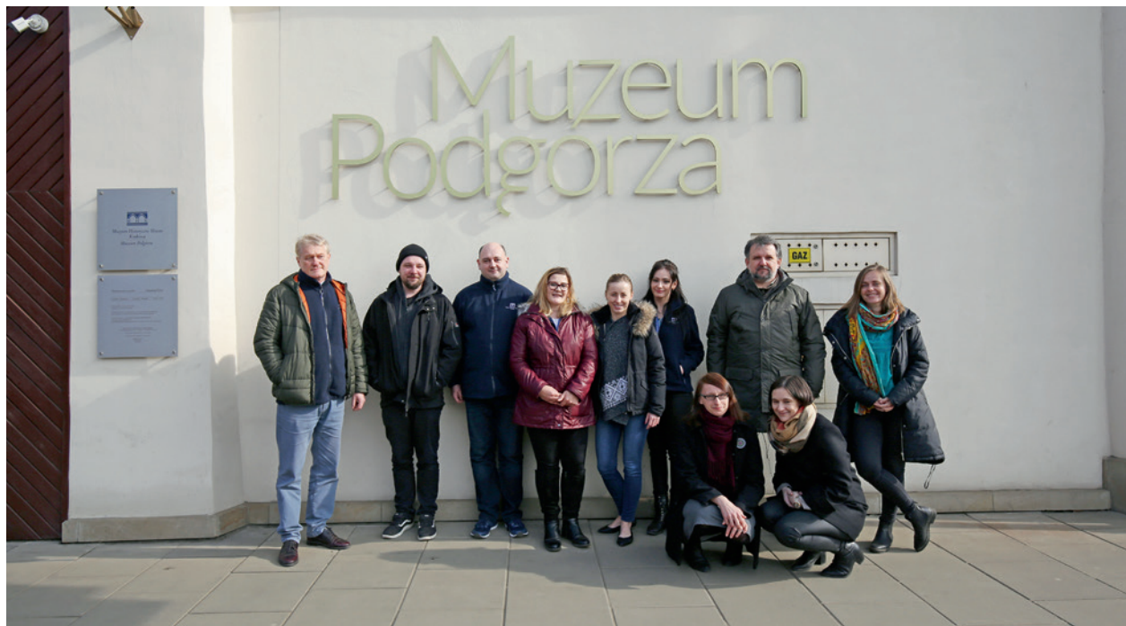
Zespół Muzeum Podgórze, fotografia wykonana z okazji 120-lecia Muzeum Historycznego Miasta Krakowa, 1 marca 2019 r.

Perła w Koronie! Dziękuję za zmianę mojego „widzenia” Podgórze z lat 80–90 tych. za Jego sublimację i ukazanie Jego charakteru. M.