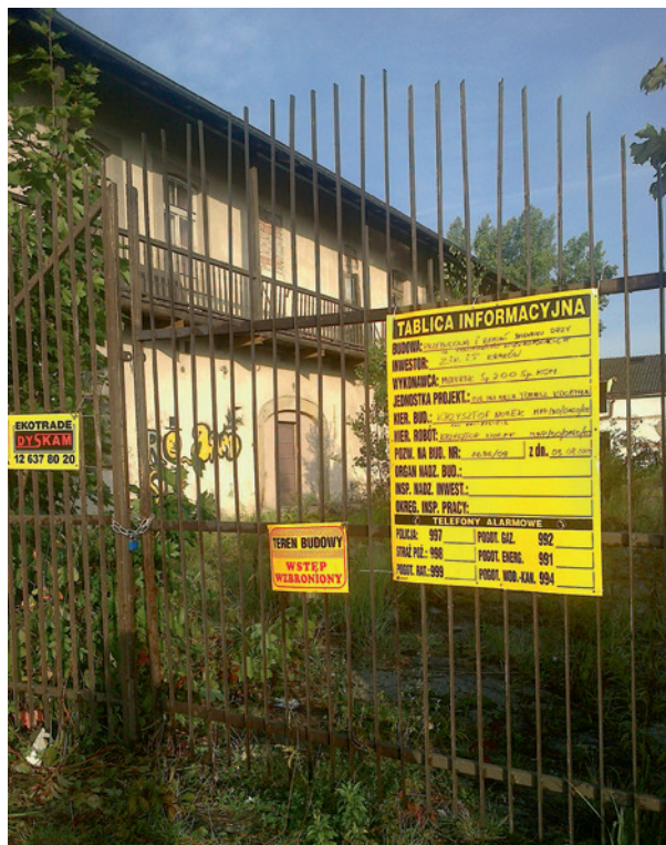
Budowa Muzeum Podgórze, wrzesień 2016 r.

We wrześniu 2015 roku w zajeździe Pod św. Benedyktem rozpoczęły się prace budowlane, koordynowane przez