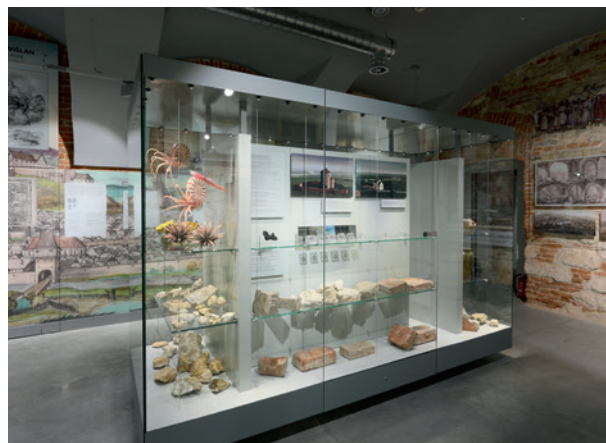
Między Wisłą a górą św. Benedykta , fragment wystawy głównej, fot. Andrzej Janikowski, 2018