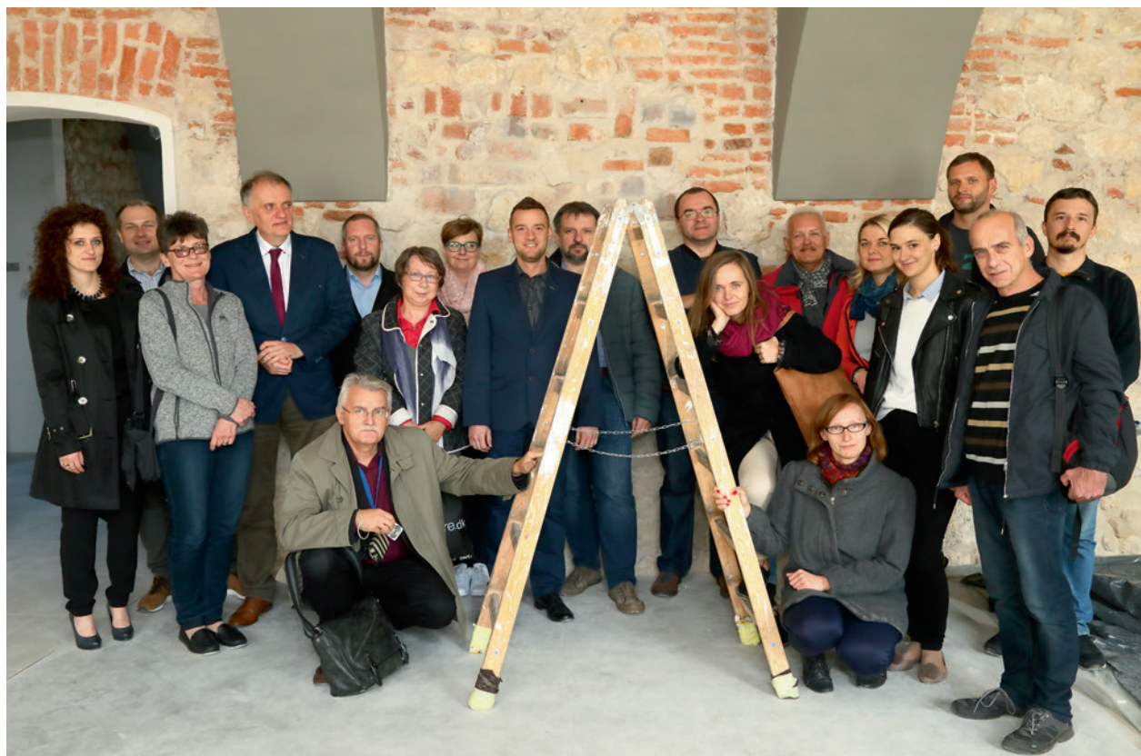
Zespół na budowie Muzeum Podgórze