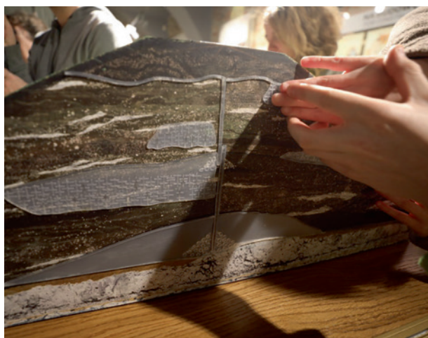
Zajęcia dla osób z dysfunkcją wzroku