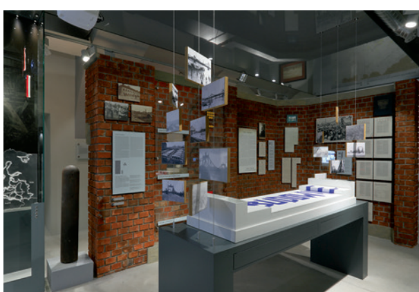
Ku wolności , fragment wystawy głównej, fot. Andrzej Janikowski, 2018

mie budujących potęgę swojej małej ojczyzny, o dumnych obywatelach mądrze gospodarujących powierzonymi im dobrami, o dojrzałych decyzjach władarzy wspierających rozwój miasta, ale także prowadzących do odzyskania niepodległości. To także trudna historia czasów II wojny światowej, która odcisnęła na Podgórzu bolesne piętno, i okresu powojennego, który ugruntował wrażenie „bezpieczeństwa” tej części miasta. Fakt powołania do istnienia muzeum świadczy o zmianie myślenia, która dokonana się 20, a może nieco więcej lat temu i polegała na ponownym odkryciu