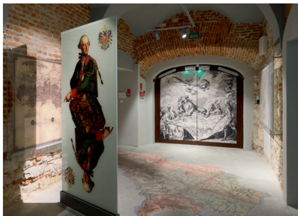
W Galicji , fragment wystawy głównej, fot. Andrzej Janikowski, 2018