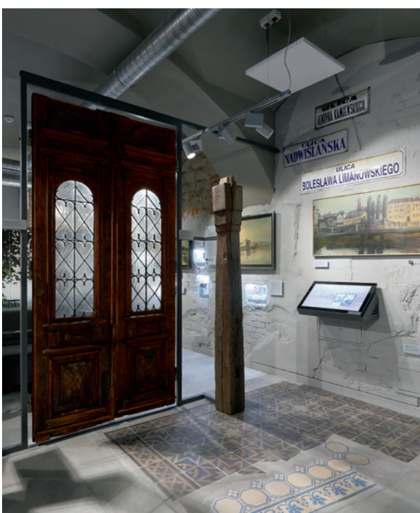
Czas Podgórze , fragment wystawy głównej, fot. Andrzej Janikowski, 2018

mie budujących potęgę swojej małej ojczyzny, o dumnych obywatelach mądrze gospodarujących powierzonymi im dobrami, o dojrzałych decyzjach władarzy wspierających rozwój miasta, ale także prowadzących do odzyskania niepodległości. To także trudna historia czasów II wojny światowej, która odcisnęła na Podgórzu bolesne piętno, i okresu powojennego, który ugruntował wrażenie „bezpieczeństwa” tej części miasta. Fakt powołania do istnienia muzeum świadczy o zmianie myślenia, która dokonana się 20, a może nieco więcej lat temu i polegała na ponownym odkryciu