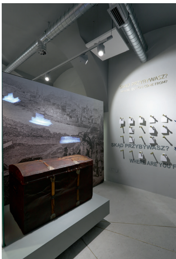
Kufer przybyszów , fragment wystawy głównej, fot. Andrzej Janikowski, 2018