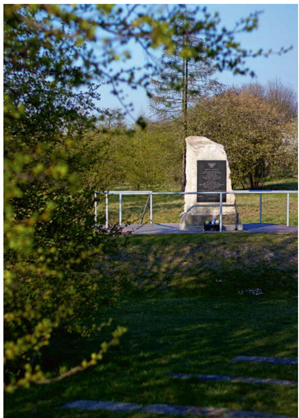
Ryc. 14. Pomnik z 1947 r. współcześnie, fot. Przemysław Kozera, Agata Łopatkiewicz, 2020. W 2000 r. została zmieniona tablica pamiątkowa, zachowano jednak dotychczasową treść inskrypcji