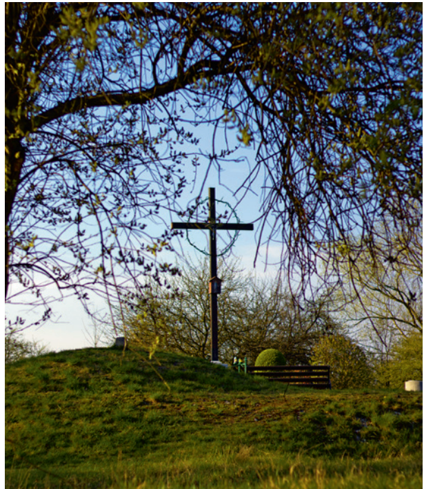
Ryc. 12. Krzyż na H-górcze współcześnie, fot. Przemysław Kozera, Agata Łopatkiewicz, 2020