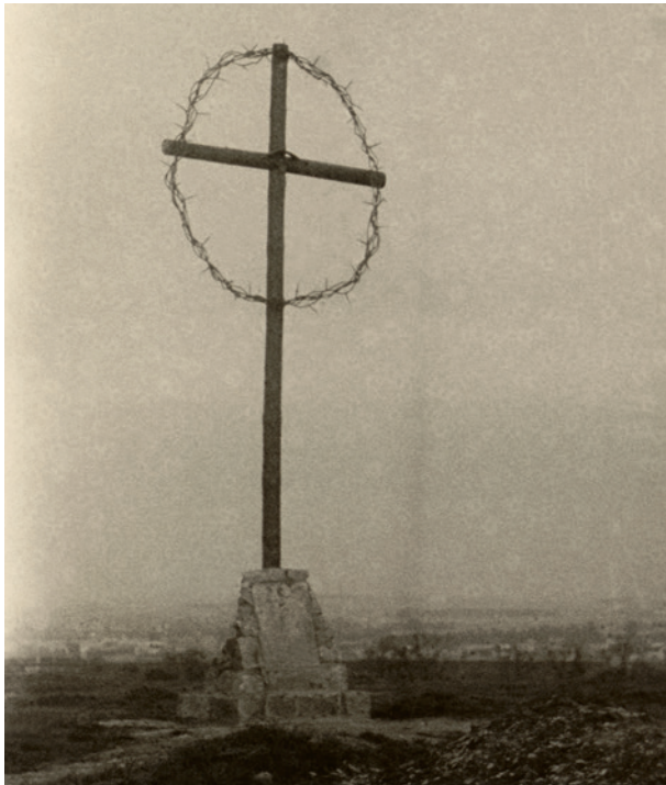
Ryc. 11. Krzyż z 1947 r. ozdobiony drutem kolczastym w kształcie korony cierniowej na H-górcze, 1954; w zbiorach MK, sygn. MHK-Fs20780/IX/13