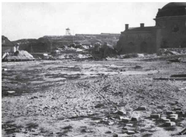
Ryc. 8. Ruiny domu przedpogrzebowego, 1944