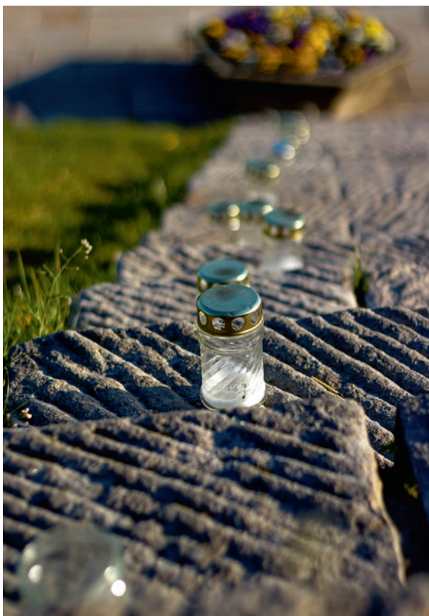
Ryc. 16a. Sacrum. Profanum , fot. Przemysław Kozera, Agata Łopatkiewicz, 2020