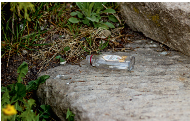
Ryc. 16b. Sacrum. Profanum , fot. Przemysław Kozera, Agata Łopatkiewicz, 2020

Spośród wielu historycznych miejsc, zdarzeń oraz potencjalnych aspektów interpretacyjnych powiązanych z dziedzictwem KL Płaszów, które zostały pominięte w niniejszym opracowaniu, chcemy wskazać na dwie kwestie, które nie powinny pozostawać w „ukryciu”. Pierwsza z nich dotyczy historii dzieci żyjących w obozie, funkcjonowania Kinderheimu oraz dramatycznych okoliczności jego zagłady 14 maja 1944 roku 46 . Nie wdając się w szczegóły tych tragicznych wydarzeń, podkreślamy jedynie, że istnienie wydzielonych dla dzieci baraków oraz sama obecność dzieci w obozie jest jednym z wymiarów specyfiki pamięci o tym miejscu. Druga kwestia dotycząca spraw „przemilczanych” 47 skupiona jest na wykorzystywaniu więźniarek w obozowym domu publicznym zwanym wesołym domkiem. Ten aspekt historii wiąże się z piętnem dodatkowo naznaczającym i wykluczającym więźniarki ze społeczności obozowej, wpisuje się w szersze zjawisko seksualnej przemocy wobec kobiet. Przemocy, która naruszała nie tylko ich fizyczność i była realnym zagrożeniem dla życia, ale także uderzała w nienaruszalną sferę godności.