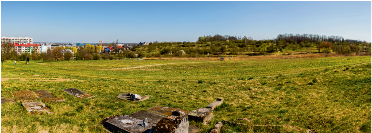
Ryc. 4. Plac apelowy, widok w kierunku H-górki, fot. Przemysław Kozera, Agata Łopatkiewicz, 2020

aspekty nowoczesności, które zakwestionowały humanistyczną filozofię człowieka i leżały u podstaw Zagłady. Jest on doprowadzoną do ekstremum emanacją kultury, bazującej na czterech fundamentach: ideologii eugenicznej 34 , biurokracji, hierarchizacji władzy oraz racjonalnej obojętności wobec wyselekcjonowanej kategorii społecznej. Opierając