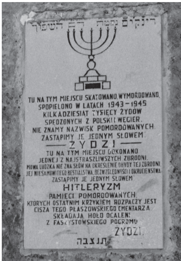
Ryc. 13. Tablica na pomniku wzniesionym przez Kongregację Wyznania Mojżeszowego w Krakowie w 1947 r., kadr z fotografii Henryka Hermanowicza, druga połowa lat sześćdziesiątych XX w.; w zbiorach MK, sygn. MHK-5906/N/3