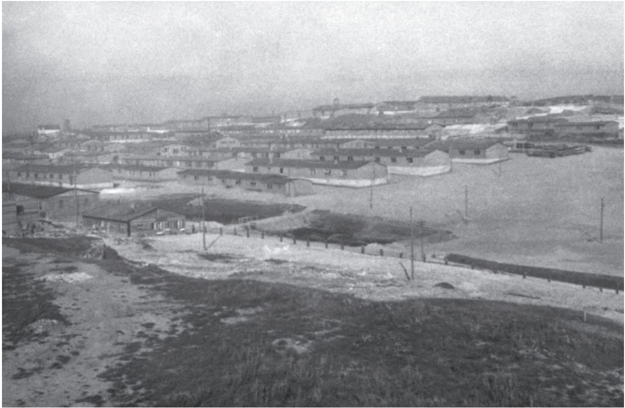
Ryc. 3. Plac apelowy, widok w kierunku baraków więźniów żydowskich, 1944