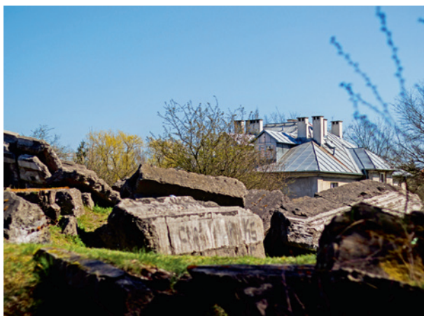
Ryc. 9. Ruiny domu przedpogrzebowego współcześnie

Dawne wejście na żydowski cmentarz do dzisiaj pozostaje gruzowiskiem (ryc. 8, 9). Dla niezainteresowanego przechodnia jest rodzajem „bałaganu”, który burzy ład najbliższej okolicy lub też jest chwilowo włączany jako rekreacyjna atrakcja płaszowskiego parku zieleni... Zdziwiałe jest niezmiennie trwanie tych „kamiennych odłamów” żydowskiej kultury. Czy są świadectwem jej trwania? A może nieustannym dowodem jej profanacji i odrzucenia? Niewątpliwie stanowią one jeden z najbardziej charakterystycznych miejsc dla całego terenu byłego KL Płaszów, ujmowanego jako przestrzeń trudnego dziedzictwa z unoszącą się nad nią aurą ambiwalencji w traktowaniu przez współczesnych własnego kontekstu historycznego. „Kamiennie odłamy” odczytywać można jako cmentarne gruzowisko, ale również jako monumentalny, symboliczny grób, na którym kamienie strzegą miejsca zmarłych przed stale grożącą im profanacją.