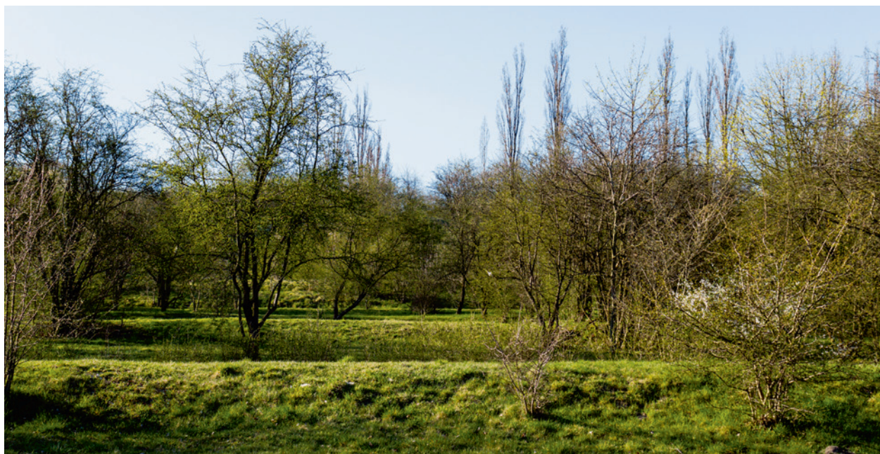
Ryc. 2. Układ tarasowy terenu byłego obozu (część gospodarza, latryny), fot. Przemysław Kozera, Agata Łopatkiewicz, 2020

autora Czasu zbezczeszczenia : „Pod butami skrzypią małe kamyki. Spójrzcie proszę, na te kamyki, przyłóżcie je do ucha – usłyszycie płacz kamieni... kiedy podniesiecie taki kamień, zobaczycie na dłoni kawałek marmuru – i jeżeli obrócić go między palcami, zauważycie, że nie jest to normalny kamień – wyryte są na nim hebrajskie litery... bowiem wszystkie drogi w obozie płaszowskim zbudowane są z rozbitych nagrobków” 33 .