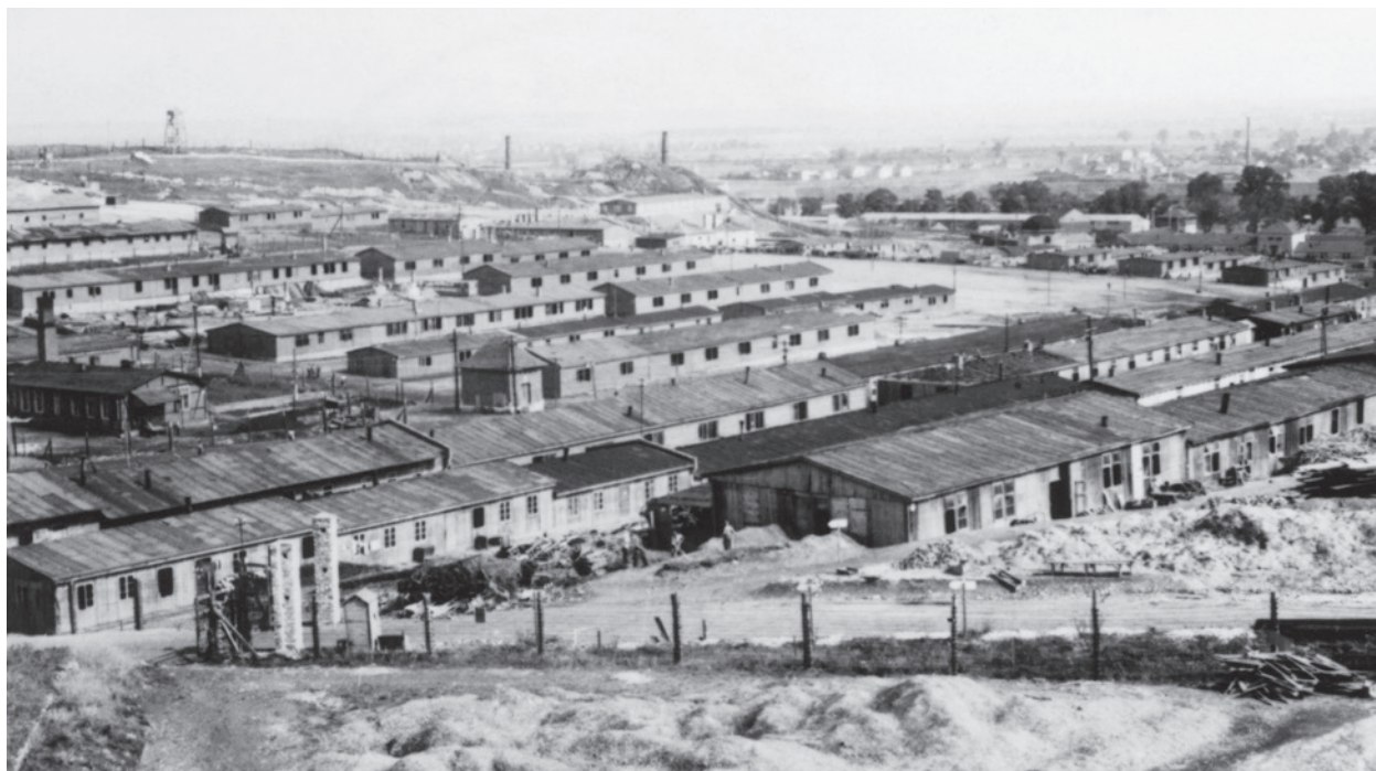
Ryc. 1. Widok terenu przemysłowego (na pierwszym planie) oraz baraków mieszkalnych przy placu apelowym, 1944; w zbiorach IPN, sygn. IPNKr-2-15-4-41