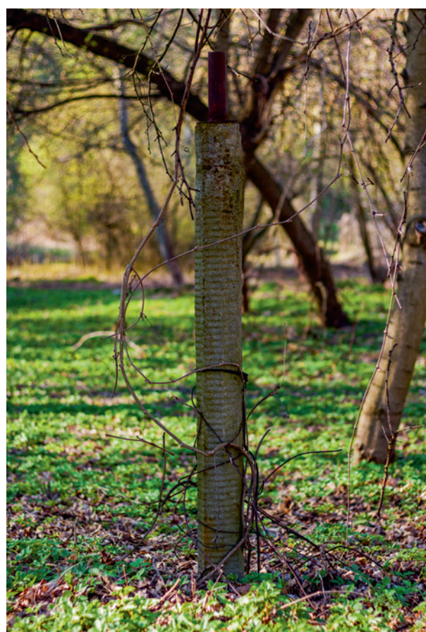
Ryc. 7. Ukryte na drugim planie miejsce masowej egzekucji, tzw. bagier

aby fizyczność obozowej instytucji przesiąknięta była symboliką pogardy dla żydowskiej kultury. Miała dowodzić możliwości całkowitego odizolowania więźnia od jakichkolwiek pierwiastków podtrzymujących – indywidualnie czy też rozumiany wspólnotowo – sens ludzkiego życia