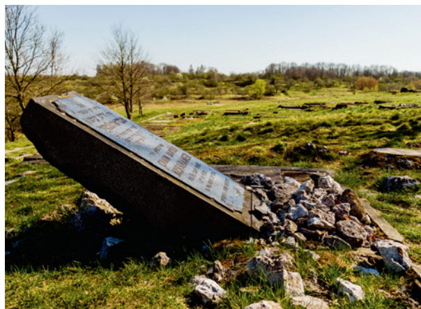
Ryc. 6. Cmentarz żydowski, fot. Przemysław Kozera, Agata Łopatkiewicz, 2020

Istota „projektu”, jakim był KL Plaszow, polegała na wbudowaniu w jego tkankę trwałych mechanizmów niszczących więźniów nie tylko w sferze fizycznej, ale przede wszystkim duchowej. Lokalizacja obozu na terenie dwóch żydowskich nekropoli, pierwotne usytuowanie właśnie tam placu apelowego, pozyskiwanie macew do jego rozbudowy i utwardzania dróg wewnętrznych, używanie nagrobnych kamieni jako fundamentów dla więziennych latryn, miały spowodować,