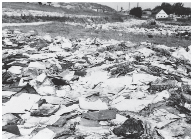
Ryc. 10. Zbzczeszczone zwoje Tory i książki religijne, 1946; w zbiorach IPN, sygn. IPN 16756b

w tym kontekście swoją logikę, gdyż uosabiali oni wartości i dziedzictwo, które naziści chcieli zniszczyć. Ich życie podtrzymywało przecież jedną z najstarszych, trwających nadal cywilizacji, jakie znamy 41 . Jedną z archiwalnych fotografii (ryc. 10) przedstawiającą zbzczeszczone zwoje Tory i książki religijne w płaszowskim obozie jest sugestywną ilustracją wpisującą się w cytowane ustalenia jednego z najwybitniejszych badaczy Zagłady.