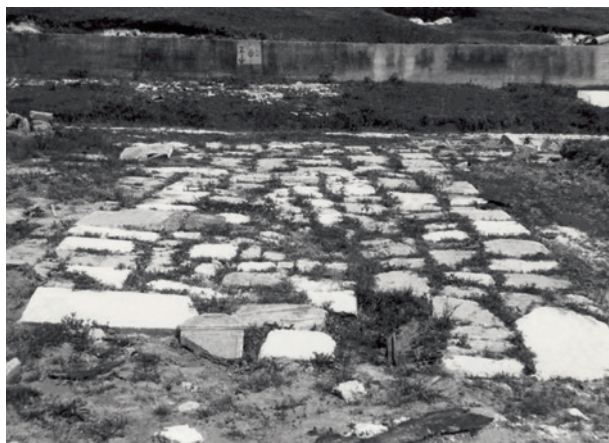
Ryc. 5. Droga na terenie obozu wyłożona macewami, 1946; w zbiorach IPN, sygn. IPN 16751

według placówek pracy. »Kapo« zdawał sprawozdanie dyżurnemu esesmanowi: ilu więźniów zdrowych i zdolnych do pracy, ilu chorych (...) i ilu zabitych w nocy (...). Z drugiej strony »apelplacu« stali ci, co skończyli nocną zmianę (...): ilu żywych więźniów wróciło z roboty i ilu zabitych przyniesiono na noszach. O szóstej wieczór porządek był odwrotny (...) staliśmy wszyscy tak długo, aż odnalazł się nieszczęśliwiec, który usnął na pryczy lub ustawił się w nieodpowiedniej grupie, albo został wysłany gdzieś i »kapo« zapomniał o tym zameldować na odpowiednich formularzach» 35 .