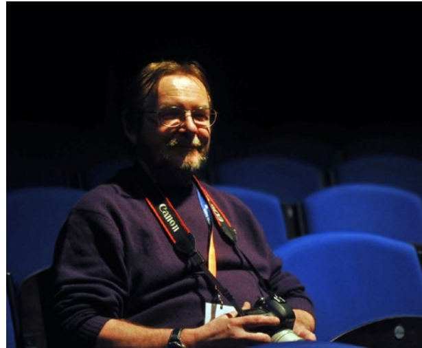
W czasie próby teatralnej, 25 lutego 2014 r.

Nic dwa razy się nie zdarza... Pewne rzeczy już nie wrócą i tylko fotografia pozwoli o nich przypomnieć. Tę ulotność chwili Andrzej dla nas zachował, potrafił uchwycić