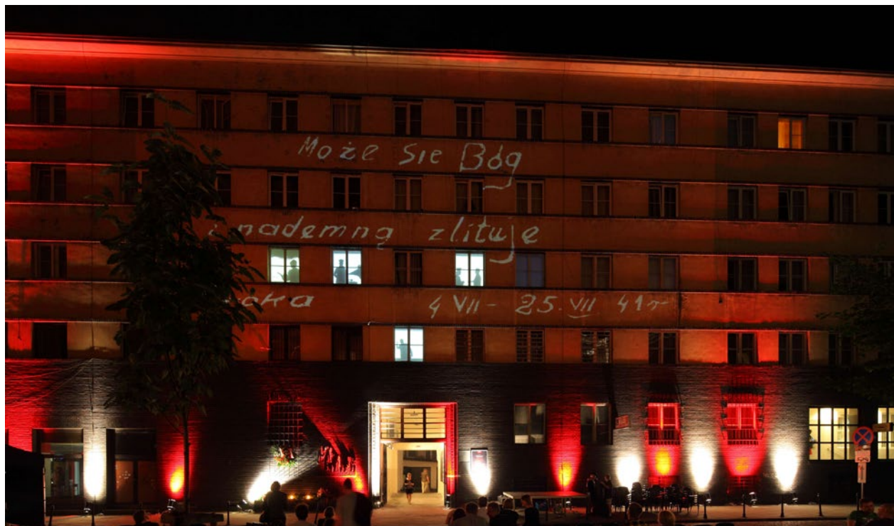
Otwarcie wystawy stałej w oddziale Ulica Pomorska, prezentacja typu światło dźwięk na fasadzie Domu Śląskiego, 2 czerwca 2011 r., fot. Tomasz Kalarus; w zbiorach MK