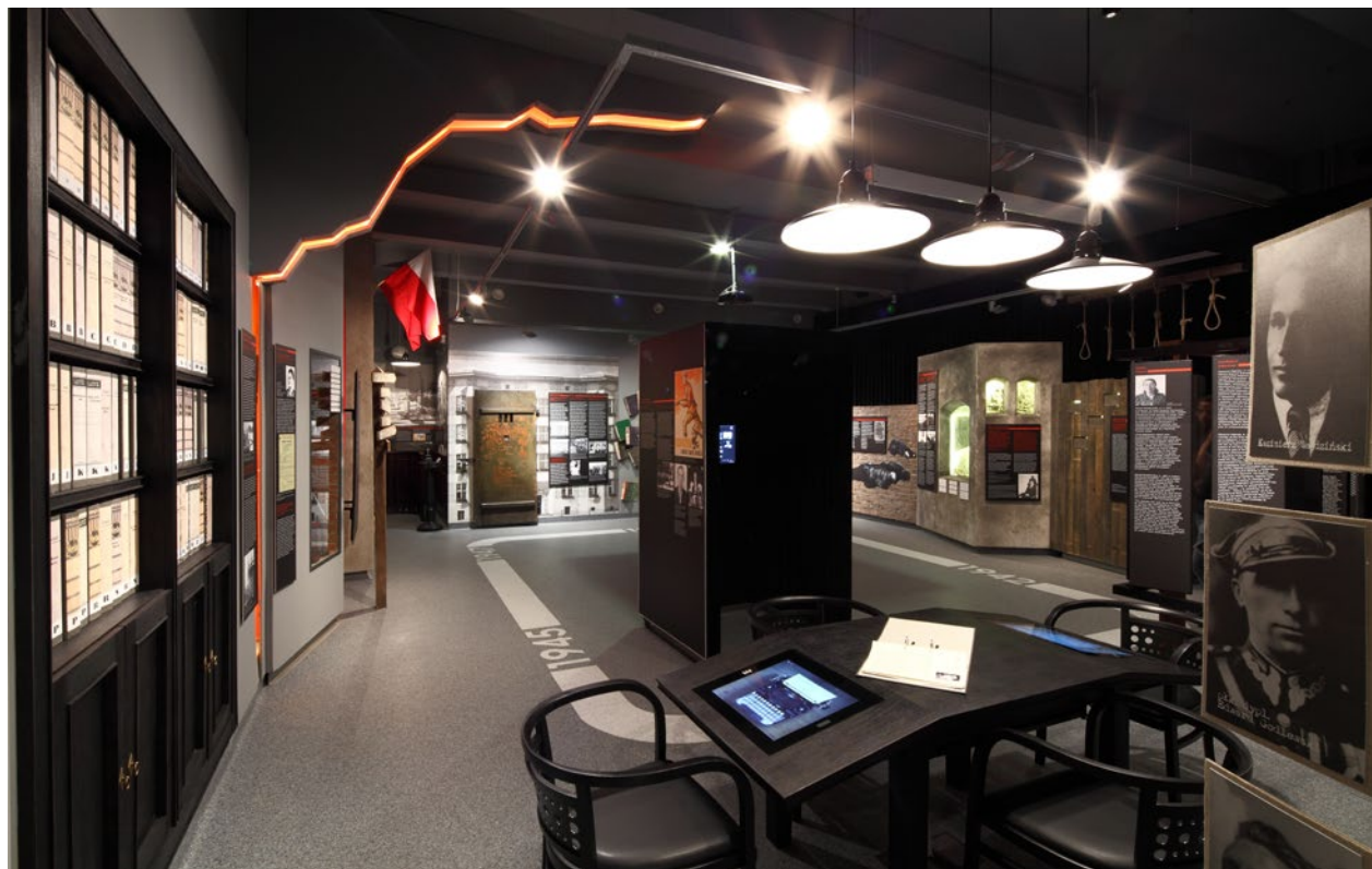
Fragment wystawy stałej Krakowianie wobec terroru 1939–1945–1956 , fot. Tomasz Kalarus; w zbiorach MK

wprowadzono dodatkowe rozwiązania. Dla podkreślenia wartości historycznej cel, wypuklenia ich roli jako eksponatu oraz dodatkowego zabezpieczenia inskrypcji w trzech celach zbudowano specjalną konstrukcję ze szkła i metalu.