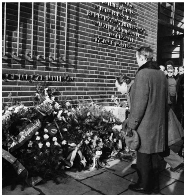
Składanie wieńców pod Ścianą Pamięci przy ul. Wybickiego 2, 17 stycznia 1975 r.

pomieszczeń biur LOK-u. Okazało się to jednak niemożliwe, ponieważ w tych pomieszczeniach LOK prowadził ośrodek szkolenia kierowców, przeniesienie go wiązałoby się z dużymi nakładami finansowymi, których nikt nie chciał ponieść.