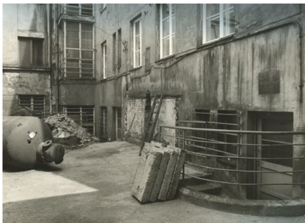
Dziedziniec Domu Śląskiego, wejście do byłych cel Gestapo, 1980