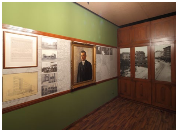
Fragment wystawy stałej Krakowianie wobec terroru 1939–1945–1956