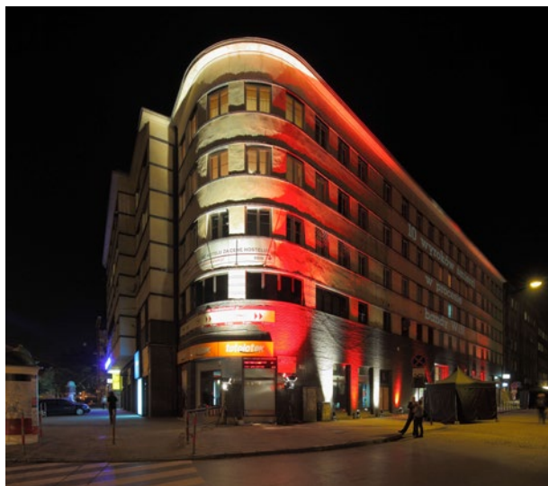
Dom Śląski od strony placu Inwalidów w czasie wernisazu wystawy stałej, 2 czerwca 2011 r.

Zwiedzającym udostępniono dwa schrony 43 . W ciągu jednej nocy zwiedziło je 3900 osób, w tym samym czasie wystawę stałą i cele Gestapo – 1600 osób. Uczestników Nocy Muzeów nie zrażało nawet oczekiwanie w długiej kolejce.