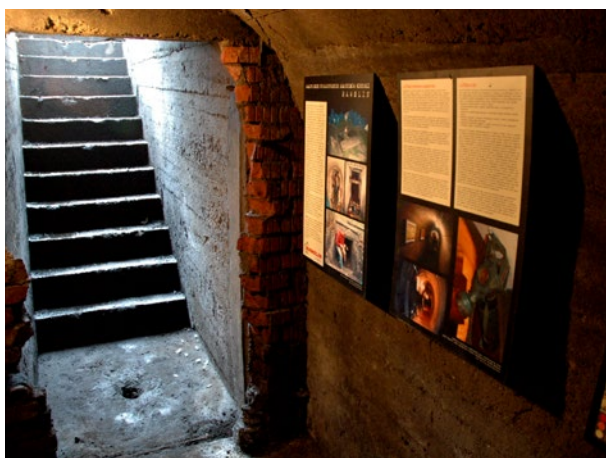
Wejście do poniemieckiego schronu przeciwlotniczego w parku Krakowskim. Schron udostępniony zwiedzającym przez MSMH Rawelin, 2012, w zbiorach prywatnych

otwarta w listopadzie 1999 roku. Po uruchomieniu oddziału Fabryka Emalia Oskara Schindlera pracownicy oddziału zyskali nowe, atrakcyjne miejsce do organizowania wystaw czasowych. Wystawy te poszerzały wątki, które zostały jedynie zasygnalizowane na wystawie stałej. Jedną z nich – Krakowscy Wyklęci – zdobyła nagrodę główną w plebiscycie na Wydarzenie Historyczne Roku 2014 w kategorii wystawy, organizowanym przez Muzeum Historii Polski.