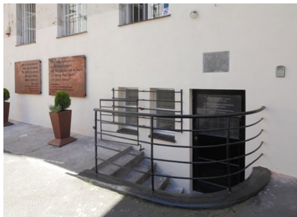
Dziedziniec Domu Śląskiego, wejście do byłych cel Gestapo, 2011