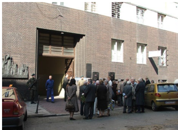
Uroczystości przed Domem Śląskim podczas zorganizowanego po raz pierwszy Dnia Pamięci Ofiar Gestapo, 14 września 2007 r.