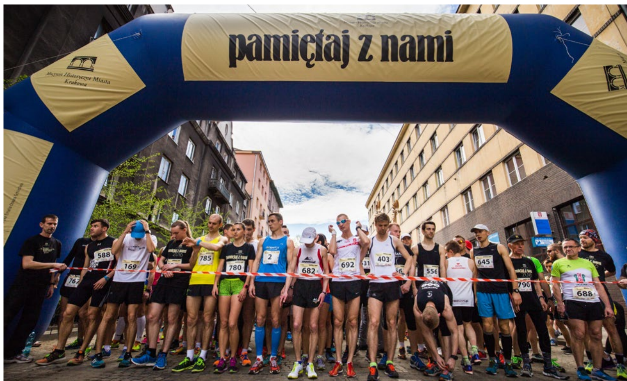
Bieg Pamiętaj z nami! . Start na ulicy Pomorskiej, 16 kwietnia 2016 r.