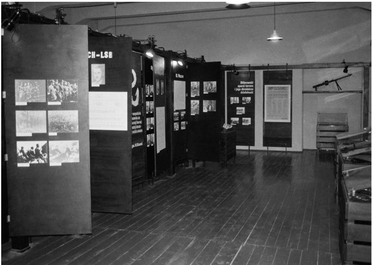
Fragment wystawy stałej Kraków 1939–1945 , 1990, fot. Józef Korzeniowski; w zbiorach MK