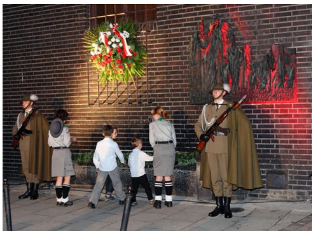
Otwarcie wystawy stałej Krakowianie wobec terroru 1939–1945–1956 , 2 czerwca 2011 r., fot. Tomasz Kalarus; w zbiorach MK