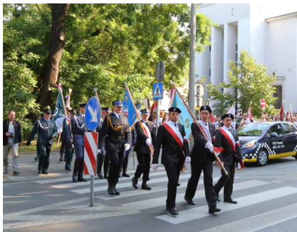
Poczty sztandarowe po zakończeniu mszy św. w kościele św. Szczepana przy ul. Sienkiewicza zmierzają w kierunku Domu Śląskiego, 9 września 2016 r.