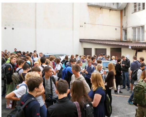
Młodzież szkolna na dziedzińcu Domu Śląskiego w oczekiwaniu na rozpoczęcie gry miejskiej Kraków świętych i żołnierzy , Dni Pamięci Ofiar Gestapo , 12 września 2014 r.

słabej promocji oddziału 52 . Pozytywną ocenę zwiedzających oddział potwierdzają dane z amerykańskiego agregatora opinii m.in. dla turystów – TripAdvisor, który wyróżnił