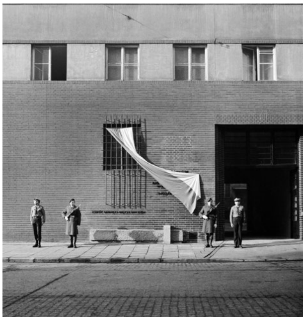
Uroczystość odsłonięcia Ściany Pamięci przy ul. Wybickiego 2 (dziś Pomorska 2), 17 stycznia 1975 r.