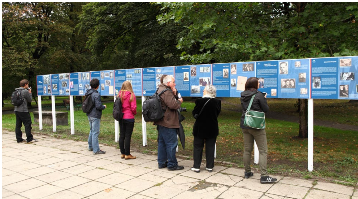
Wystawa plenerowa na placu Inwalidów Czemu ich to spotkało? , zorganizowana w ramach Dni Pamięci Ofiar Gestapo , 14 września 2012 r.

wystawę była duża (np. w 1984 roku 7365 osób indywidualnych oraz 203 zorganizowane grupy). W 1985 roku wystawa była udostępniana zwiedzającym tylko przez 85 dni, do 30 kwietnia 1985 roku, w tym czasie liczba zwiedzających wyniosła 3825 osób oraz 92 grupy zorganizowane 47 .