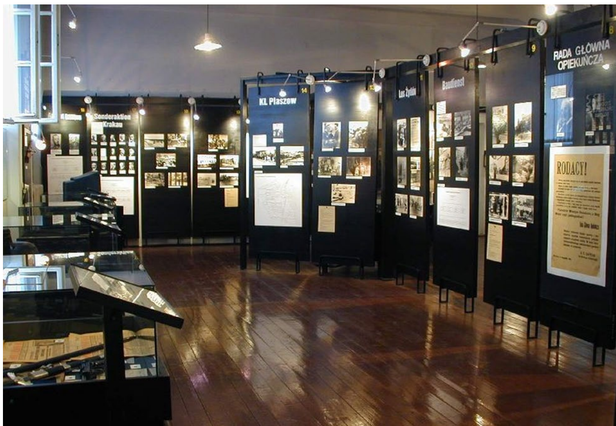
Fragment wystawy stałej Kraków 1939–1956, ok. 2005 r.