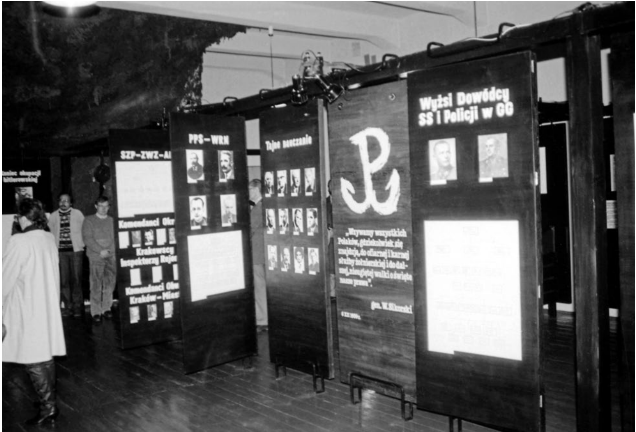
Fragment wystawy stałej Kraków 1939–1945 , 1990, fot. Józef Korzeniowski; w zbiorach MK