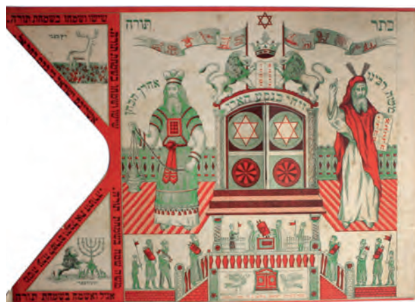
Ryc. 8. Chorągiewka na święto Simchat Tora, Warszawa, początek XX w.; nr inw. III/73319/D