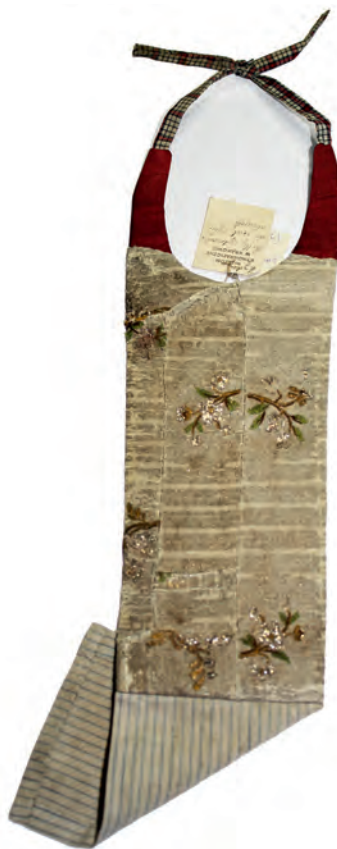
Ryc. 3. Założka, Polska, XVIII w. (?), dar Franciszka Gawełka (?); nr inw. 7077/MEK

MEK dwie załóżki (napierśniki o numerach inw. 4229/MEK i 4230/MEK), kołnierz do kitla (nr inw. 4231/MEK – ryc. 1) oraz dwie jarmułki (numery inw. 4233/MEK – ryc. 2, 4234/MEK), w tym jedną dziecięcą, pochodzące z Grodziska Wielkopolskiego. Dokładna datacja obiektów jest utrudniona z powodu braku szczegółowych danych dotyczących proveniencji, a także niezadowalającego stanu zachowania. Można jednak przypuszczać, że pochodzą one z początku XIX wieku.