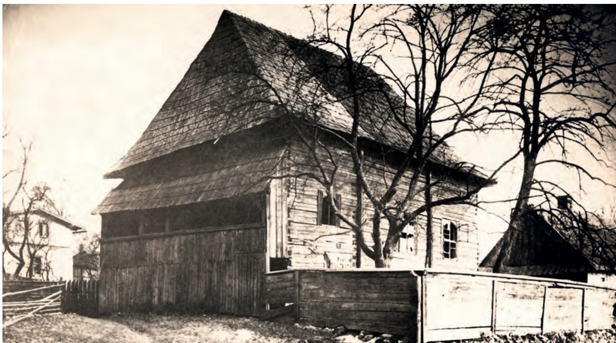
Ryc. 15. Synagoga w Cieszowej w powiecie lublinieckim, koniec XIX w. (?), nr inw. III/27615/F

MEK 72 . Fotografie o tematyce żydowskiej można podzielić zasadniczo na dwie grupy. Pierwsza z nich, licząca około 85 zdjęć, to ta, na której żydowska narodowość fotografowanych osób jest ujęta w oryginalnym podpisie autora oraz przedstawiające synagogi, cmentarze czy żydowskie dzielnice miast (ryc. 15). Drugą grupę, około 70 sztuk, można by określić jako fotografie typu Strassen Bilder, ukazujące scenki uliczne, targi, jarmarki, place, sklepy itp., na których wyraźnie obecni są żydowscy mieszkańcy, choć nie uwzględnia tego opis. Znani z nazwiska autorzy to m.in. Arven Schultz, Hans Praesent, Max Friederichsen czy Erich Wunderlich. Zasięg terytorialny uwiecznionych miejsc to w znakomitej większości teren Kongresówki (wyjątkiem są fotografie z krakowskiego Kazimierza) – Warszawa, Łódź, Łęczycza, Kutno, Łuków, Sandomierz, Biała Podlaska i inne.