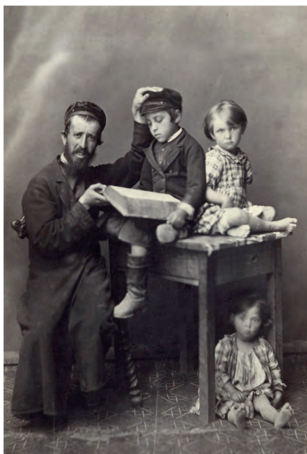
Ryc. 12. Typy izraelitów podolskich, Kamieniec Podolski, lata siedemdziesiąte (?) XIX w., fot. Michał Greim; nr inw. III/28/F

modelami, malowidłami, rysunkami i fotografiami. Do zbiorów muzealnych potrzebne są: 1. Modele, rysunki i fotografie kościołów, cerkwi i bóżnic drewnianych 60 .