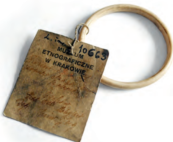
Ryc. 5. Wilczy ząb – dziecięcy talizman Żydów białoruskich, Mohylew, 1893, dar Stanisława Cerchy; nr inw. 10663/MEK