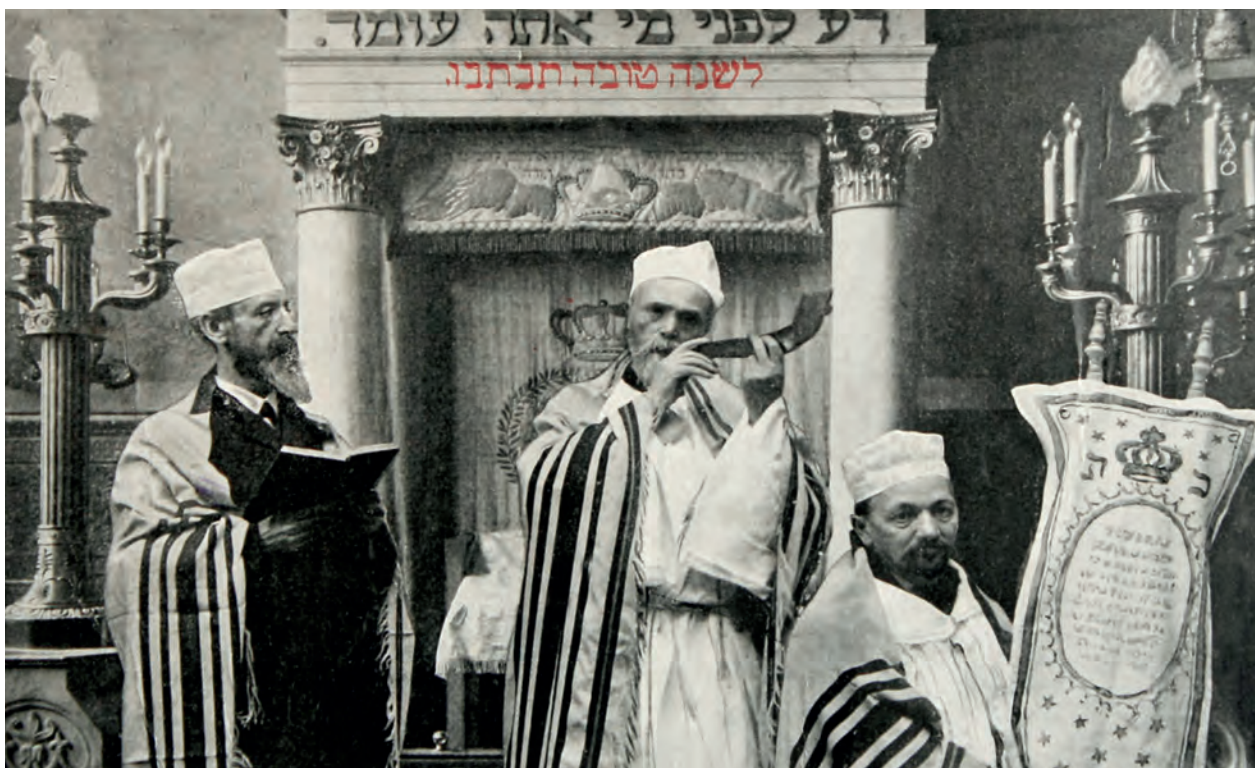
Ryc. 9. Pocztówka na Rosz ha-Szana, Polska, XIX/XX w.; nr inw. III/100/W

noworoczne w języku niemieckim i hebrajskim zawierają karty z serii Jüd[ische] Neuj[ahr] 36 , wydane w 1905 roku w Stanisławie 37 przez Norberta Ehrlicha. Podobnie datowane są także trzy karty pocztowe prezentujące Żydów jemeńskich na fotografiach Hermanna Burchardta z serii wydanej przez Orient-Verlag w Berlinie 38 . Pozostałe pojedyncze pocztówki (ryc. 9) również pochodzą z początku XX wieku, jak ta z 1902 roku – Die Chuppa, Trauung – z reprodukcją rysunku młodej pary pod ślubnym baldachimem w otoczeniu rabina i weselników 39 , czy kartka z 1914 roku zatytułowana Obrzucanie panny młodej – Das Bewerfen der Braut 40 .