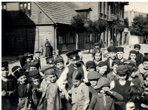
Ryc. 14. Dzieci żydowskie, Łódź Batuty, 1917, fot. Hans Praesent (Landeskundliche Kommission); nr inw. III/27549/F

uczniów szkoły żydowskiej w Kamieńcu 65 . Dokładne okoliczności pozyskania fotografii Greima, a także albumu Kopernickiego do zbioru MEK nie są do końca znane z uwagi na brak jakiegokolwiek ewidencji materiałów archiwalnych z czasów Udzieli. Prawdopodobnie należy ich jednak szukać we wspomnianej już współpracy Udzieli z Komisją Antropologiczną Akademii Umiejętności i możliwością ulokowania części jej zasobu w nowo powstałej placówce muzealnej 66 .