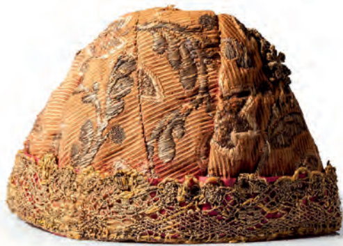
Ryc. 2. Jarmułka dziecięca, Grodzisk Wlkp., początek XIX w. (?), depozyt Edmunda Majkowskiego; nr inw. 4234/MEK