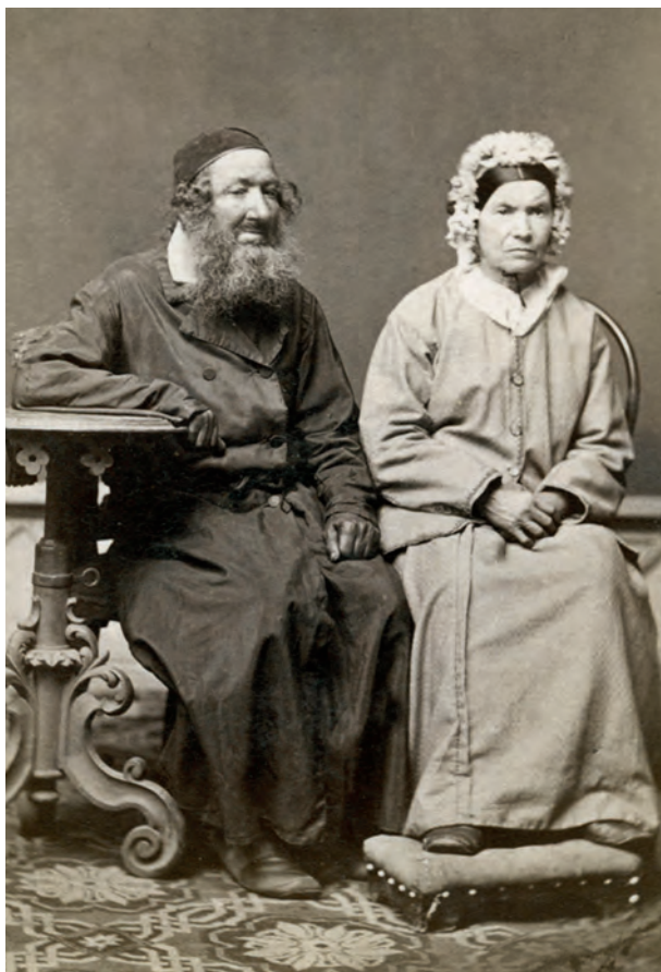
Ryc. 11. Para żydowska, Kraków, 1873; nr inw. III/57357/414/F