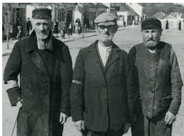
Ryc. 16. Żydzi z getta, Generalne Gubernatorstwo, ok. 1942 r., nr inw. III/80392/F