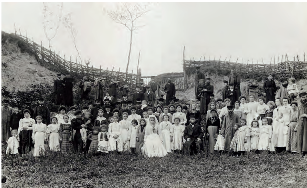
Ryc. 13. Żydowskie wesele pachciarza, Donosy, powiat Pinczów, 1901; nr inw. III/78442/F