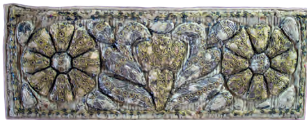
Ryc. 1. Koltnerz do kitla, Grodzisk Wlkp., początek XIX w. (?), depozyt Edmunda Majkowskiego; nr inw. 4231/MEK, fot. Łukasz Prędko

W tym miejscu należy również przywołać wystawę Sztuka ludowa zamieszkałych w Polsce Białorusinów, Litwinów, Rosjan, Słowaków, Ukraińców, Żydów , jaką z inicjatywy Ministerstwa Kultury i Sztuki zorganizowało Muzeum w 1960 roku. W dostarczeniu eksponatów pomagały m.in. Towarzystwa Społeczno-Kulturalne poszczególnych grup, w tym także Towarzystwo Społeczno-Kulturalne Żydów w Polsce. Była to jak dotąd bodaj jedyna wystawa MEK, na której, w dużej mierze opierając się na zbiorach własnych, zaprezentowano m.in. wybrane judaika. Założeniem wystawy była próba zobrazowania przeszłej i współczesnej sztuki ludowej cechującej wymie-