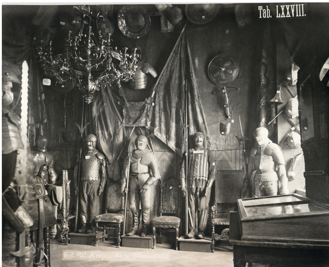
Ryc. 4. Sala wystawy starożytności w Warszawie w 1881 roku, fot. Władysław Krajewski. W: Album dzieł sztuki zastosowanej do przemysłu z wystawy urządzonej przez Muzeum Przemysłu i Rolnictwa w Warszawie w 1881 r. Warszawa [1883], tabl. LXXVIII; w zbiorach BN w Warszawie, sygn. A.2880/FXIX/IV-10

ustawiano i rozwieszano nie tak, jak byłoby logicznie, ale tak, jak pozwalały na to ich gabaryty i warunki lokalowe, a także niedostateczna liczba gablot 100 .