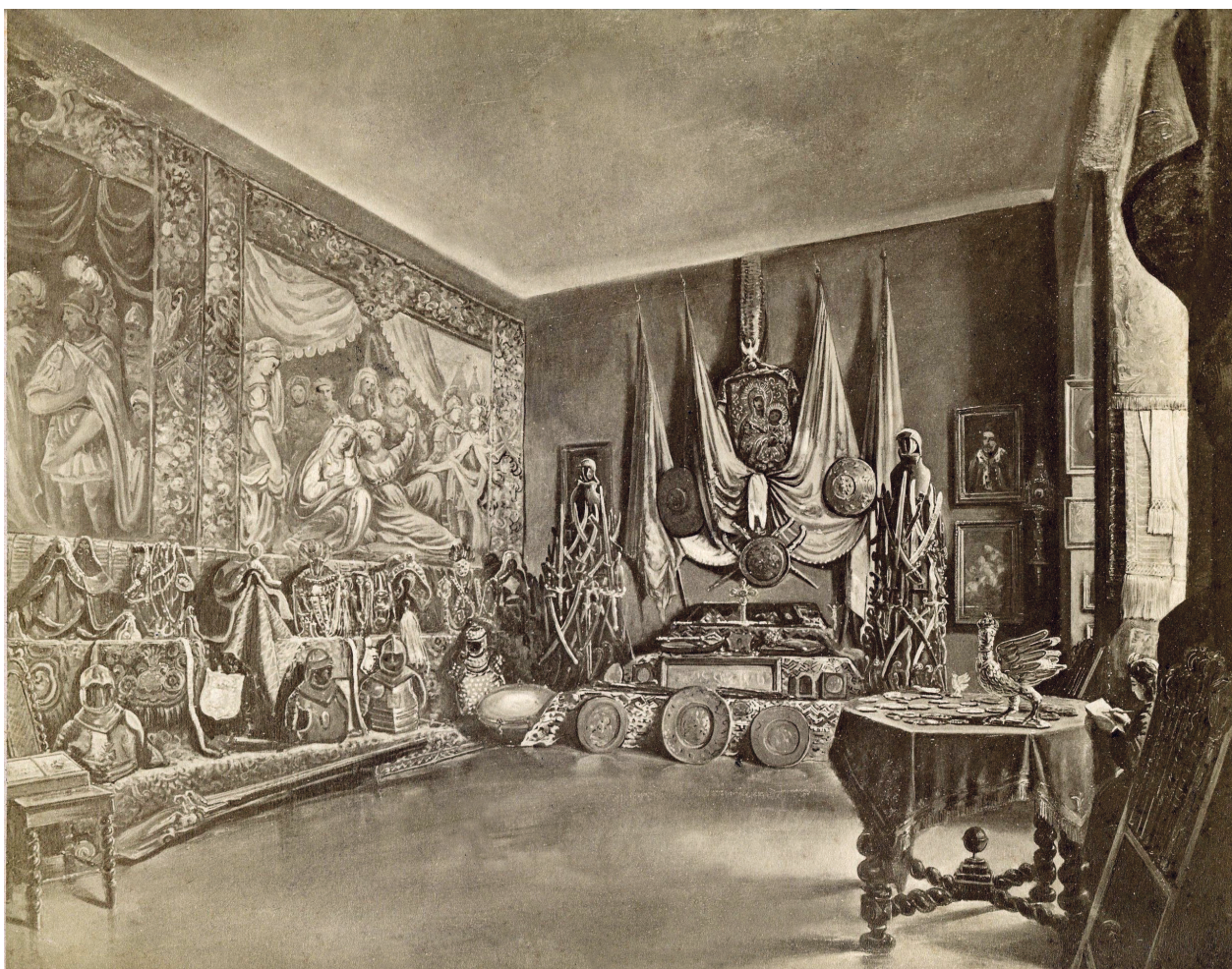
Ryc. 2. Saturnin Świerzyński, Sala trzecia wystawy starożytności, 1873, fot. Awit Szubert (?), 1873, odbitka albuminowa; w zbiorach Fototeki IHS UJ, sygn. IHSUJ P 019822

Bartynowskiego do Zygmunta Celichowskiego 15 , będącym jedyną znaną mi relacją z wystawy spoza prasy.