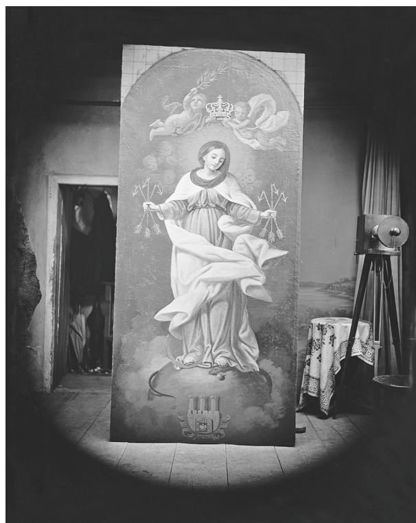
Obraz Matki Boskiej Łaskawej na elewacji północnej kościoła Mariackiego w Krakowie, fot. Ignacy Krieger, 1876; w zbiorach MHK, nr inw. MHK-2131/K

Archiwum WUOZ w Krakowie, Skrzydlak Ewa: „Dokumentacja powykonawcza konserwacji obrazu Matki Bo-