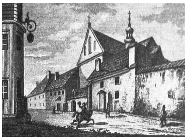
Kościół Św. Kazimierza XX Reformatów (widziany z Frontu)