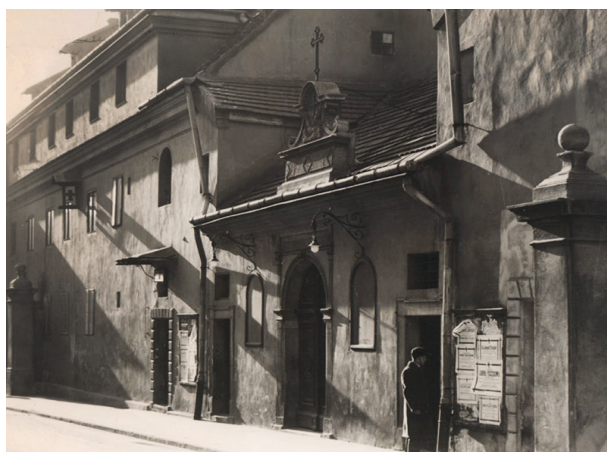
Kościół św. Kazimierza i klasztor Reformatów przy ul. Reformackiej w Krakowie, przed 1939 r., autor fotografii nieznanymi; w zbiorach MHK, nr inw. MHK-Fs 2720/IX

łowego rozpoznania stwierdzono widoczne drobne retusze obrazu, być może wykonane w 1867 roku. Obrazy zostały odczyszczane z brudu, usunięto pociemniałe retusze i pozostałości werniks zmieniający kolorystykę, zaimpregnowano deski od odwrocia. Zostały pokryte werniksem matowym, a malarstwo scalono kolorystycznie 28 .