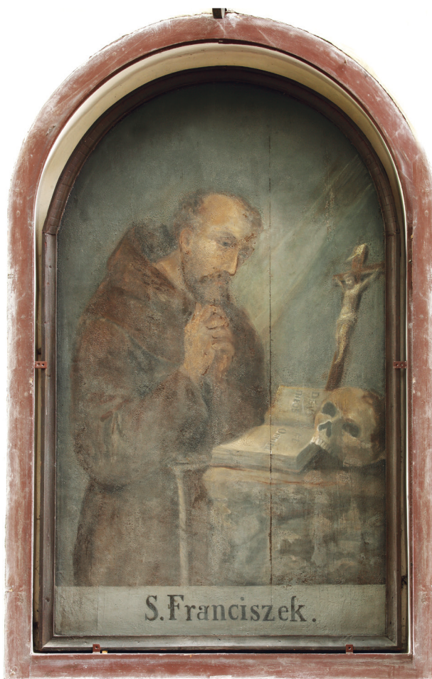
Obraz św. Franciszka z 1822 r. na elewacji frontowej kościoła Franciszkanów Reformatów w Krakowie, fot. Tomasz Kalarus, 2016

turem, przewiązany w pasie sznurem. U dołu obrazu napis: S. Franciszek.