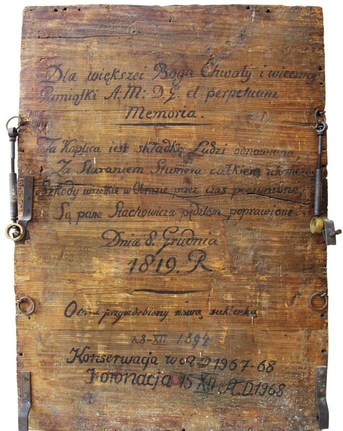
Odwrócie obrazu Matki Boskiej Częstochowskiej w kościele Mariackim w Krakowie, fot. Ewa Skrzydlak, 2010

Drugi obraz odnawiany przez Stachowicza to wizerunek Matki Boskiej Łaskawej w typie Immaculata (Niepokalanej), znajdujący się na elewacji północnej kościoła Mariackiego, namalowany techniką olejną na płótnie przez nieznanego autora na początku XVIII wieku. Historia tego obrazu sięga roku 1707, kiedy podczas panującej zarazy na polecenie burmistrza Michała Bema wymalowano na zewnątrz na północnej ścianie kościoła wizerunek Matki Boskiej „we-