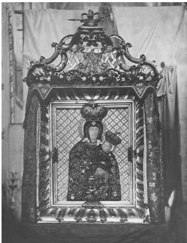
Obraz Matki Boskiej Różańcowej w kościele Dominikanów w Krakowie, fot. Ignacy Krieger, ok. 1875 r.; w zbiorach MHK, nr inw. MHK-2095/K

czym oraz szat stwierdzono podczas konserwacji wykonanej w 2001 roku 14 .