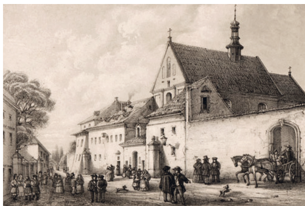
Kościół św. Kazimierza i klasztor Reformatów przy ul. Reformackiej w Krakowie, Henryk Walter, ok. 1863 r.; w zbiorach MHK, nr inw. MHK-336/VIII