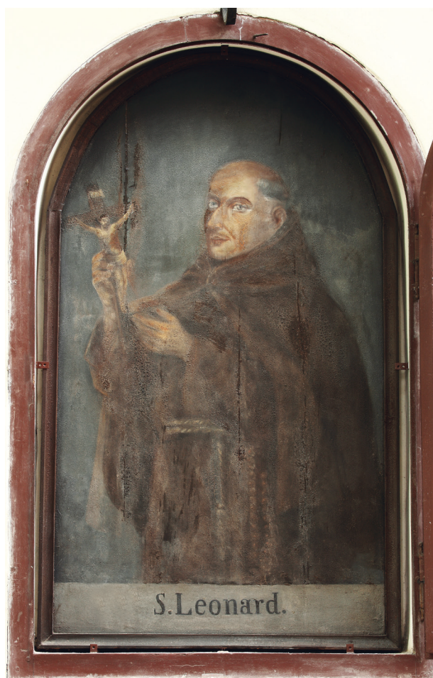
Obraz św. Leonarda z 1822 r. na elewacji frontowej kościoła Franciszkanów Reformatów w Krakowie