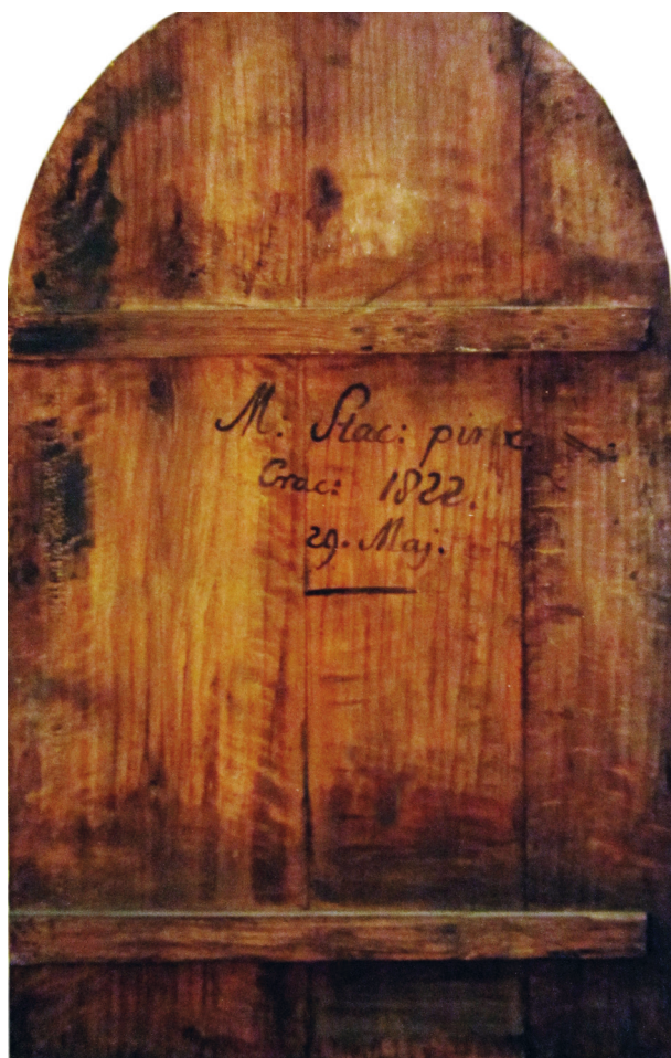
Odwrócenie obrazu św. Leonarda na elewacji frontowej kościoła Franciszkanów Reformatów w Krakowie, fot. Maria Lisowska-Dziuba, 1997