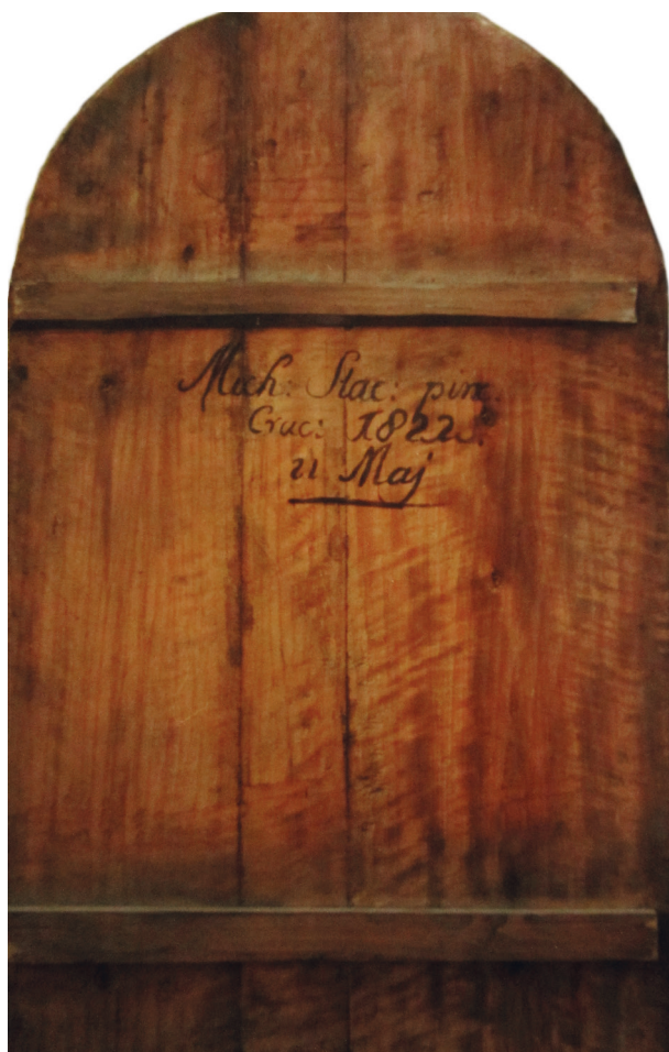
Odwrocie obrazu św. Franciszka na elewacji frontowej kościoła Franciszkanów Reformatów w Krakowie, fot. Maria Lisowska-Dziuba, 1997

Obrazy zostały wykonane w 1822 roku, gdy gwardianem był o. Antoni Kaczorkiewicz 23 , jednak nie od razu zostały umieszczone na elewacji kościoła. Stało się tak naj-