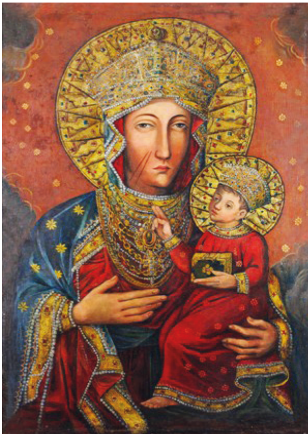
Obraz Matki Boskiej Częstochowskiej w kościele Mariackim w Krakowie, XVII w., fot. Piotr Guzik, 2010

nimbów Marii i Dzieciątka. Różnice występują również w ozdobnym galonie maforionu Matki Boskiej. Pierwotnie był obszyty dwoma sznurami pereł z segmentowym motywem pośrodku w formie stylizowanych kasetonów z kamieniami. Na kliszy rentgenowskiej widoczne są niewielkie różnice w udrapowaniu fałd maforionu pod jej prawą dłoń. Podczas tej konserwacji malarz nie dokonał natomiast zmian w obrębie twarzy – miało to miejsce podczas konserwacji przeprowadzonej w 1894 roku. Równocześnie stwierdzono, że pod przemalowaniem wykonanym zapewne przez Michała Stachowicza znajduje się pierwotne malowidło, które na tym etapie badań nie mogło być rozpoznane.