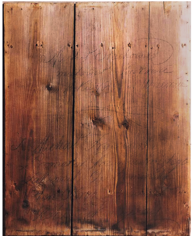
Odwrócenie obrazu Matki Boskiej Różańcowej na elewacji kamienicy przy ul. Mikołajskiej 20–22 w Krakowie, 2001

Obraz o wymiarach 1,30 na 96 cm namalowano techniką olejną na płótnie napiętym na drewniany podkład, składający się z trzech desek z dwoma poprzecznymi szponkami. Obramiony jest drewnianą, profilowaną ramą w kolorze zielonym. W 2001 roku podczas prac remontowo-konserwatorskich budynku obraz został zdemontowany i zakonserwowany przez Marię Marzec i Beatę Kowalczyk. Zarówno konserwatorzy, jak i historycy sztuki niewiele o nim wcześniej wiedzieli 7 . Tymczasem znalezione na nim inskrypcje ujawniły nie tylko autora, ale i historię powstania dzieła.