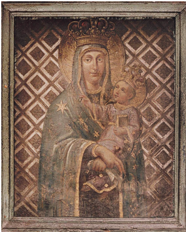
Obraz Matki Boskiej Różańcowej na elewacji kamienicy przy ul. Mikołajskiej 20–22 w Krakowie, fot. Maria Marzec, Beata Kowalczyk, 2001

Jednym z przykładów pracy renowatorskiej Stachowicza są dwa obrazy – Matki Boskiej z Dzieciątkiem w kaplicy pod tym wezwaniem w kościele Mariackim w Krakowie oraz Matki Boskiej Łaskawej umieszczone na elewacji północnej tegoż kościoła.