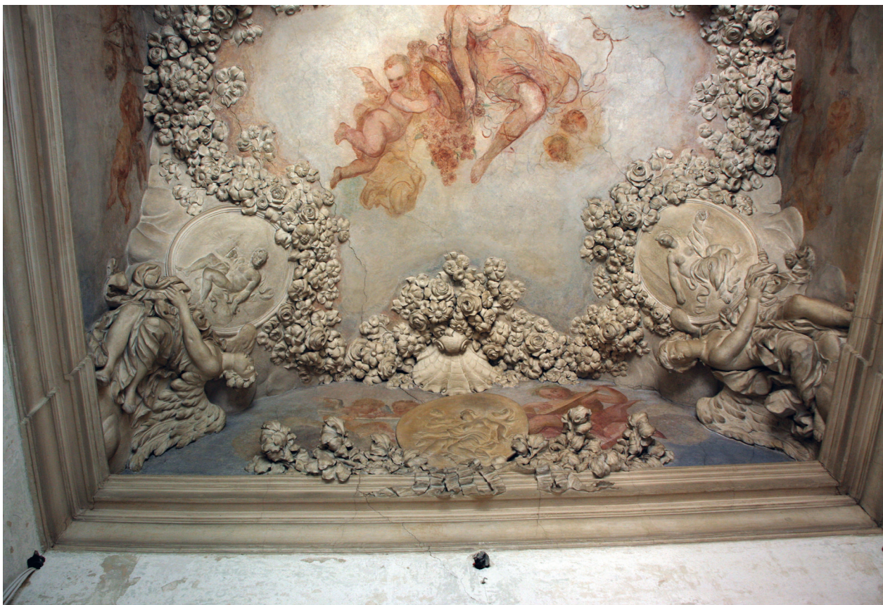
Pałac pod Krzysztofory, skrzydło zachodnie, tzw. kaplica. Dekoracja sztukatorska sklepienia Baltazara Fontany, widok strony południowej, stan przed konserwacją; fot. Danuta Mazur