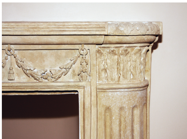
Kominek na ścianie południowej, detal, stan po konserwacji