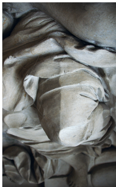
Dekoracja sztukatorska sklepienia tzw. kaplicy, detal, stan w trakcie konserwacji