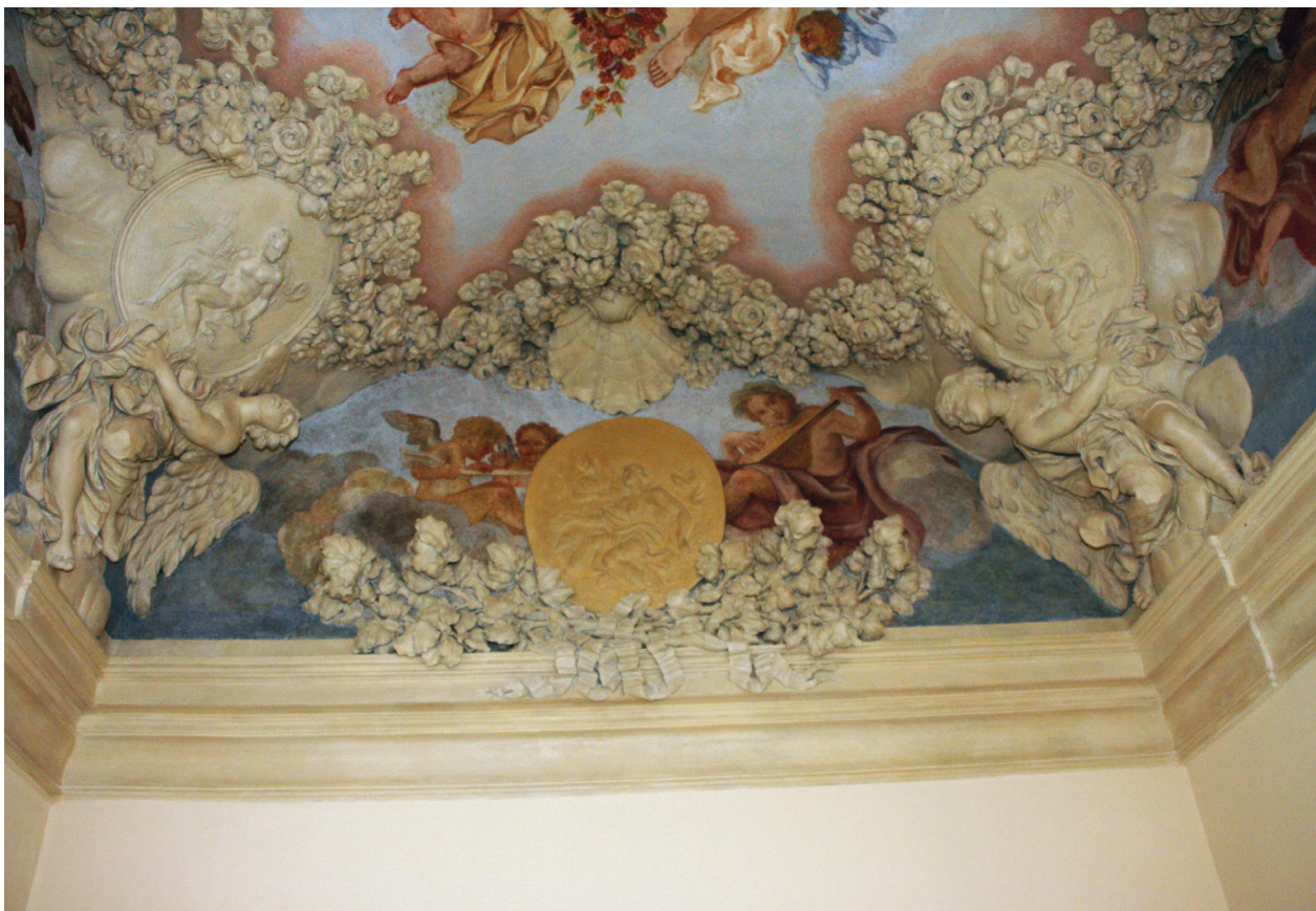
Pałac pod Krzysztofory, skrzydło zachodnie, tzw. kaplica. Dekoracja sztukatorska sklepienia Baltazara Fontany, widok strony południowej, stan po konserwacji