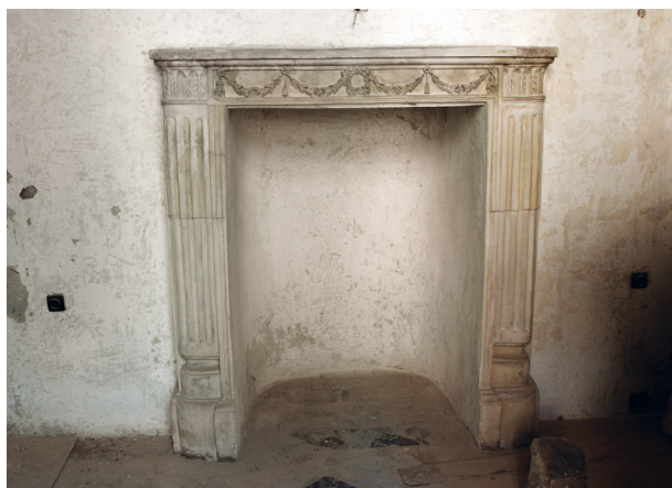
Kominek na ścianie południowej, widok całości, stan przed konserwacją