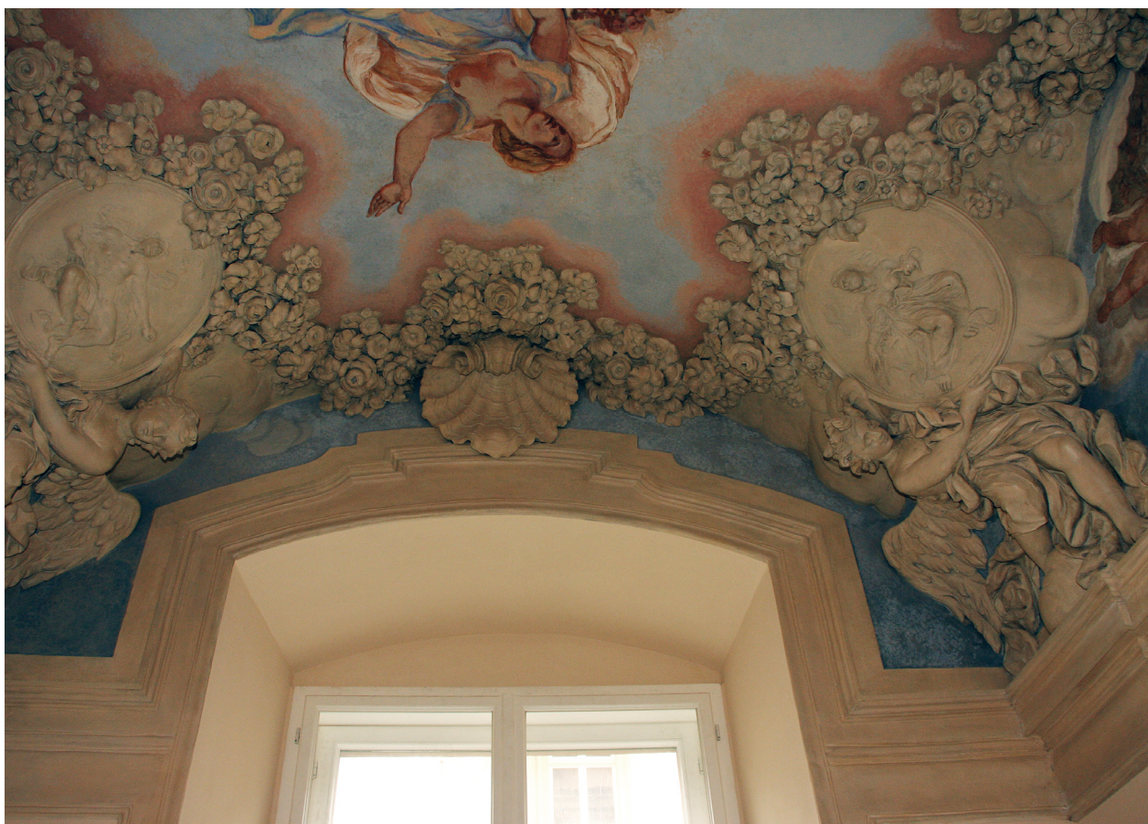
Dekoracja sztukatorska tzw. kaplicy, widok strony północnej, stan po konserwacji