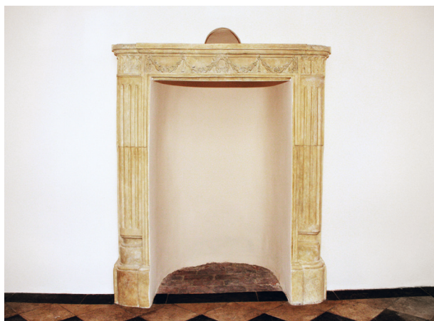
Kominek na ścianie południowej, widok całości, stan po konserwacji; fot. Danuta Mazur