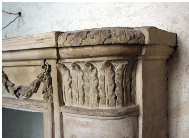
Kominek na ścianie południowej, detal, stan przed konserwacją