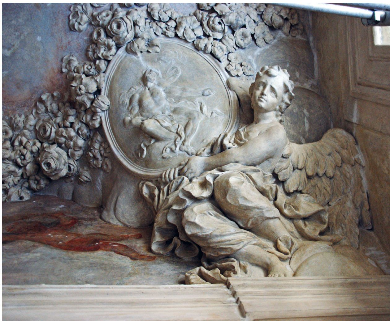
Dekoracja sztukatorska sklepienia tzw. kaplicy, fragment, stan w trakcie konserwacji