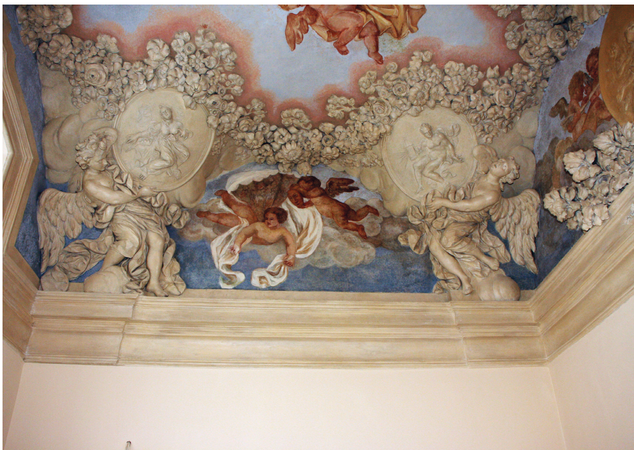
Dekoracja sztukatorska sklepienia tzw. kaplicy, widok strony wschodniej, stan po konserwacji