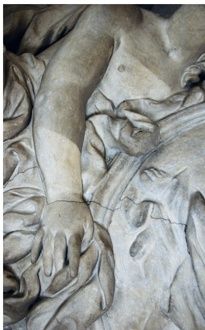
Dekoracja sztukatorska sklepienia tzw. kaplicy, detal, stan w trakcie konserwacji