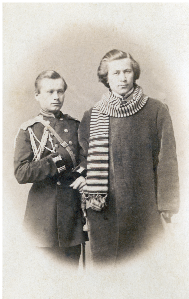
Jarosław Dąbrowski z bratem Teofilem, 1862, Karol Beyer; w zbiorach MHK, nr inw. MHK-Fs4069/IX/10

Wśród zdjęć wykonanych w zakładzie Beyera znalazły się wizerunki trzech partyzantów: Władysława Ostaszewskiego (1823–1863) 40 , oficera pruskiego, a w powstaniu dowódcę batalionu strzelców, poległego pod Kietlanką 13 maja 1863 roku, Ignacego Mystkowskiego (1826–1863) 41 , inżyniera zatrudnionego przed 1863 rokiem przy budowie Kolei Warszawsko-Petersburskiej, a w powstaniu naczelnika na powiat ostrołęcki, pułtuski, przasnyski, który zorganizował jednostkę powstańczą na Kurpiowszczyźnie, i także zginął w ataku na pociąg pod Kietlanką, oraz Ludwika Fryczygo 42 , który zginął pod Rydzewem 8 września 1863 roku. To ostatnie zdjęcie zostało błędnie podpisane na rewersie jako „Karol Fritsch”. Karol Frycze (1830–1863) 43 , pisany także Fritsch lub Frytsch, był bratem Ludwika, został ciężko