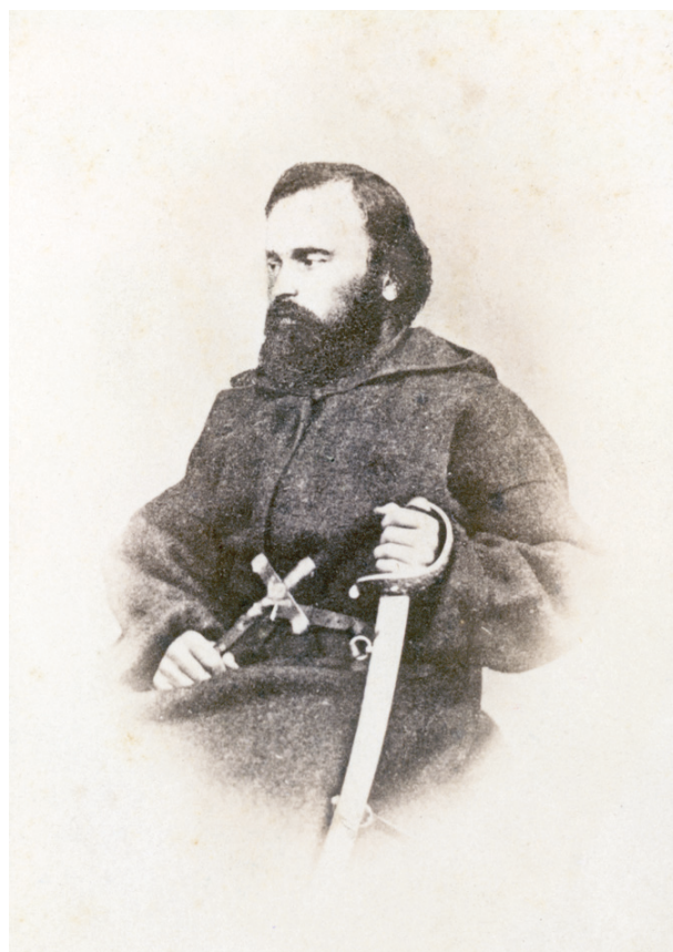
Nierozpoznany powstaniec styczniowy (opisywany jako ks. Antoni Mackiewicz), 1863, autor fotografii nieznaną; w zbiorach MHK, nr inv. MHK-Fs4452/IX/36