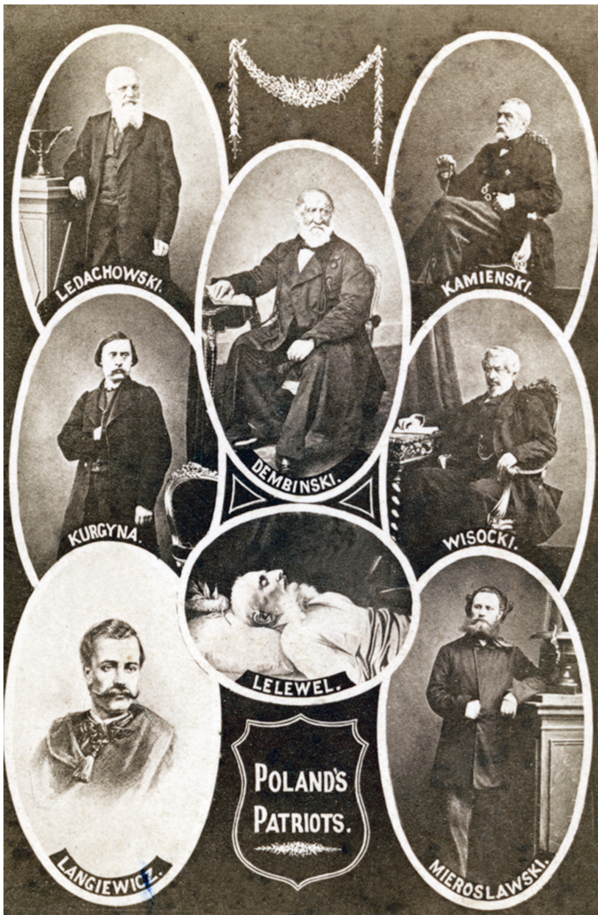
Tableau Poland's Patriots, ok. 1863–1865, Ashford Brothers Co.; w zbiorach MHK, nr inw. MHK-Fs4452/IX/65