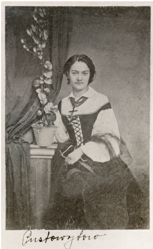
Henryka Pustowójtówna, ok. 1862, autor fotografii nieznanymi; w zbiorach MHK, nr inw. MHK-Fs4056/IX/16

ten sam, portret Kazimierza Mielęckiego (1837–1863) 23 , ziemianina z Poznańskiego, naczelnika sił zbrojnych województwa mazowieckiego, zmarłego na skutek ciężkiej rany, otrzymanej w czasie bitwy pod Olszakiem. Inni uczestnicy powstania to: Antoni Jeziorański (1821–1882) 24 , oficer armii tureckiej, w powstaniu naczelnik wojenny województwa lubelskiego, Władysław Niegolewski (1819–1885) 25 , polityk wielkopolski, ochotnik w oddziale Edmunda Taczanowskiego, Edmund Callier (1833–1893) 26 , współorganizator oddziału w zgrupowaniu Mielęckiego.