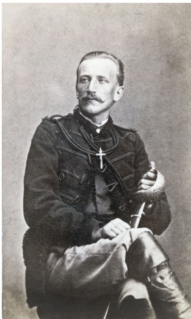
Karol Kalita de Brenzenheim, 1863, autor fotografii nieznan; w zbiorach MHK, nr inw. MHK-Fs4452/IX/64

obronę sprawy narodowej. Po lutowych wypadkach warszawskich, w marcu 1861 roku został wezwany przez Komitet Towarzystwa Rolniczego, a po powrocie złożył projekt wniosku o zmianie traktatu wersalskiego na korzyść Polski.