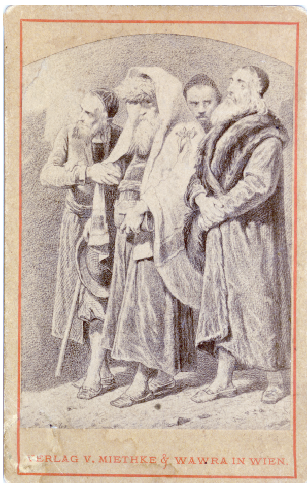
Żydzi warszawscy, rys. Artur Grottger, karton IV cyklu Warszawa I, 1861, Miethke & Wawra; w zbiorach MHK, nr inw. MHK-Fs4452/IX/10