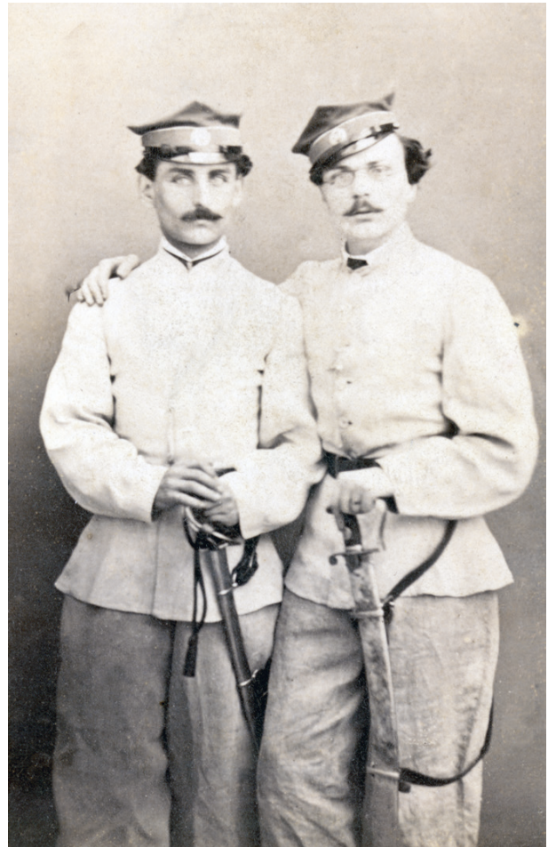
Dwaj studenci szkoły wojskowej w Cuneo, 1862