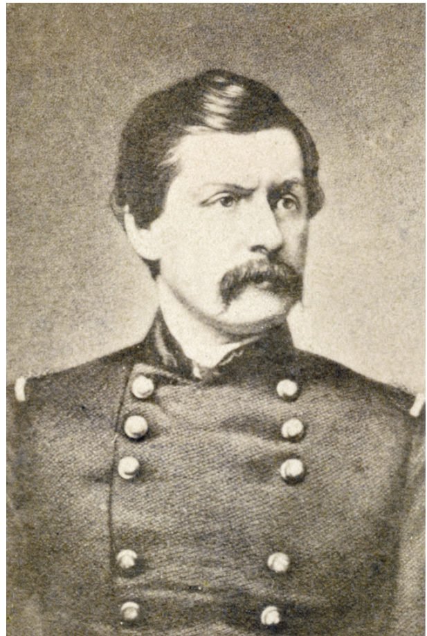
Ludwik Narbutt, ok. 1863, autor fotografii nieznaną; w zbiorach MHK, nr inw. MHK-Fs4492/IX/9

wstaniu dowodził oddziałem na Żmudzi, raniony w bitwie pod Sznurkiszkami, dostał się do niewoli i został powieszony 27 czerwca 1863 roku w Wilnie. Nalepkę firmy Bogdanowicza posiada też fotografia alegorycznej ryciny o patriotycznej wymowie – „Chrystus wskrzeszający Polskę” 68 .