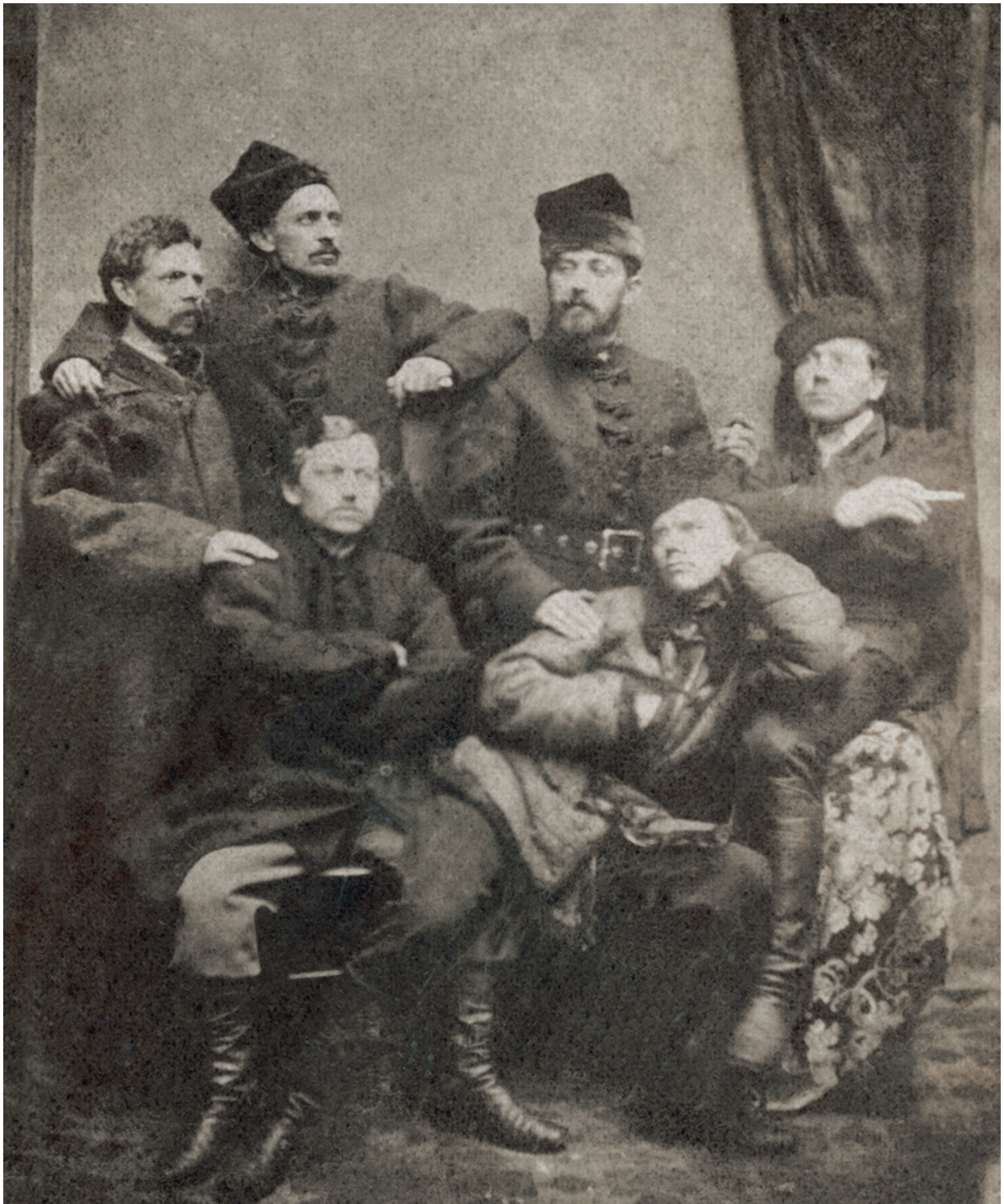
Grupa powstańców, przed 18 marca 1863 r., autor fotografii nieznanym; w zbiorach MHK, nr inw. MHK-Fs4452/IX/90