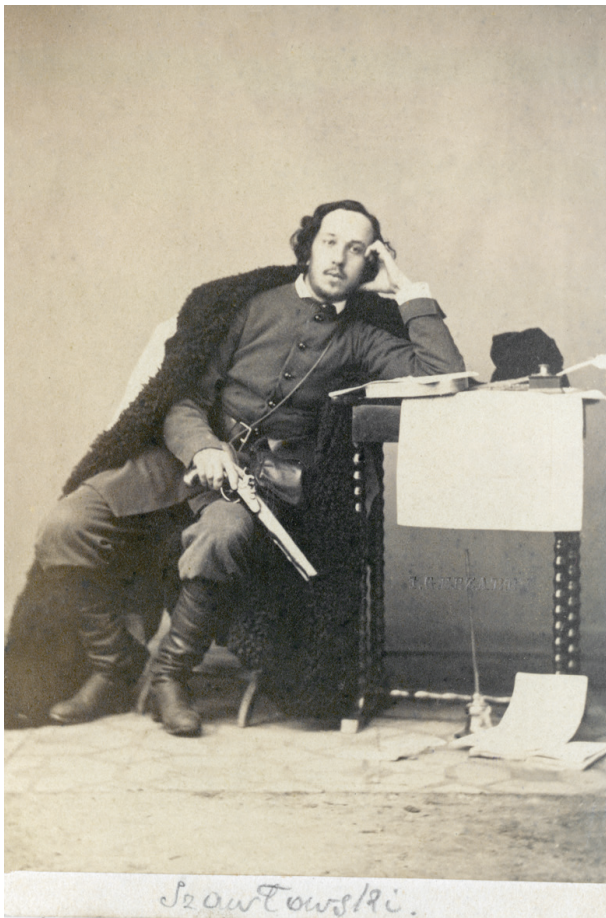
Szawłowski, 1863–1864, J.G. Erzarek; w zbiorach MHK, nr inw. MHK-Fs4492/IX/11

kapucyna, noszącego w zakonie imię Agrypin, misjonarza w Konstantynopolu i Bułgarii, w powstaniu kapelana m.in. w oddziale Czachowskiego, słynącego z brawurowej odwagi, który został ujęty na początku czerwca 1863 roku, był więziony w Cytadeli warszawskiej, a następnie 12 czerwca stracony; Zygmunta Sierakowskiego (1827–1863) 67 pseudonim Dołęga, absolwenta Akademii Sztabu Generalnego w Petersburgu, założyciela tajnego koła oficerów polskich w tym mieście, podpułkownika armii carskiej, który w po-