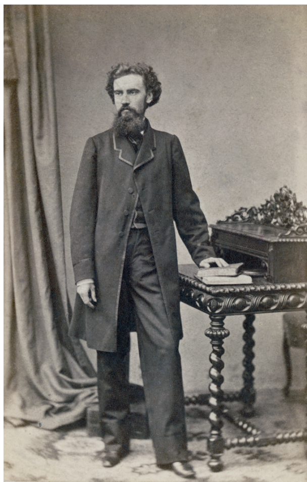
Witold Marczewski, 1861–1863, Jan Mieczkowski; w zbiorach MHK, nr inw. MHK-Fs4069/IX/17

Nie nosi sygnatury fotokopia podobizny działacza rewolucyjnego Leona Frankowskiego (1842–1863) 55 , współorganizatora manifestacji patriotyczno-religijnych w Królestwie Polskim. Po wybuchu powstania zorganizował oddział stu-