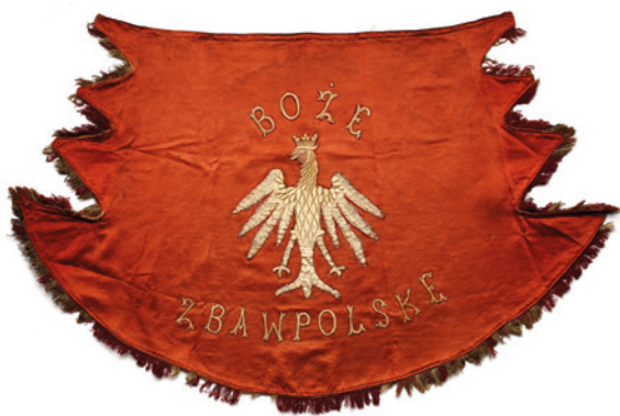
Makata z okresu powstania styczniowego, 1863 r.; w zbiorach Muzeum Historycznego Miasta Krakowa, nr MHK 6026/III; fot. T. Kalarus