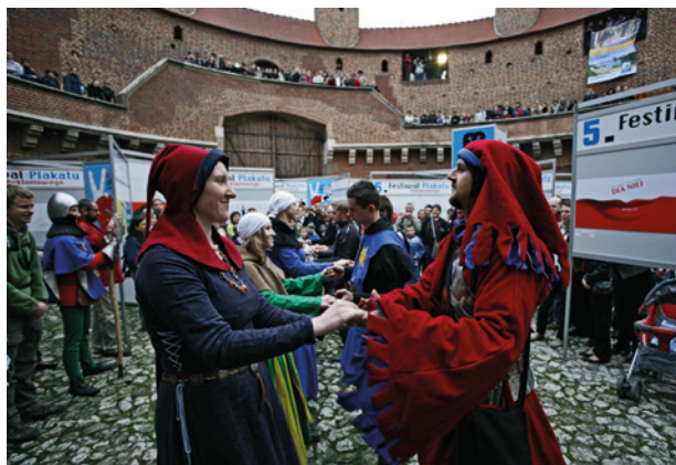
Noc Muzeów w Barbakanie, 14 maja 2010 r.