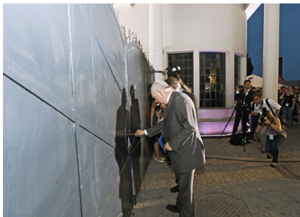
Uroczysty wernisaż wystawy Kraków – czas okupacji 1939–1945, prezydent Krakowa Jacek Majchrowski otwiera bramę do Fabryki Emalia Oskara Schindlera, dokonując w ten sposób symbolicznego otwarcia muzeum, 10 czerwca 2010 r.