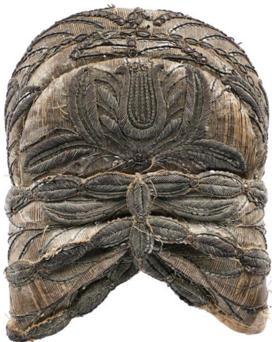
Czepiec kobiecy, koniec XVIII w.; w zbiorach Muzeum Historycznego Miasta Krakowa, nr inw. MHK 960/VII

I wreszcie, przechodząc do ostatniego projektu strategicznego MHK, przygotowany został zakres pierwszego etapu robót budowlanych w obiekcie przy ulicy Księcia Józefa 337, obejmujący głównie prace w przyziemiu oraz budowę zewnętrznego szybu windowego. Ogłoszono przetarg na te zadania. Podpisanie umowy z wykonawcą (firma Stambud) nastąpiło w lutym 2011 roku. Sytuacja projektu Thesaurus Cracoviensis była niekorzystna. Muzeum nie dysponowało środkami finansowymi na jego realizację. Zbiory MHK przechowywano tymczasowo w Domu Pod Kryżem (od 2008 roku) i w szkole przy ulicy Stanisława ze Skalbmierza. Stąd też decyzja władz MHK, aby rezerwy finansowe wypracowane w trakcie roku przeznaczyć na pierwszy etap budowy nowych magazynów (ostatecznie prace te rozpoczęto w marcu 2011 roku). Wstępnie zdecydowano również, aby cały zysk instytucji za rok 2010 przeznaczyć na prace budowlane, które będą prowadzone w tym obiekcie w 2011 roku.