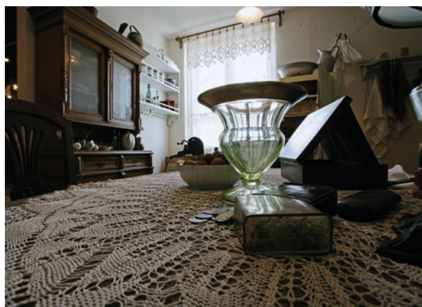
Fragment wystawy Kraków – czas okupacji 1939–1945

Thank you very much for the fantastic tour of the permanent Exhibition at Schindler's Factory Museum last week. My wife and I, along with all the other participants of the opening ceremony, appreciated you and your colleagues' efforts in making the most difficult time in Kraków's history come alive for the future generations.