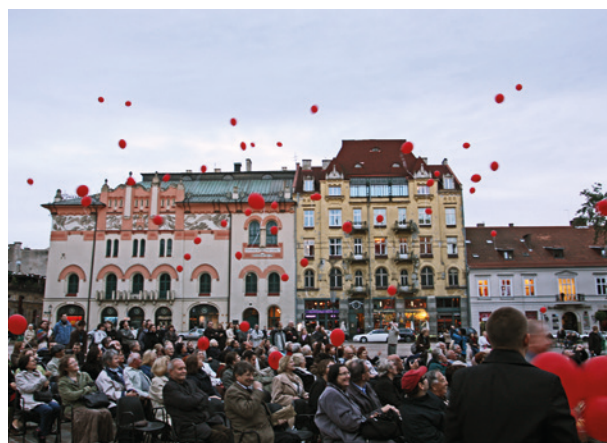
Czerwone baloniki nad placem Szczepańskim w czasie wernisażu wystawy Wielki Kraków – wielkie szanse 1910–2010; fot. M. Kocbuch