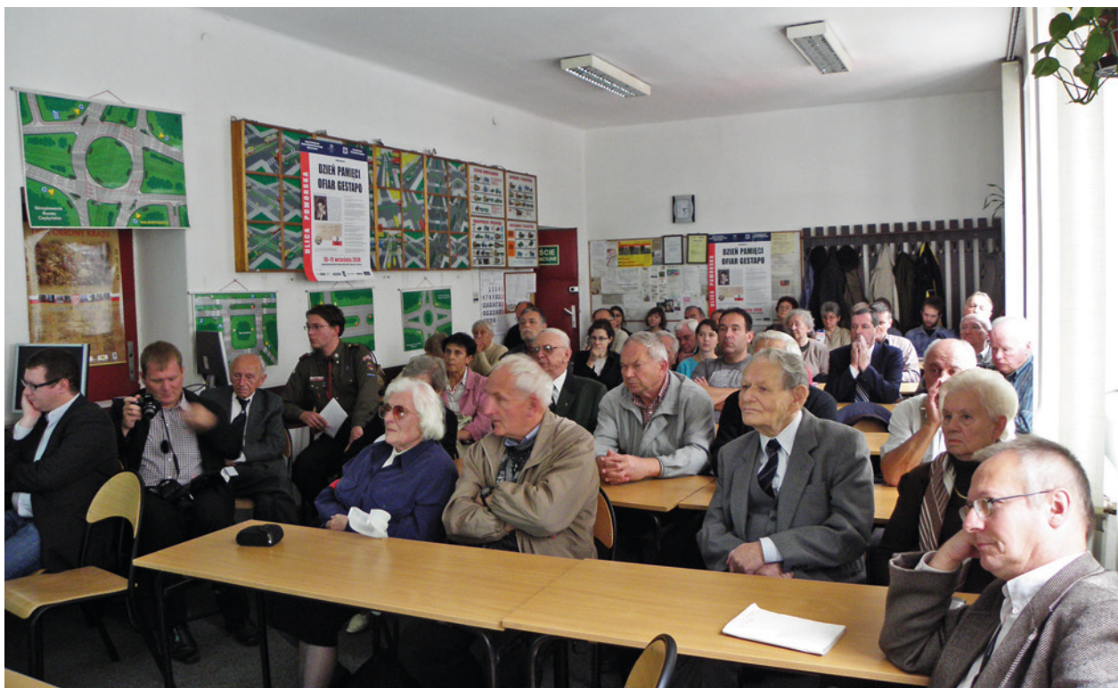
Seminarium na temat krakowskich Szarych Szeregów w czasie Dnia Pamięci Ofiar Gestapo, oddział Ulica Pomorska, 11 września 2010 r.