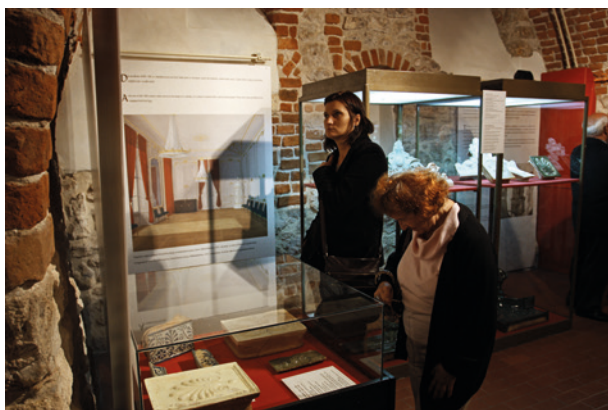
Fragment ekspozycji Calor amicus, czyli o kaflu i piecu, Kamienica Hipolitów, 29 września 2010 r.