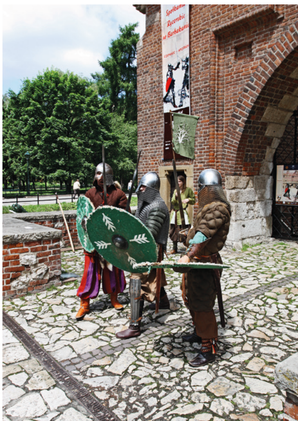
Spotkanie Rycerskie w Barbakanie, 26 czerwca 2010 r.