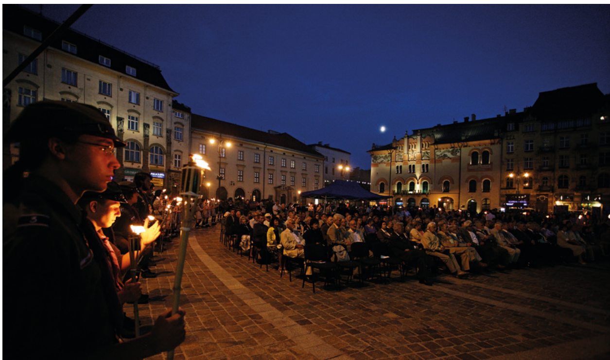
Plac Szczepański w czasie uroczystości otwarcia wystawy Ojczyzna – nauka – cnota. Jubileuszowa wystawa harcerska 1910–2010