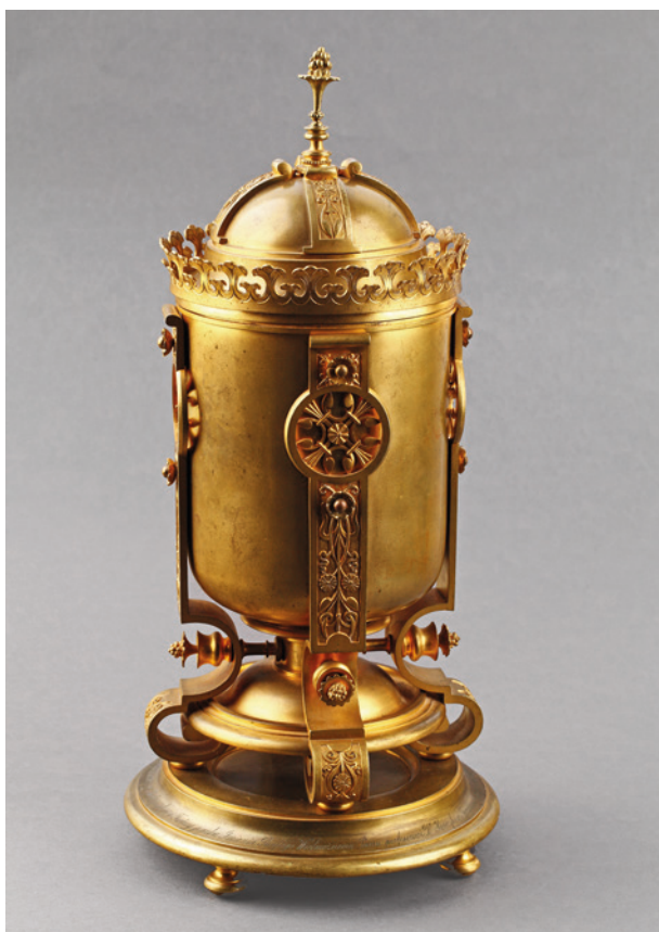
Puchar z dedykacją dla Henryka Jordana, 1891 r.; w zbiorach Muzeum Historycznego Miasta Krakowa, nr inw. MHK 6028/III