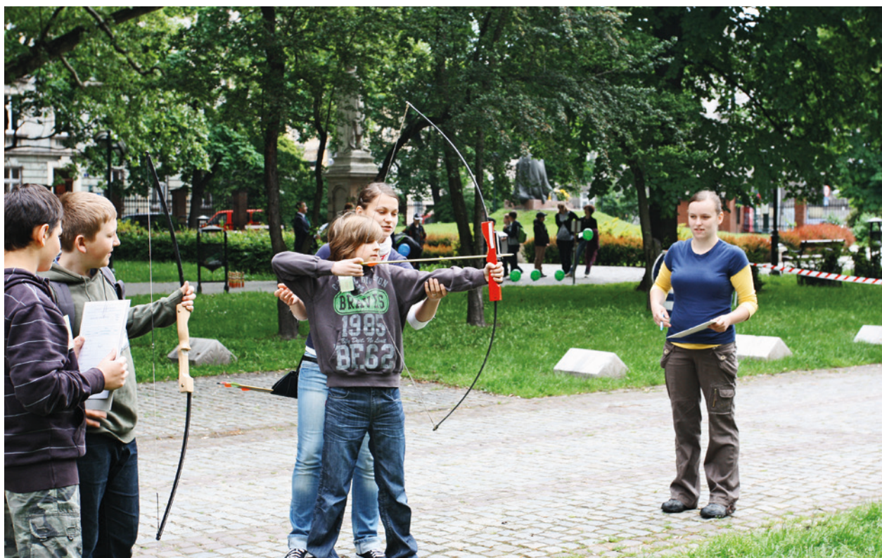
Finale Konkursu o tytuł Małego Króla Kurkowego, Celestat, 29 maja 2010 r.

Współpracowano z Radami Dzielnic w organizacji konkursów adresowanych do mieszkańców dzielnic, m.in. Prądnik Czerwony – w 100-lecie Wielkiego Krakowa .