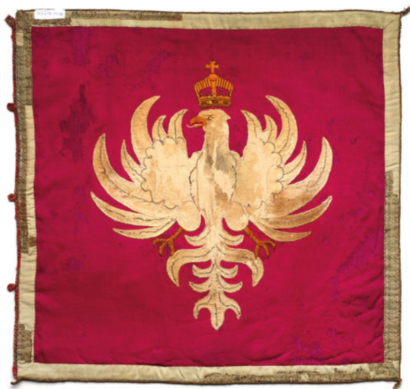
Sztandar Chorągwi Krakowskiej ZHP, lata 20.–30. XX w., awers i rewers; w zbiorach Muzeum Historycznego Miasta Krakowa, nr inw. MHK 1021aH