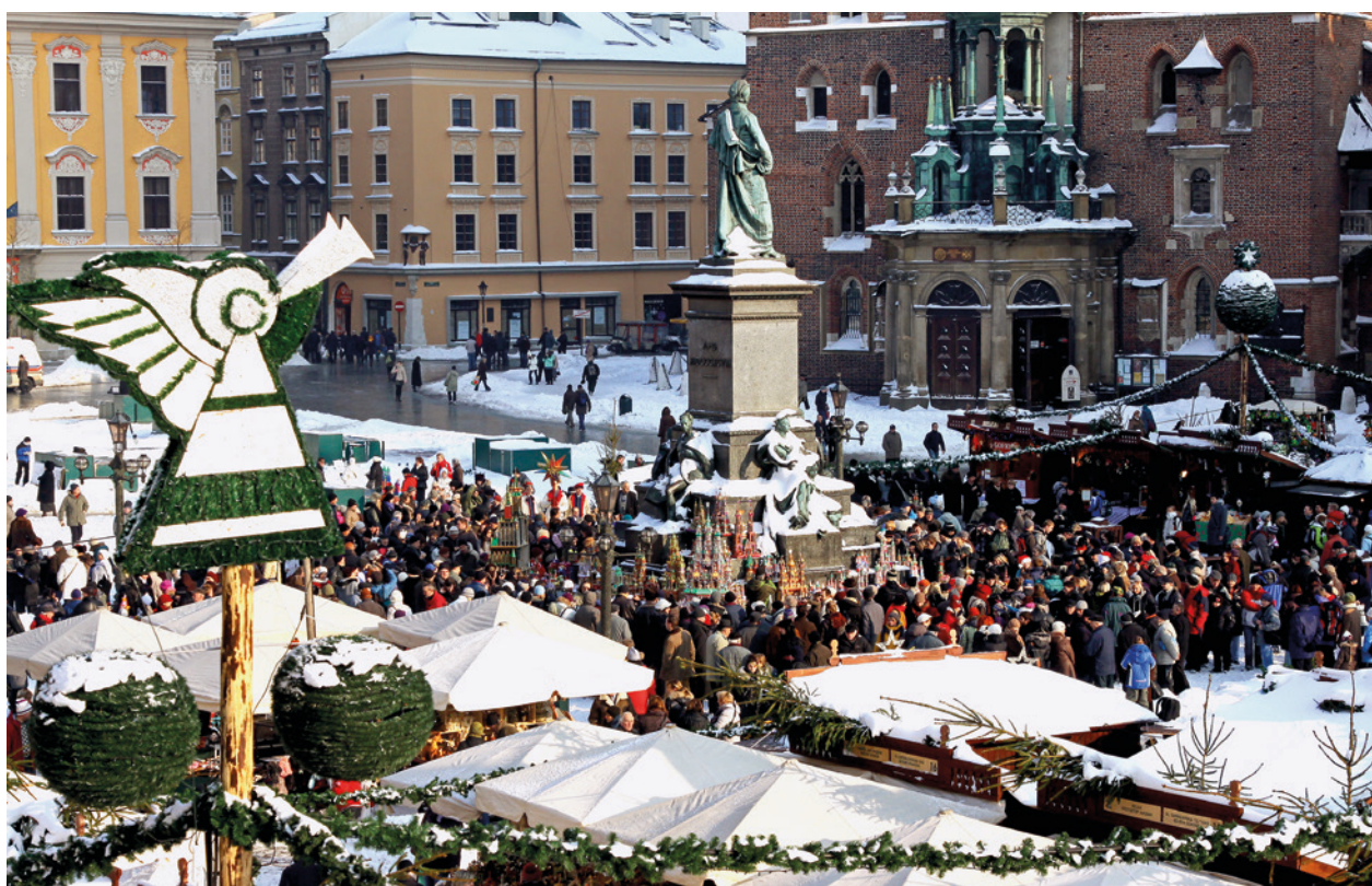
68. Konkurs na najpiękniejszą szopkę krakowską, Rynek Główny, 3 grudnia 2010 r.

ważny temat historii kościołów zbudowanych w Nowej Hucie po 1949 roku. W tym „mieście bez Boga”, jak w okresie PRL mówiono o Nowej Hucie, dzięki wysiłkowi Kościoła i staraniom wiernych postawiono 10 świątyń. Ekspozycja z jednej strony odniosła się do dorobku architektonicznego twórców tych budowli, z drugiej strony przybliżyła wysiłek lokalnych społeczności, skupionych wokół nowohuckich parafii, który doprowadził do budowy kościołów-budynków i żywych wspólnot. Na wystawie i w towarzyszącym jej katalogu zgromadzono bardzo obszerny zestaw dokumentów, fotografii i planów związanych z historią nowo-