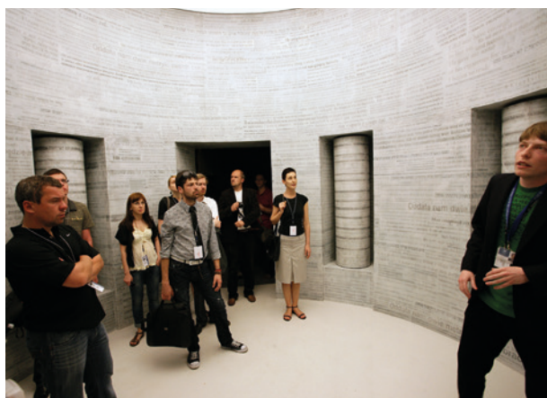
Pierwsi zwiedzający wystawę Kraków – czas okupacji 1939–1945, 10 czerwca 2010 r.; fot. T. Kalarus