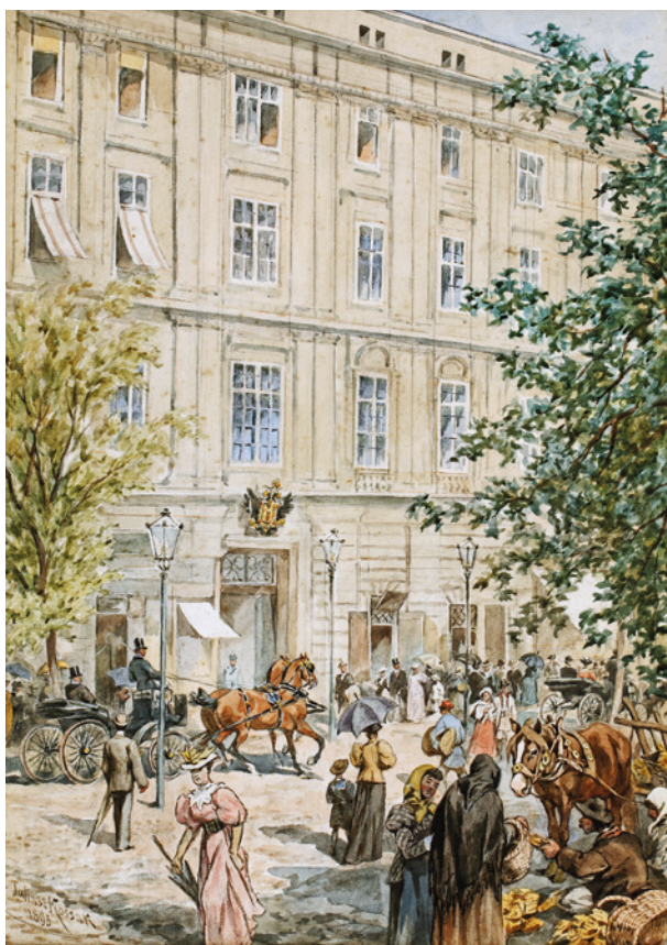
J. Kossak Pałac Spiski w Krakowie, 1895 r., akwarela, sygn., dat.; w zbiorach Muzeum Historycznego Miasta Krakowa, nr MHK 3092/VIII