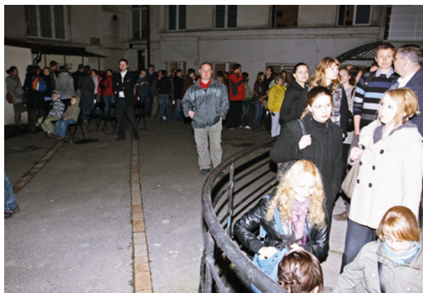
Noc Muzeów w oddziale Ulica Pomorska, kolejka do zwiedzania cel gestapo, 14 maja 2010 r.

pragnących poznawać obiekty i miejsca na co dzień nieudostępniane zwiedzającym.