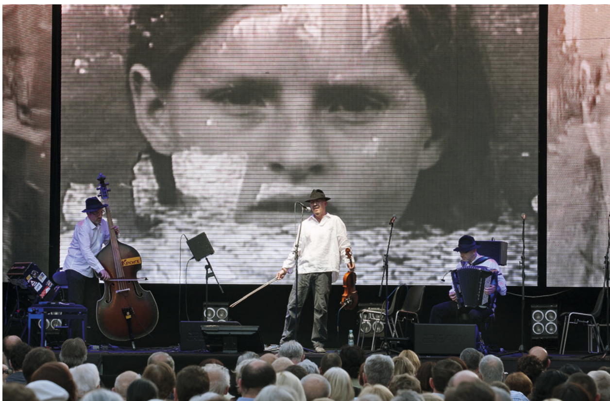
Widowisko słowno-muzyczne w reżyserii Łukasza Czuja w czasie uroczystości otwarcia Fabryki Emalia Oskara Schindlera, występ zespołu Kroke; fot. R. Korzeniowski

historią tego miejsca. W 2002 roku zaprzestali produkcji Krakowskie Zakłady Elektroniczne Unitra-Telpod, która to fabryka w okresie powojennym użytkowała obiekty i tereny dawnej Emalii. W 2005 roku gmina miejska wykupiła tereny zlikwidowanego Telpodu, a w 2007 roku rozpoczął się remont dawnego budynku administracyjnego, zbudowanego w okresie II wojny, którego celem było adaptacja obiektu na planowane muzeum miejsca.