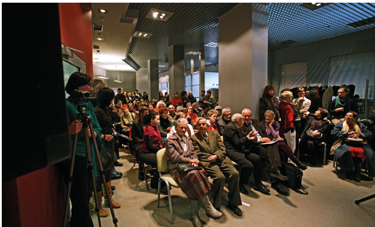
Prapremiera filmu Marcina Kapronia Lipowa 4, Fabryka Emalia Oskara Schindlera, 14 marca 2010 r.

Dorota Jarecka: Nowe Muzeum w Krakowie. W potrzasku wojny. „Gazeta Wyborcza” z 25 czerwca 2010 r.