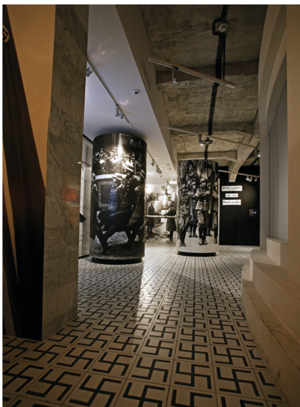
Fragment wystawy Kraków – czas okupacji 1939–1945

pozycji poświęcona Oskarowi Schindlerowi, właścicielowi Emailwarenfabrik, którego godnym pamięci poczynaniom tak wielu Żydów zawdzięczało ocalenie.