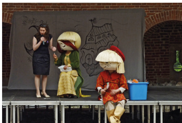
Spotkanie z Krzysztoforkiem i Dorotką w ramach programu Muzeomania, Barbakan, 13 czerwca 2010 r.

MHK wspólnie z sześcioma innymi krakowskimi muzeami zorganizowało VI Turniej Piłkarski Muzeów Krakowskich o Puchar Prezydenta Krakowa. Była to wspólna zabawa muzealników krakowskich, a jednocześnie impreza sportowa, która ma już swoją tradycję, bo przecież jest corocznie organizowana pod patronatem prezydenta Krakowa od 2005 roku. Hala sportowa w Zabierzowie 25 września gościła sześć drużyn muzealnych. Zwyciężyła ekipa Zamku Królewskiego na Wawelu, która w spotkaniu finałowym pewnie pokonała drużynę Muzeum Etnograficznego 4:0, biorąc rewanż za finał z poprzedniego roku. W meczu o trzecie miejsce Muzeum UJ po rzutach karnych pokonało Muzeum Narodowe 2:2 i w karnych 4:2. Muzeum Historyczne zajęło, najgorsze od lat, piąte miejsce. Po zwycięstwie z Muzeum Żup Solnych 2:1 (bramki Piotr Salwiński, Paweł Jagło), pechowo, w samej końcówce, przegrało z Muzeum Narodowym 1:2 (bramka Paweł Jagło), a następnie z Mu-