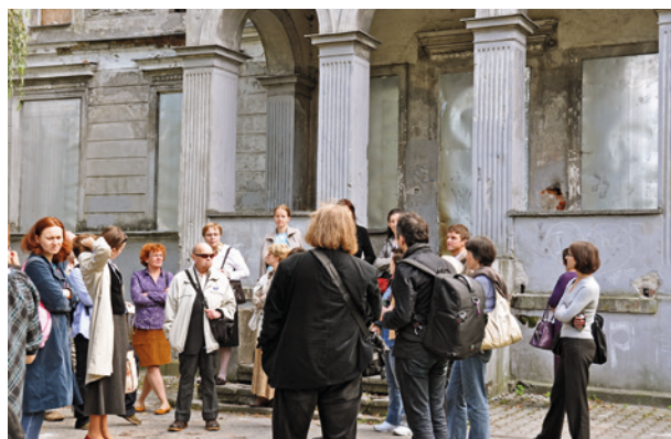
Uczestnicy wernisażu Zapomniane dziedzictwo Nowej Huty – Wadów w trakcie zwiedzania dworu w Wadowie, 22 września 2010 r.; fot. M. Śmietana