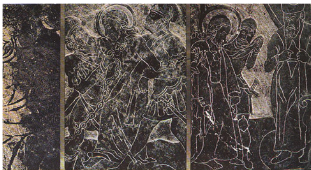
Płytciny z kolumny Męki Pańskiej na Bielanych, ok. drugiej połowy XVII w.; w zbiorach archiwum Wojewódzkiego Konserwatora Zabytków w Krakowie

czętej. W dolnej partii cokołu ryta data: ANNO DOMINI 1668.