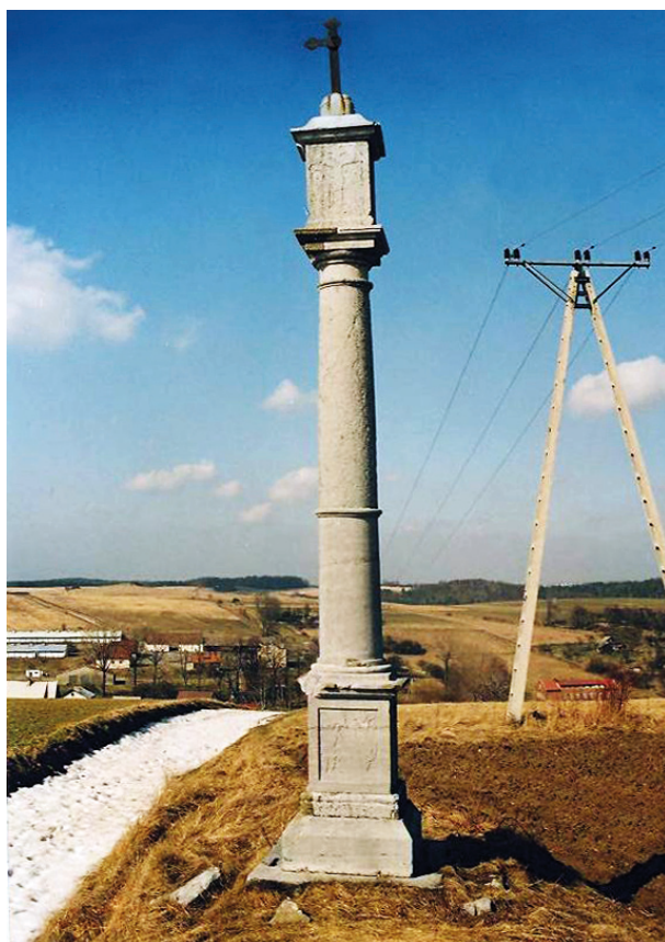
Kolumna Męki Pańskiej w Paczółtowicach, wyk. A. Negowicz, 1659 r.; w zbiorach archiwum Wojewódzkiego Konserwatora Zabytków w Krakowie

5. Prostokątna marmurowa tablica w kościele w Paczółtowicach z inskrypcją poświęconą Matce Boskiej, otoczona grawerowaną bordiurą kwiatowo-roślinną. Na osi