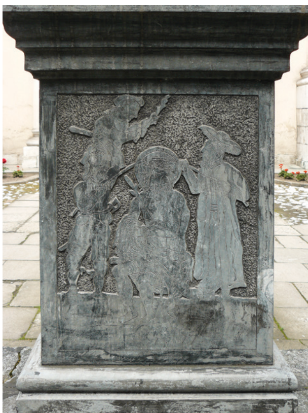
Płaskorzeźba z kolumny Męki Pańskiej przed kościołem Karmelitanek na Wesołej w Krakowie przy ul. Kopernika 44, druga połowa XVII w.; fot. I. Palca

AD PRAEFA TVM ALTA / INDVLGEN // TIAM CON. IMA VIRGI / NIS MAR RIJ POGNIS / LIBERET TANTI- BVS / QVIBVSC ROMAE / APVD SAN MDCX.