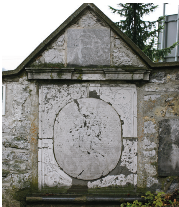
Epitafulum A. Negowicza w Paczółtowicach, wyk. J. Zielaski (?), 1682 r.

Dobrze rozwijająca się działalność „fabryki” dębnickiej wywołała zatarg z cechami kamieniarskimi, które broniły swoich interesów. Dlatego karmelitanie zwrócili się do króla Jana Kazimierza, korzystając z jego wizyty w klasztorze