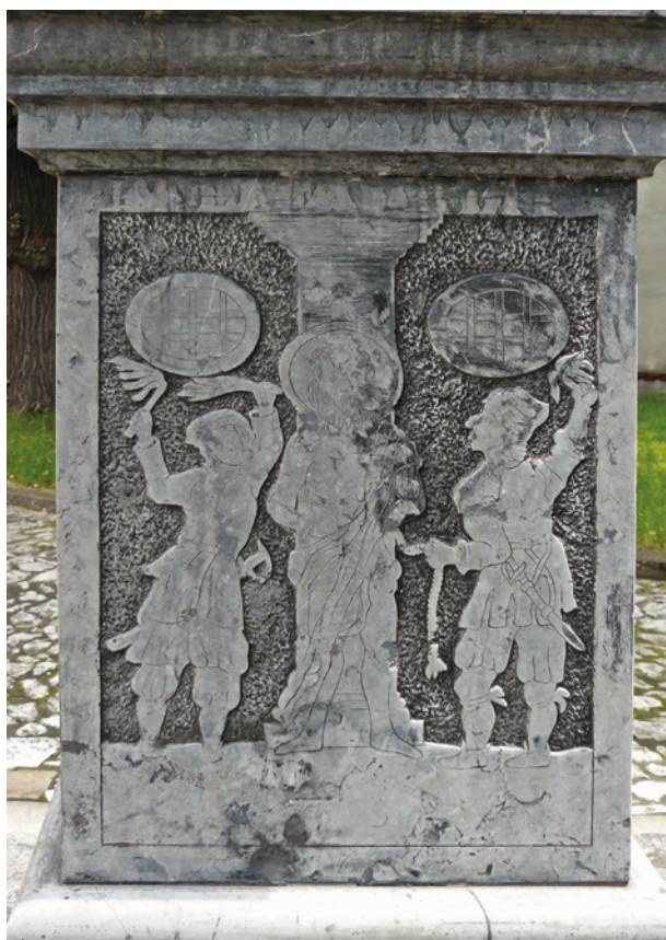
Biczowanie, kolumna Męki Pańskiej przed kościołem Karmelitanek przy ul. Kopernika 44 w Krakowie, druga połowa XVII w.

której dolny odcinek wypełniony jest rytą wicią roślinną, składającą się z czterech par wolutowych zwojów liści akanantu, zestawionych symetrycznie i rozdzielonych pojedynczymi kwiatami tulipana.