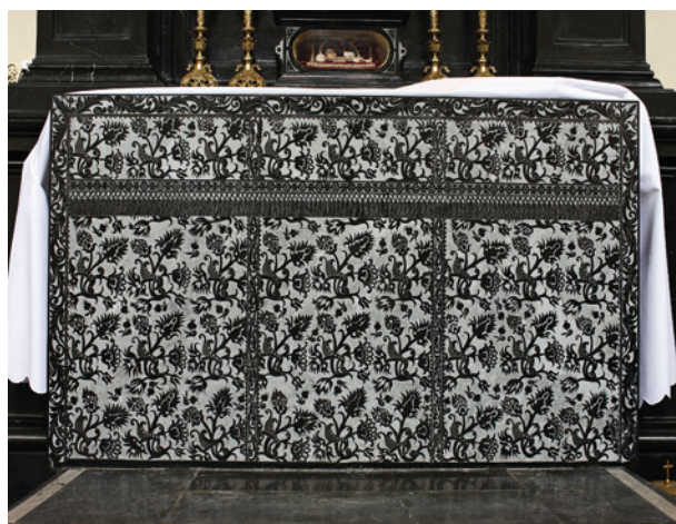
Antependium ołtarza w kościele Karmelitów w Czernej, ok. połowy XVII w.

Jest to doskonała imitacja tkaniny, gęsto pokrytej ornamentem roślinnym wydobytym polerem z groszkowanego, matowego tła. Podobne antependia wykonane w warsztacie Zielaskich znajdują się w kilku jeszcze miejscach, m.in. w kościele parafialnym w Paczółtowicach. Obok motywów roślinnych pojawiają się pośrodku pola emblematy: herb w antepedium ołtarza w kościele Bernardynów w Krakowie; scena Zwiastowania w kaplicy w Karniowicach 44 . Pola obwiedzione są bordiurą, w trzech, czterech lub pięciu płaszczyznach ujętych wąskimi ramami o pionowo biegnącym ornamentem roślinnym, w górze na jednej trzeciej wysokości biegnie poziomy pas imitujący frędzle o drobnym rytmie. Reszta płaszczyzny wypełniona powtarzającym się w czterech rzędach or-