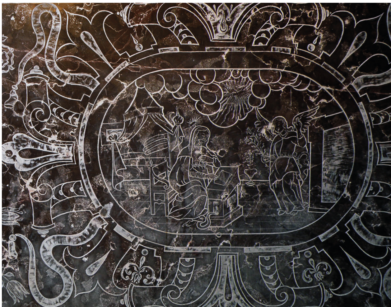
Antependium ołtarza w kaplicy w Karniowicach, w gminie Zabierzów; fot. J. Hiżycka

cie kolumny płyta, a na niej kapliczka w kształcie graniastosłupa zakończona krzyżykiem. Całość figury wykonana z marmuru dębnickiego, krucyfiks żelazny. Na cokole i kapliczce na czterech ścianach ryte sceny Męki Pańskiej. U dołu: Chrystus w Ogroju, Biczowanie, Cierniem koronowanie . U góry: Anioł trzymający chustę św. Weroniki, Chrystus Odkupiciel, Matka Boska Bolesna, Ukrzyżowanie . Na bazie, po lewej stronie, wyryte: Anno Domini 1669 . Wysokość kolumny: 4,42 m. Tematycznie sceny różnią się nieco od wyżej wymienionych kolumn, ale widać tę samą rękę oraz te same wzory graficzne.