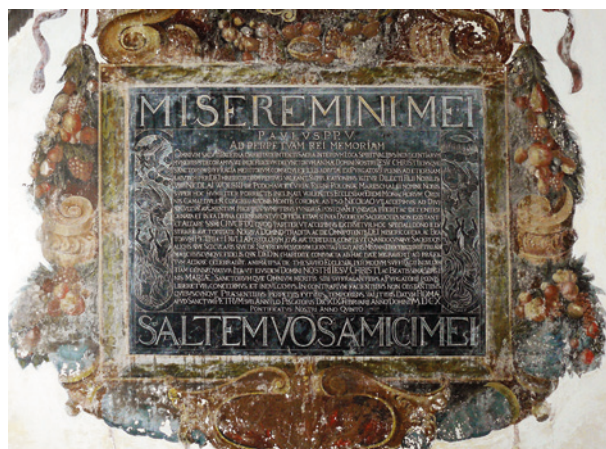
Tablica w kościele Kamedułów na Bielanach, sygn. J. Zielaski, połowa XVII w.

O dębnickim warsztacie Zielaskich pisało wielu autorów, wymieniany jest w wielu opracowaniach z końca XIX wieku 1 . Jednak dopiero Stanisław Tomkowicz odkrył rzeźbiarzy z Dębника. W komunikacie z 1912 roku zatytułowanym Zielascy, kamieniarze-artysci w Dębniku pod Krzeszowicami omówił wykonane przez nich zabytki 2 . Przypisał tym twórcom około 10 obiektów znajdujących się w Krakowie i Małopolsce. Uważał, że motywy zaczerpnięte są ze sztuki europejskiej, a „grawirunki te mają coś w sobie kaligraficz-