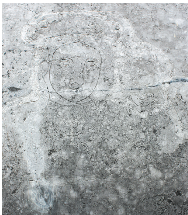
Wizerunek Matki Boskiej w zwieńczeniu epitafulum Adama Negowicza, wyk. W. Zielaski, 1653 r.