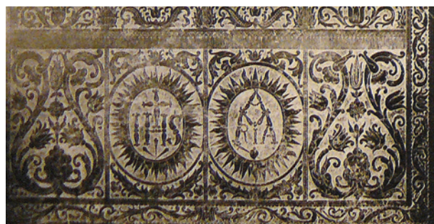
Antependium ołtarza w kościele parafialnym w Paczółtowicach, ok. połowy XVII w.; w zbiorach archiwum Wojewódzkiego Konserwatora Zabytków w Krakowie

nująco. Ołtarz z czarnego marmuru dębnickiego wykonany został w latach 1662–1686 przez mistrza kamieniarskiego na Kazimierzu Marcina Krystiana 42 .