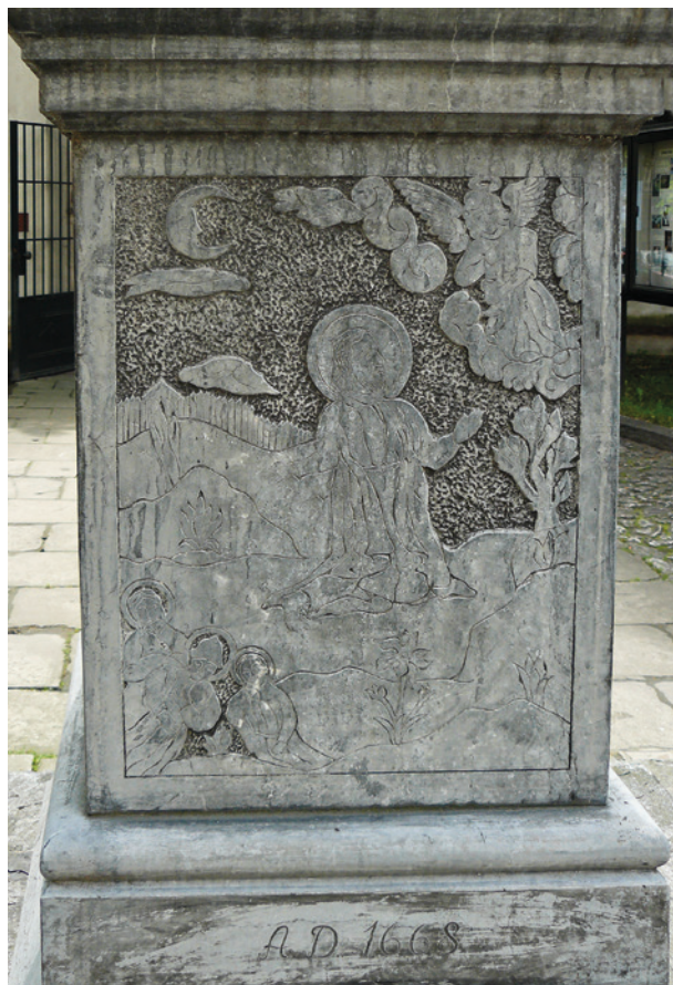
Chrystus w Ogrojcu, kolumna Męki Pańskiej przed kościołem Karmelitanek przy ul. Kopernika 44 w Krakowie, druga połowa XVII w.

Trzon kolumny gładki, zwieńczony kapitelem zbliżonym do doryckiego; na szerokim gzymsie posadowiona kapliczka w kształcie kwadratowego nasadnika, otoczonego czterema tralkami podtrzymującymi gzyms, na którym osadzony jest żeliwny krzyż, ażurowy, umieszczony w kamiennej kopułce (symbolizująca niebo). Ścianki nasadnika zdobione są następującymi scenami: Cierniem koronowanie (od strony wschodniej), Upadek pod krzyżem (od strony południowej), Przybijanie do krzyża (od strony zachodniej), Ukrzyżowanie (od strony północnej). Sceny umieszczone w prostokątnych, płytkich płytcinach, obwiedzionych gładkimi listwami są polerowane, natomiast tło jest groszkowane.