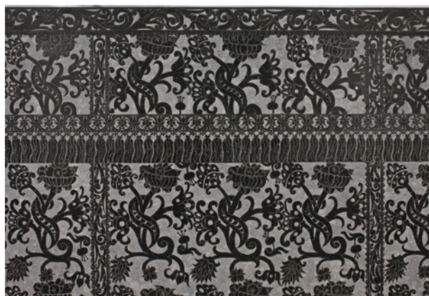
Antependium ołtarza w kościele Karmelitów w Czernej, ok. połowy XVII w. (fragment)

namentem drobno kwiatowym o stałym raporcie złożonym ze splecionych kwiatów goździków, ostu, lilii itp., ale także z motywami ptaków. Tło matowe, ornament szlifowany.