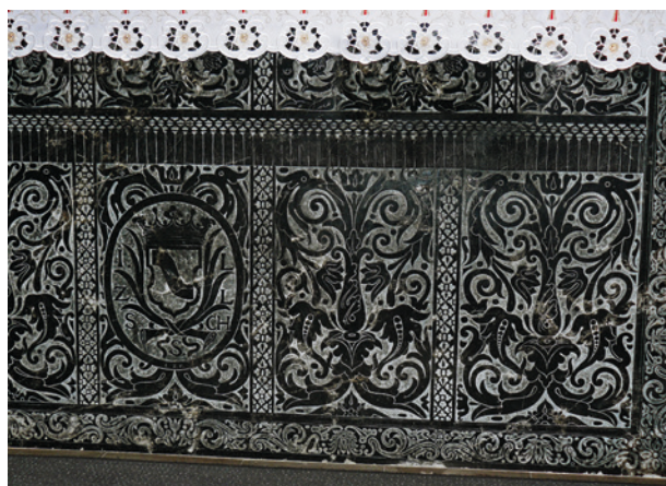
Antependium ołtarza św. Szymona z Lipnicy w kościele Bernardynów w Krakowie, 1677 r.

Bracia Zielascy podejmowali się najtrudniejszych pod względem artystycznym zadań: byli grawerami w marmurze. Te grawerunki, głównie o motywach ornamentalnych, ale także figuralnych, o charakterze kaligraficznym i miniaturowym, spotyka się na antependiach, ramach tablic pamiątkowych i kolumnach. Rzadko sygnowali swoje prace, do wyjątków należy antependium ołtarza z kaplicy św. Szymona z Lipnicy w kościele Bernardynów w Krakowie, wykonane około 1677 roku. Było to ważne zamówienie, bowiem 24 lutego 1685 roku beatyfikowano Szymona z Lipnicy, a uroczyste przeniesienie relikwii błogosławionego z katedry do kościoła Bernardynów na Stradomiu odbyło się 27 lipca 1685 roku. Kaplica, w której je złożono, przedstawiała się impo-