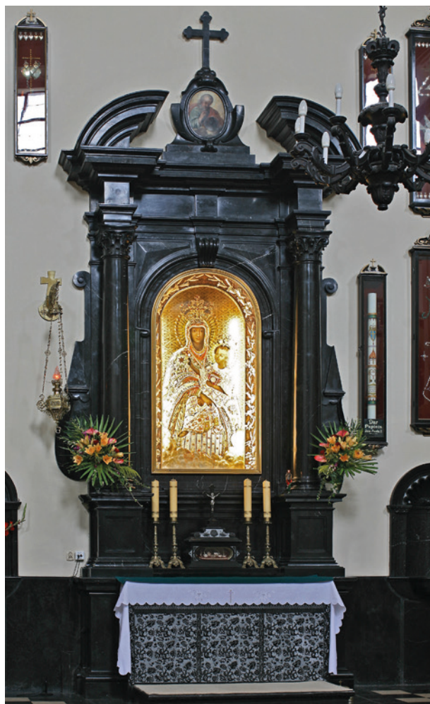
Ołtarz boczny w kościele Karmelitów w Czernej z antepedium Zielaskich, ok. połowy XVII w.; fot. T. Kalarus

Jest to doskonała imitacja tkaniny, gęsto pokrytej ornamentem roślinnym wydobytym polerem z groszkowanego, matowego tła. Podobne antependia wykonane w warsztacie Zielaskich znajdują się w kilku jeszcze miejscach, m.in. w kościele parafialnym w Paczółtowicach. Obok motywów roślinnych pojawiają się pośrodku pola emblematy: herb w antepedium ołtarza w kościele Bernardynów w Krakowie; scena Zwiastowania w kaplicy w Karniowicach 44 . Pola obwiedzione są bordiurą, w trzech, czterech lub pięciu płaszczyznach ujętych wąskimi ramami o pionowo biegnącym ornamentem roślinnym, w górze na jednej trzeciej wysokości biegnie poziomy pas imitujący frędzle o drobnym rytmie. Reszta płaszczyzny wypełniona powtarzającym się w czterech rzędach or-