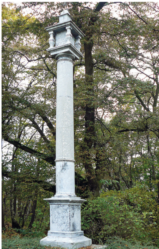
Kolumna Męki Pańskiej przed klasztorem Kamedułów na Bielanych, ok. drugiej połowy XVII w.

ryte frędzle. Tutaj jednak tło jest polerowane, a ornament grozdkowany 48 .