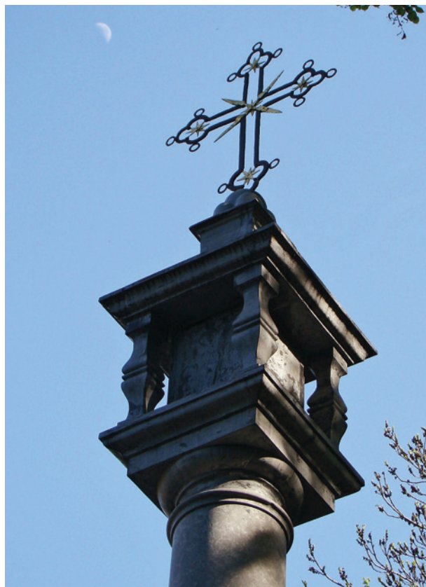
Kolumna Męki Pańskiej na Bielanych, ok. drugiej połowy XVII w. (fragment)

Zielaskis used the Dębniki marble to produce antependia, sculptures featuring Christ at the Column, baptismal fountains, epitaphs. Covered with thick textile-like ornamentation, the antependia produce an amazing effect of a fabric or needlework (such as those at the Monastery of Friars Minor of the Observance in Stradom or churches in Paczółtowice and Karniowice). Located in front of the Camaldolese Monastery in Bielany, in front of the Convent of Discalced Carmelites in Wesoła quarter, and in churches in Zielonki, Paczółtowice and Siedlec, the columns with panels featuring engraved scenes from the Passion are abundant in iconography and testify to their creators' artistry as sculptors.