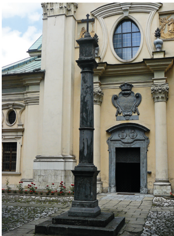
Kolumna Męki Pańskiej przed kościołem Karmelitanek na Wesołej w Krakowie przy ul. Kopernika 44, druga połowa XVII w.; fot. I. Palca