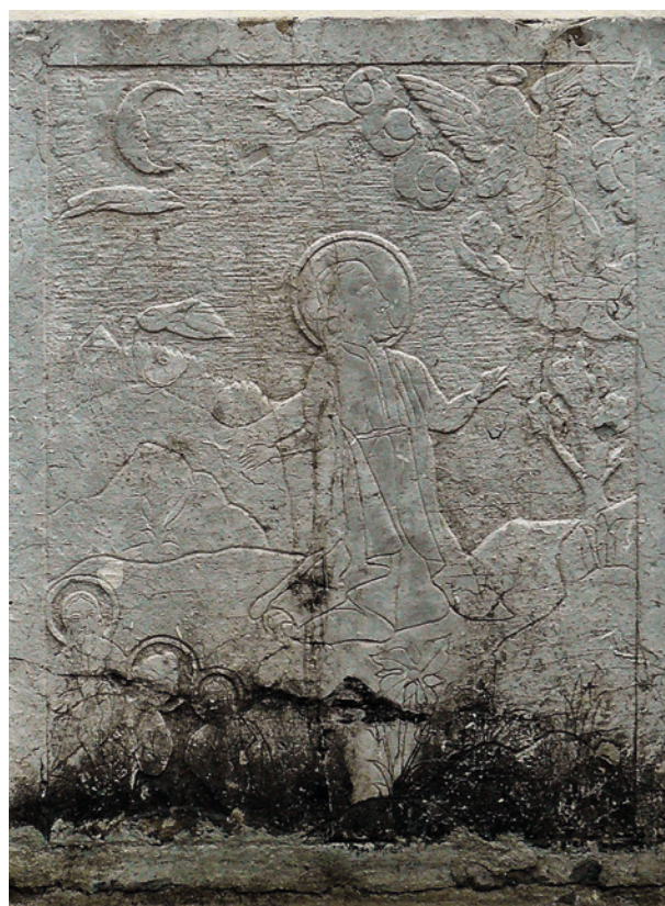
Płaskorzeźba z kolumny Męki Pańskiej przed kościołem Karmelitanek na Wesołej w Krakowie przy ul. Kopernika 44, druga połowa XVII w.