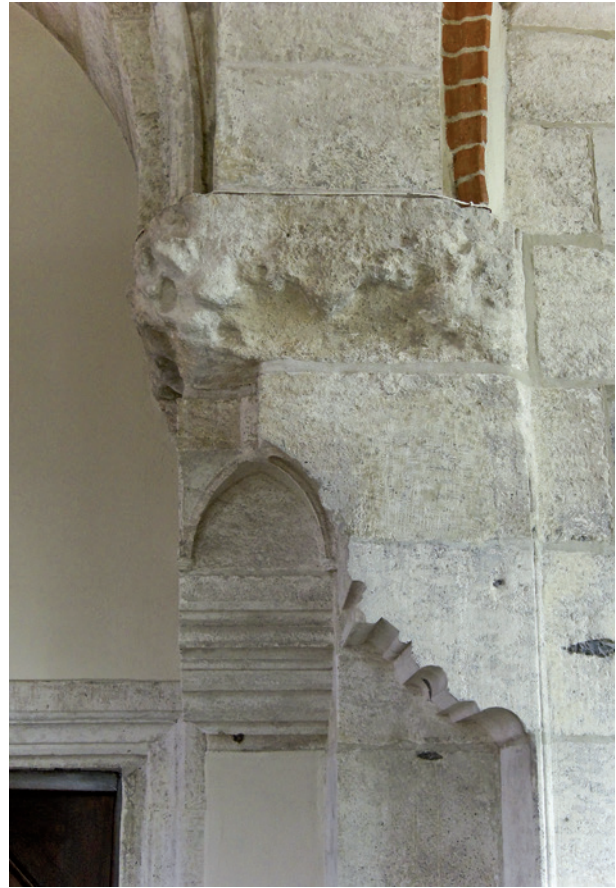
Wieża Ratuszowa – wspornik gotycki w sali na pierwszym piętrze po konserwacji; fot. A. Godlewski, 2008 r.

W ostatniej dekadzie ubiegłego wieku kamienica przeszła gruntowny remont konserwatorski. Piwnice zachowały w pełni swój średniowieczny układ z oryginalnym wątkiem ceglanych murów i kamiennym detalem. Jednak wskutek braku należytej ich wentylacji oraz izolacji pionowej ściany frontowej budynku, następował proces wysalania i osypywania się lica cegieł oraz daleko posunięte rozluźnienie spoinowania. Degradacja struktury objęła również tynki w sieni, oczyszczenia i wzmocnienia wymagał także detal architektoniczny. Przeprowadzone prace konserwatorskie o charakterze zachowawczym skonsolidowały warstwę licową cegieł z miąższem struktury murów, zmurszałe tynki i spoiny zastąpiono nowymi, dostosowując je pod względem estetycznym do oryginalnych. Niestety z powodu braku środków finansowych nie dokonano wymiany grzejników oraz przewodów centralnego ogrzewania rozmieszczonych przypadkowo we wnętrzu piwnic.