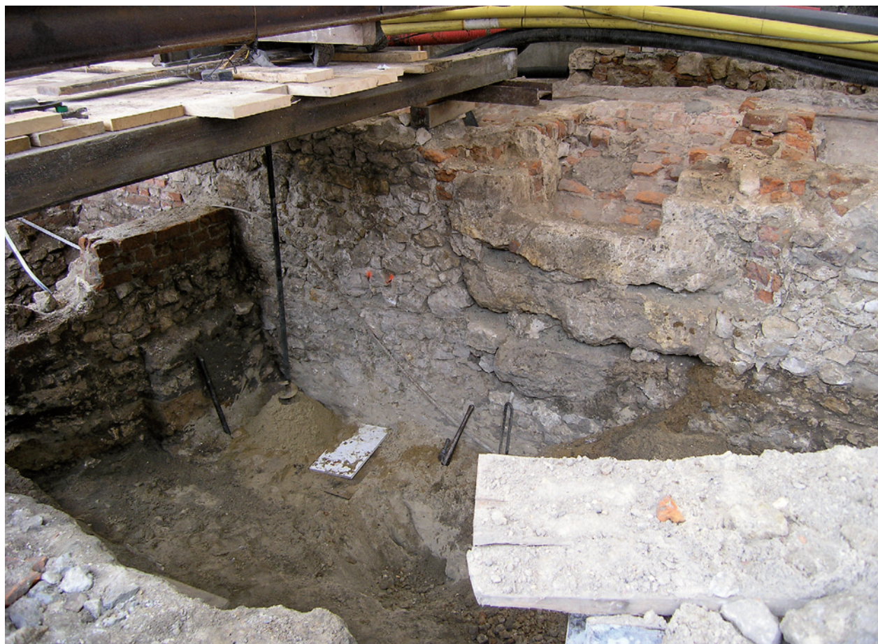
Fragment odsłoniętych murów przedproży przed podjęciem prac konserwatorskich; fot. Ł. Holcer, 2008 r.