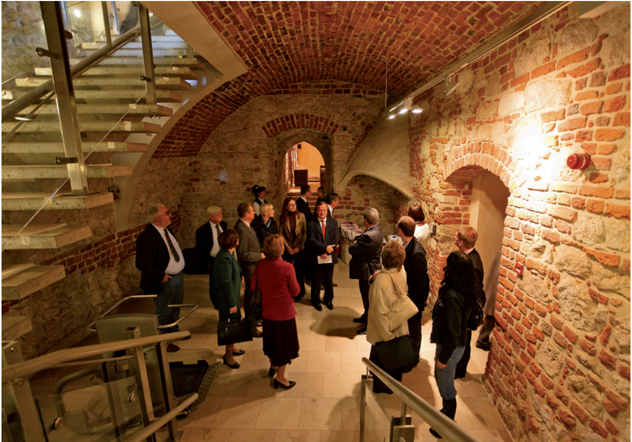
Odbiór prac konserwatorskich przy przedprożach, Pałac Krzysztofory, 29 września 2009 r.

średniowieczne godło kamienicy Pod Krzysztofory oraz czy była nim figura św. Krzysztofa, usunięta w 1791 roku przez ówczesnego właściciela pałacu Jacka Kluszewskiego 3 .