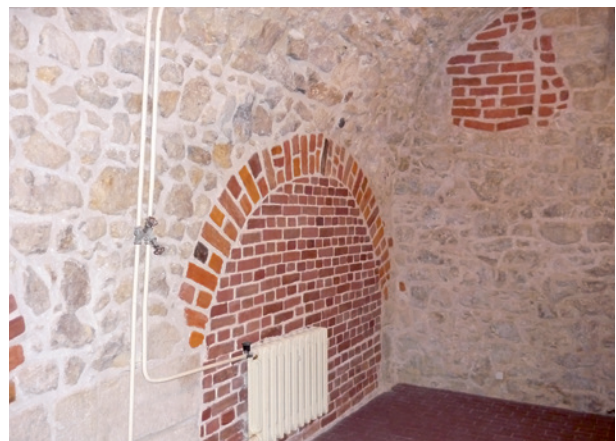
Kamienica Hipolitów – ściana działowa piwnic po konserwacji