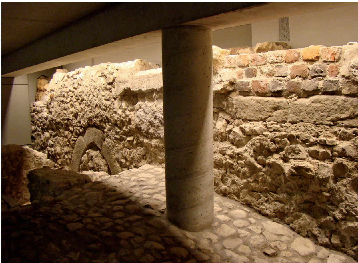
Widok ekspozycji muzealnej przedproży; fot. A. Gawrońska, 2009 r.