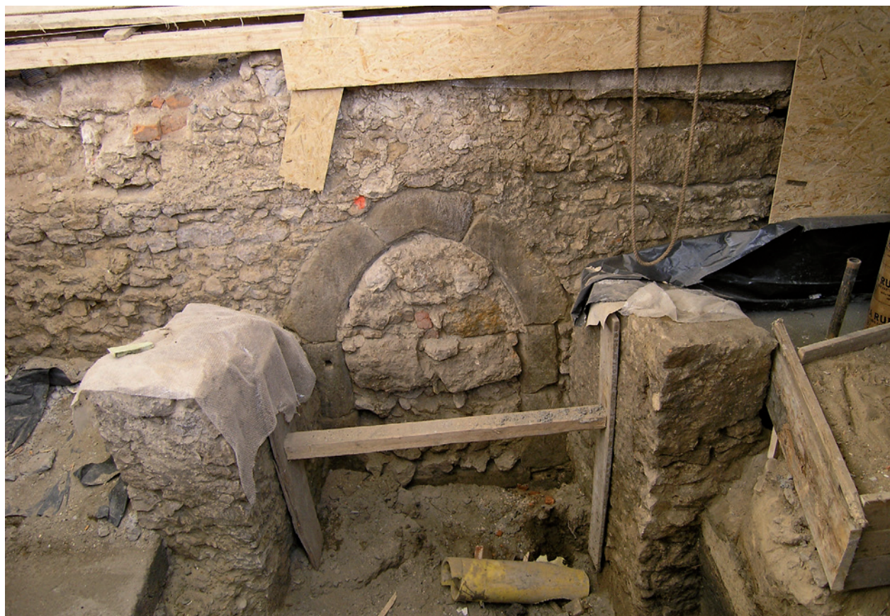
Fragment odsłoniętych murów przedproży w trakcie prac konserwatorskich; fot. Ł. Holcer, 2008 r.