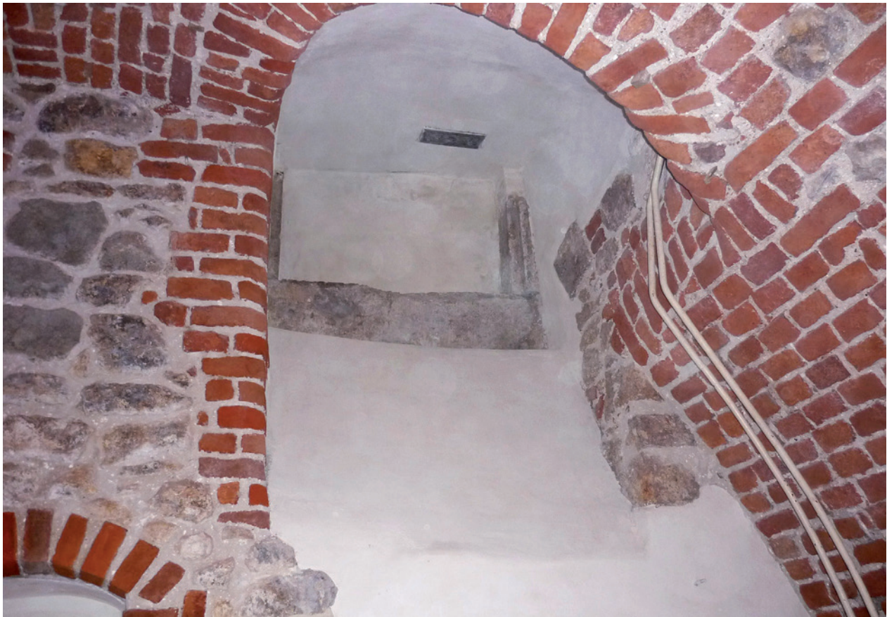
Kamienica Hipolitów – ściana frontowa piwnic po konserwacji; fot. A. Bohan, 2009 r.

Należy ponadto odnotować, że 2009 rok obfitował w prace konserwatorskie prowadzone również w innych budynkach zabytkowych należących do Muzeum Historycznego Miasta Krakowa, a mianowicie w Barbakanie, Domu Hipolitów i Wieży Ratuszowej. Zadania te były w całości finansowane z Narodowego Funduszu Rewaloryzacji Zabytków Krakowa.