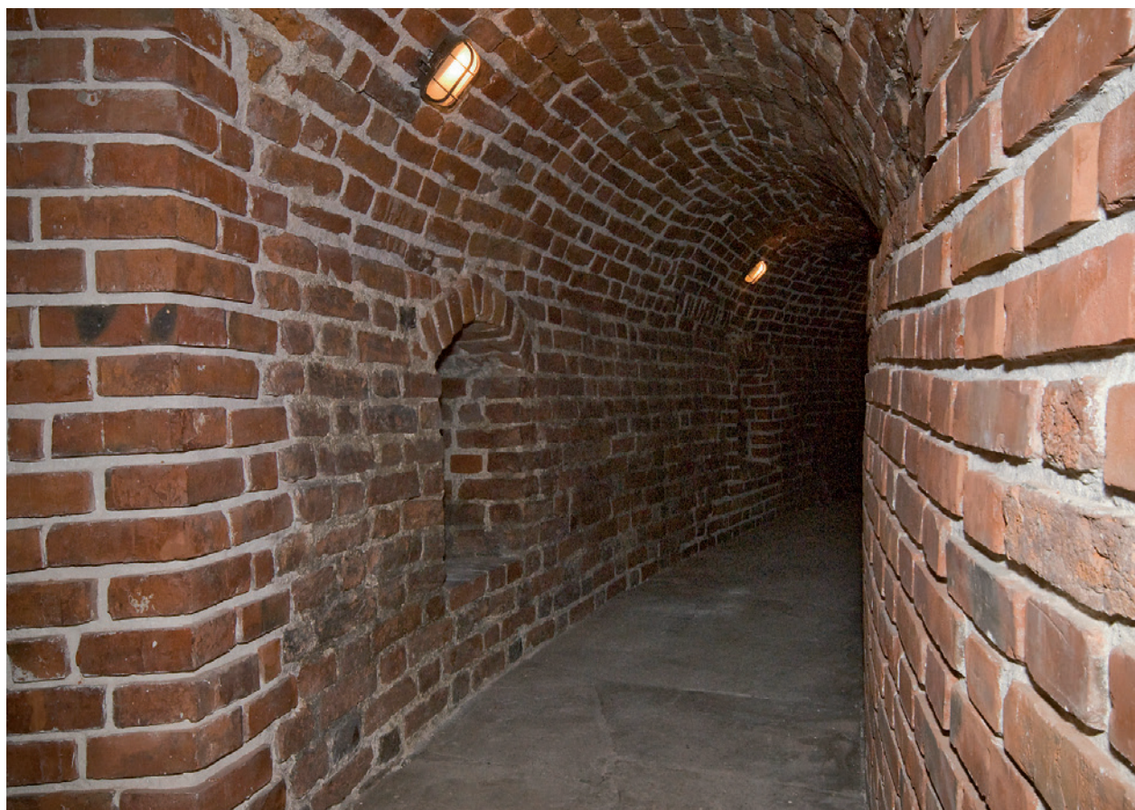
Barbakan – chodnik strzelecki po konserwacji; fot. L. Modelski, 2010 r.