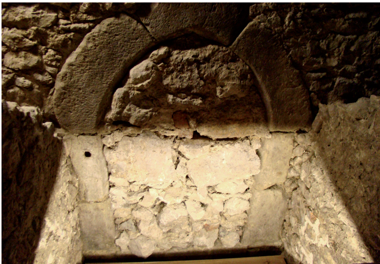
Gotycki portal w dawnym zejściu z Rynku do przedproży; fot. A. Gawrońska, 2009 r.