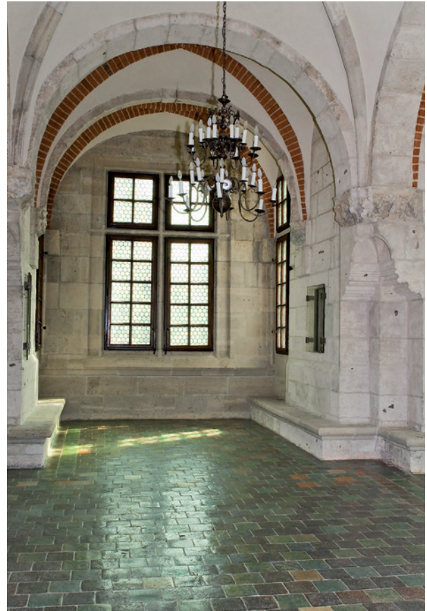
Wieża Ratuszowa – sala na pierwszym piętrze po konserwacji; fot. L. Modelski, 2009 r.

strzeleckie znajdujące się w dolnej kondygnacji, wewnątrz murów od strony południowej. Wejścia do nich znajdują się po bokach bramy wjazdowej do szyi Barbakanu. W ich ścianach zewnętrznych umieszczone są klucze strzelnicze (widoczne od strony zachodniej, od wschodniej zamurowane). Korytarze te służyły straży broniącej fosy oraz grodzy.