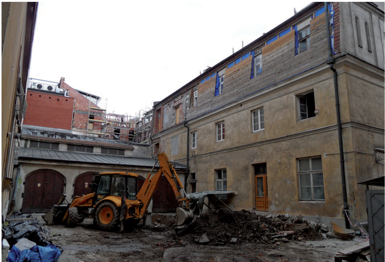
Zachodnia część dziedzińca pałacowego, elewacja wschodnia budynku przy ulicy Jagiellońskiej 4 w trakcie prac remontowo-budowlanych; fot. A. Gawrońska, 2010 r.

leśław Walter dokonał kolejnej adaptacji na mieszkanie dla stróża. Murowany parterowy budynek przedstawia rysunek malarza Franciszka Turka z około 1913 roku. Na obrysie tego budynku, z zachowaniem piwnic, został wzniesiony w 1923 roku obecny dwukondygnacyjny, z efektowną fasadą od strony ulicy Jagiellońskiej.