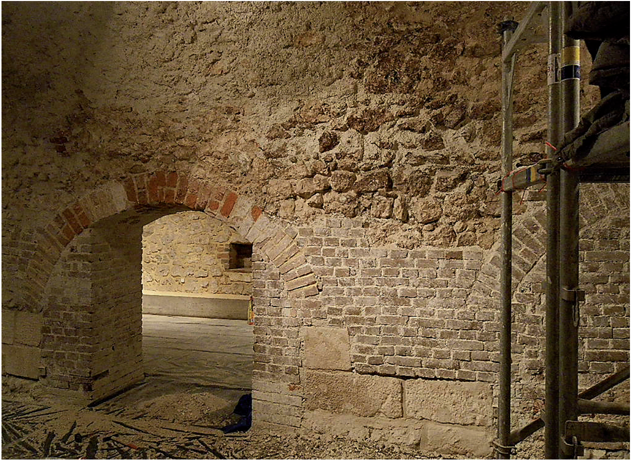
Kamienica Hipolitów – ściana działowa piwnic w trakcie prac konserwatorskich; fot. H.Sanecka, 2008 r.