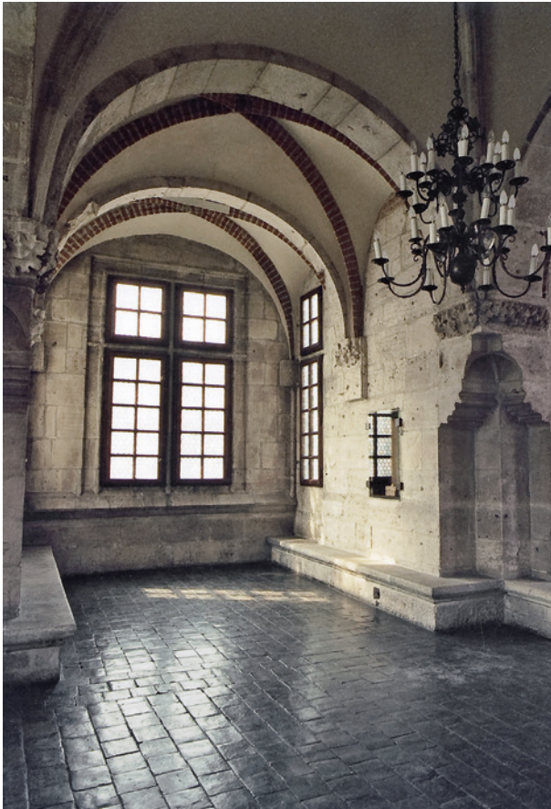
Wieża Ratuszowa – sala na pierwszym piętrze przed konserwacją