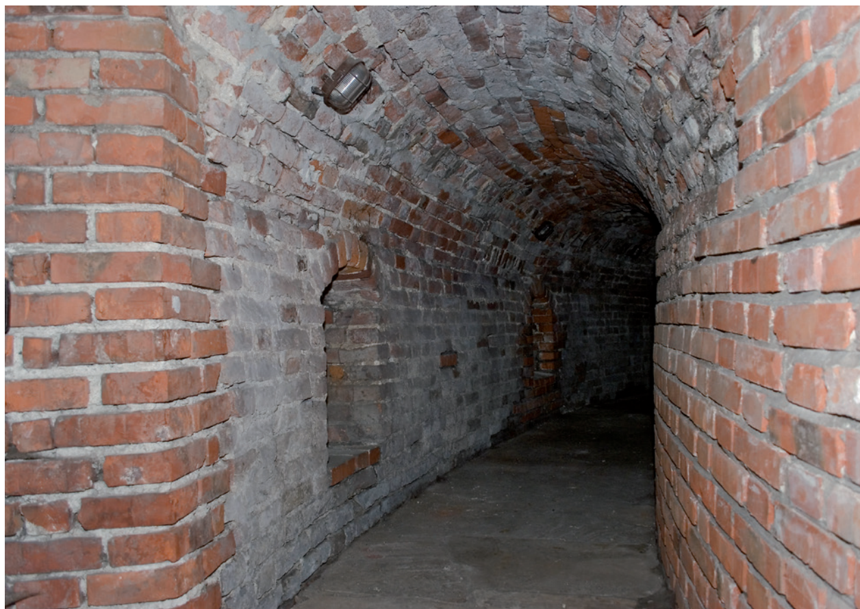
Barbakan – chodnik strzelecki przed konserwacją; fot. R. Rolewicz, 2009 r.