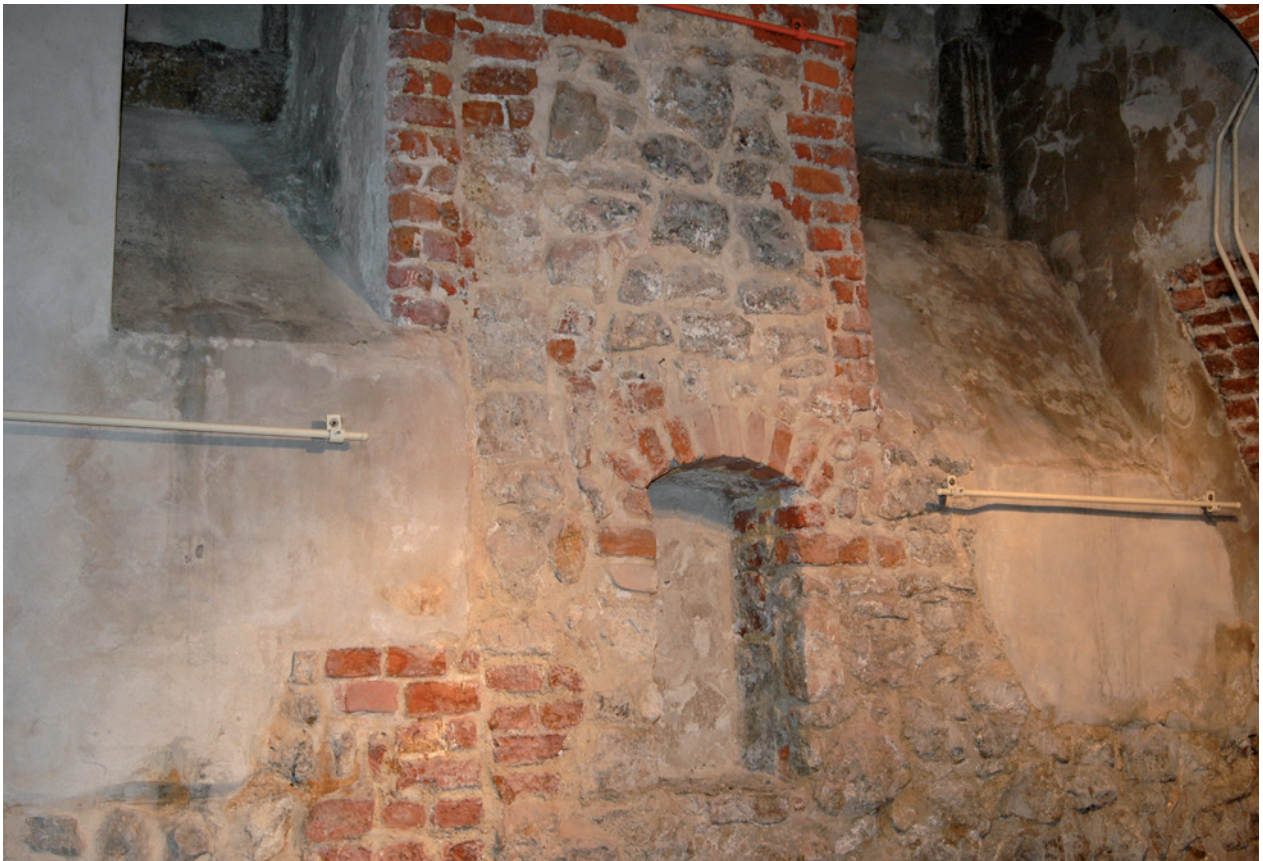
Kamienica Hipolitów – ściana frontowa piwnic przed konserwacją; fot. A. Bohan, 2008 r.