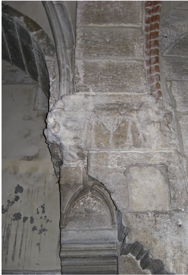
Wieża Ratuszowa – wspornik gotycki w sali na pierwszym piętrze przed konserwacją; fot. A. Godlewski, 2008 r.