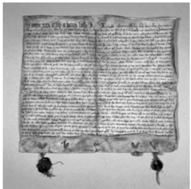
Kopia aktu lokacji Krakowa, Kopernia, 5 VI 1257, wł. Muzeum Historyczne Miasta Krakowa, fot. R. Korzeniowski, oryg. w Archiwum Państwowym w Krakowie, Zbiór Dokumentów Archiwum Akt Dawnych, perg. nr 2

Dzieje rozwoju przestrzennego miasta to jedno z ważniejszych zagadnień w historii Krakowa. O jego kształcie w cza-