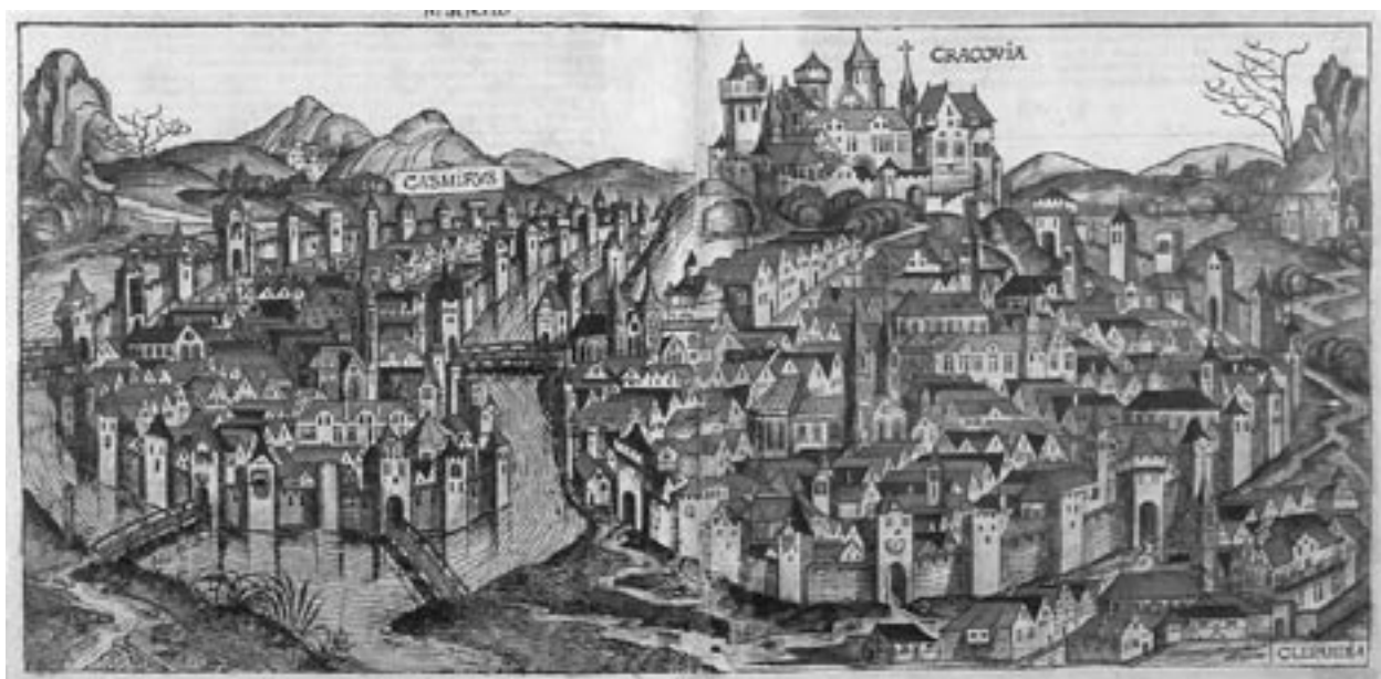
Widok Krakowa od północy, Norymberga 1493, wyk. w prac. M. Wolgemuta i W. Pleydenwurffa wg rys. K. Celtisa, w Liber chronicarum H. Schedla, drzeworyt, 53 x 22,5 cm, wł. Muzeum Historyczne Miasta Krakowa, nr inw. MHK 1591/VIII

trzeba przyznać, wywiązali się ze swego zadania znakomicie, zapewne za sprawą swych służb archiwalnych. Zwraça uwagę doskonała znajomość zagadnienia dotyczącego owych gruntów „początkowie miastu nadanych”. Zdanie to odniesiono najślusniej do lokacji Krakowa, gdzie właśnie grunty te zostały określone. Sięgnijmy więc jeszcze raz do owego źródła.