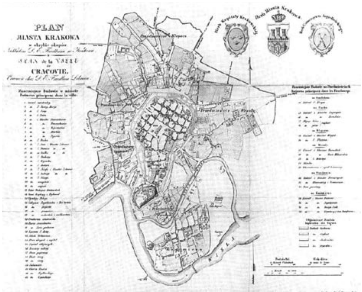
Plan miasta Krakowa w obrębie okopów, nakładem D.E. Friedleina w Krakowie, skala 1:9600, autor T. Żebrański, medzioryt, wł. Muzeum Historyczne Miasta Krakowa, sygn. 23/T/VIIIa5

(437 posesji), trzeci – północno-wschodnie przedmieścia Krakowa: Garbary, Biskupie, Smoleńsko, Podzamcze oraz Czarną Wieś, Nową Wieś, Łobzów (484 posesje) oraz czwarty z Kleparzem, Pędzichowem, Lubicz, Wesołą, Brzegiem Miejskim i Krowodrzą (373 posesje) 16 . W ten sposób Kraków osiągnął wszystko to, co było wcześniej postulowane. Nie było jednak dane miastu osiągnąć realnych korzyści z tak ułożonych granic.