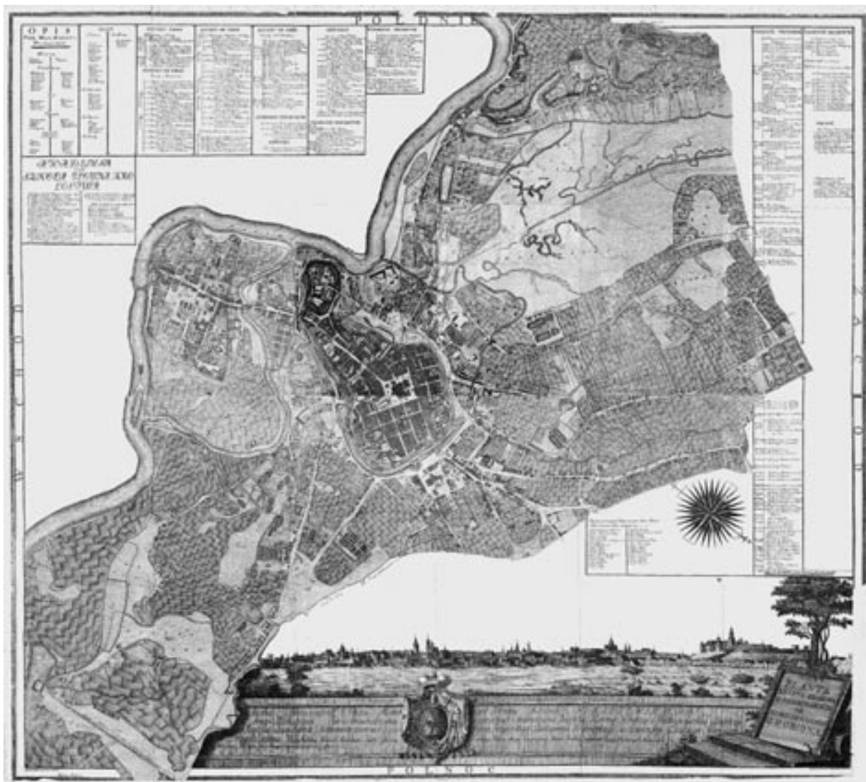
Planta Miasta Krakowa z przedmieściem roku 1785 zrobiona, tzw. Plan Kolltatajowski, skala ok. 1:3000, aut. M. Dębski, K. Szarkiewicz, rkps, tusz i piórko, wł. Muzeum Historyczne Miasta Krakowa, sygn. 2104/VII

konieczności oddania Austrii Krakowa w ramach postanowień III rozbioru Polski, nie podjęły żadnych decyzji w sprawie miasta. Formalnie trudno nawet powiedzieć, jaki stan prawny wówczas obowiązywał. Dla pospolitego człowieka oznaczało to ogromne zamieszanie. W jurdykach i gminach podmiejskich nadal urzędowali zdeorientowani wójtowie, swe pretensje do decyzji zgłaszała rada miasta Krakowa, od decyzji której emancypował się Kazimierz i Kleparz. W takiej sytuacji, w styczniu 1796 roku Kraków przejęły władze austriackie. Rozpoczęła się tzw. I okupacja austriacka, trwająca do 1809 roku.