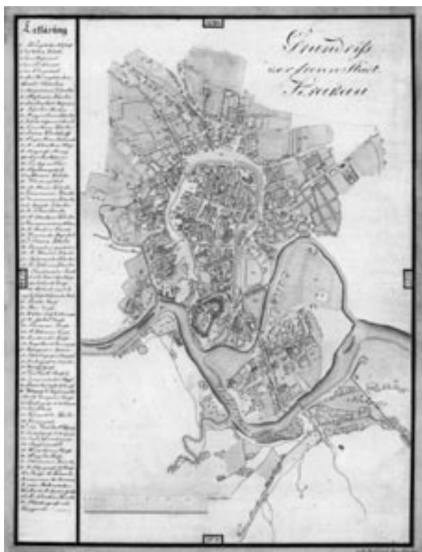
Grundriss der freien Stadt Krakau (Plan z czasu Wolnego Miasta Krakowa), 1817, skala 1:7000, aut. M. Passeck, rkps, tusz, akwarela, wł. Muzeum Historyczne Miasta Krakowa, sygn. B/T/VIIIa 21