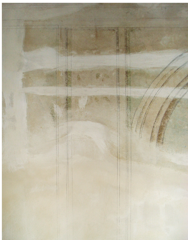
Fragment ściany wschodniej przed konserwacją estetyczną, fot. Małgorzata Kaczmarczyk, styczeń 2014 r.

Działania konserwatorskie w pomieszczeniach zachodniego skrzydła pałacu Pod Krzysztoforą rozłożone były na trzy etapy. Pierwszy z nich stanowiły prace badawczo-odkrywcze na obecność polichromii 1 . Drugi obejmował konserwację techniczną, w której zakres wchodziło odsłonięcie oryginalnej polichromii spod późniejszych nawarstwień oraz uzupełnienie tynku i pobiał. Prace trzeciego etapu dotyczyły konserwacji estetycznej dekoracji malarskiej.