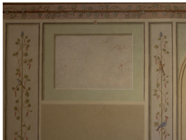
Ściana wschodnia, supraporta po konserwacji estetycznej, fot. Piotr Gwóźdź, kwiecień 2014 r.

Prace te wykonano w technice wapiennej, wzmocnionej Primaem AC 33 w celu podniesienia odporności tej warstwy na ścieranie. Tak przygotowana powierzchnia stała się odpowiednio chłonnym podkładem do naniesienia kolejnych warstw rekonstrukcji malarskiej, wykonanej z użyciem polialkoholu winylu jako spoiwa.