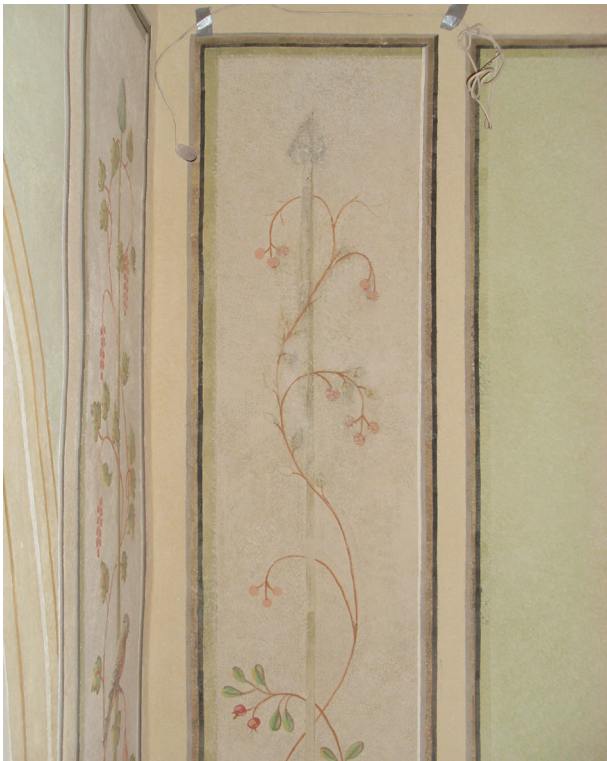
Fragment ściany południowej w trakcie rekonstrukcji wici roślinnej. Widoczne zachowane ślady oryginału, fot. Małgorzata Kaczmarczyk, marzec 2014 r.