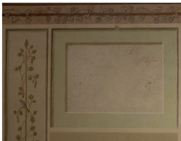
Fragment ściany wschodniej. Z lewej – przed konserwacją estetyczną, fot. Katarzyna Gwóźdź, styczeń 2014 r. Z prawej – po konserwacji estetycznej, fot. Piotr Gwóźdź, kwiecień 2014 r.