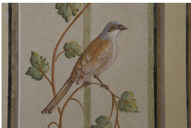
Ściana zachodnia, zrekonstruowany fragment dekoracji, fot. Piotr Gwóźdź, kwiecień 2014 r.