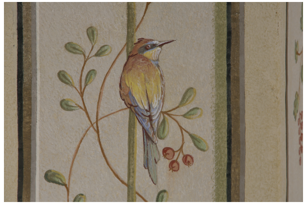
Ściana południowa, zrekonstruowany fragment dekoracji, fot. Piotr Gwóźdź, kwiecień 2014 r.