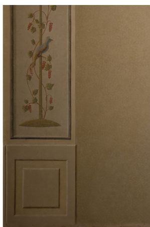
Strefa cokołu ściany wschodniej. Z lewej – przed konserwacją estetyczną, fot. Katarzyna Gwóźdź, styczeń 2014 r. Z prawej – po konserwacji estetycznej, fot. Piotr Gwóźdź, kwiecień 2014 r.

no fragmenty wici roślinnych i częściowo zachowanych ptaków. Zarys ich sylwetek widoczny jest na fotografiach sprzed konserwacji estetycznej na pierwszej, drugiej i czwartej płycinie na ścianie wschodniej.