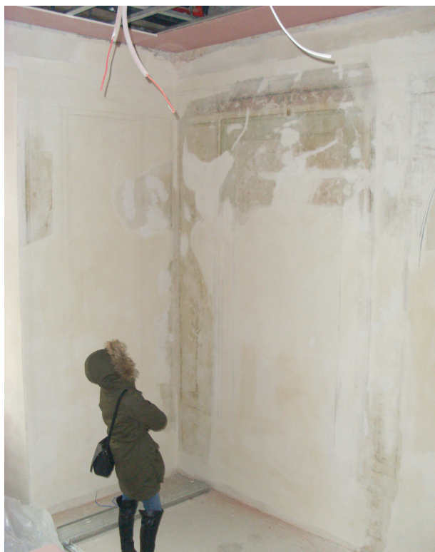
Ściany północna i wschodnia przed konserwacją estetyczną, fot. Małgorzata Kaczmarczyk, styczeń 2014 r.