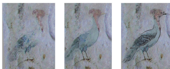
zachowane fragmenty oryginału