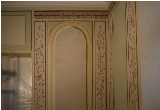
Ściana zachodnia, stan po konserwacji estetycznej, kwiecień 2014 r.