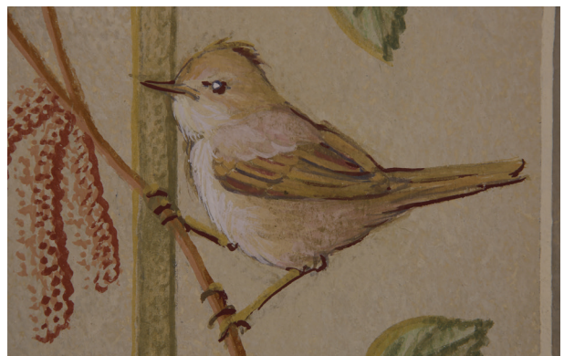
Ściana południowa, zrekonstruowany fragment dekoracji, fot. Piotr Gwóźdź, kwiecień 2014 r.

się zrekonstruować, wskazywały na dużą różnorodność oraz fantazyjną stylistykę niektórych z nich 6 .