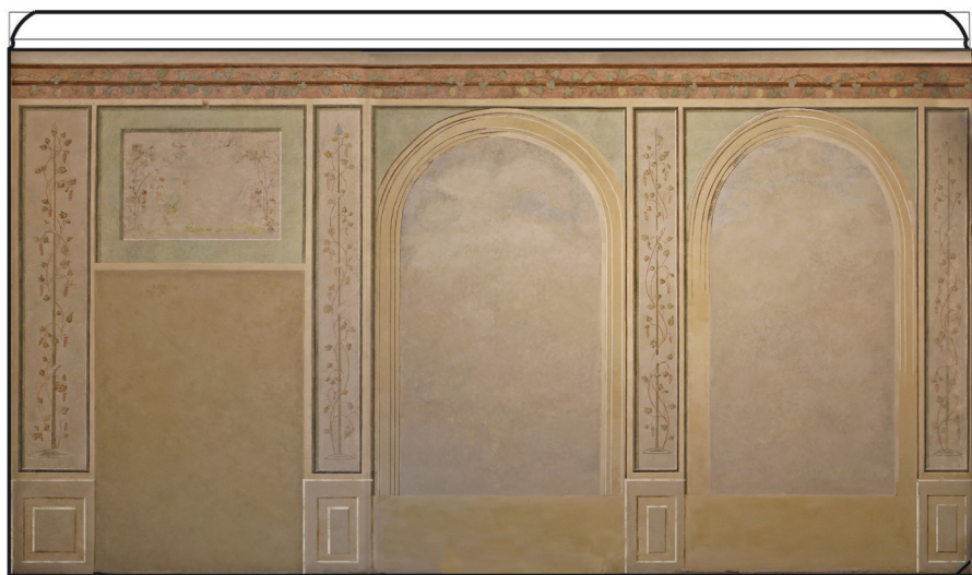
Ściana wschodnia, komputerowy projekt rekonstrukcji wykonany w pierwszym etapie konserwacji estetycznej, oprac. Katarzyna Gwóźdź, styczeń 2014 r.

→ lokalizacja obiektu na planie sytuacyjnym