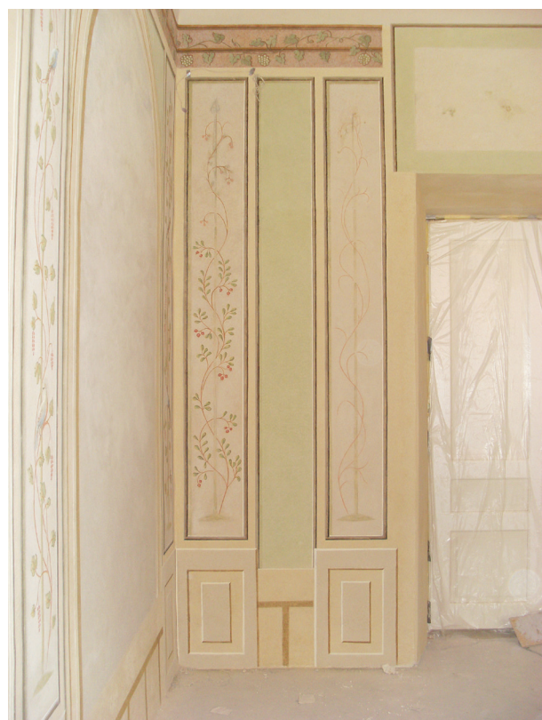
Widok ściany południowej w trakcie rekonstrukcji wici roślinnej. W górnej strefie widoczne zachowane ślady oryginału, fot. Małgorzata Kaczmarczyk, marzec 2014 r.

Wykonane wcześniej projekty rekonstrukcji wici roślinnych dla czterech pionowych płycin mogły być pomocne przy aranżacji pozostałych dwunastu. Na płycinach pozbawionych oryginału ornamenty zostały ułożone w taki sposób, aby przy zachowaniu podobieństwa ich kształt nie był w zbyt oczywisty sposób powtórzony.