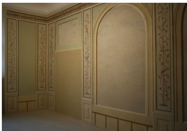
Ściany północna i wschodnia, polichromia po konserwacji estetycznej, fot. Piotr Gwóźdź, kwiecień 2014 r.