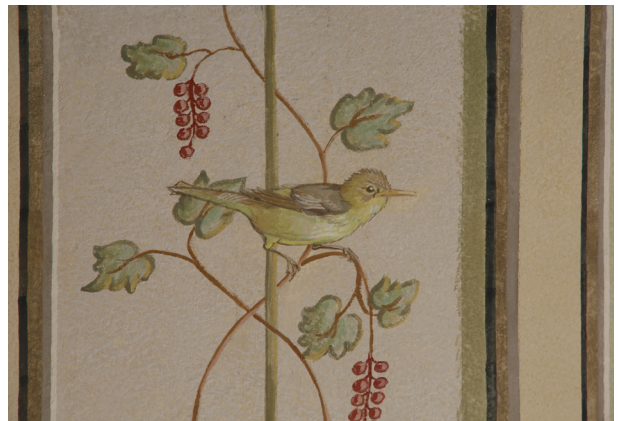
Ściana zachodnia, zrekonstruowany fragment dekoracji, fot. Piotr Gwóźdź, kwiecień 2014 r.