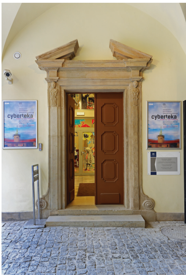
Węście główne z sieni do skrzydła zachodniego, obramione kamiennym portalem, fot. Tomasz Kalarus, październik 2015 r.

Operacyjnego 9 . W odrestaurowanych wnętrzach skrzydła zachodniego 30 października 2014 roku została otwarta nowa wystawa Cyberteka. Kraków – czas i przestrzeń 10 , prezentująca metodą multimedialną dzieje i rozwój przestrzenny Krakowa.