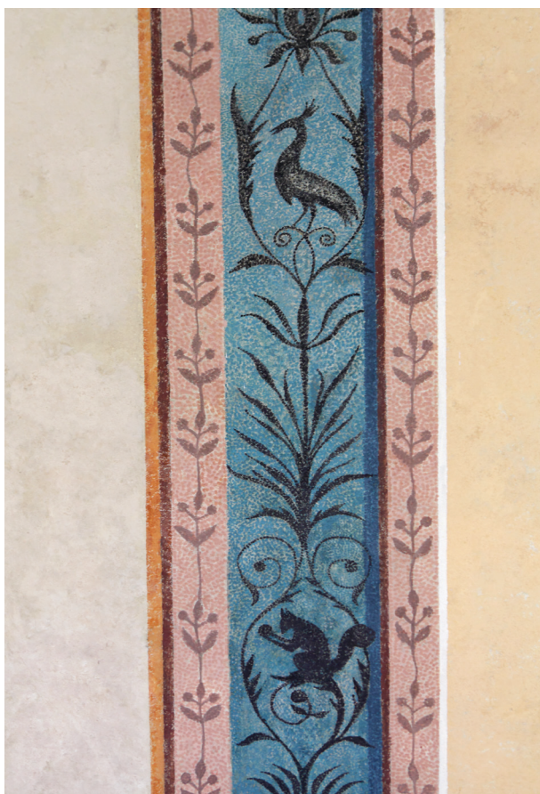
Fragment dekoracji malarskiej sali na pierwszym piętrze traktu północnego, z powtarzalnym ornamentem roślinnym z motywem wiewiórki i pawia, fot. Tomasz Kalarus, październik 2015 r.

skrzydła, na wzór zabytkowych, marmurowe posadzki (tzw. Morawica) w układzie szachownicowym, na schodach i podestach klatki schodowej, w pomieszczeniu traktu środkowego pierwszego piętra oraz w piwnicach; w pozostałych pomieszczeniach (poza przeznaczonymi na cele sanitarne) położono drewniane parkiety taflowe, wykonane na wzór zabytkowych. Nową aranżację kolorystyczną uzyskała klatka schodowa (zaproponowaną przez nadzór inwestorski), dostosowaną do jej charakteru stylowego, podkreślającą detal architektoniczny. Zabiegami renowacyjnymi, z częściami wymianą na nową o formach stylowych, objęto stolarkę drzwiową, z zachowaniem stylowych, esowatych okuć z drzwi wejściowych. Szczególnie ważna dla funkcjonowania skrzydła zachodniego była budowa windy osobowej, dzięki której zarówno odrestaurowane wnętrza, jak i nowo utworzona ekspozycja muzealna Cyberteka. Kraków – czas