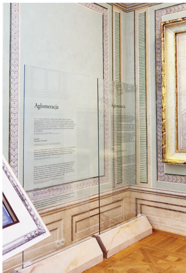
Fragment dekoracji malarskiej w narożnej sali drugiego piętra traktu południowego z motywem ornamentalnym, tzw. cekinowym, fot. Tomasz Kalarus, październik 2015 r.

skrzydła, na wzór zabytkowych, marmurowe posadzki (tzw. Morawica) w układzie szachownicowym, na schodach i podestach klatki schodowej, w pomieszczeniu traktu środkowego pierwszego piętra oraz w piwnicach; w pozostałych pomieszczeniach (poza przeznaczonymi na cele sanitarne) położono drewniane parkiety taflowe, wykonane na wzór zabytkowych. Nową aranżację kolorystyczną uzyskała klatka schodowa (zaproponowaną przez nadzór inwestorski), dostosowaną do jej charakteru stylowego, podkreślającą detal architektoniczny. Zabiegami renowacyjnymi, z częściami wymianą na nową o formach stylowych, objęto stolarkę drzwiową, z zachowaniem stylowych, esowatych okuć z drzwi wejściowych. Szczególnie ważna dla funkcjonowania skrzydła zachodniego była budowa windy osobowej, dzięki której zarówno odrestaurowane wnętrza, jak i nowo utworzona ekspozycja muzealna Cyberteka. Kraków – czas