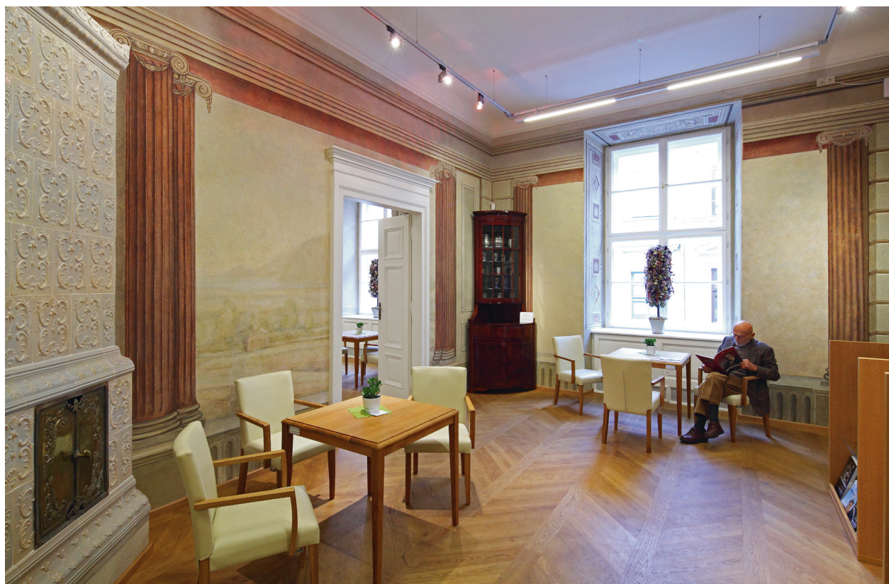
Widok z narożnika sali na pierwszym piętrze taktu północnego w kierunku sąsiednich pomieszczeń, fot. Tomasz Kalarus, październik 2015 r.