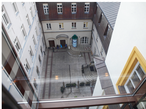
Widok z czwartego piętra windy na dziedziniec, fot. Tomasz Kalarus, październik 2015 r.

przewizoryczna zabudowa przy południowym murze granicznym zastąpiona została dwukondygnacyjnym pasażem, mieszczącym zaplecze techniczne Muzeum, architektonicznie znakomicie konweniującym z otoczeniem, domykając kompozycyjnie dziedziniec pałacowy. Istotnym elementem architektonicznym wzbogacającym zespół zabytkowy jest nadbudowa o jedną kondygnację narożnego pawilonu dawnej restauracji Rooster, zaprojektowana w duchu współczesnego funkcjonalizmu. Przeznaczona jest na aulę muzealną, wyposażoną w najnowocześniejszy sprzęt audiowizualny, przewidzianą na pomieszczenie 200 osób. Stanowi ona znakomite dopełnienie ogólnodostęp-