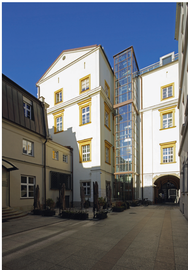
Widok skrzydła zachodniego od strony dziedzińca, w narożniku oszklony szyb windy, październik 2015 r.