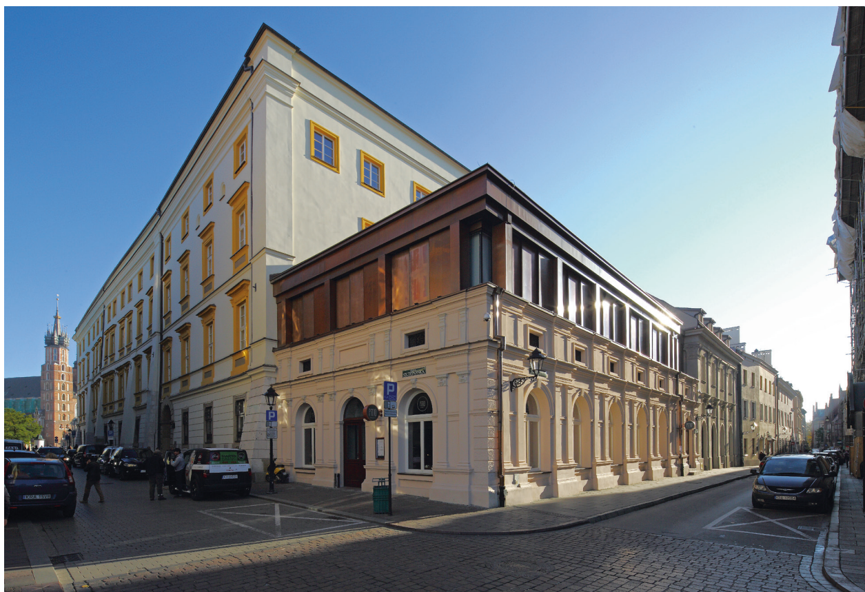
Widok z placu Szczepańskiego na pawilon na rogu ulic Jagiellońskiej i Szczepańskiej, współcześnie nadbudowany, mieszczący na piętrze aulę muzealną, październik 2015 r.