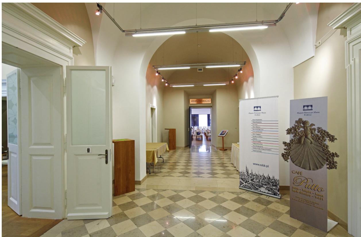
Trakt środkowy skrzydła zachodniego, łączący w poziomie pierwszego piętra klatkę schodową z aulą muzealną, fot. Tomasz Kalarus, październik 2015 r.

cu Pod Krzysztoforą – skrzydło zachodnie 12 . W postulowanych wnioskach konserwatorskich program zakładał, że dekoracja malarska zostanie zachowana i eksponowana w pięciu pomieszczeniach: w poziomie pierwszego piętra w dwóch pomieszczeniach w trakcie północnym od ulicy Szczepańskiej oraz na drugim piętrze w trzech pomieszczeniach, tj. dwóch w trakcie od ulicy Szczepańskiej i jednym narożnym, południowo-zachodnim, od strony dziedzińca. W ramach pierwszego etapu prac konserwatorskich, poprzedzających prace budowlane, została odsłonięta najlepiej zachowana warstwa z dekoracją malarską datowaną na przełom XVIII i XIX wieku i poddana zabiegom zachowawczym na czas wykonywania prac budowlanych 13 . W 2012 roku kontynuowano prace