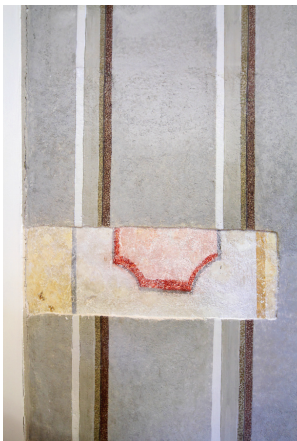
Fragment dekoracji malarskiej, tzw. świadek dokumentujący odkryte nawarstwienia polichromii, zachowany w przejściu pomiędzy salami pierwszego piętra w trakcie północnym, październik 2015 r.