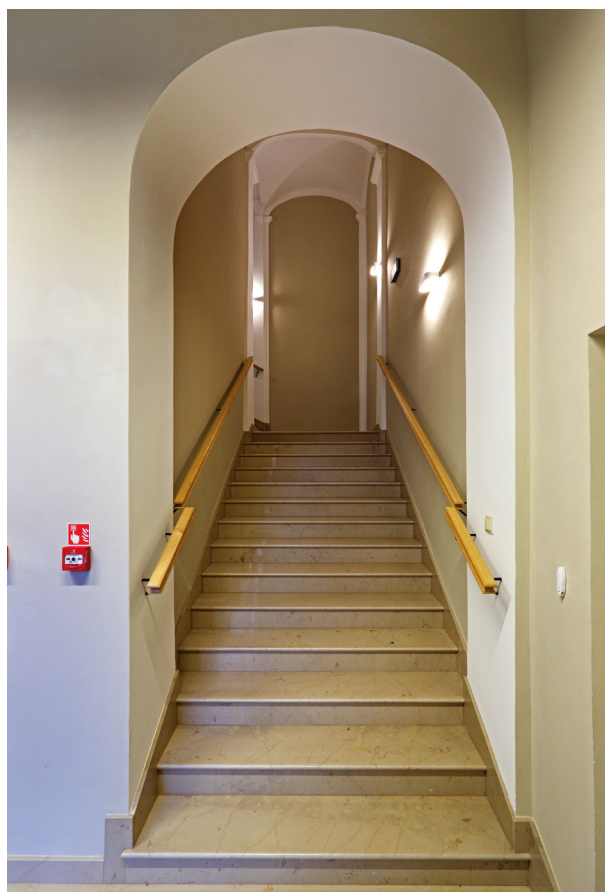
Klatka schodowa w nowej aranżacji kolorystycznej, z nowymi marmurowymi stopnicami, październik 2015 r.