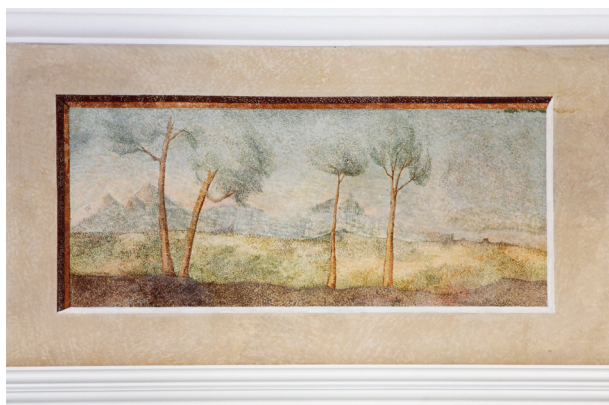
Supraporta ponad drzwiami łączącymi pomieszczenia pierwszego piętra traktu północnego z widokiem pejzażowym, zrekomponowany w trakcie prac konserwatorskich, fot. Tomasz Kalarus, październik 2015 r.