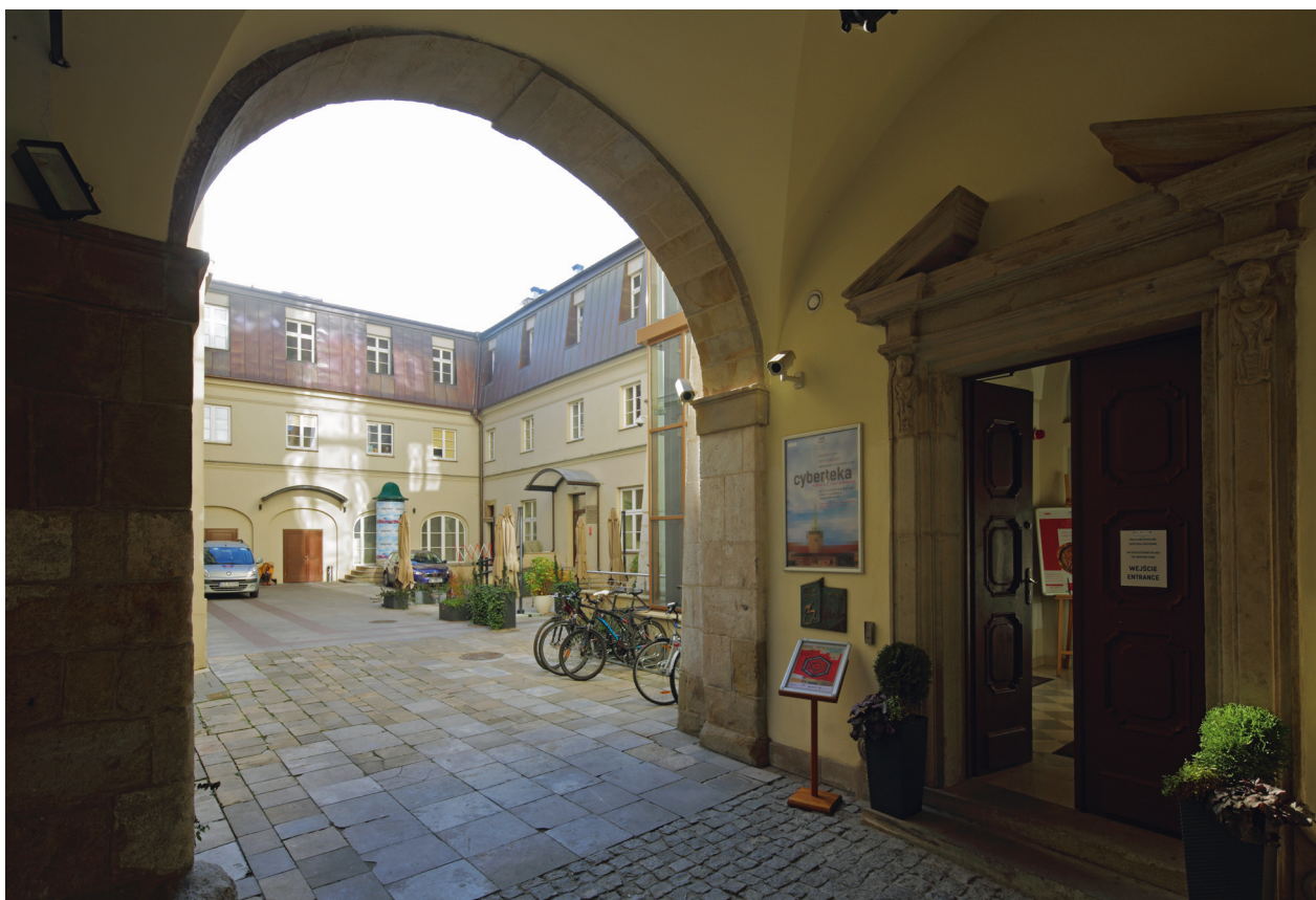
Widok zrewaloryzowanej przestrzeni dziedzińca pałacowego spod arkady galerii, fot. Tomasz Kalarus, październik 2015 r.

ekspozowanej działce lokacyjnej przy Rynku Głównym 5 . W okresie po II wojnie światowej przypadkowi lokatorzy i użytkownicy eksploatowali budowlę, doprowadzając do jej degradacji, powstrzymywanej punktowymi reperacjami i konserwacjami, prowadzonymi z powodu niewystarczających środków finansowych w ograniczonym zakresie 6 .