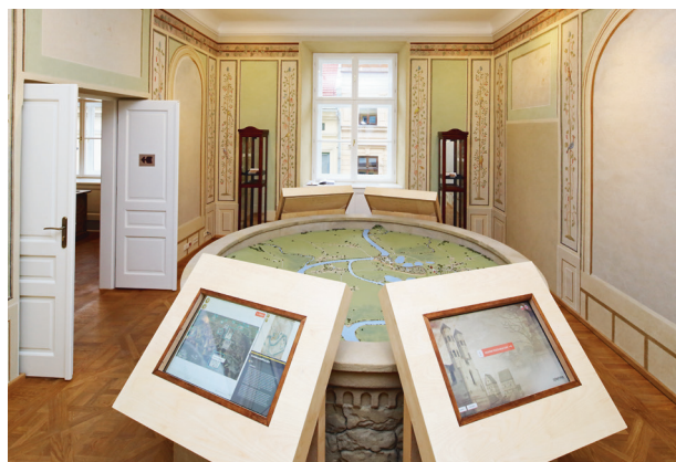
Sala wystawowa urządzona w odrestaurowanym pomieszczeniu na drugim piętrze w trakcie północnym, fot. Tomasz Kalarus, październik 2015 r.

kresie (techniczną i estetyczną) wystroju wnętrz w skrzydle zachodnim pałacu Pod Krzysztofory na podstawie zatwierdzonego „Programu prac konserwatorskich. Konserwacja polichromii na ścianach pomieszczeń skrzydła zachodniego w Krakowie oraz kamiennego detalu architektonicznego pałacu Pod Krzysztofory w Krakowie”, opracowanego przez mgr. Jana Szczurka (Kraków, maj 2013), opartego na opracowaniu Grażyny Dreścik „Polichromie w pałacu pod Krzysztofory przy Rynku Głównym 35 w Krakowie”. Prace zostały podjęte w listopadzie 2013 roku, a zakończone w sierpniu 2014 roku. Konserwację dekoracji malarskiej pod kierunkiem artysty konserwatora Jana Szczurka wykonali artyści konserwatorzy: Alicja Gut, Tomasz Wielek, Michalina Drewniak-Mosurek, Monika Kaczmarczyk,