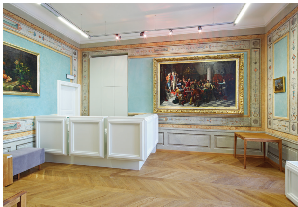
Widok sali recepcyjnej, łączącej się funkcjonalnie z aulą muzealną, fot. Tomasz Kalarus, październik 2015 r.

w rekonstruowanych partiach malowideł. Biorąc pod uwagę charakter użytkowania pomieszczeń, rodzaj i stylistykę