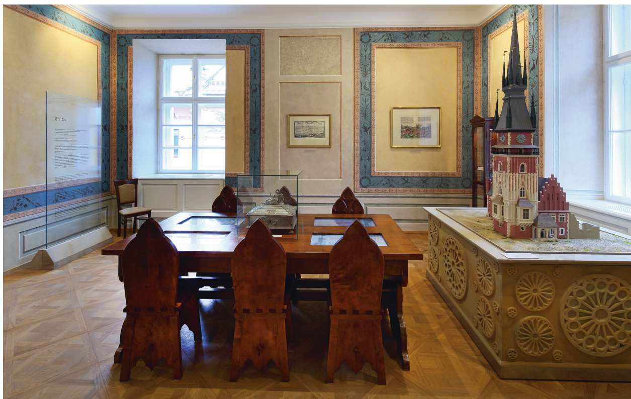
Sala na pierwszym piętrze skrzydła zachodniego, trakt północny po kompleksowej restauracji, przywracającej pierwotny, stylowy charakter, obecnie znajduje się tu część wystawy Cyberteka. Kraków – czas i przestrzeń, październik 2015 r.