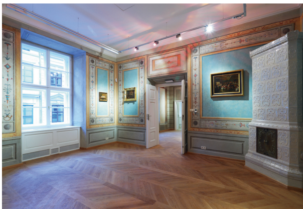
Widok sali na pierwszym piętrze w trakcie północnym, pełniącej funkcje recepcyjne, fot. Tomasz Kalarus, październik 2015 r.