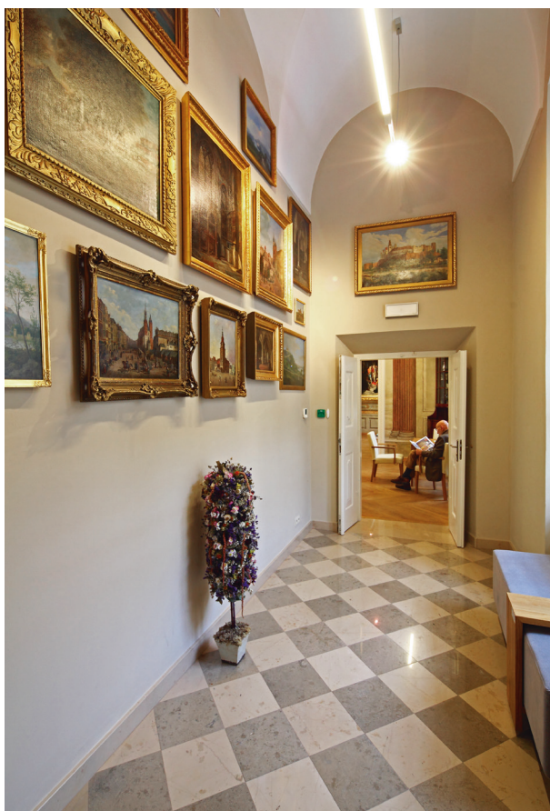
Korytarzyk łączący dawny gabinet (tzw. kaplica) z pierwszym piętrem skrzydła zachodniego, w nim nowo urządzona galeria muzealna z widokami dawnego Krakowa, fot. Tomasz Kalarus, październik 2015 r.

na modernizacja budowli, w wyniku której zamknęła się faza jej rezydencjonalnego charakteru. Przemiany objęły nie tylko przebudowę fasady, połączoną z usunięciem figury św. Krzysztofa, zmianę mezaninu na kondygnację, zmianę poziomów użytkowych dostosowanych do pałacu Spiskiego, ale również przekształcenie i urządzenie licznych apartamentów wynajmowanych za czynsz. Wnętrza – z wyjątkiem dawnego salonu i gabinetu z dekoracją stiukową Baltazara Fontany – otrzymały nowe dekoracje w postaci profilowanych faset i dekoracji malarskich. Zgodnie