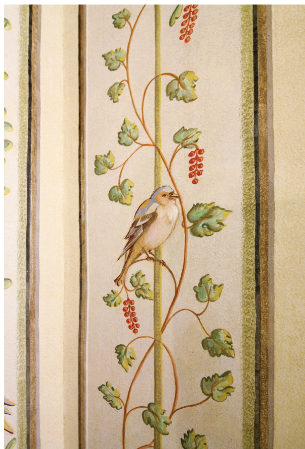
Fragment dekoracji malarskiej w sali na drugim piętrze traktu północnego z motywem ornamentalnym wici roślinnej i egzotycznych ptaszków (por. artykuł Małgorzaty Kaczmarczyk i Katarzyny Gwóźdź w niniejszym tomie), fot. Tomasz Kalarus, październik 2015 r.

Dopełnieniem konserwacji, rekonstrukcji i aranżacji wystroju i wyposażenia pomieszczeń pierwszego i drugiego piętra była wymiana pierwotnych, zużytych technicznie su-