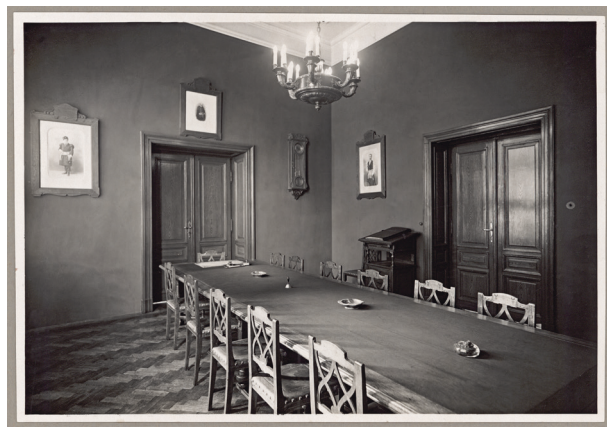
Gmach Kasy przy ul. Pijarskiej 1, sala posiedzeń, lata 20.–30. XX w., autor fotografii nieznanymi, Księga pamiątkowa, s. 28

wieka – to nie tylko ograniczenie potrzeb dzisiejszych na rzecz lepszego i jaśniejszego jutra. Oszczędność w życiu społecznym zawiera w sobie szereg cnót moralnych – jak rzetelność, uczciwość, przezorność, poszanowanie wszelkiego cudzego dobra, skrupulatne wypełnianie obowiązków wobec rodziny, społeczeństwa i państwa”, „Droga do dobrobytu, do samodzielności gospodarczej, do wytworzenia materialnej siły i potęgi Państwa – prowadzi przez powszechną, dobrze rozumianą i konsekwentnie wyko-