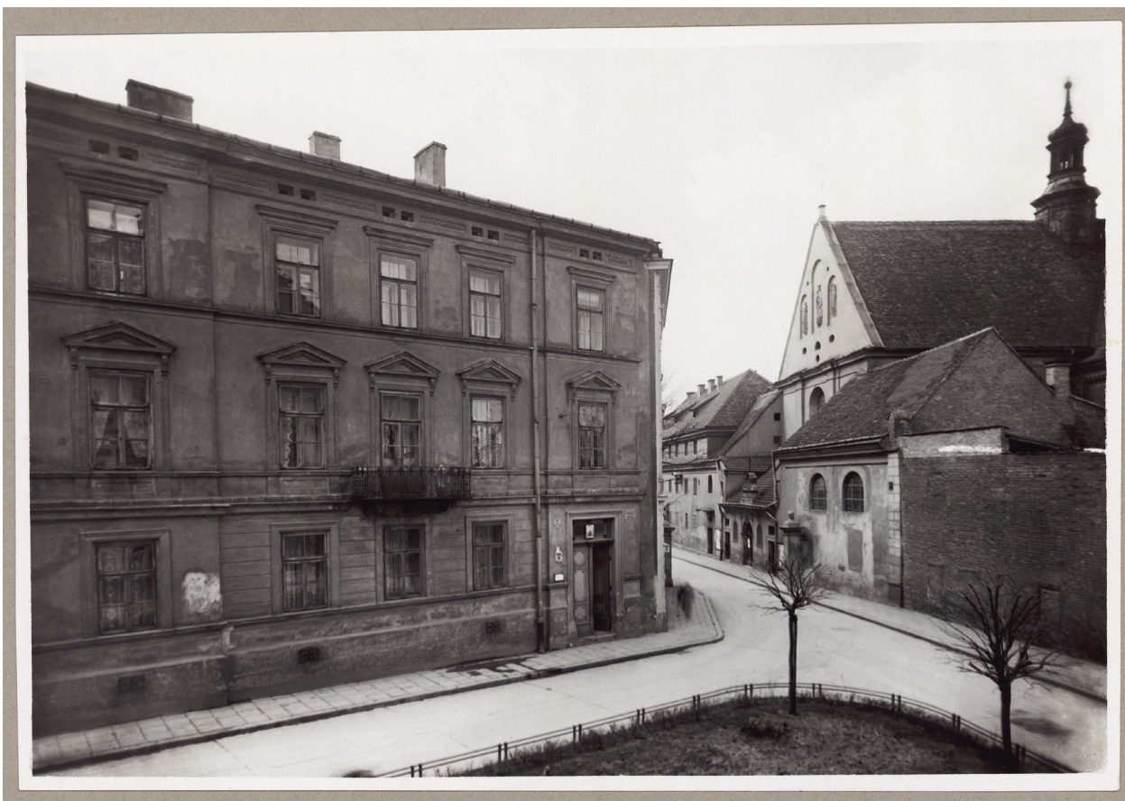
Pierwotne pomieszczenie Powiatowej Komunalnej Kasy Oszczędności przy ul. św. Marka 5, początek XX w., autor fotografii nieznany, Księga pamiątkowa, s. 21