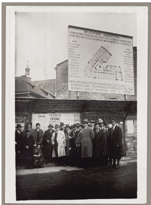
Grupa pracowników Kasy, inżynierów i projektantów przy tablicy informacyjnej o budowie gmachu Powiatowej Komunalnej Kasy Oszczędności w Krakowie przy placu Szczepańskim 5, maj 1933 r., autor fotografii nieznanym, Księga pamiątkowa, s. 88