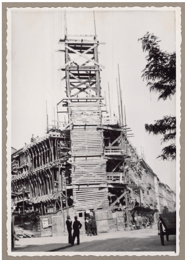
Budowa nowego gmachu Kasy przy placu Szczepańskim, widok od strony Plant, ok. 1933 r., fot. i sygn. „J. VOIGHT, optyk dypl. Kraków”, Księga pamiątkowa, s. 119