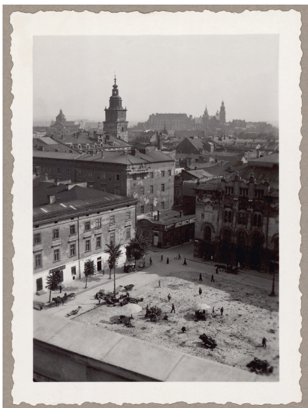
Widok z terenu budowy nowego gmachu Kasy przy placu Szczepańskim 5, widok na plac Szczepański, Stary Teatr i pałac Pod Krzysztofory, ok. 1934 r., autor fotografii nieznaną, Księga pamiątkowa, s. 143

W większości zostały wykonane na zlecenie projektantów budynku, Stefana Strojka i Fryderyka Tadaniera, i stanowiły materiały dokumentujące poszczególne fazy i etapy budowy. Interesujące są fotografie pokazujące budowniczych gmachu: robotników, kadrę kierowniczą oraz projektantów i inwestorów. Jednak najciekawsze są fotografie z 1934 roku ukazujące widok na plac Szczepański oraz panoramę Krakowa, wykonane z tarasu budowanego wieżowca. Na odwrocie 21 fotografii znajdują się odciski pieczętek firmowych: „J. VOIGT OPTYK DYPL. KRAKÓW” 56 oraz na ośmiu z nich odciski pieczętek: INŻYNIEROWIE – ARCHITEKCI STEFAN STROJEK I FRYDERYK TADANIER – KRAKÓW – UL. BASZTOWA 17. TELEF: 106-26.