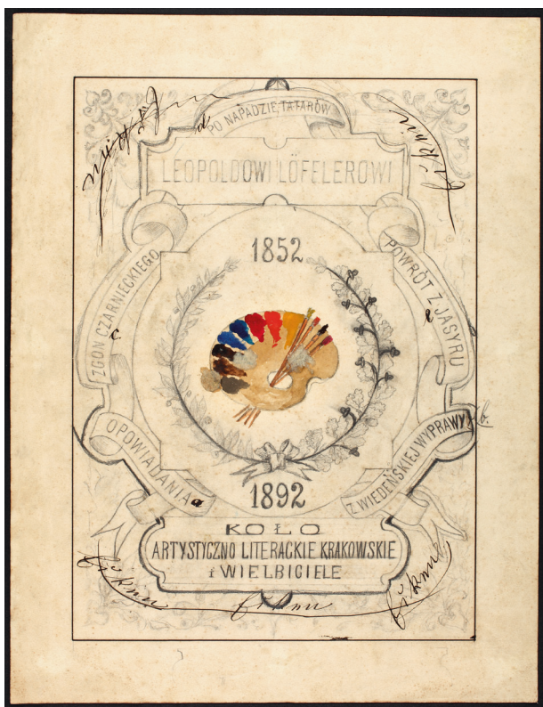
Projekt oprawy albumu dla Leopolda Löfflera, projekt Juliusza Kossaka, Kraków, ok. 1892 r., karton; w zbiorach MHK, nr inw. MHK-629/DIP/10

Skargi w Krakowie w 1911 roku, Wszechświatowej wystawie sztuki książki Burga w Lipsku w 1914 roku (złoty medal) 14 .