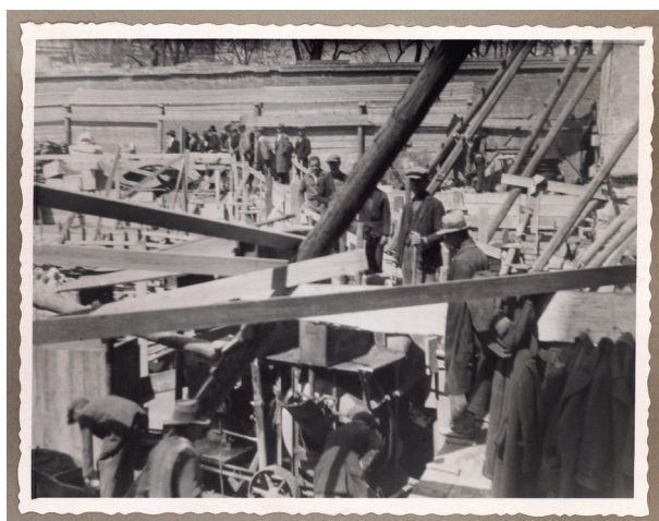
Robotnicy na placu budowy gmachu Kasy przy placu Szczepańskim 5, 1933, fot. i sygn. „J. VOIGHT, optyk dypl. Kraków”, Księga pamiątkowa, s. 95

Investor zamierzał maksymalnie wykorzystać niewielką przestrzeń, dlatego pierwotny projekt przewidywał budowę siedmiopiętrowego gmachu o elewacji frontowej wynoszącej ponad 30 m. Przekraczał on parametry wysokościowe dla budynków wznoszonych w centrum miasta aż o 9 m. Projekt został wówczas zmieniony. Przewidywano budowę gmachu pięciopiętrowego o wysokości 22 m i pięciu