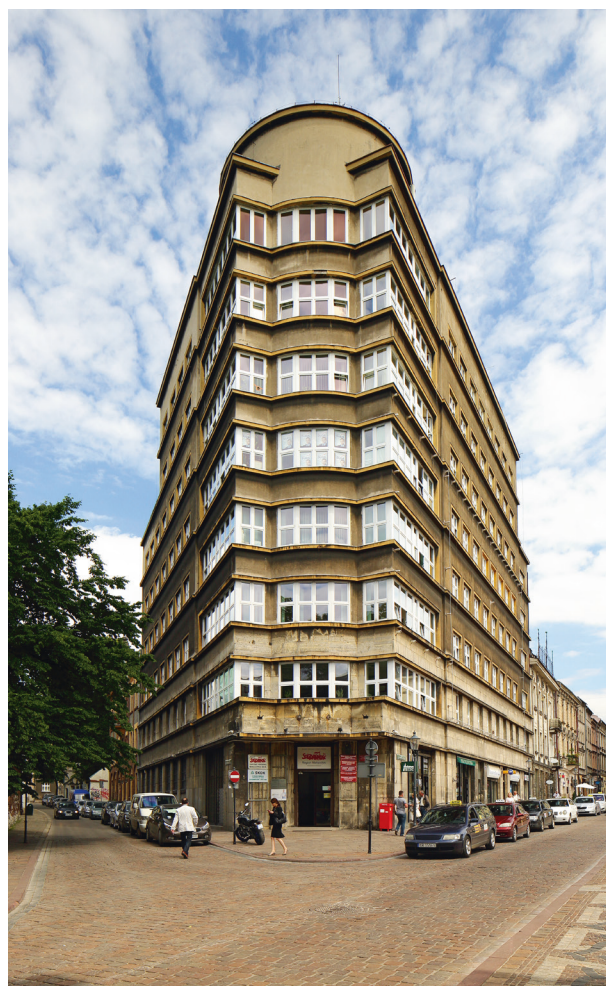
Gmach dawnej Kasy, ujęcie od strony Plant, widok obecny, fot. Andrzej Janikowski, czerwiec 2015 r.

We wrześniu 1989 roku gmach stał się siedzibą Zarządu Regionu Małopolskiego NSSZ „Solidarność” oraz licznych urzędów i organizacji. Obecnie prócz Małopolskiej „Solidarności” swoje biura i przedstawicielstwa w gmachu posiadają: Urząd Ochrony Konkurencji i Konsumentów Delegatura w Krakowie; Państwowa Inspekcja Pracy – Okręgowy Inspektorat Pracy w Krakowie; Wojewódzki Inspektorat Ochrony Środowiska w Krakowie; Lekarska Kasa Wzajemnej Pomocy w Krakowie; SKOK Krakowska Spółdzielcza Kasa Oszczędnościowo-Kredytowa; Wojewódzki Inspektorat Farmaceutyczny w Krakowie wraz