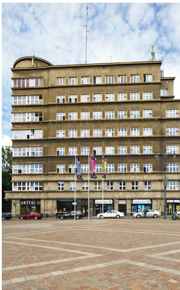
Gmach dawnej Kasy, ujęcie od strony placu Szczepańskiego, widok obecny, fot. Andrzej Janikowski, czerwiec 2015 r.

We wrześniu 1989 roku gmach stał się siedzibą Zarządu Regionu Małopolskiego NSSZ „Solidarność” oraz licznych urzędów i organizacji. Obecnie prócz Małopolskiej „Solidarności” swoje biura i przedstawicielstwa w gmachu posiadają: Urząd Ochrony Konkurencji i Konsumentów Delegatura w Krakowie; Państwowa Inspekcja Pracy – Okręgowy Inspektorat Pracy w Krakowie; Wojewódzki Inspektorat Ochrony Środowiska w Krakowie; Lekarska Kasa Wzajemnej Pomocy w Krakowie; SKOK Krakowska Spółdzielcza Kasa Oszczędnościowo-Kredytowa; Wojewódzki Inspektorat Farmaceutyczny w Krakowie wraz