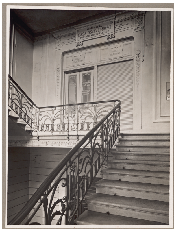
Gmach Kasy przy ul. Pijarskiej 1, klatka schodowa i wejście do biur, lata 20.–30. XX w., autor fotografii nieznany, Księga pamiątkowa, s. 39

nie przybranego gmachu Kasy, gdzie w wielkiej Sali Rady odbyło się uroczyste posiedzenie pod przewodnictwem prezesa Dr. Władysława Wnęka – równocześnie odbywało się normalne urzędowanie, przyczem dla upamiętnienia jubileuszu, składający w dniu tym swoje oszczędności otrzymywali specjalnie wydane, miniaturowe, luksusowe książeczki wkładkowe. Po południu wyświetlano film propagandowy w kinie »Apollo« na specjalnym przedstawieniu dla zaproszonych gości. O godz. 19. rozpoczęła się uroczysta akademicka w Sali »Florianki« przy ul. Basztowej 1. 8 przy wypełnionej Sali przez obywateli krakowskich, wobec przedstawicieli ministerstw oraz miejscowych władz państwowych (...) odbył się tamże raut, który zgromadził elitę towarzyską ziemi krakowskiej i zakończył uroczystości jubileuszowe 36 . Następnie na czterech kolejnych stronach widnieją podpisy uczestników uroczystości oraz pracowników Kasy.