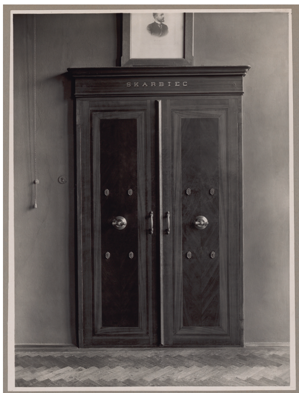
Gmach Kasy przy ul. Pijarskiej 1, skarbiec, lata 20.–30. XX w., autor fotografii nieznany, Księga pamiątkowa, s. 39