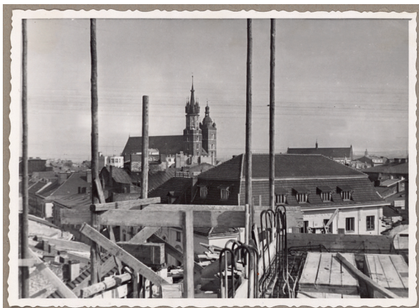
Widok z terenu budowy nowego gmachu Kasy w kierunku kościoła Mariackiego, ok. 1934 r., fot. i sygn. „J. VOIGHT, optyk dypl. Kraków”, Księga pamiątkowa, s. 123

kondygnacjach. Po rozpoczęciu inwestycji inwestor, czyli Powiatowa Komunalna Kasa, poleciła architektom zmienić jednak projekt i powrócić do wersji pierwotnej. Mimo zakazu wybudowano budynek o siedmiu kondygnacjach, nadbudowując kolejne piętra w ciągu zaledwie... trzech dni.