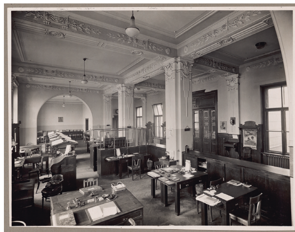
Gmach Kasy przy ul. Pijarskiej 1, widok na biura, lata 20.–30. XX w., Księga pamiątkowa, s. 27