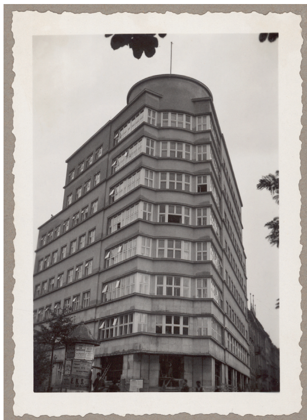
Nowy gmach Kasy przy placu Szczepańskim 5, widok od strony Plant, po wrześniu 1934 r., autor fotografii nieznanym, Księga pamiątkowa, s. 155

Ministerstwo Apropowizacji i Handlu, przedstawiciel dla spraw UNRRA na Województwo Kraków; Komisarz Rządowy dla Spraw Osadnictwa na Województwo Kraków; Komisja Specjalna do Walki z Nadużyciami i Szkodnictwem Gospodarczym oraz Urząd Wojewódzki w Krakowie, z Wydziałami Apropowizacji i Handlu oraz Przemysłowym 57 . W latach 1980–1989 w budynku miały swoją siedzibę następujące urzędy oraz instytucje, m.in.: Pełnomocnika do Sprawowania Zarządu Majątkiem byłych Central Związkowych, Państwowej Inspekcji Pracy, Państwowej Inspekcji Ochrony Środowiska Oddziału Terenowego, Wojewódzkiego Klubu Techniki i Racjonalizacji, Klubu „Bałamutka” Spółdzielni Pracy im. J. Dąbrowskiego, Społecznego Komitetu Przeciwalkoholowego, Okręgowego Ośrodka Racjonalizacji i Doradztwa Rolniczego, „Plastyka” Spółdzielni Pracy Artystów Plastyków, Wojewódzkiego Zrzeszenia Sportowego Spółdzielczości Pracy „Start”, Zarządu Wojewódzkiego Polskiego Związku Działkowców, Spółdzielczego Komitetu Zakładowego PZPR Śródmieście, Redakcji Wydawnictwa „Doświadczalny Mistrz” oraz restauracji „Spaghetti” 58 .