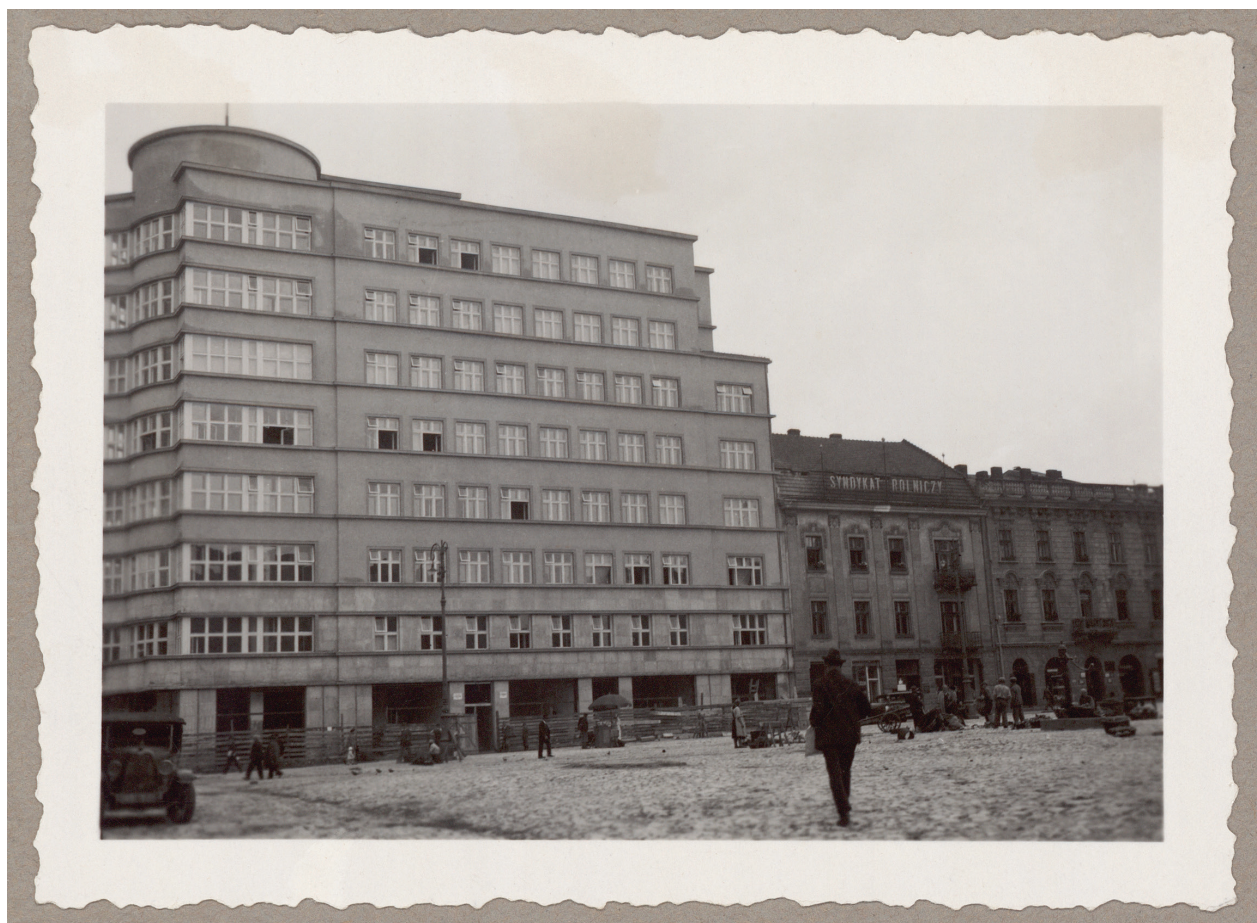
Nowy gmach Kasy, widok od strony placu Szczepańskiego, po wrześniu 1934 r., autor fotografii nieznanym, Księga pamiątkowa, s. 155

Ministerstwo Apropowizacji i Handlu, przedstawiciel dla spraw UNRRA na Województwo Kraków; Komisarz Rządowy dla Spraw Osadnictwa na Województwo Kraków; Komisja Specjalna do Walki z Nadużyciami i Szkodnictwem Gospodarczym oraz Urząd Wojewódzki w Krakowie, z Wydziałami Apropowizacji i Handlu oraz Przemysłowym 57 . W latach 1980–1989 w budynku miały swoją siedzibę następujące urzędy oraz instytucje, m.in.: Pełnomocnika do Sprawowania Zarządu Majątkiem byłych Central Związkowych, Państwowej Inspekcji Pracy, Państwowej Inspekcji Ochrony Środowiska Oddziału Terenowego, Wojewódzkiego Klubu Techniki i Racjonalizacji, Klubu „Bałamutka” Spółdzielni Pracy im. J. Dąbrowskiego, Społecznego Komitetu Przeciwalkoholowego, Okręgowego Ośrodka Racjonalizacji i Doradztwa Rolniczego, „Plastyka” Spółdzielni Pracy Artystów Plastyków, Wojewódzkiego Zrzeszenia Sportowego Spółdzielczości Pracy „Start”, Zarządu Wojewódzkiego Polskiego Związku Działkowców, Spółdzielczego Komitetu Zakładowego PZPR Śródmieście, Redakcji Wydawnictwa „Doświadczalny Mistrz” oraz restauracji „Spaghetti” 58 .