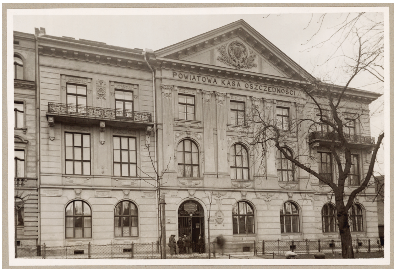
Gmach Powiatowej Komunalnej Kasy Oszczędności przy ul. Pijarskiej 1, front budynku od strony Plant, lata 20.–30. XX w., autor fotografii nieznanymi, Księga pamiątkowa, s. 21