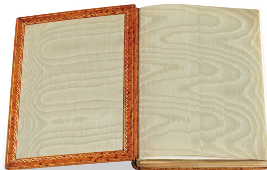
Wnętrze książki z wyklejką, fot. Tomasz Kalarus, 2014

jego pierwszych własnych prac wywarły styl i technika opraw książkowych z księgozbioru Hofbibliothek (Biblioteki Cesarskiej) w Wiedniu, z którymi się zapoznał.