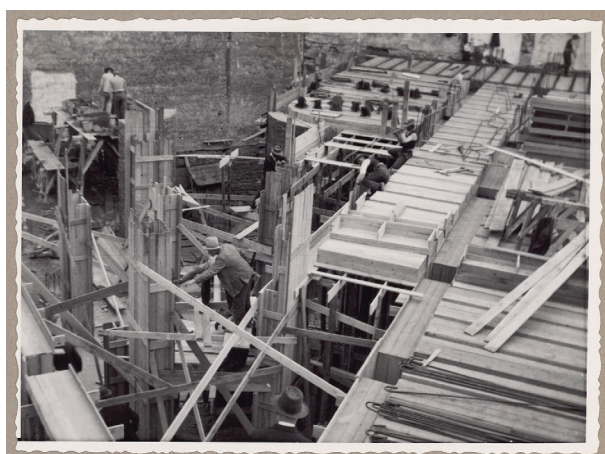
Robotnicy na placu budowy gmachu Kasy przy placu Szczepańskim 5, 1933, fot. i sygn. „J. VOIGHT, optyk dypl. Kraków”, Księga pamiątkowa, s. 107