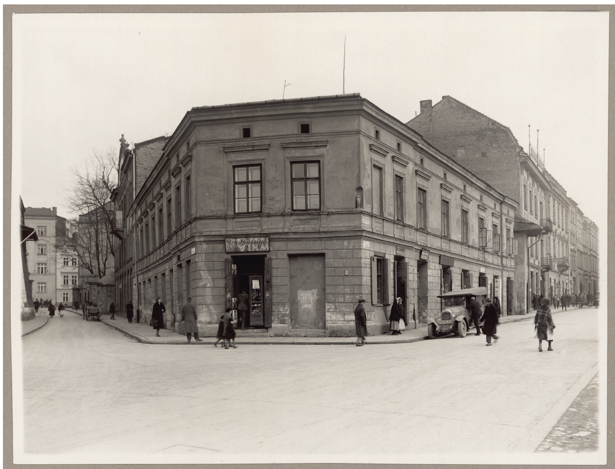
Dom przy placu Szczepańskim i ul. Reformackiej, gdzie w latach 1932–1934 wybudowano gmach Powiatowej Komunalnej Kasy Oszczędności, przed 1932 r., autor fotografii nieznaną, Księga pamiątkowa, s. 40

w całości na wpłatę na budowę nowego gmachu Muzeum Narodowego 47 . Za ten hojny dar otrzymał podziękowanie od prezydenta Miasta Krakowa Mieczysława Kaplickiego (właśc. Maurycy Kapellner, 1875–1959), o czym poświadcza wklejony do Księgi pamiątkowej dokument. Czytamy w nim: „Za hojny dar na fundusz budowy Muzeum Narodowego w Krakowie Komitet Obywatelski popierający wysiłek Rady Stoł. Król. M. Krakowa składa Powiatowej Kasie Oszczędności w Krakowie (...) Prezydent Miasta Krakowa” 48 .