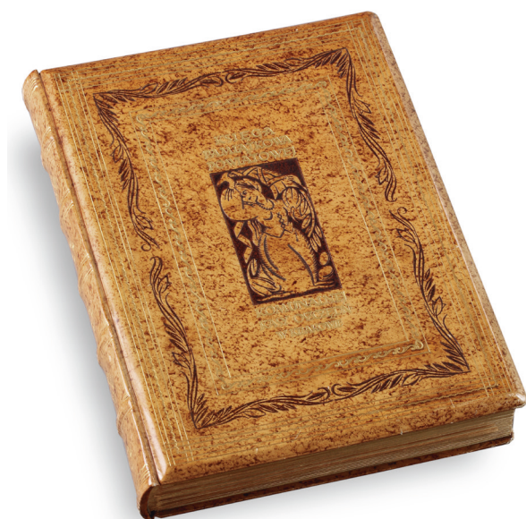
Księga pamiątkowa, lico oprawy