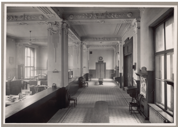
Gmach Kasy przy ul. Pijarskiej 1, hall dla klientów, lata 20.–30. XX w., autor fotografii nieznanymi, Księga pamiątkowa, s. 27