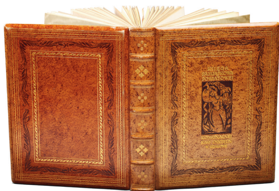
Księga pamiątkowa Powiatowej Komunalnej Kasy Oszczędności, lico, grzbiet i tylna okładka oprawy, nr inv. MHK-1793/III, 2014