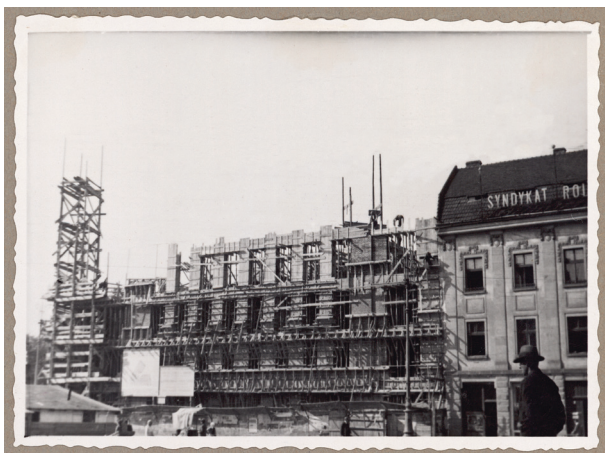
Budowa nowego gmachu Kasy, widok od strony placu Szczepańskiego, ok. 1933 r., fot. i sygn. „J. VOIGHT, optyk dypl. Kraków”, Księga pamiątkowa, s. 119