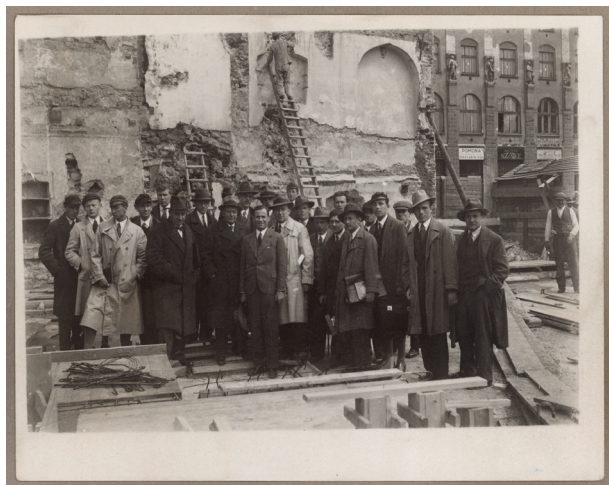
Grupa pracowników Kasy, inżynierów i projektantów na placu budowy gmachu Kasy przy placu Szczepańskim 5, 1933, autor fotografii nieznanym, Księga pamiątkowa, s. 88

skiego w Krypcie Zasłużonych kościoła św. Michała Archanioła na Skałce, 1938 42 .