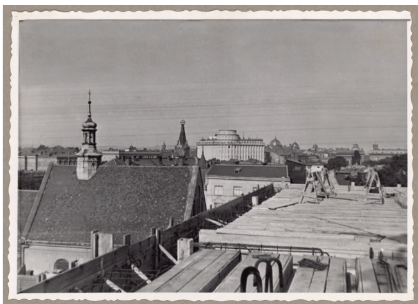
Widok z terenu budowy nowego gmachu Kasy w kierunku ul. Basztowej, ok. 1934 r., Księga pamiątkowa, s. 123