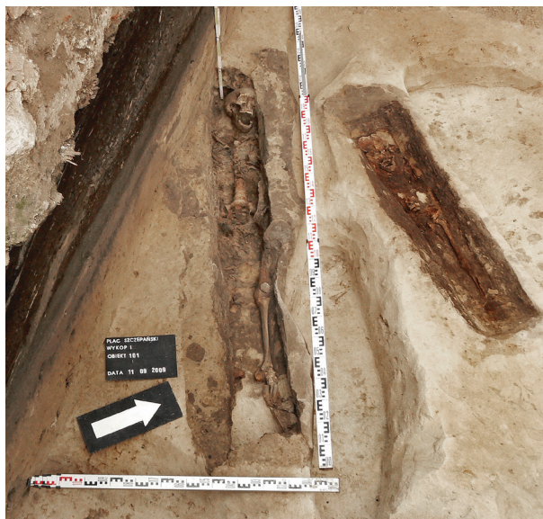
Ryc. 35. Grób nr 28 i grób nr 5

Obiekt 101, szkielet 28; lokalizacja: wykop I