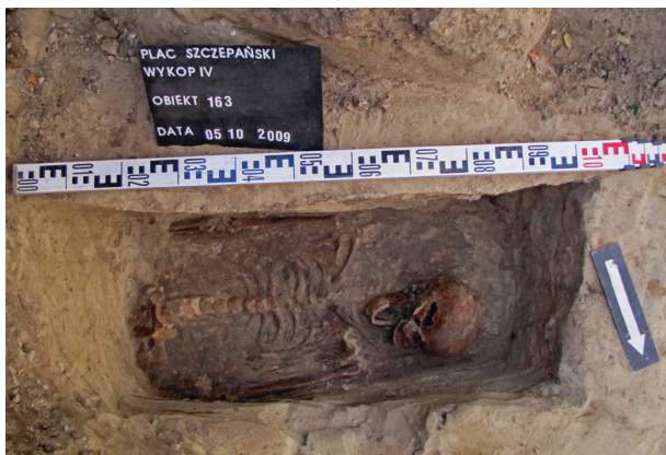
Ryc. 30. Grób nr 25