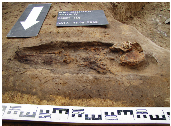
Ryc. 18. Grób nr 15