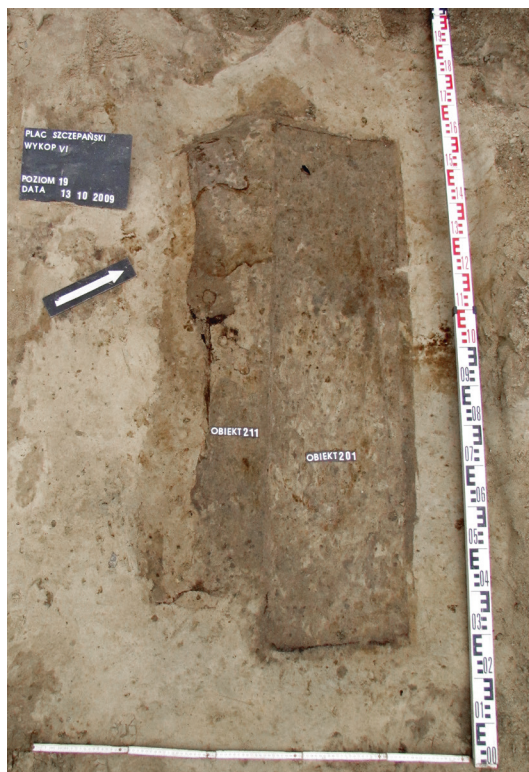
Ryc. 49. Grób nr 41 i 42 – zarys trumien

Obiekt 201, szkielet 41; lokalizacja: wykop VI