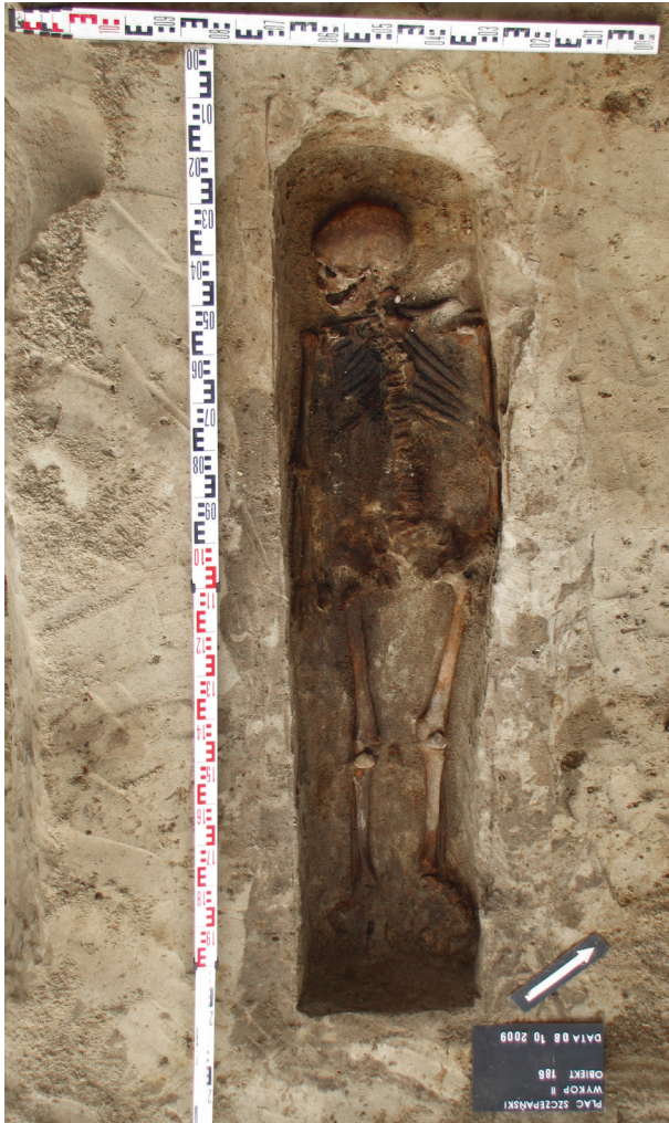
Ryc. 39. Grób nr 33

Obiekt 186, szkielet 33; lokalizacja: wykop II