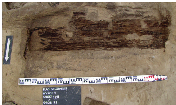
Ryc. 28. Grób nr 23 – wieko trumny

Obiekt 120, szkielet 23; lokalizacja: wykop V