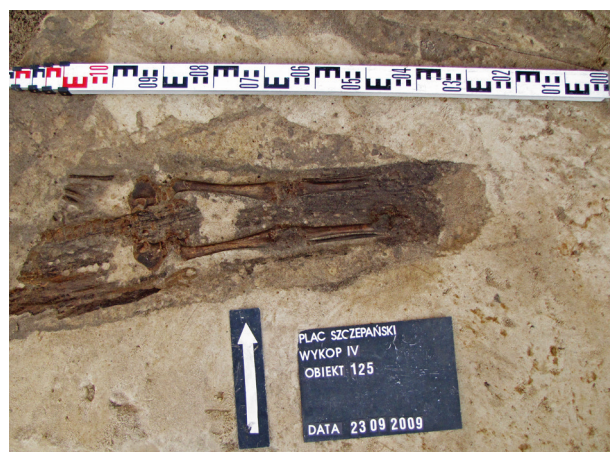
Ryc. 24. Grób nr 21, fot. Bartłomiej Tofel