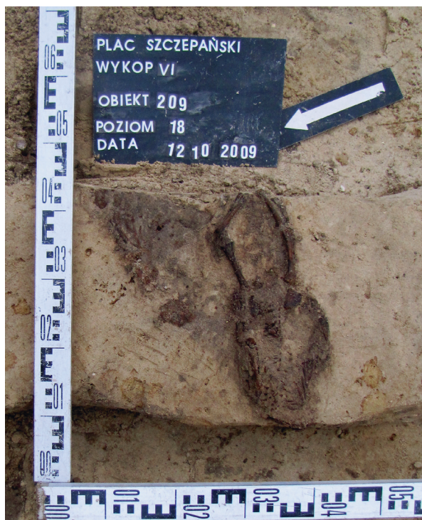
Ryc. 42. Grób nr 36

Obiekt 209, szkielet 36; lokalizacja: wykop VI