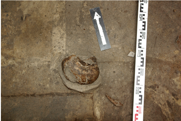
Ryc. 60. Grób nr S8

Lokalizacja: sondaż 1, m: y = 1 , x = 2,5 Zachowała się jedynie czaszka w zasypie grobu nr S15.