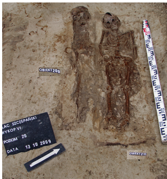
Ryc. 48. Grób nr 41 i grób nr 42, mylnie podpisane jako obiekty 209 i 211, fot. Marcin Bartoszek