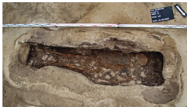
Ryc. 20. Grób nr 17, fot. Bartłomiej Tofel