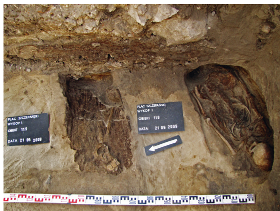
Ryc. 9. Grób nr 6 i grób nr 10