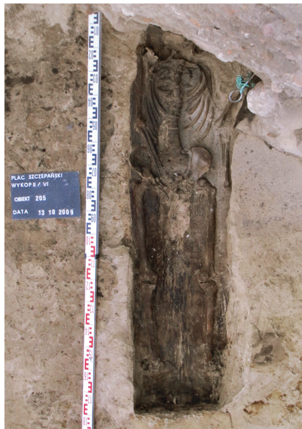
Ryc. 50. Grób nr 43 – prawa ręka lekko zgięta, ułożona na miednicy, prawa wyprostowana wzdłuż ciała

Obiekt 205, szkielet 43; lokalizacja: wykop II/VI