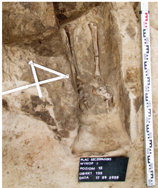
Ryc. 5. Grób nr 4

Obiekt 135, szkielet 4; lokalizacja: wykop I