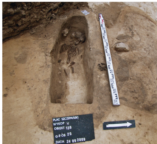
Ryc. 23. Grób nr 20

Obiekt 139, szkielet 20; lokalizacja: wykop V