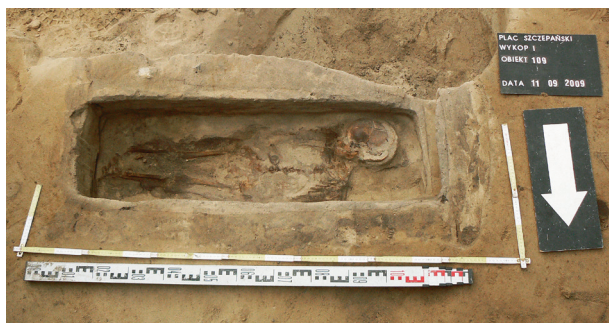
Ryc. 2. Grób nr 1

Obiekt 109, szkielet nr 1; lokalizacja: wykop I