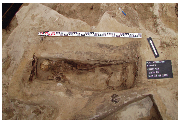
Ryc. 27. Grób nr 23 – szkielet, fot. Bartłomiej Tofel