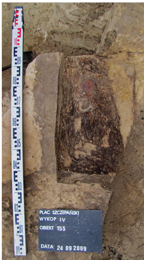
Ryc. 26. Grób nr 22

Obiekt 155, szkielet 22; lokalizacja: wykop IV