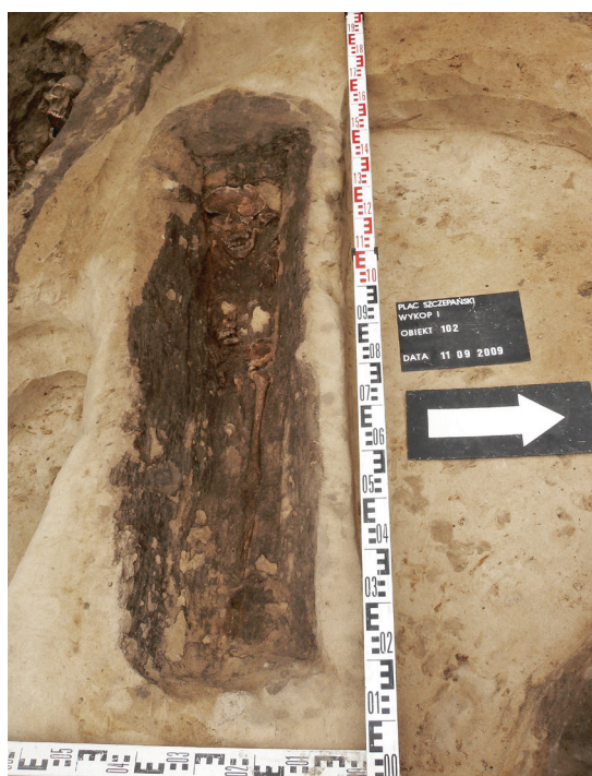
Ryc. 6. Grób nr 5 – widoczne dno i boki trumny, fot. Bartłomiej Tofel