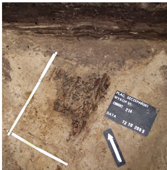
Ryc. 51. Grób nr 44

Obiekt 214, szkielet 44; lokalizacja: wykop VI