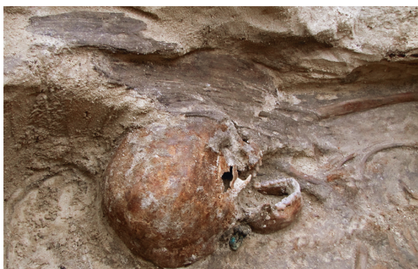
Ryc. 31. Grób nr 25 z kabłączkiem skroniowym, fot. Krzysztof Przygoda

Obiekt 163, szkielet 25; lokalizacja: wykop IV