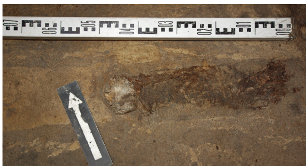
Ryc. 57. Grób nr S6

Lokalizacja: sondaż S1, m: y = 3, x = 1,5–2