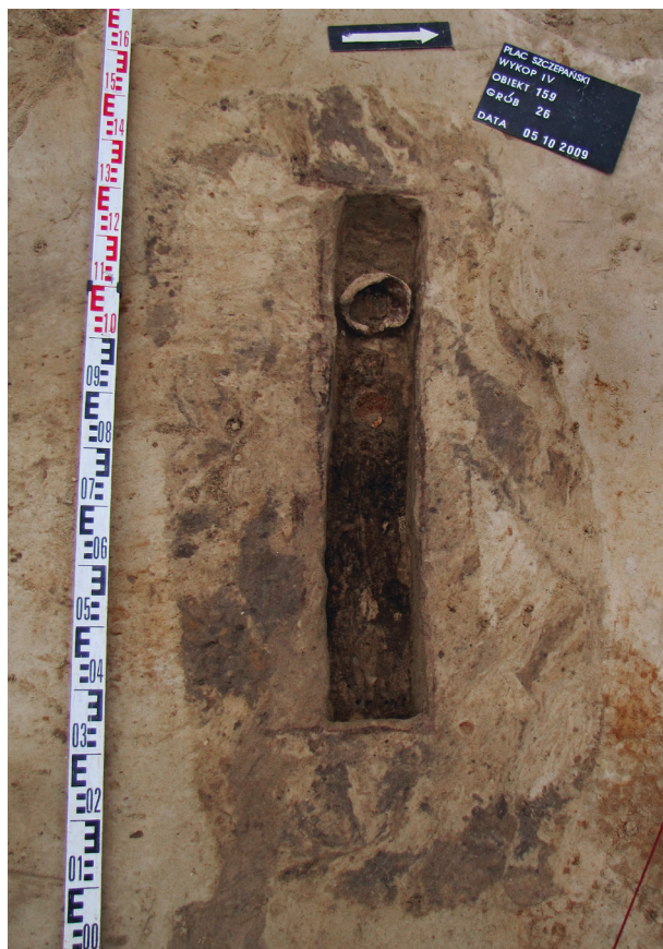
Ryc. 32. Grób nr 26, fot. Krzysztof Przygoda