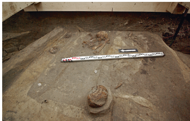
Ryc. 59. Grób nr S7, czaszka S8 i fragmenty szkieletu S9, fot. Bartłomiej Tofel

Lokalizacja: sondaż S1, m: y = 2–3, x = 1–2