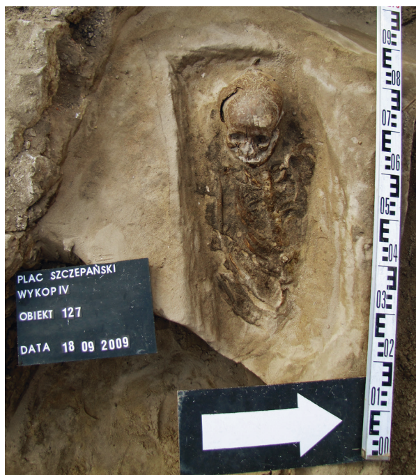
Ryc. 17. Grób nr 14

Obiekt 127, szkielet 14; lokalizacja: wykop IV