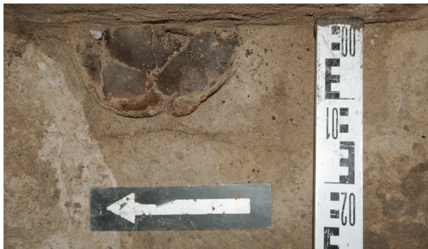
Ryc. 55. Grób nr S4

Lokalizacja: sondaż S1, m: y = 5–6, x = 1,5–2