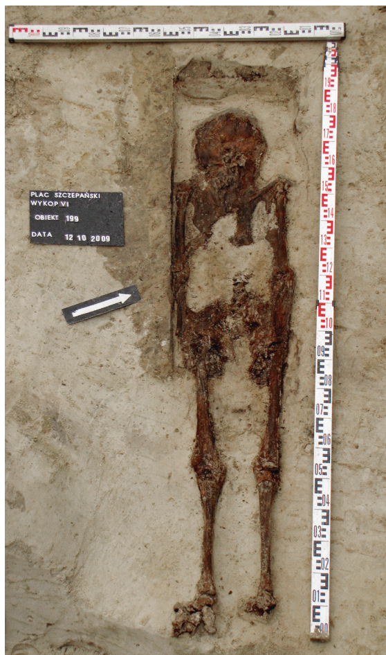
Ryc. 43. Grób nr 37, fot. Marcin Bartoszek

Obiekt 199, szkielet 37; lokalizacja: wykop VI