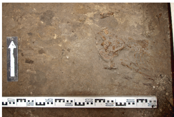
Ryc. 52. Grób nr S1

Lokalizacja: sondaż 1, m: y = 2–3, x = 1,5–2 m