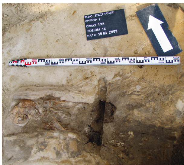
Ryc. 3. Grób nr 2, fot. Bartłomiej Tofel

Obiekt 103, szkielet nr 2; lokalizacja: wykop I