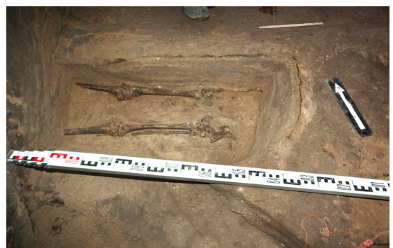
Ryc. 64. Grób nr S13