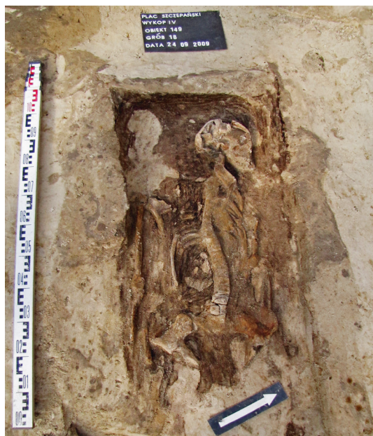
Ryc. 21. Grób nr 18

Obiekt 149, szkielet 18; lokalizacja: wykop IV