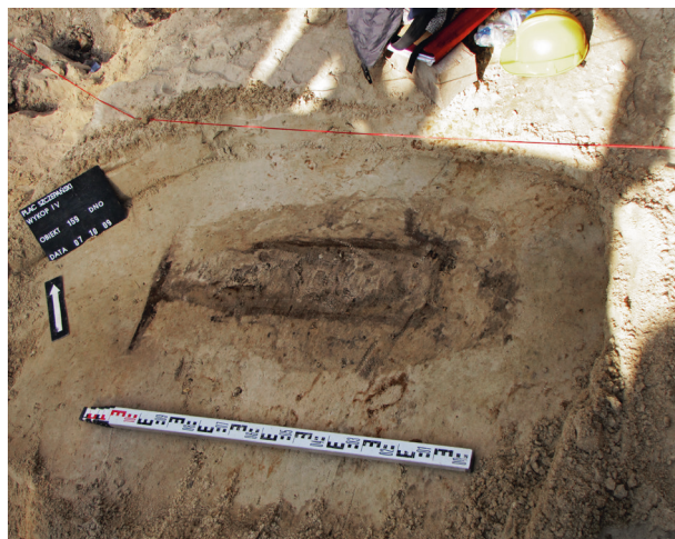
Ryc. 33. Pozostałość mar w grobie nr 26