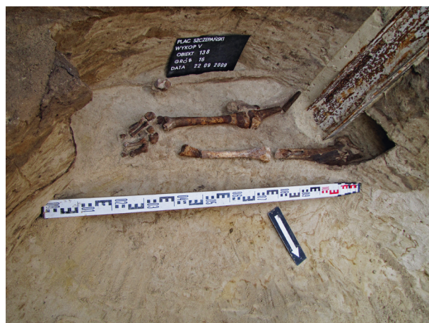
Ryc. 19. Grób nr 16, fot. Bartłomiej Tofel

Obiekt 138, szkielet 16; lokalizacja: wykop V