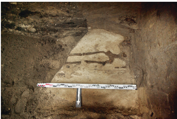
Ryc. 61. Grób nr S10

Lokalizacja: sondaż S1, m: y = 0-1 , x = 0-1