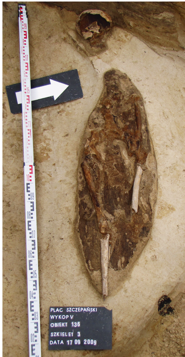
Ryc. 4. Grób nr 3 zniszczony przez wkop ziemianki, fot. Bartłomiej Tofel

Obiekt 136, szkielet 3; lokalizacja: wykop V