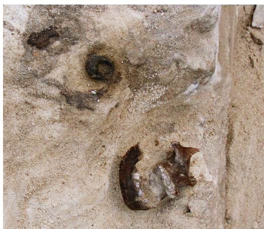
Ryc. 25. Grób nr 21 – zbliżenie na pozostałość czaszki z kablączkiem skroniowym

Obiekt 125, szkielet 21; lokalizacja: wykop IV