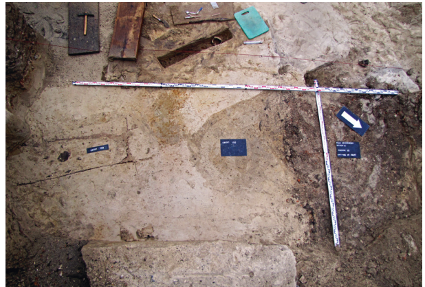
Ryc. 46. Grób nr 39 – drewniane szalowanie, fot. Kamil Kopij

Obiekt 196, szkielet 39; lokalizacja: wykop III