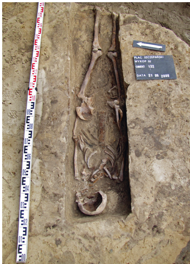
Ryc. 14. Grób nr 12

Obiekt 132, szkielet 12; lokalizacja: wykop IV