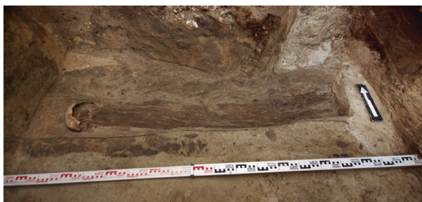
Ryc. 56. Grób nr S5

Lokalizacja: sondaż S1, m: y = 4,5–6, x = 0–1,7