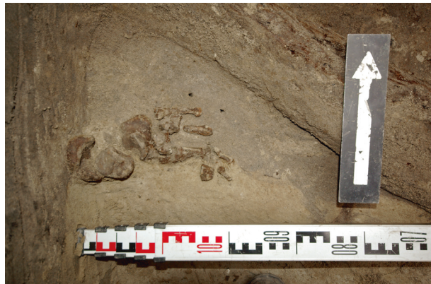
Ryc. 65. Grób nr S14, fot. Bartłomiej Tofel

Lokalizacja: sondaż S1, m: y = 3, x = 0–1