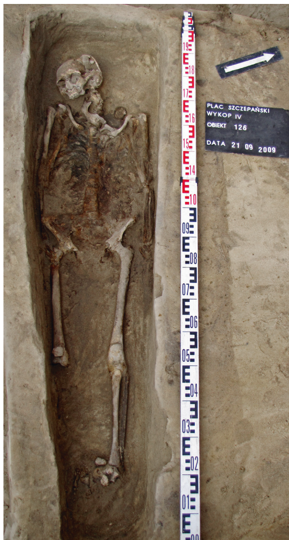
Ryc. 15. Grób nr 13, fot. Bartłomiej Tofel