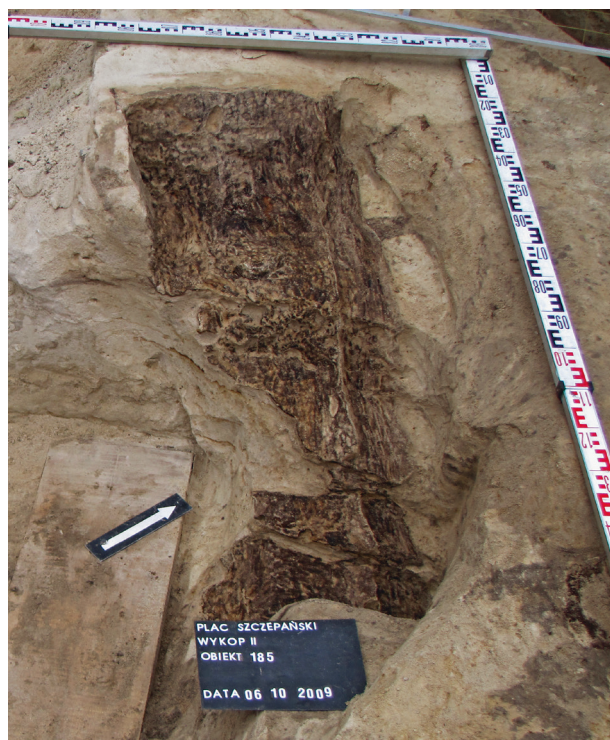
Ryc. 37. Grób nr 30

Obiekt 185, szkielet 30; lokalizacja: wykop II