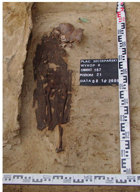
Ryc. 41. Grób nr 35, fot. Agnieszka Suder