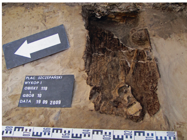
Ryc. 13. Grób nr 10, fot. Bartłomiej Tofel, zob. też ryc. 9

Obiekt 119, szkielet 10; lokalizacja: wykop I