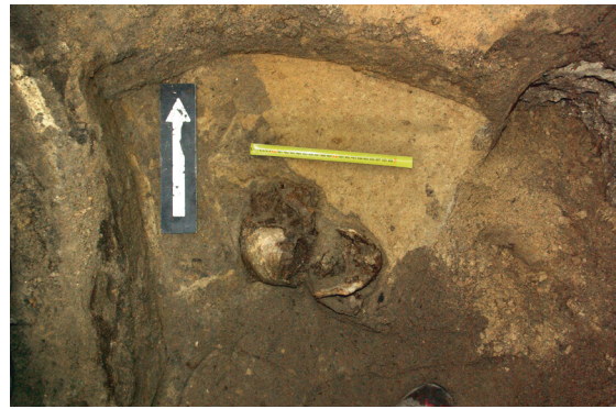
Ryc. 62. Grób nr S11

Lokalizacja: sondaż S1, m: y = 6 , x = 0 Zachowała się jedynie czaszka w zasypie grobowym grobu nr 4; nie ustalono płci ani wieku.