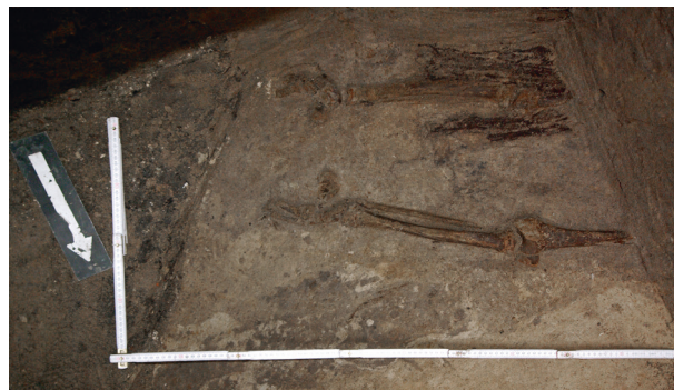
Ryc. 53. Grób nr S2

Lokalizacja: sondaż S1, m: y = 0–1, x = 0–1