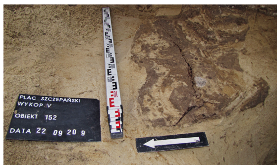
Ryc. 22. Grób nr 19, fot. Bartłomiej Tofel

Obiekt 152, szkielet 19; lokalizacja: wykop V