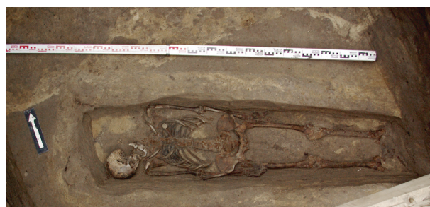
Ryc. 54. Grób nr S3

Lokalizacja: sondaż S1, m: y = 4–5, x = 0–2