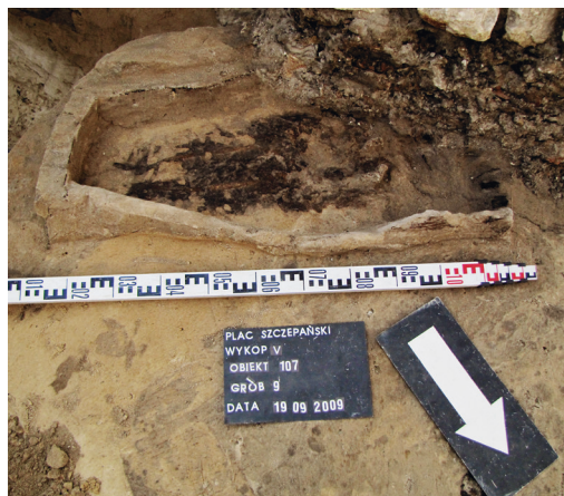
Ryc. 11. Grób nr 9 – dno trumny