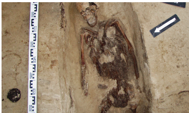
Ryc. 29. Grób nr 24 – pochówek z głową na wschód

Obiekt 130, szkielet 24; lokalizacja: wykop IV