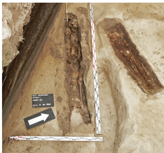
Ryc. 7. Grób nr 28 i grób nr 5

Obiekt 102, szkielet 5; lokalizacja: wykop I