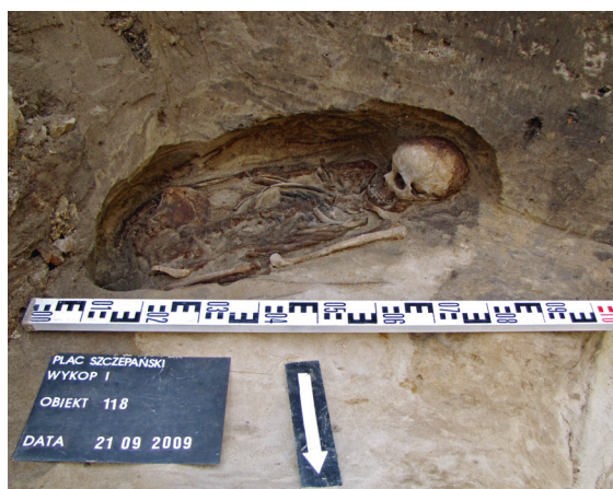
Ryc. 8. Grób nr 6