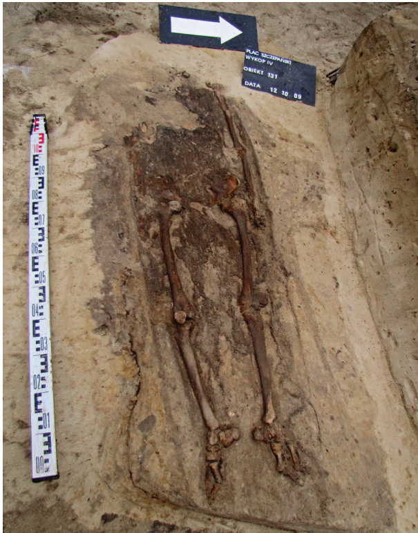
Ryc. 44. Grób nr 38

Obiekt 131, szkielet 38; lokalizacja: wykop IV