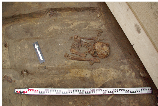
Ryc. 58. Grób nr S7 – pochówek z głową na wschód