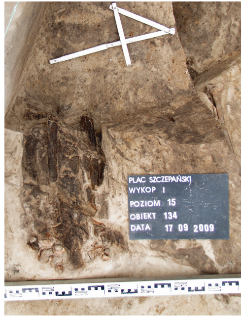
Ryc. 40. Grób nr 34

Obiekt 134, szkielet 34; lokalizacja: wykop I