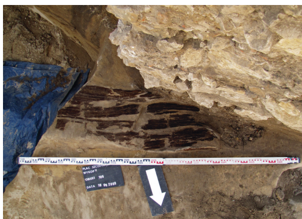
Ryc. 12. Grób nr 9 – pokrywa trumny, ryc. Bartłomiej Tofel

Obiekt 106, szkielet 9; lokalizacja: wykop V