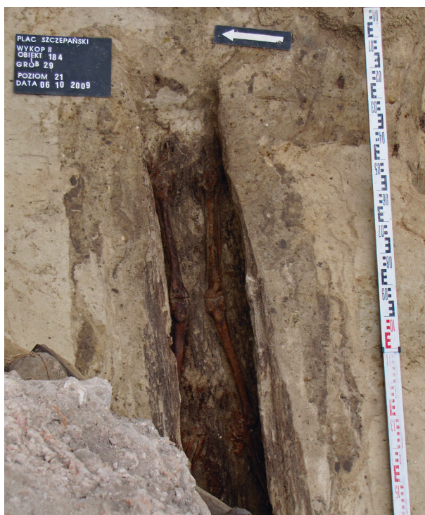
Ryc. 36. Grób nr 29, fot. Agnieszka Suder