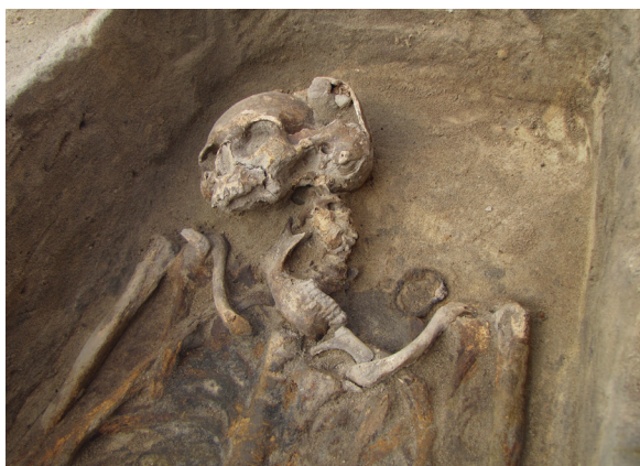
Ryc. 16. Grób nr 13 – zbliżenie czaszki z przedmiotem metalowym w okolicy barku

Obiekt 126, szkielet 13; lokalizacja: wykop IV