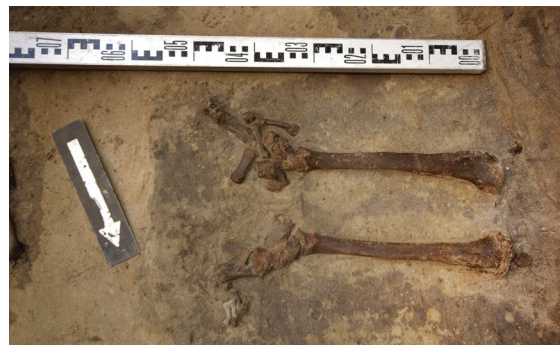
Ryc. 63. Grób nr S12, fot. Bartłomiej Tofel

Lokalizacja: sondaż S1, m: y = 2 , x = 0-1