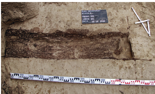
Ryc. 45. Grób nr 39