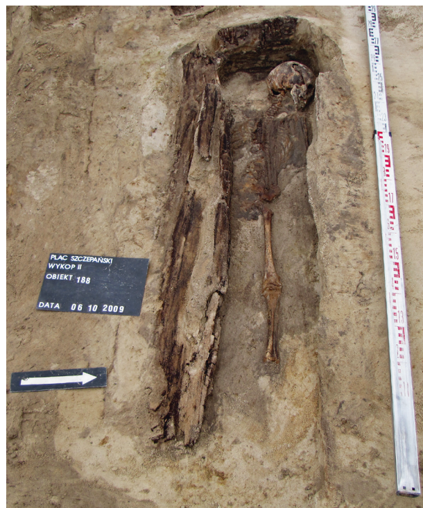
Ryc. 38. Grób nr 32

Obiekt 188, szkielet 32; lokalizacja: wykop II