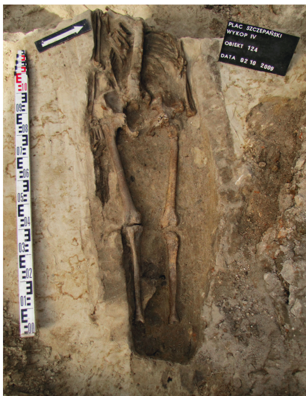
Ryc. 34. Grób nr 27

Obiekt 124, szkielet 27; lokalizacja: wykop IV