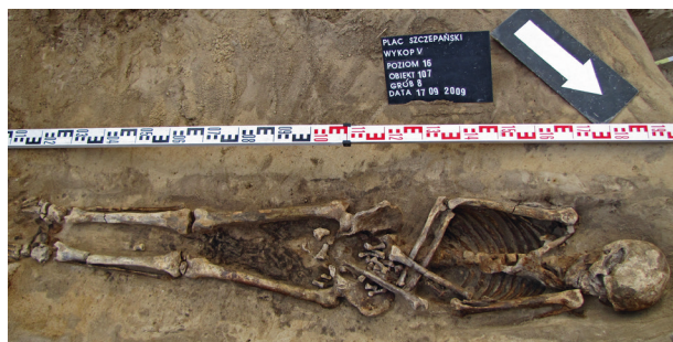
Ryc. 10. Grób nr 8 – szkielet z dłońmi złożonymi na miednicy

Obiekt 107, szkielet 8; lokalizacja: wykop V