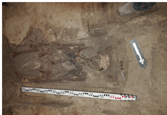
Ryc. 66. Grób nr S15

Lokalizacja: sondaż S1, m: y = 3, x = 1–2