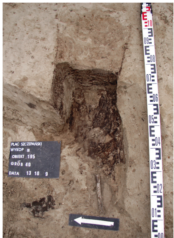
Ryc. 47. Grób nr 40